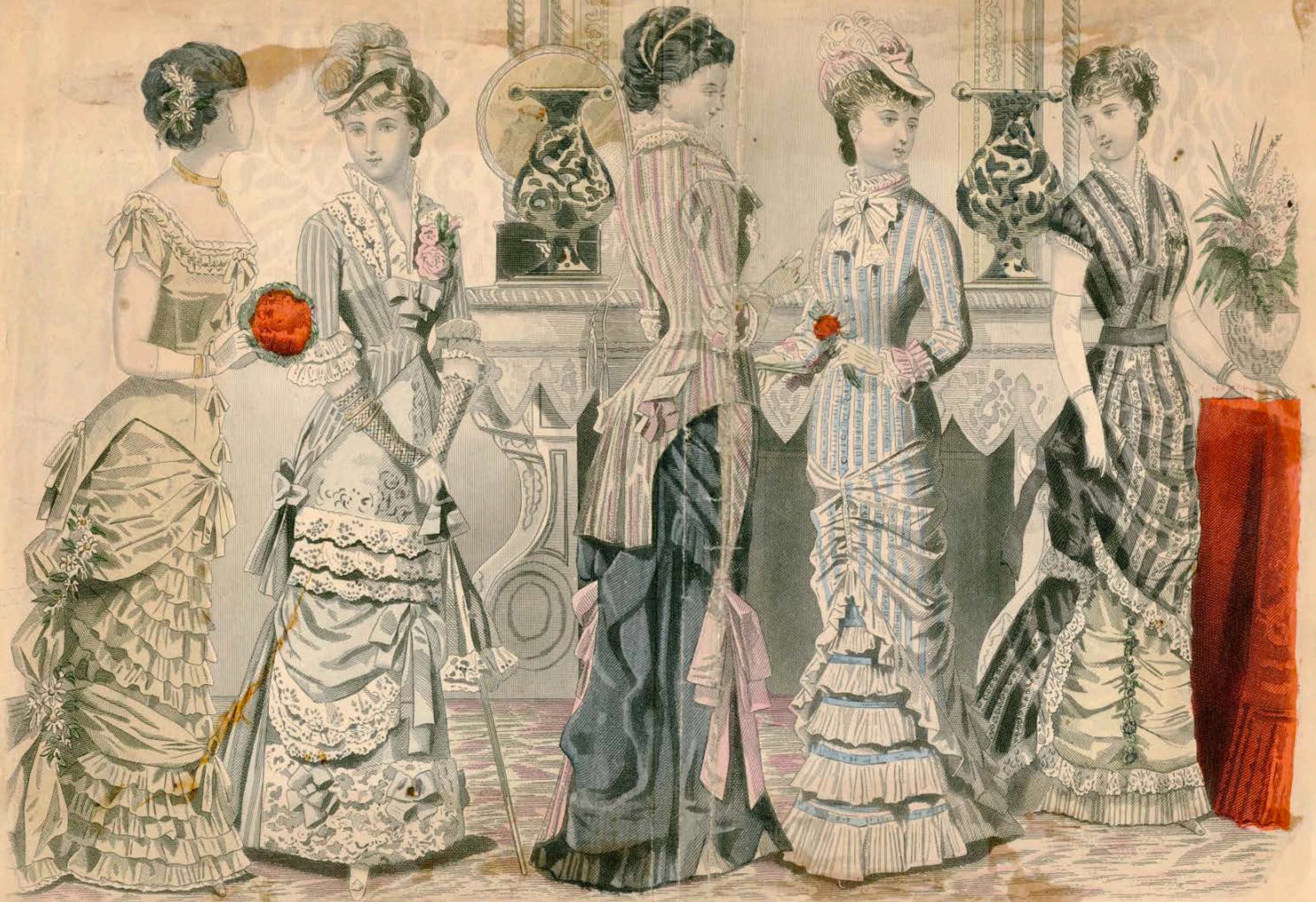
LES MODES PARISIENNES PETERSON'S MAGAZINE AUGUST, 1880 THE CONVERSAZIONE