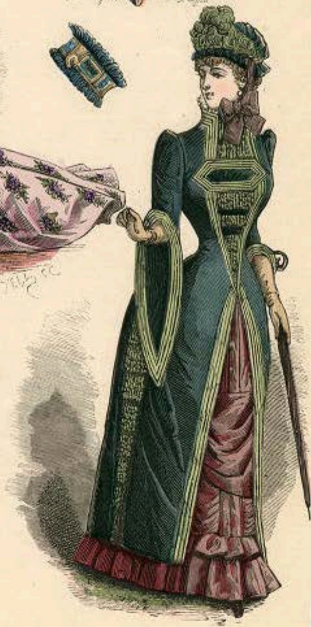
LATEST PARIS FASHIONS.