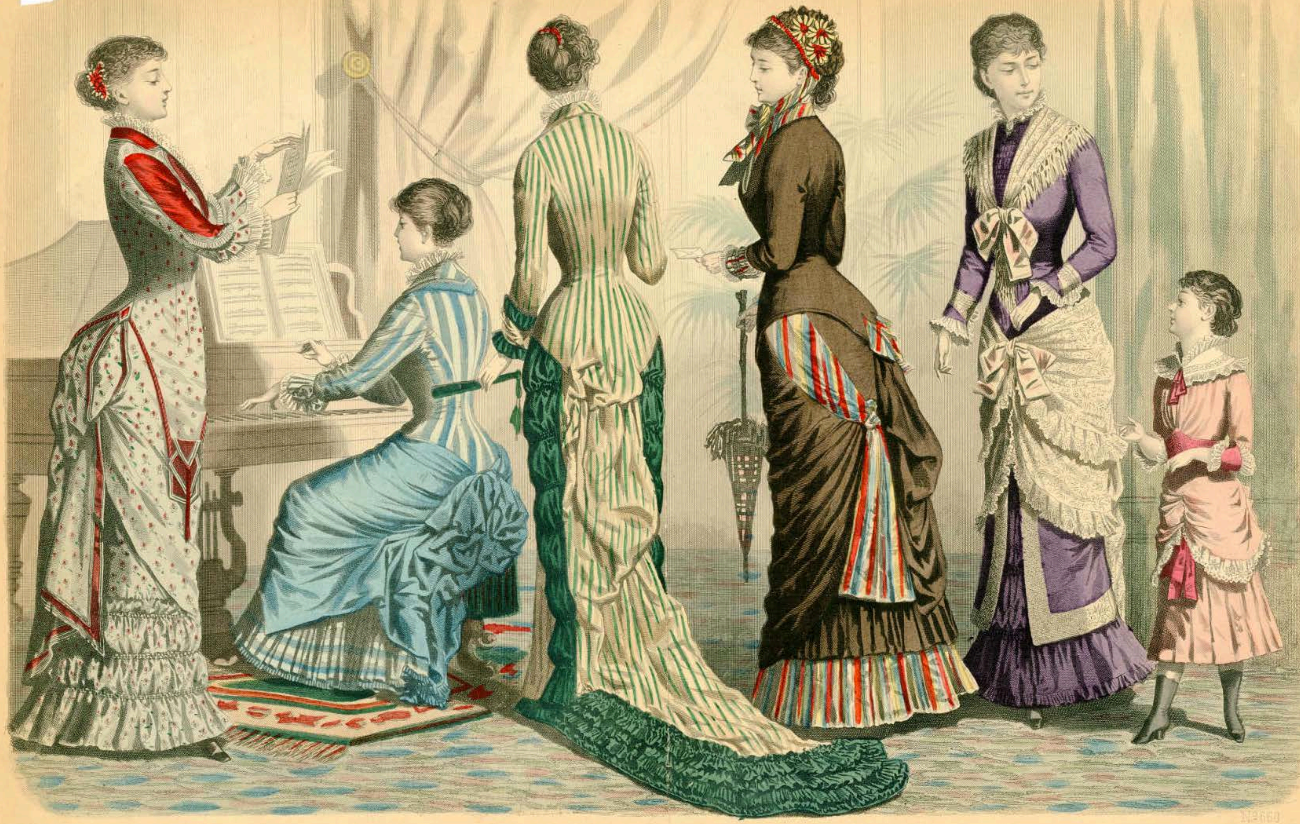
THE LATEST PARIS FASHIONS