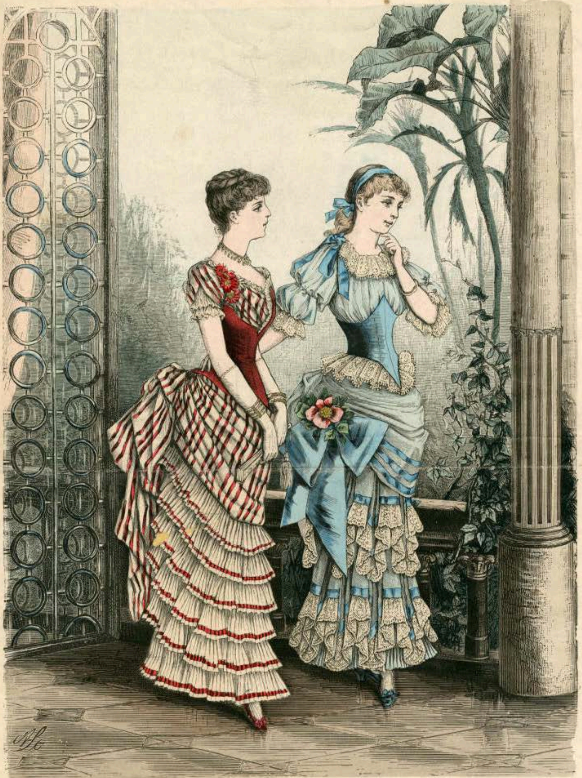
Pl. 530. Ly 47.5.43