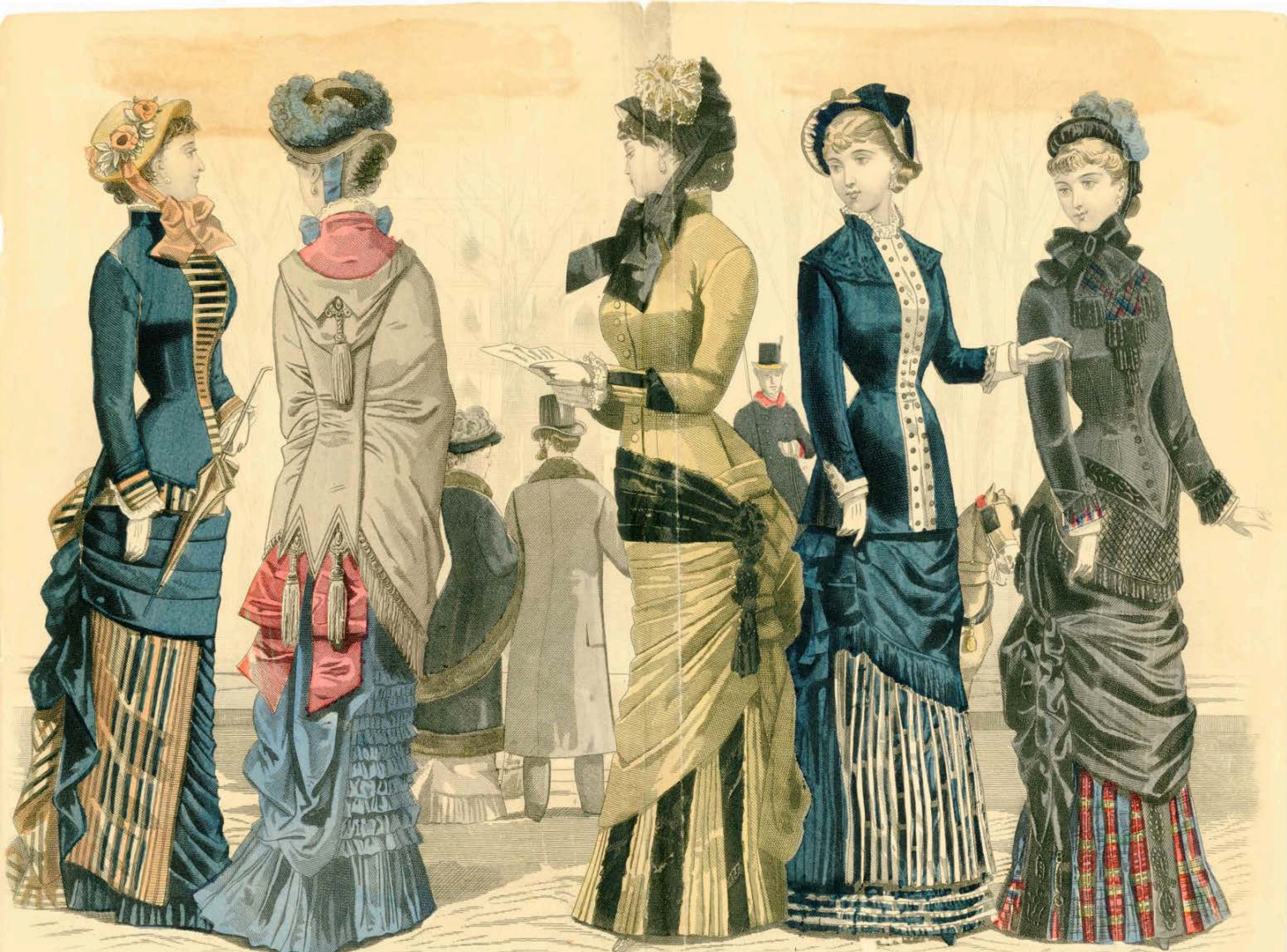
LES MODES PARISIENNES PETERSON'S MAGAZINE OCTOBER 1881 (ON THE BOULEVARD)