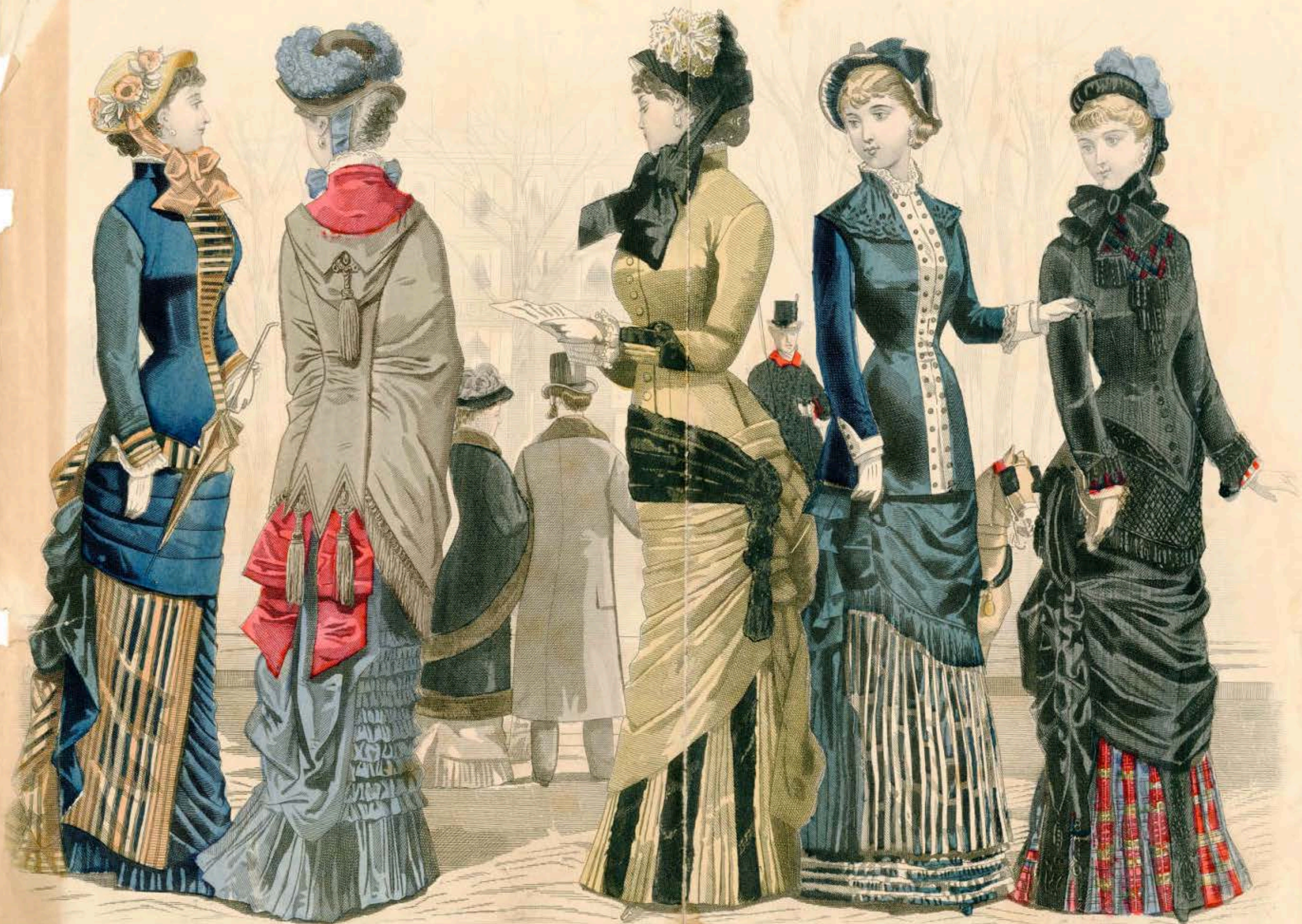
LES MODES PARISIENNES PETERSON'S MAGAZINE OCTOBER 1881 ON THE BOULEVARD.