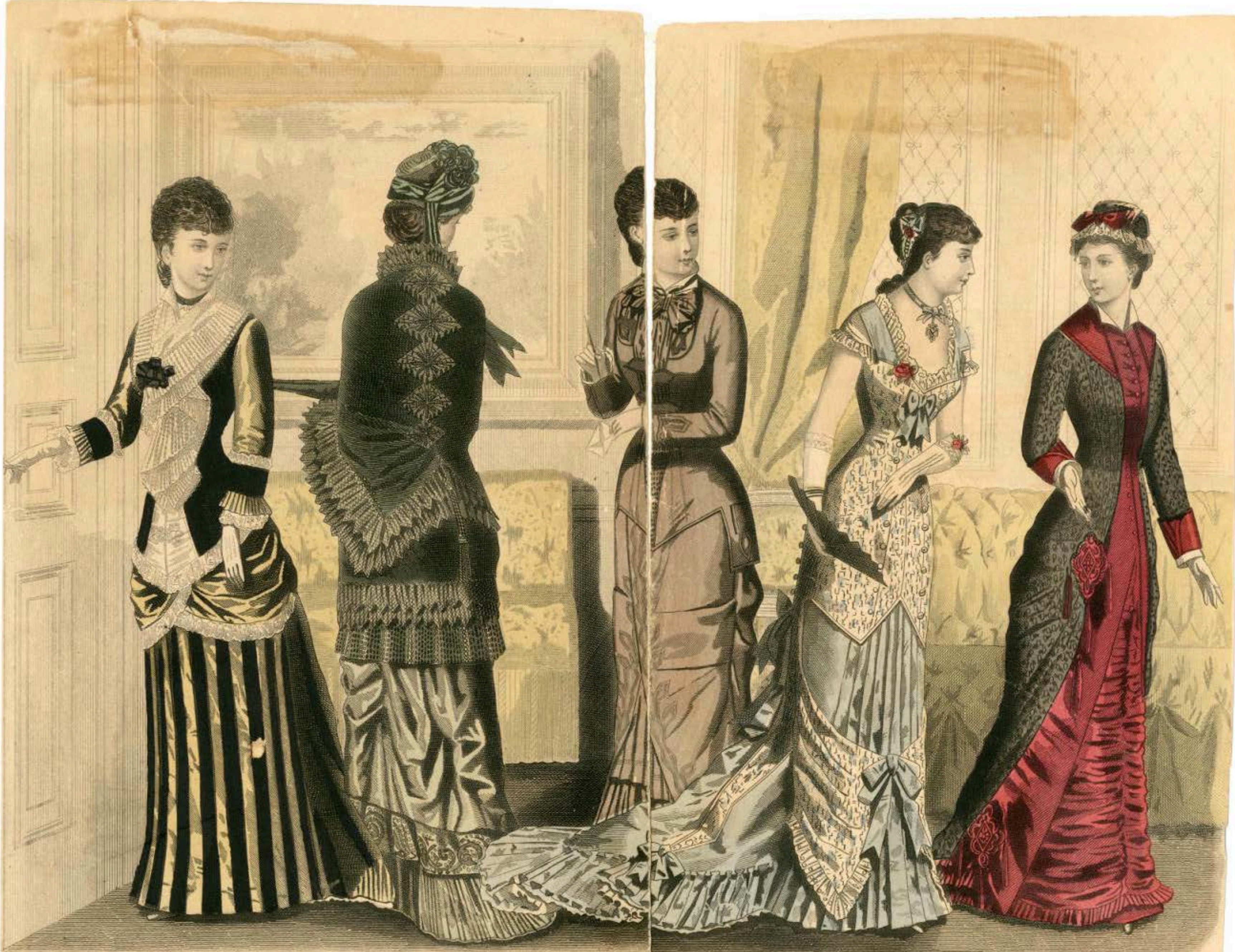
LES MODES PARISIENNES. FEBRUARY, 1881. PETERSON'S MAGAZINE. THE NEW PICTURE