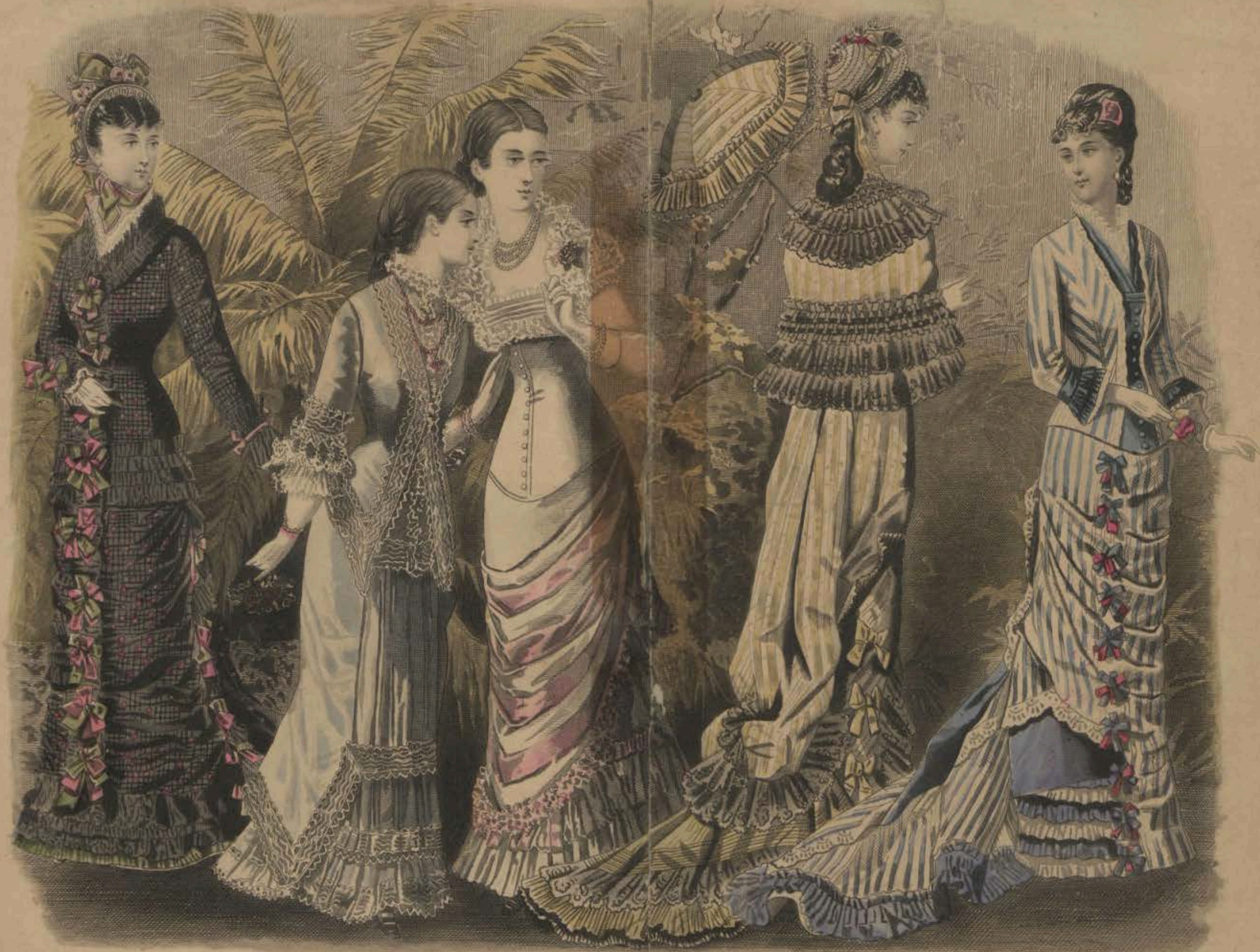
LES MODES PARISIENNES PETERSON'S MAGAZINE JUNE 1879 AMONG THE PALMS