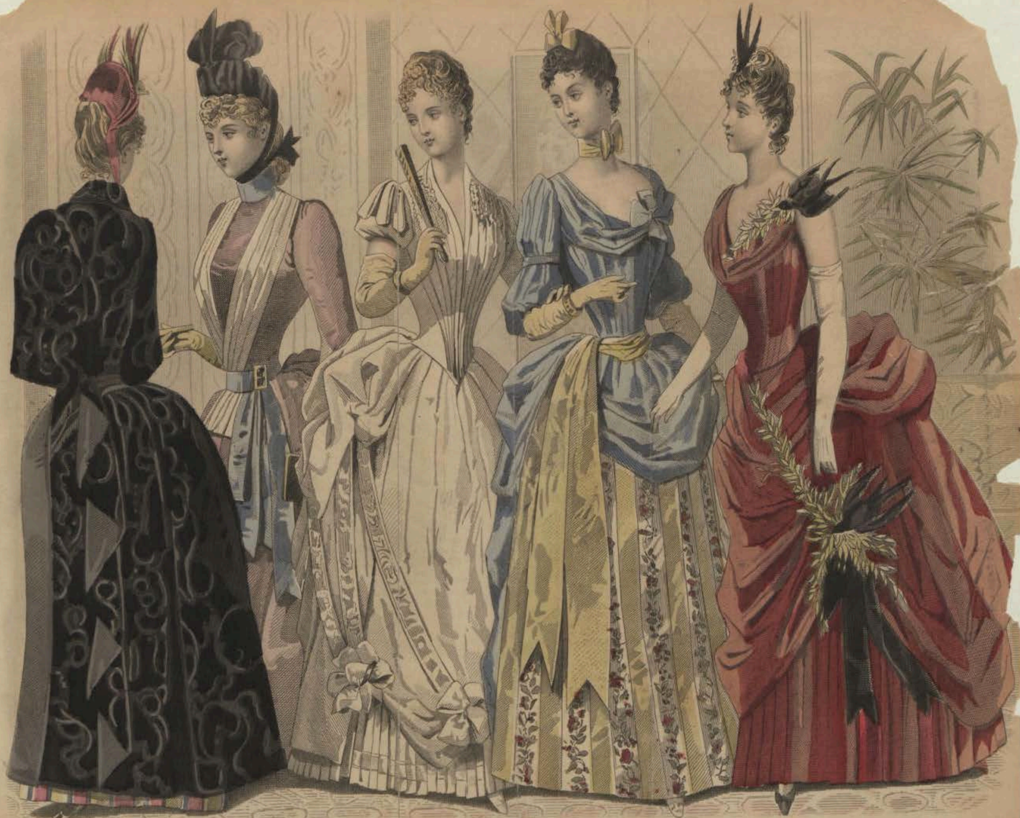
LES MODES PARISIENNES. PETERSON'S MAGAZINE.