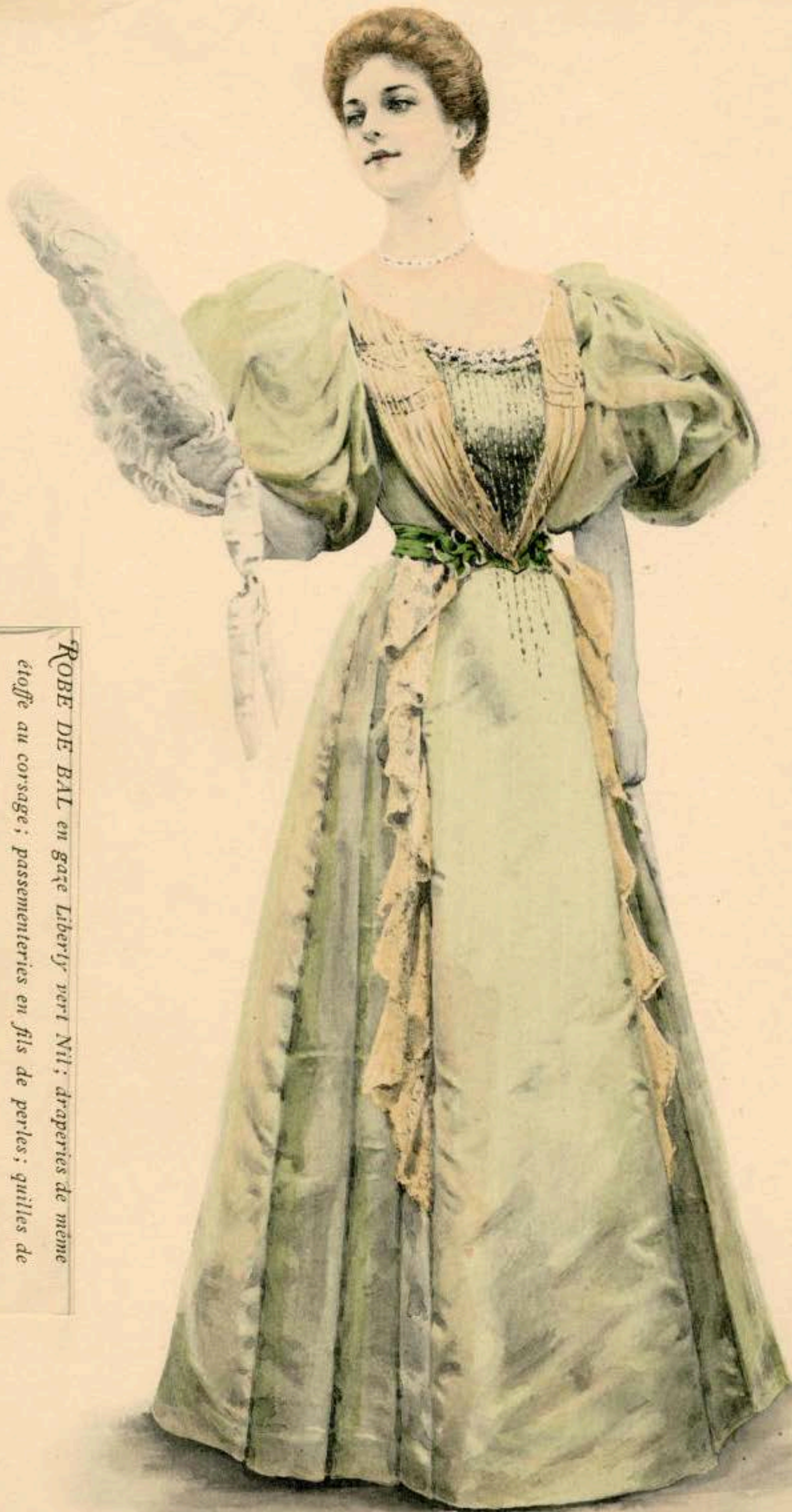
ROBE DE BAL en gaze Liberty vert Nil; draperies de même éttoffe au corsage; passementeries en fils de perles; quilles de dentelle à la jupe.