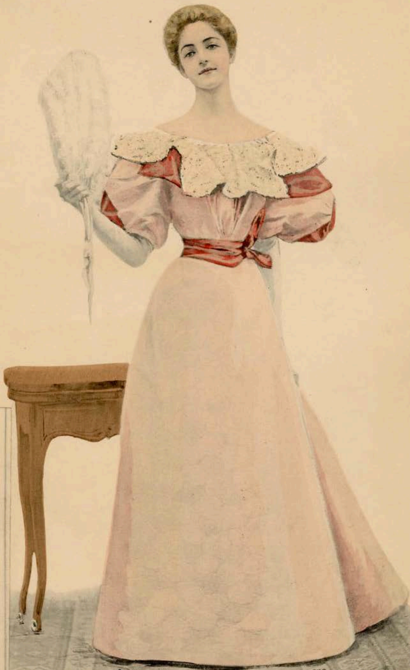
ROBE DE BAL pour jeune femme, en soie rose pâle, ceinture et berthe en velours rose géranium, applications de guipure sur la berthe.