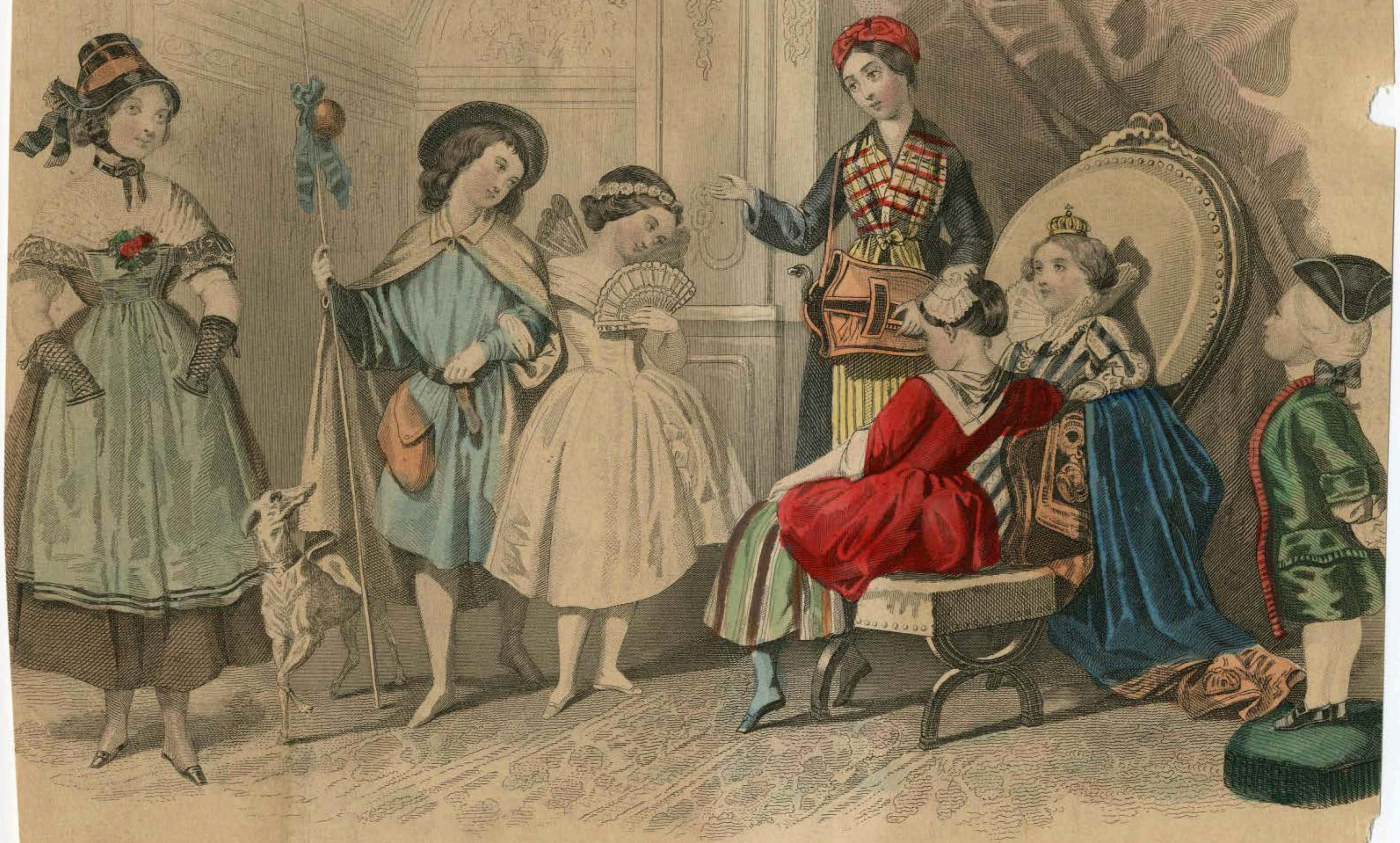
JUVENILE FANCY DRESS PARTY.