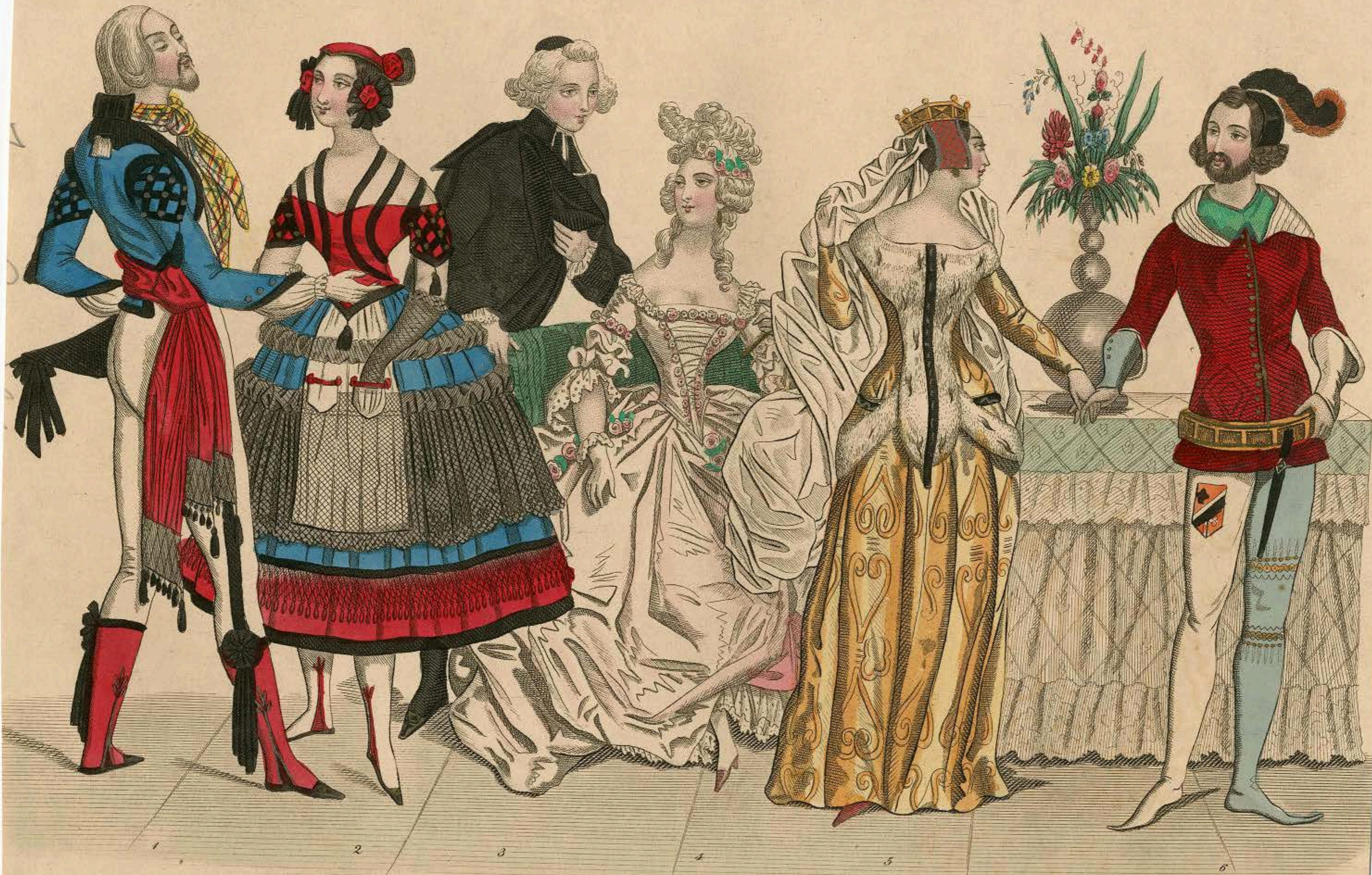
Anzüge zu Maskenbällen (Drittes Extrakupfer.)