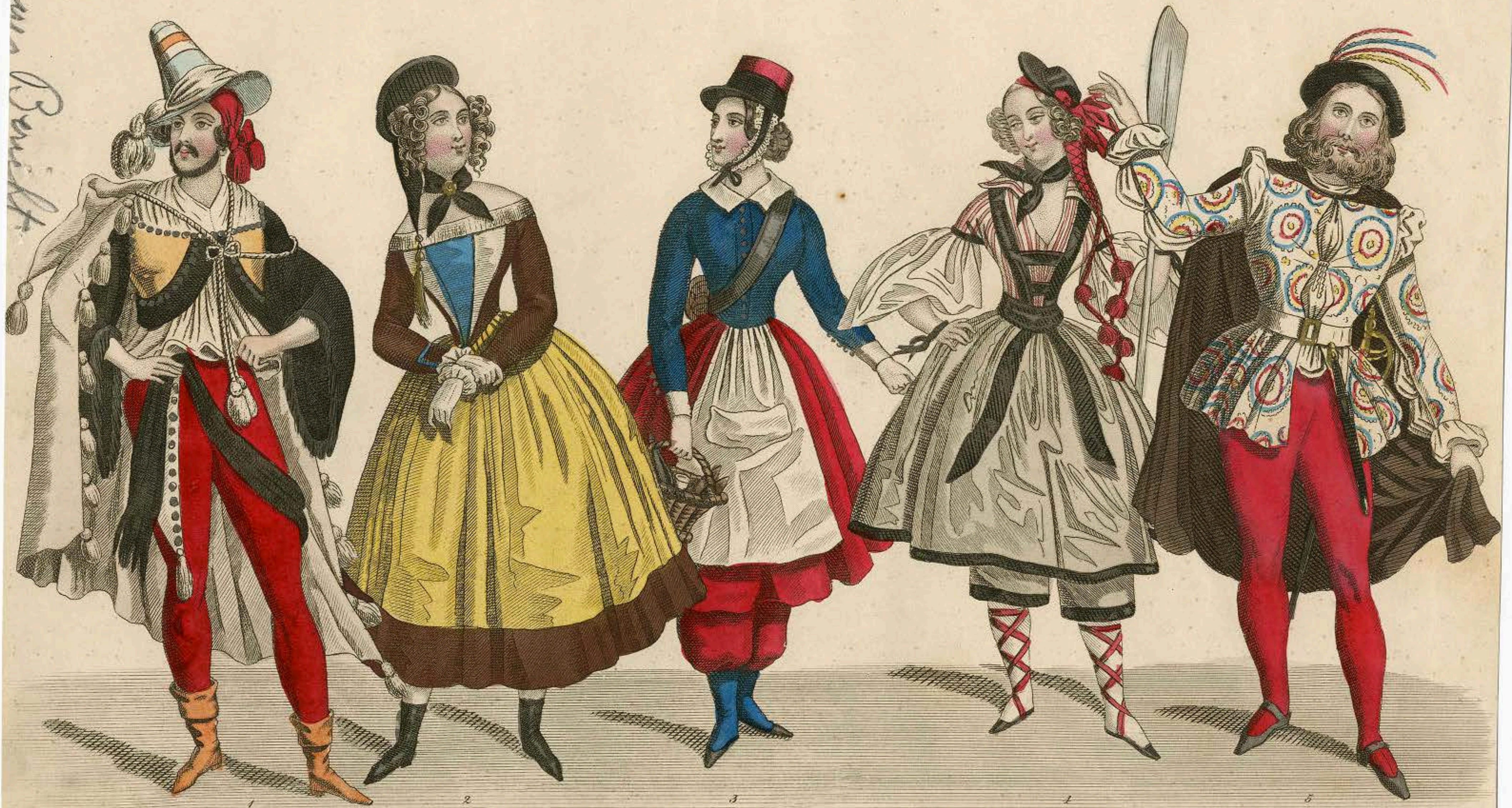
Anzüge zu Maskenbällen 1841 (Zweites Extrakupfer.)