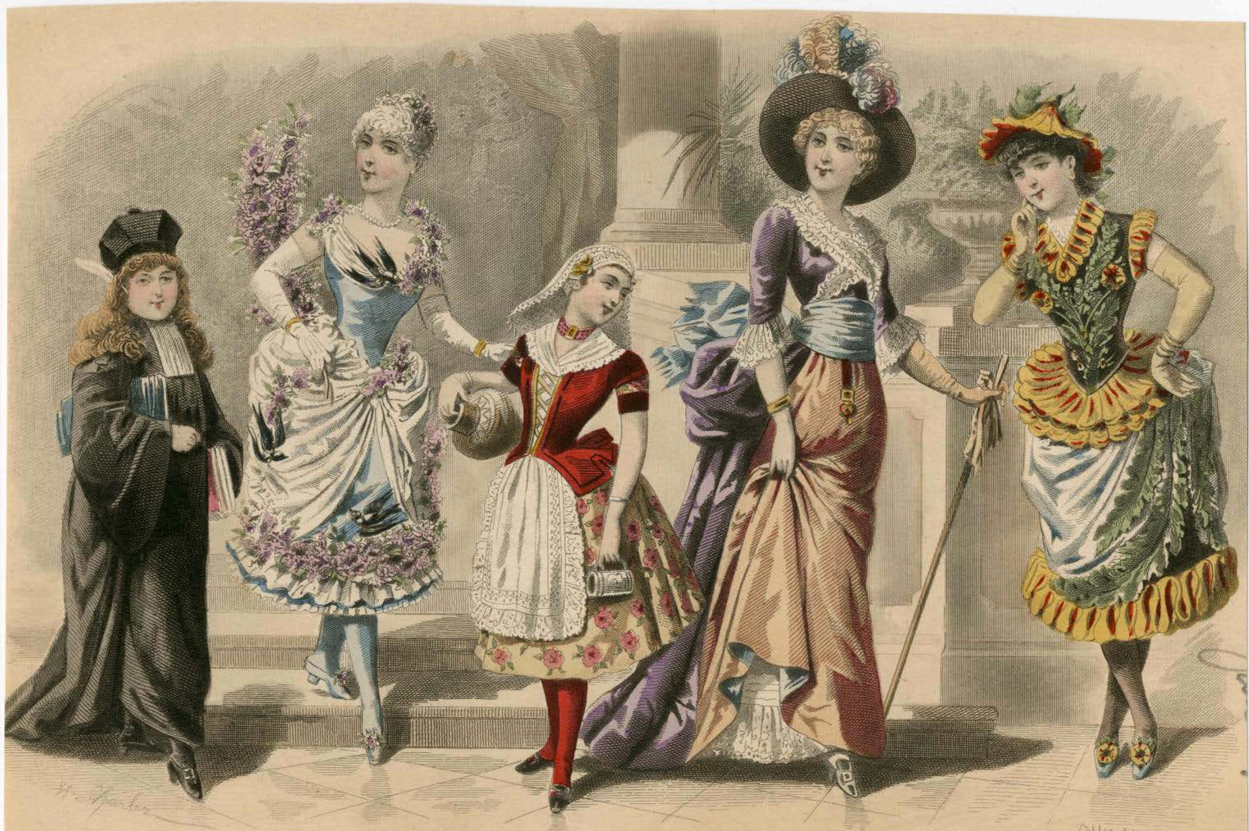
Avocat Louis XIV