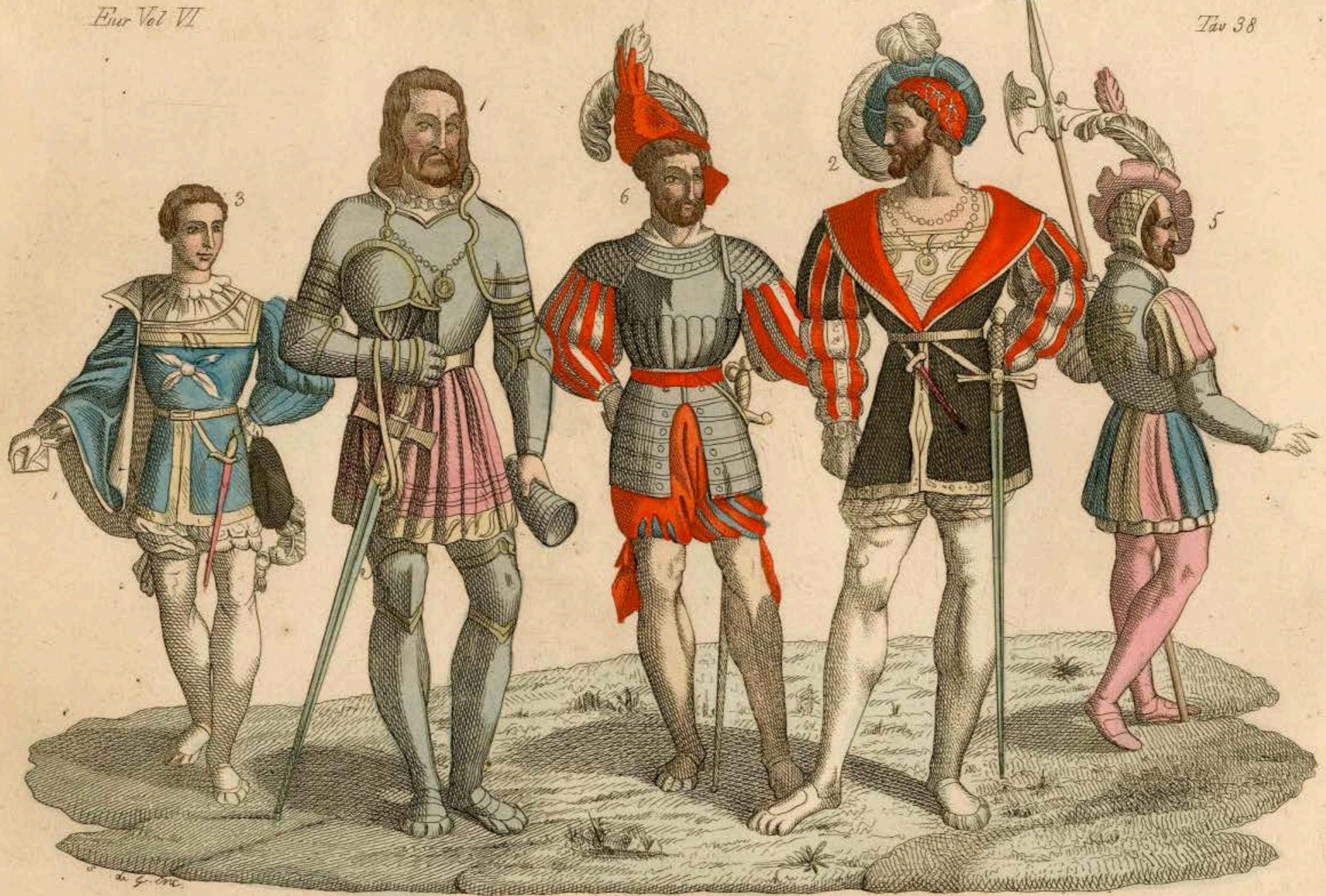
Cavaliere Bajardo &c