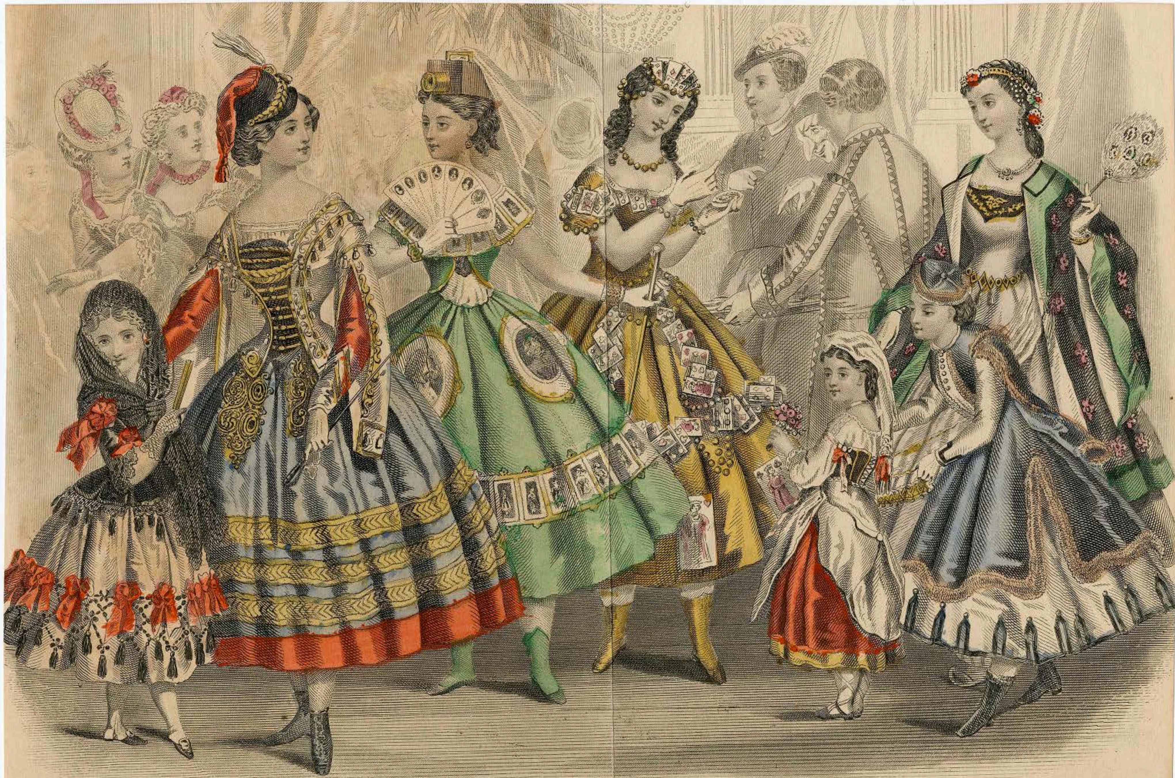
Geo. Knapp & Co. Printers N.Y. GODEY'S FASHIONS FOR OCTOBER. 1866