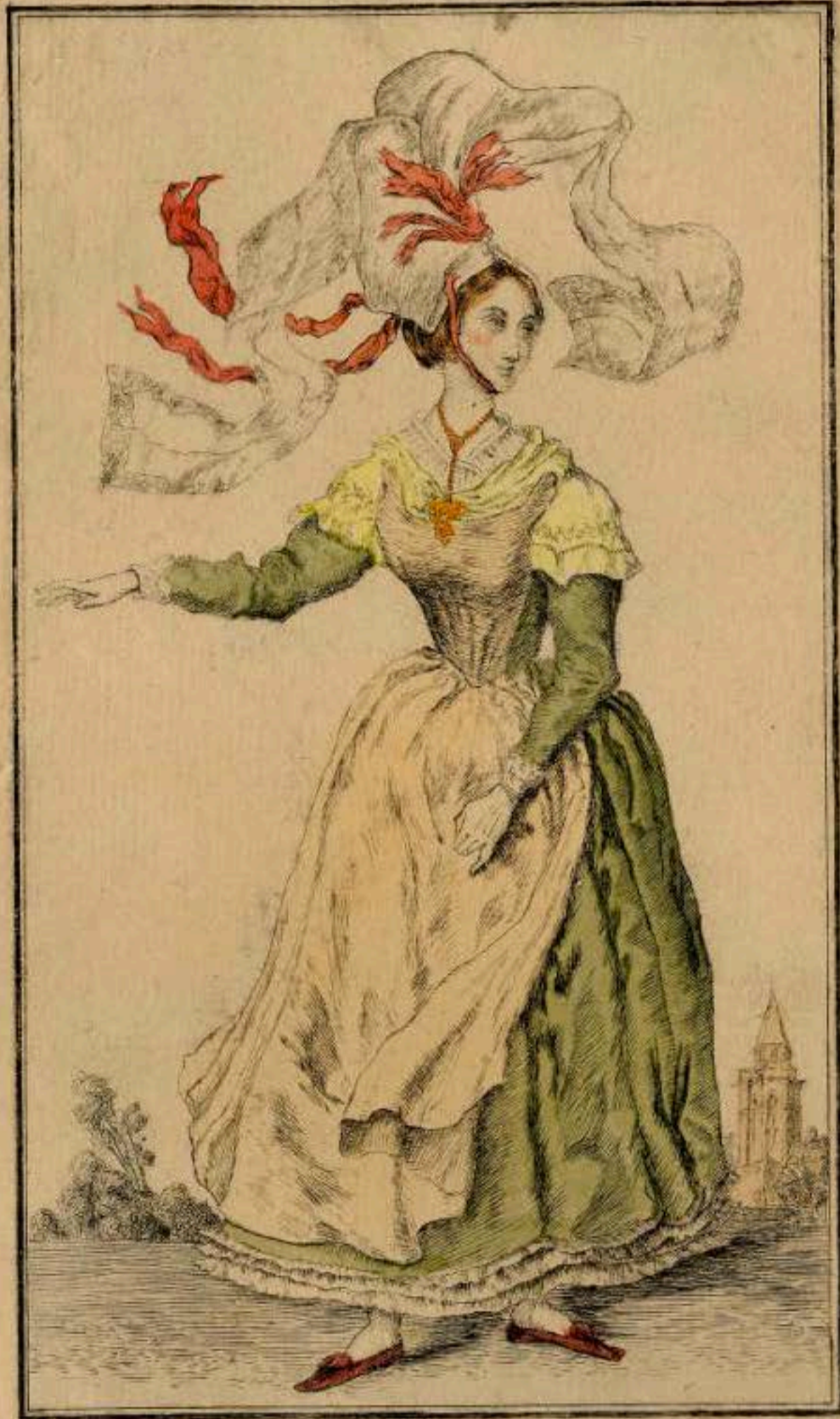
Femane des environs de Caen