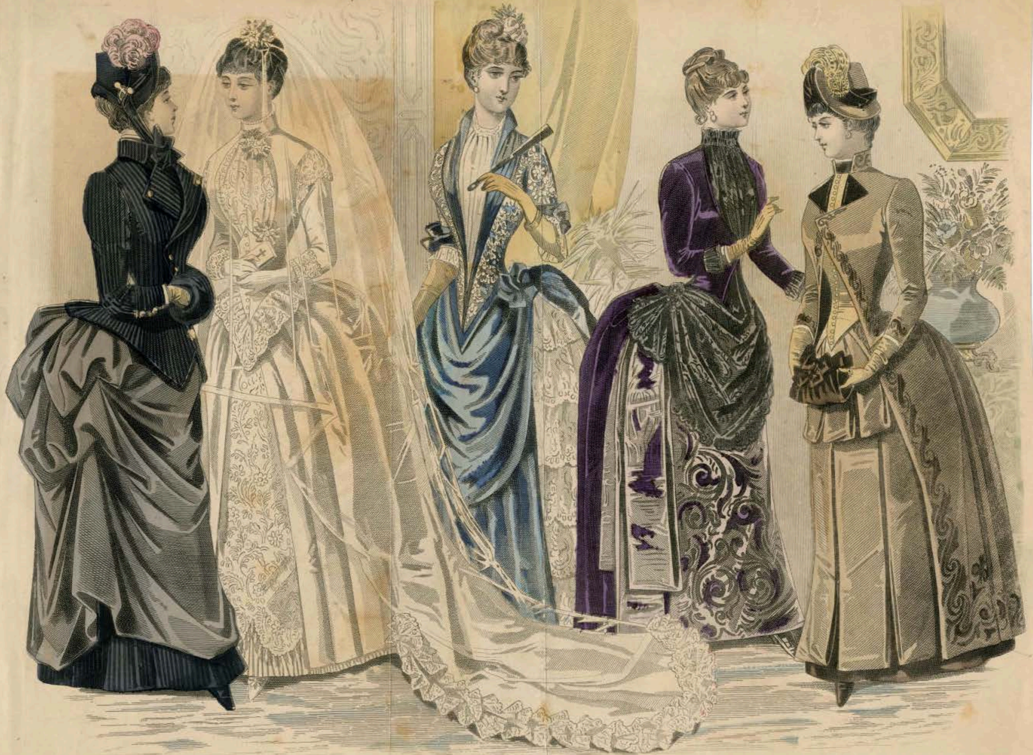
LES MODES PARISIENNES: PETERSON'S MAGAZINE, OCTOBER, 1885: THE BRIDE AND HER FRIENDS.