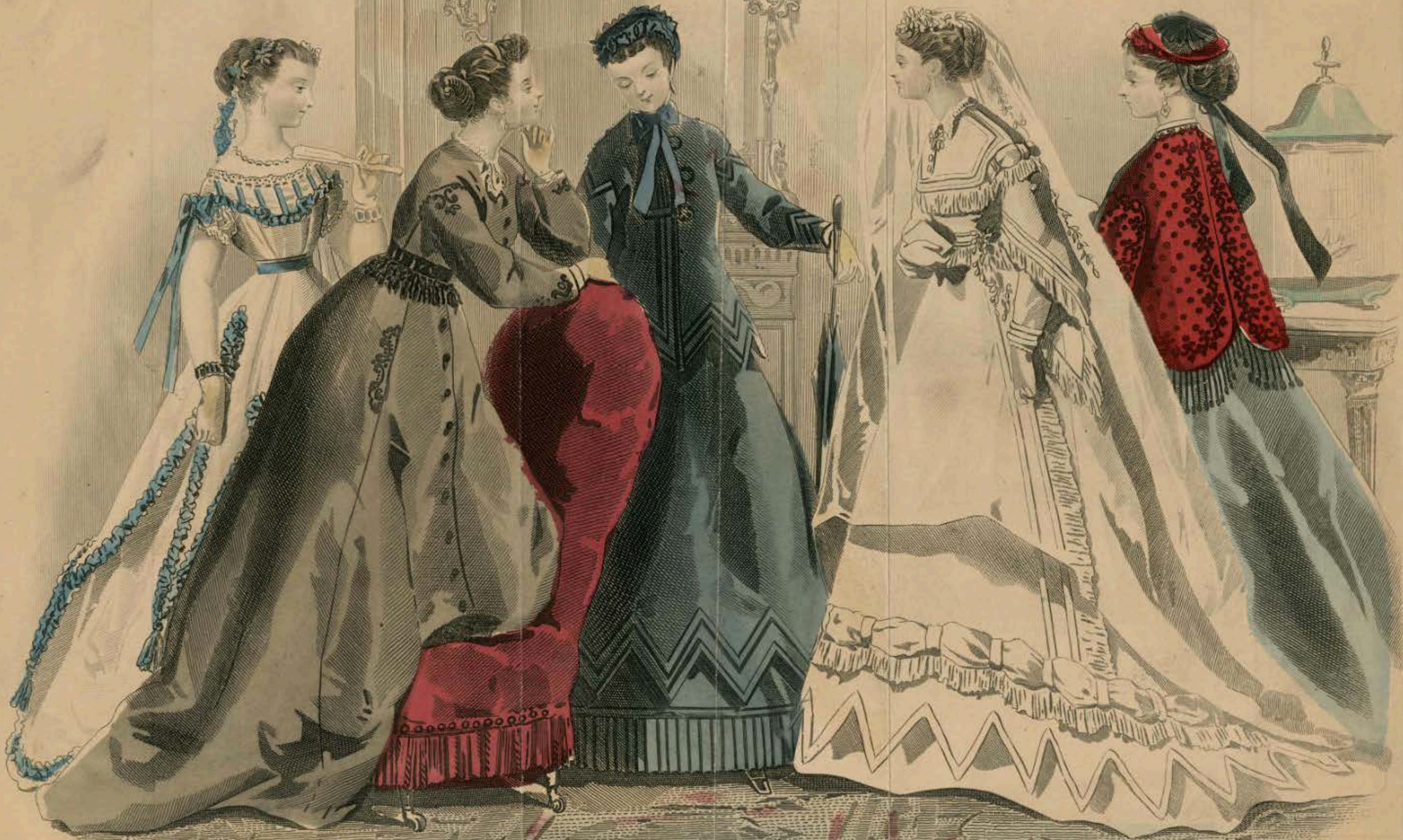
FIG. I.—EVENING DRESS OF WHITE MUSLIN.—The peplum, with deep points, is trimmed with ruchings of blue silk, and finished at the points with blue tassels. Blue flowers in the hair.