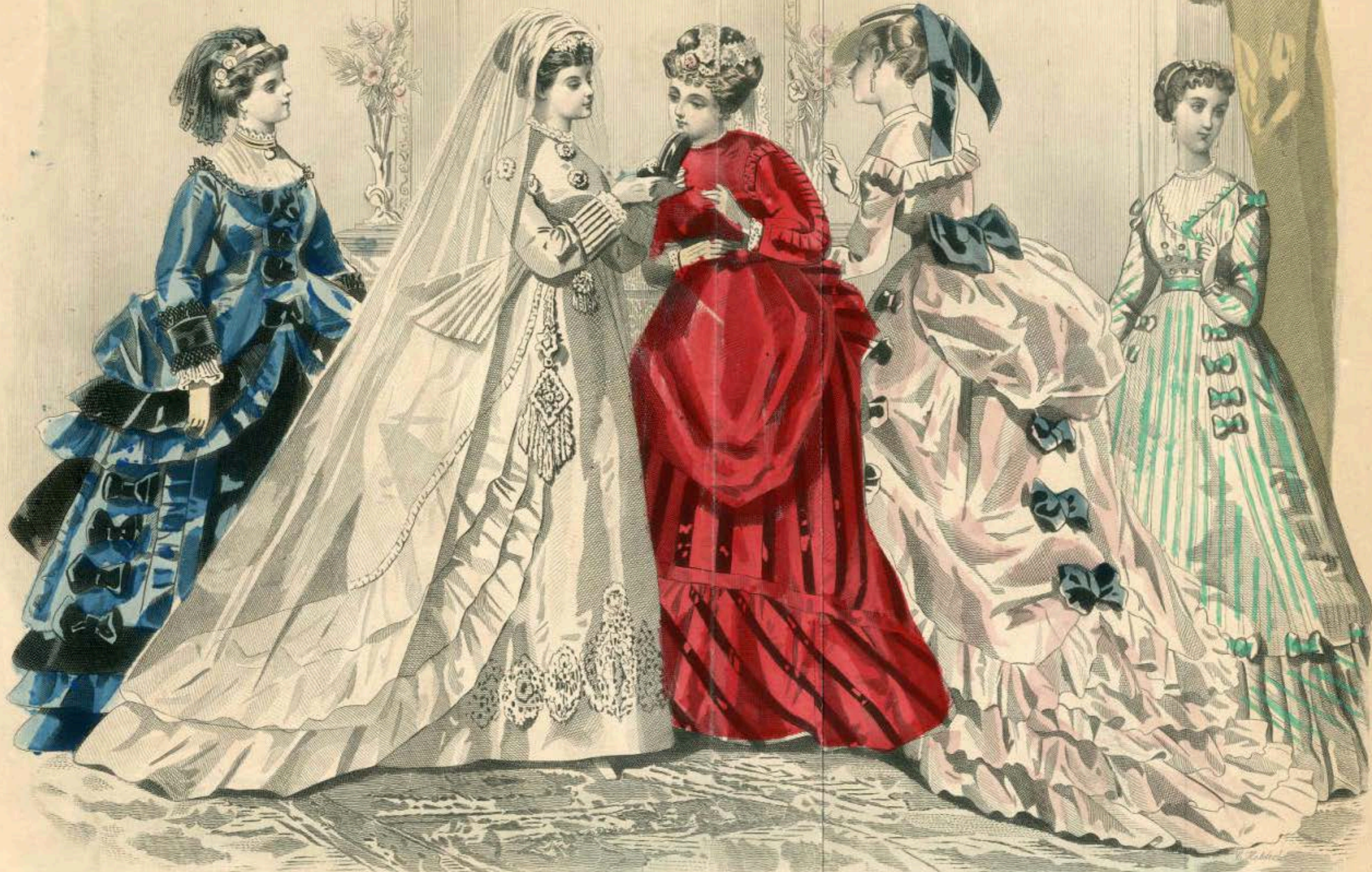
LES MODES PARISIENNES. PETERSON'S MAGAZINE. JUNE, 1869.