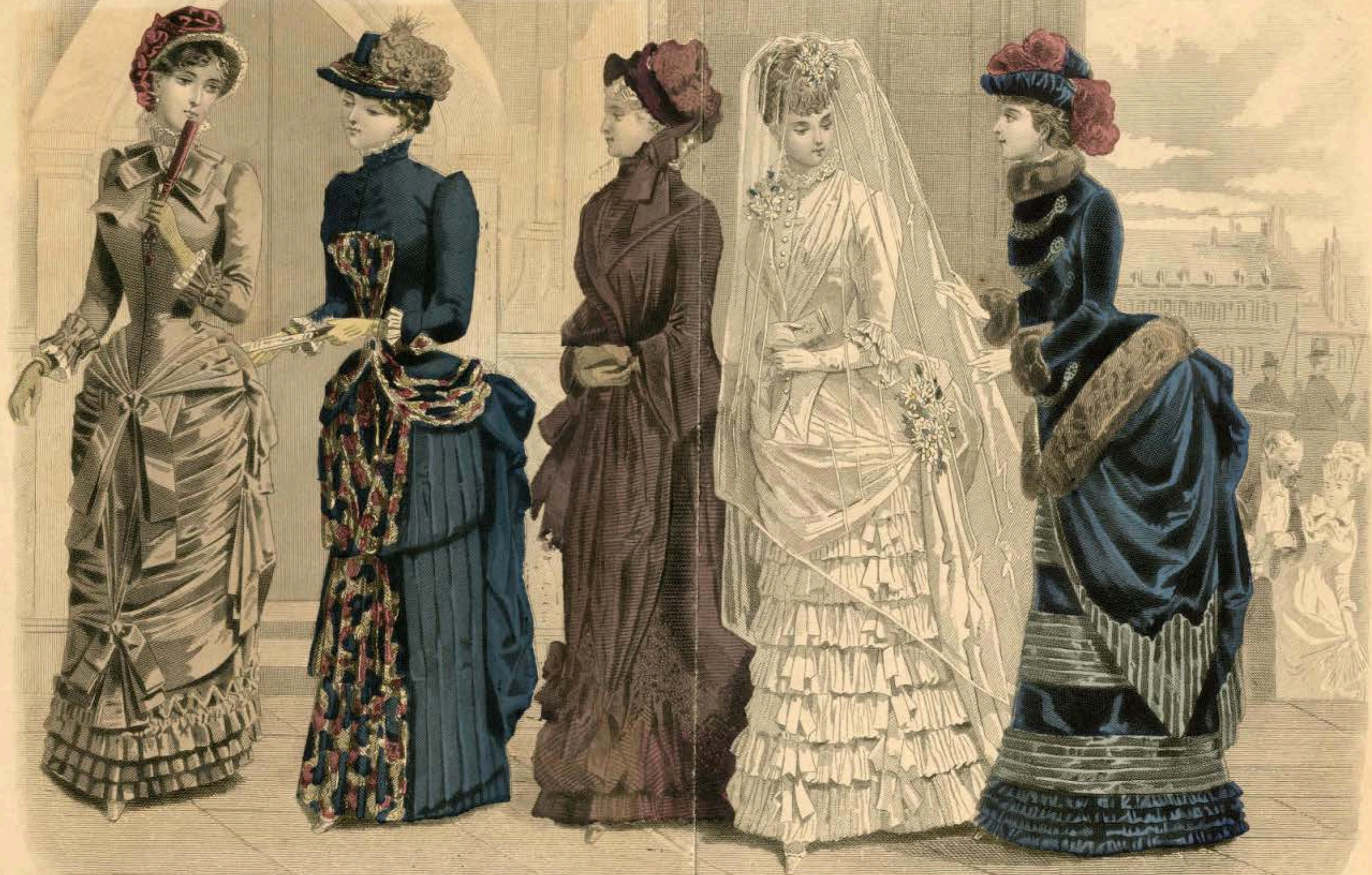
LES MODES PARISIENNES. PETERSON'S MAGAZINE. FEBRUARY, 1884. THE BRIDE ENTERING THE CHURCH.