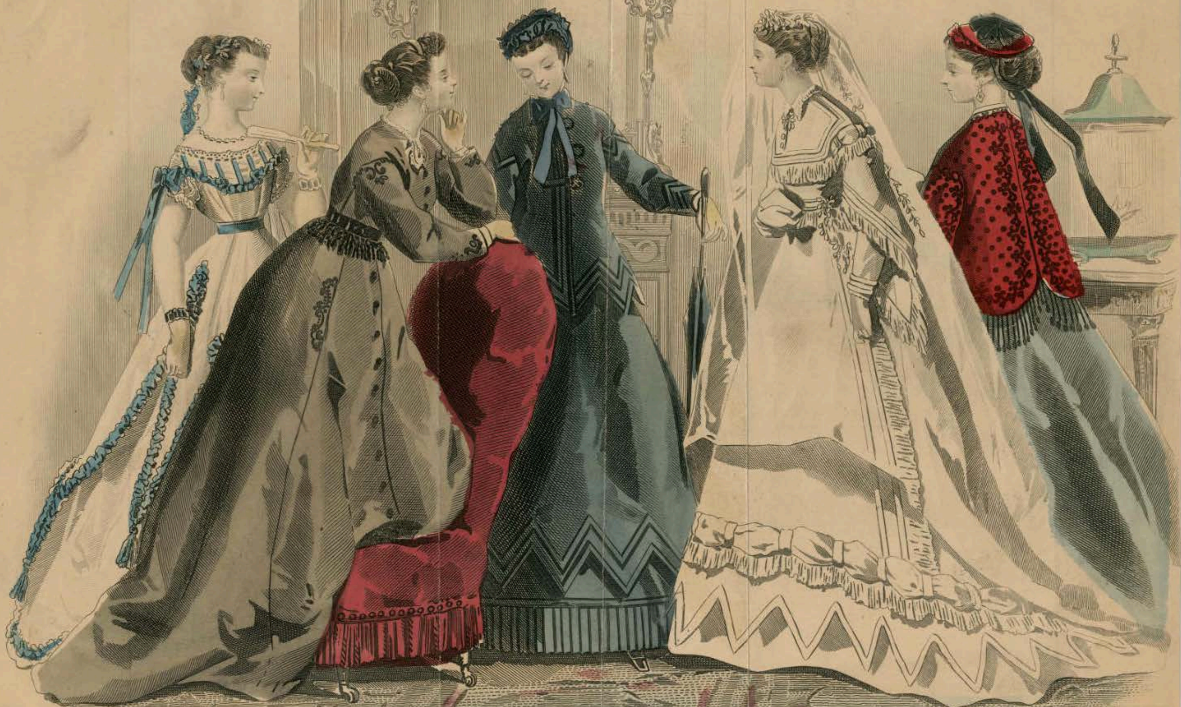
FIG. I.—EVENING DRESS OF WHITE MUSLIN.—The peplum, with deep points, is trimmed with ruchings of blue silk, and finished at the points with blue tassels. Blue flowers in the hair.