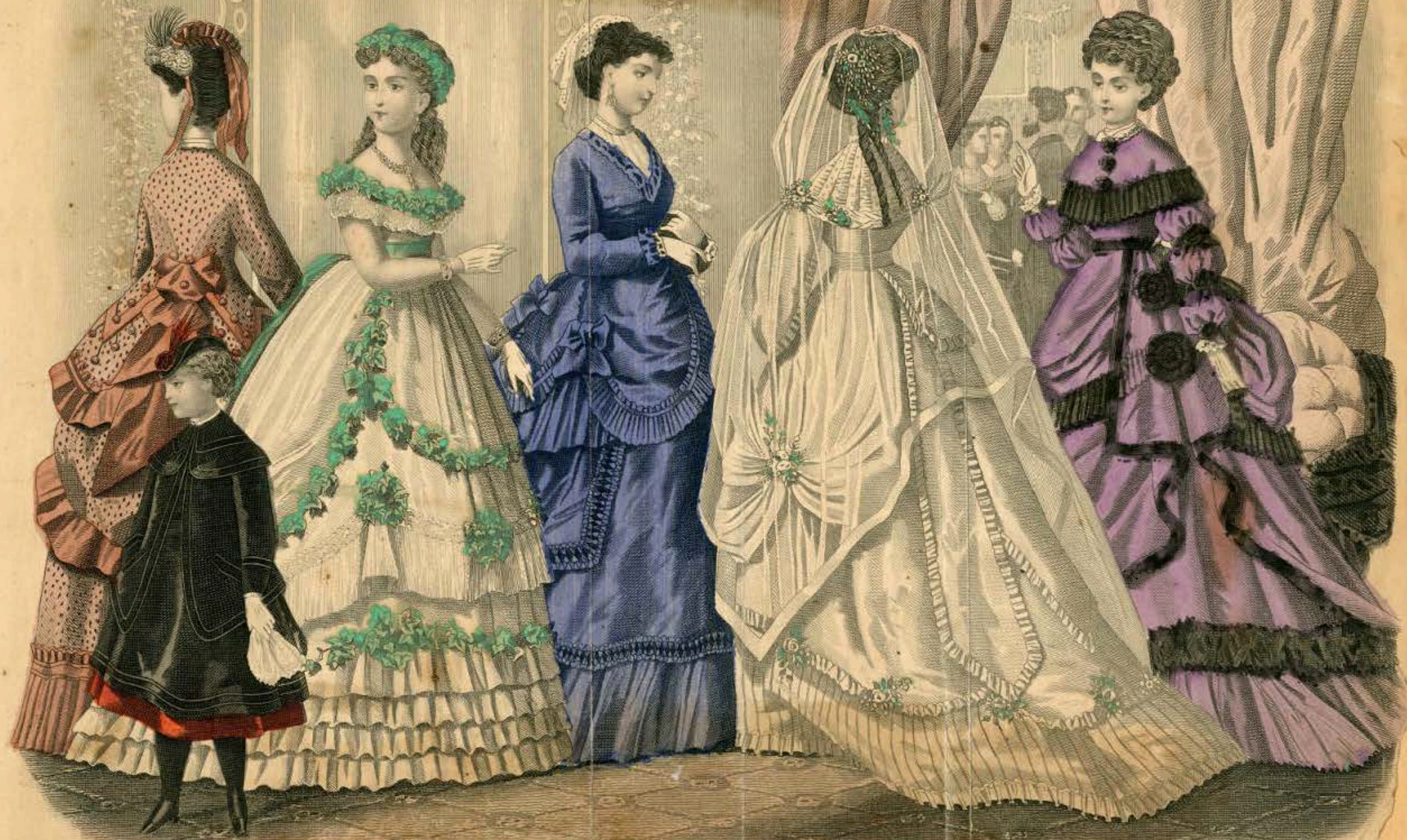
Illustration by F. Ford GODEY'S FASHIONS FOR DECEMBER 1860.