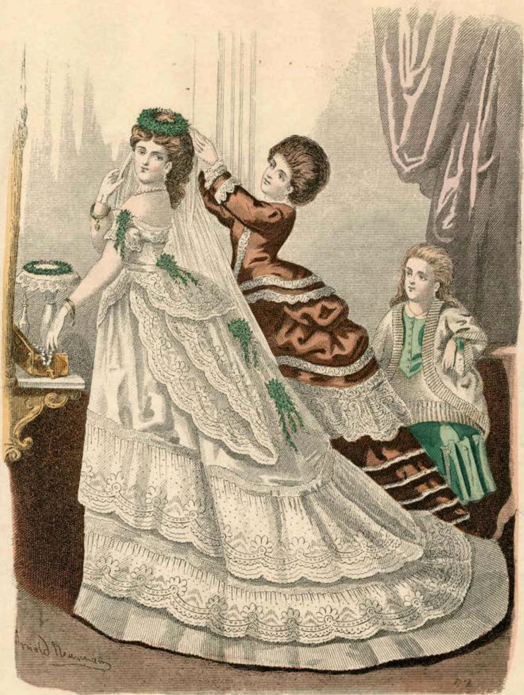
VICTORIA. October 1871. II.