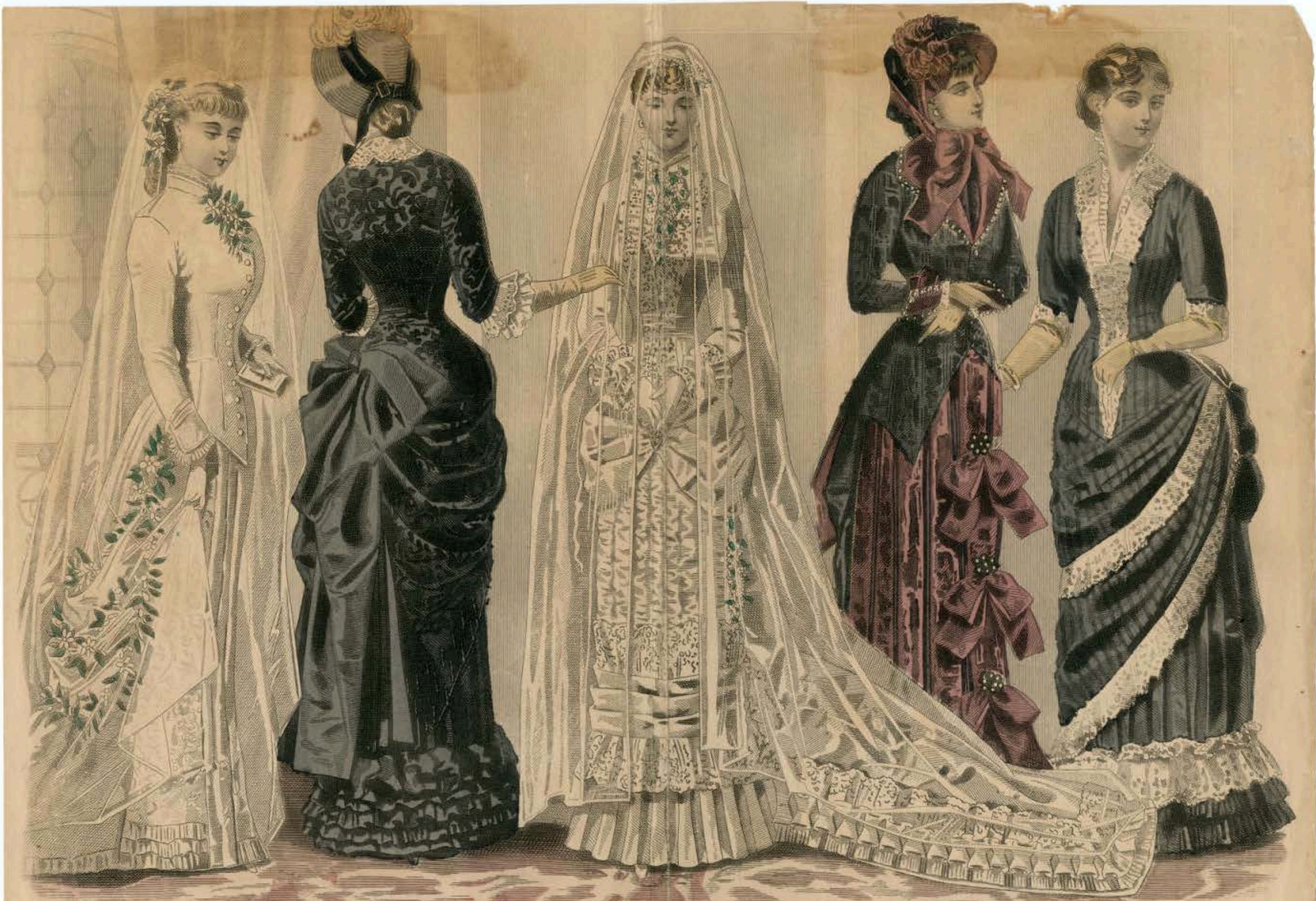
LES MODES PARISIENNES PETERSON'S MAGAZINE OCTOBER 1882 THE TWO BRIDES