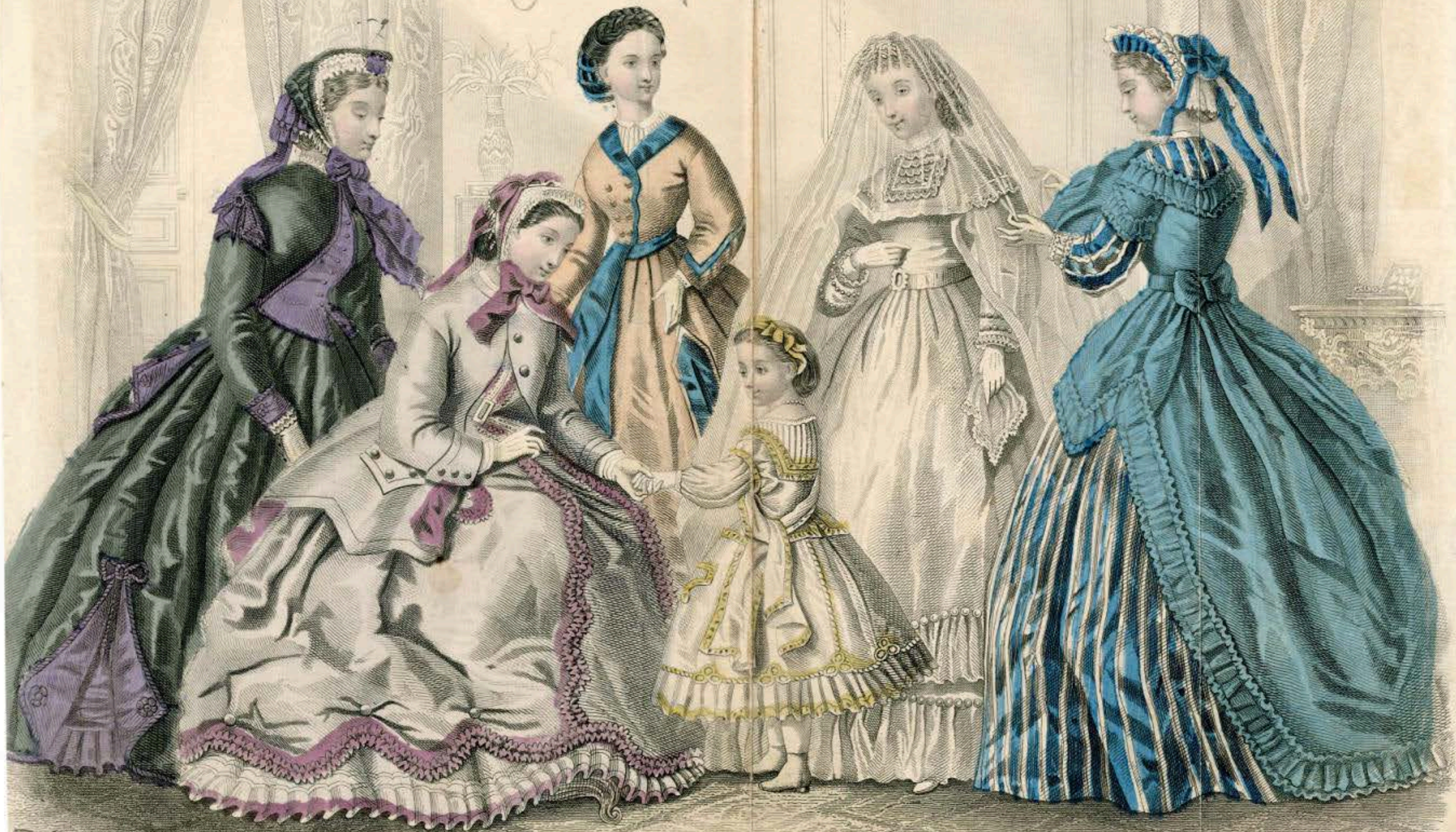
GODEY'S FASHIONS FOR OCTOBER 1865.