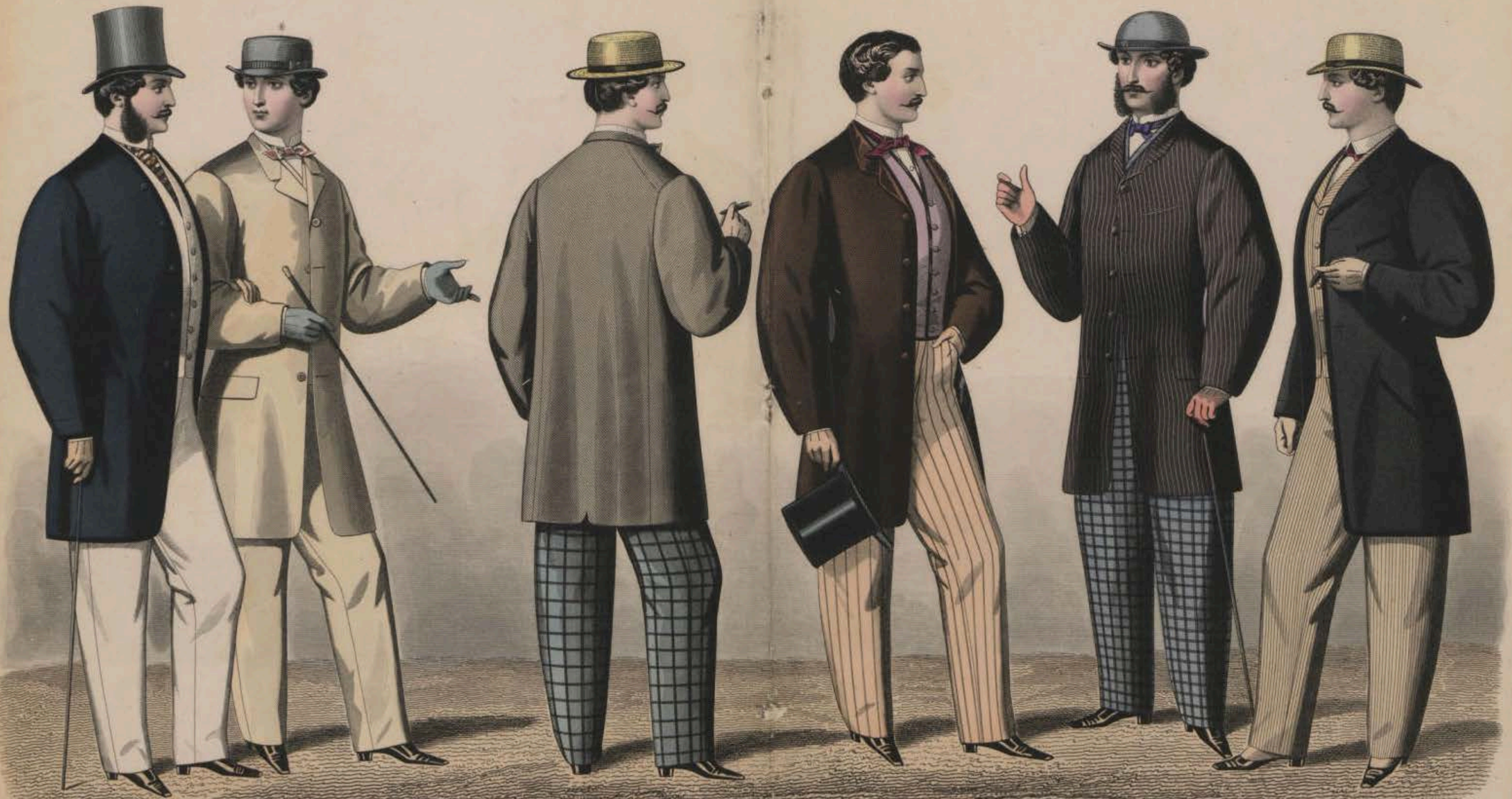
Illustration de M. de la Roche et de M. de la Roche