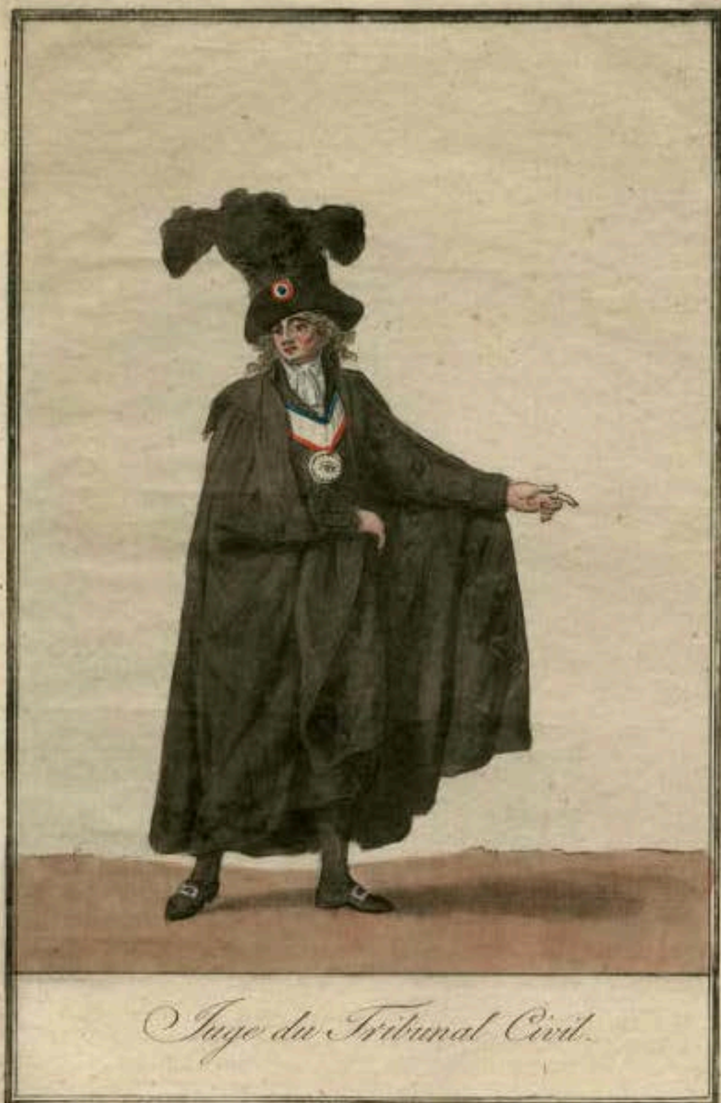
Juge du Tribunal Civil.