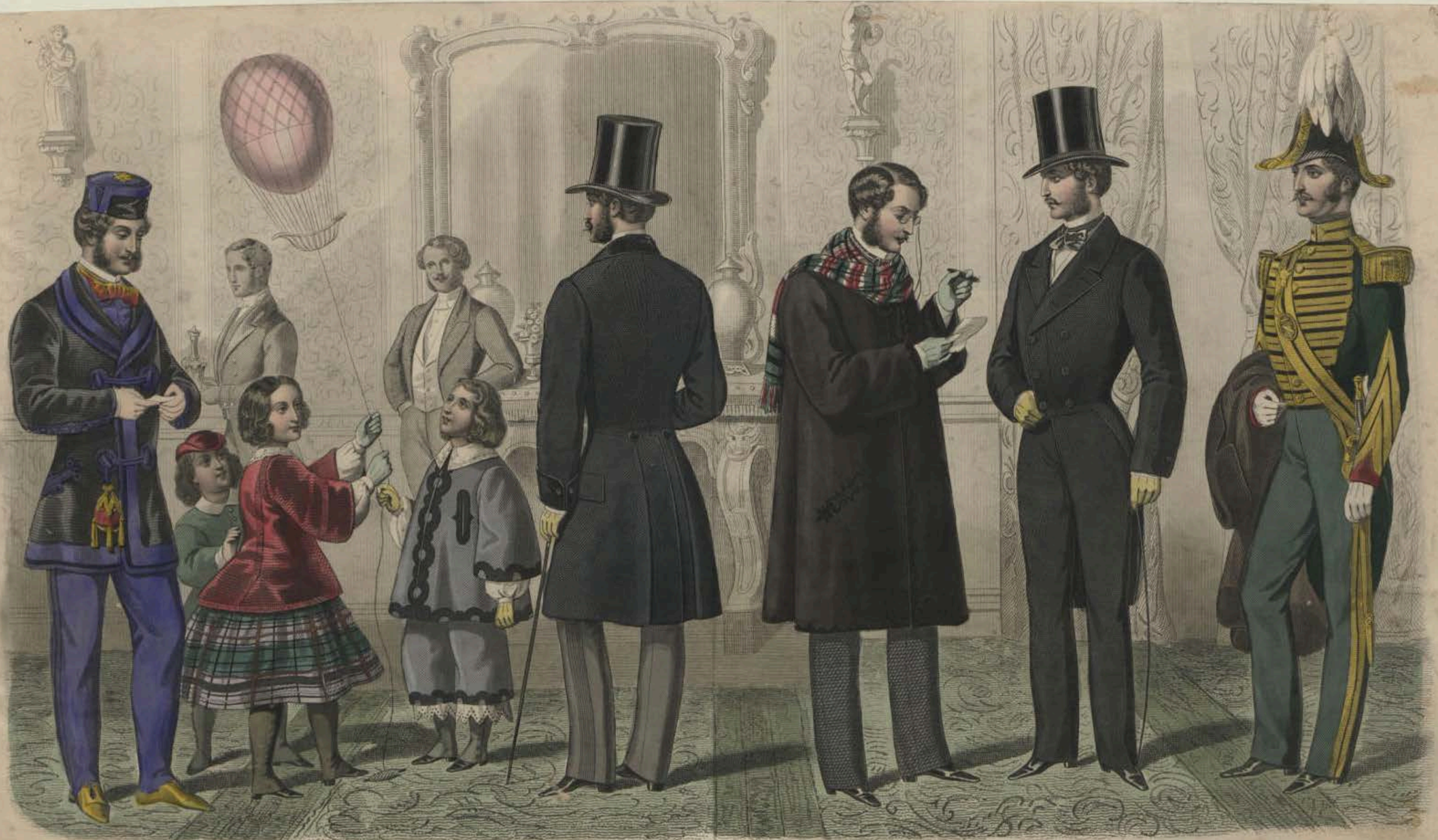
Illustration de la Chambre de Paris