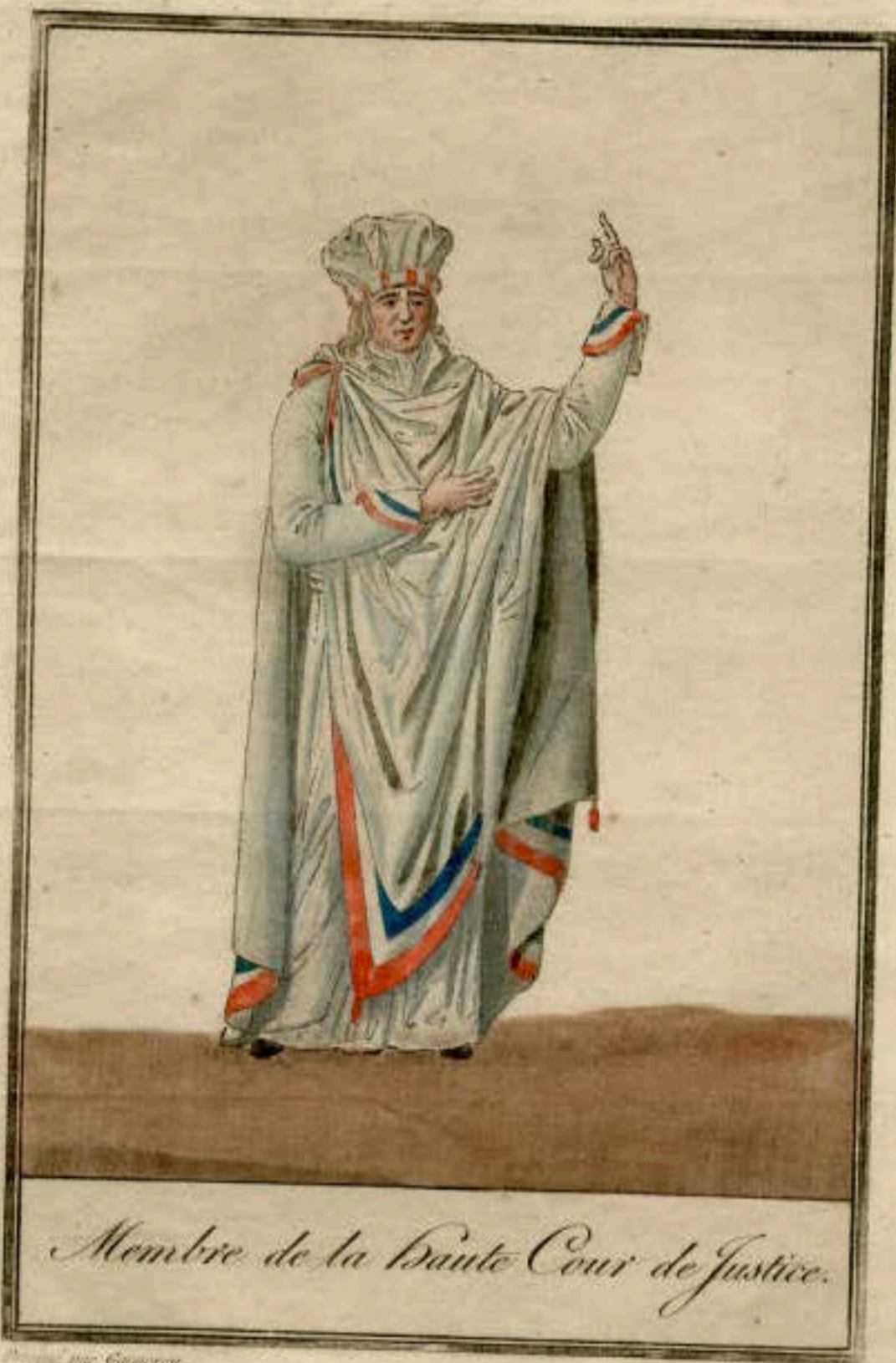
Membre de la Haute Cour de Justice.