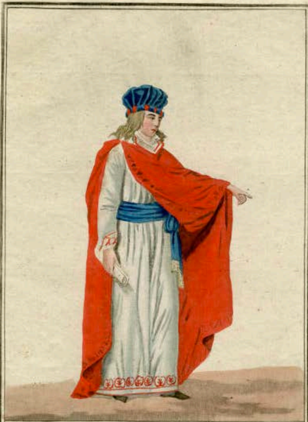
Membre du Conseil des Cinq Cents