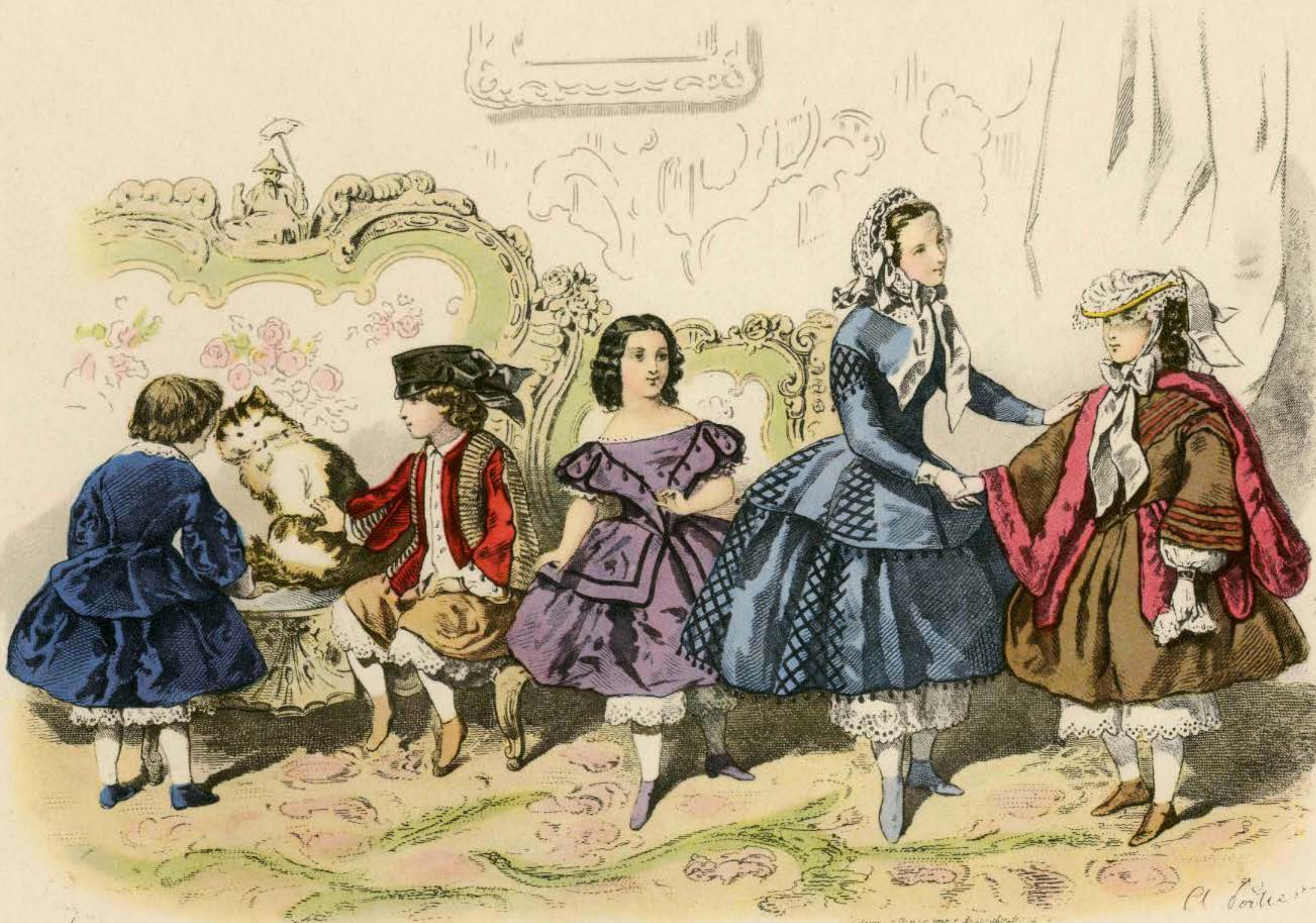
10 Young Children's Costumes of the late 'Fifties (c. 1858)