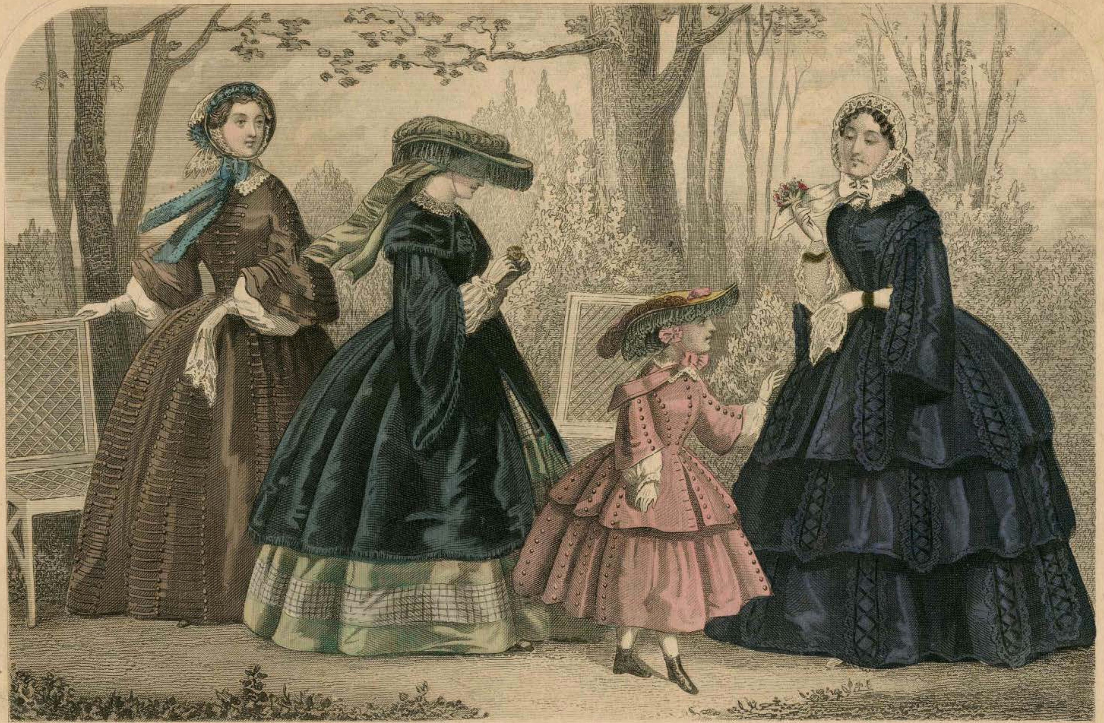
CODEY'S UNRIVALLED COLORED FASHIONS.