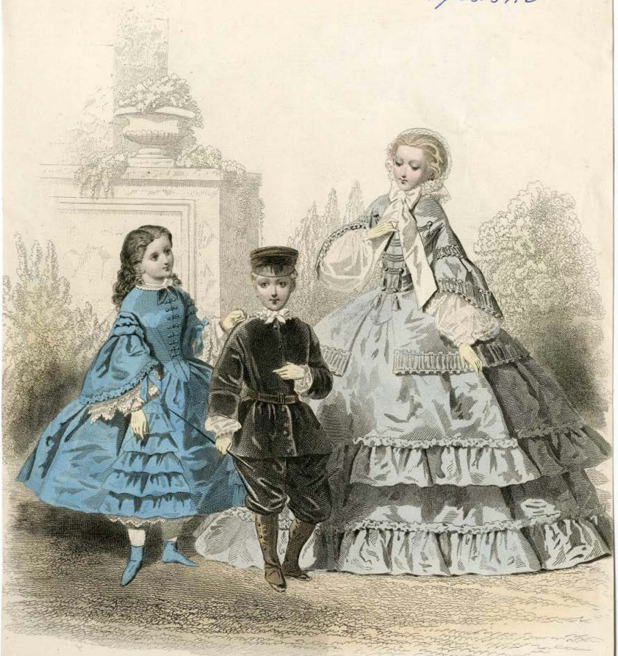
Illustration de Paris, le 15 Juin 1858.