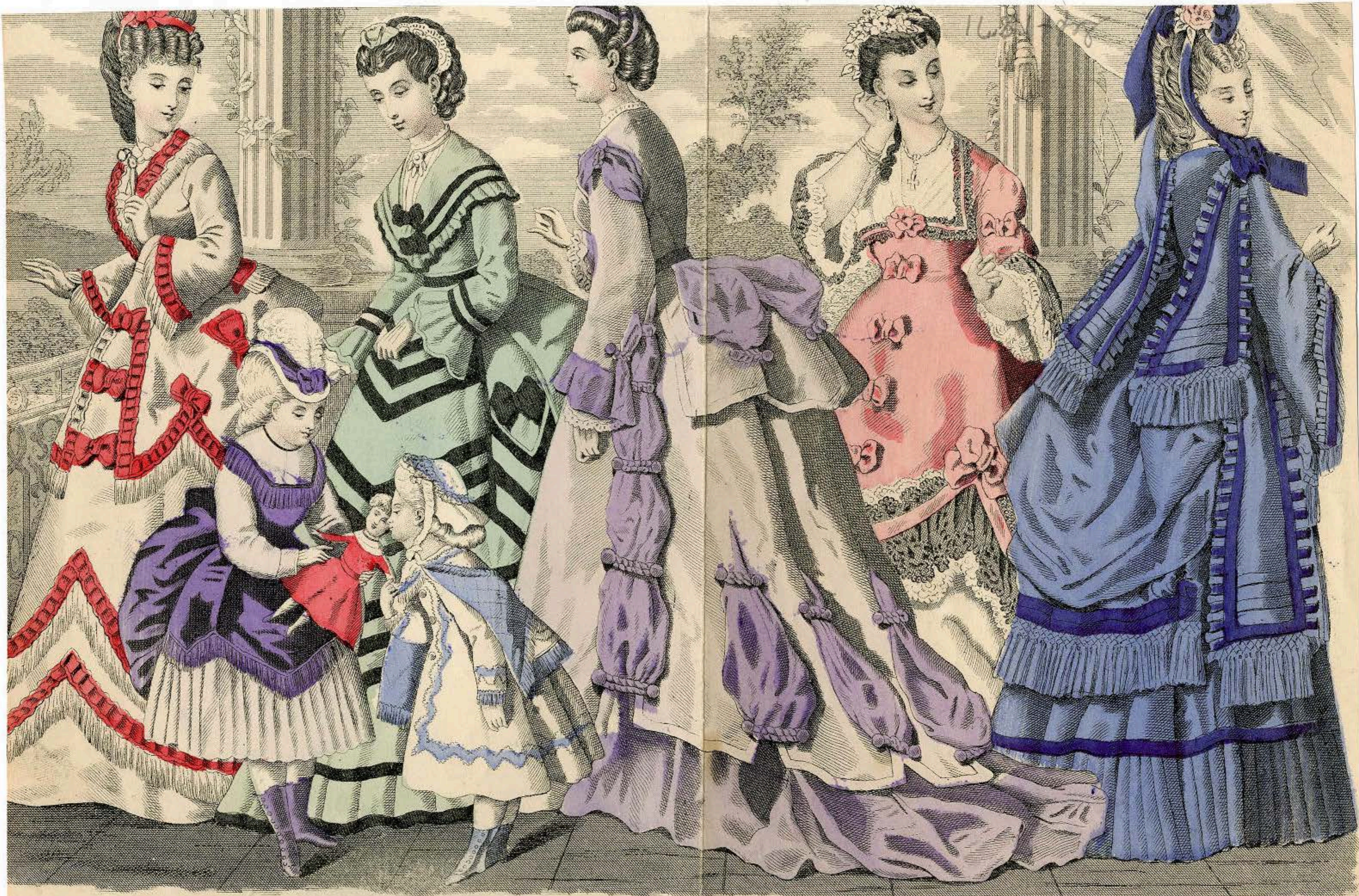
GODEY'S FASHIONS FOR SEPTEMBER 1871