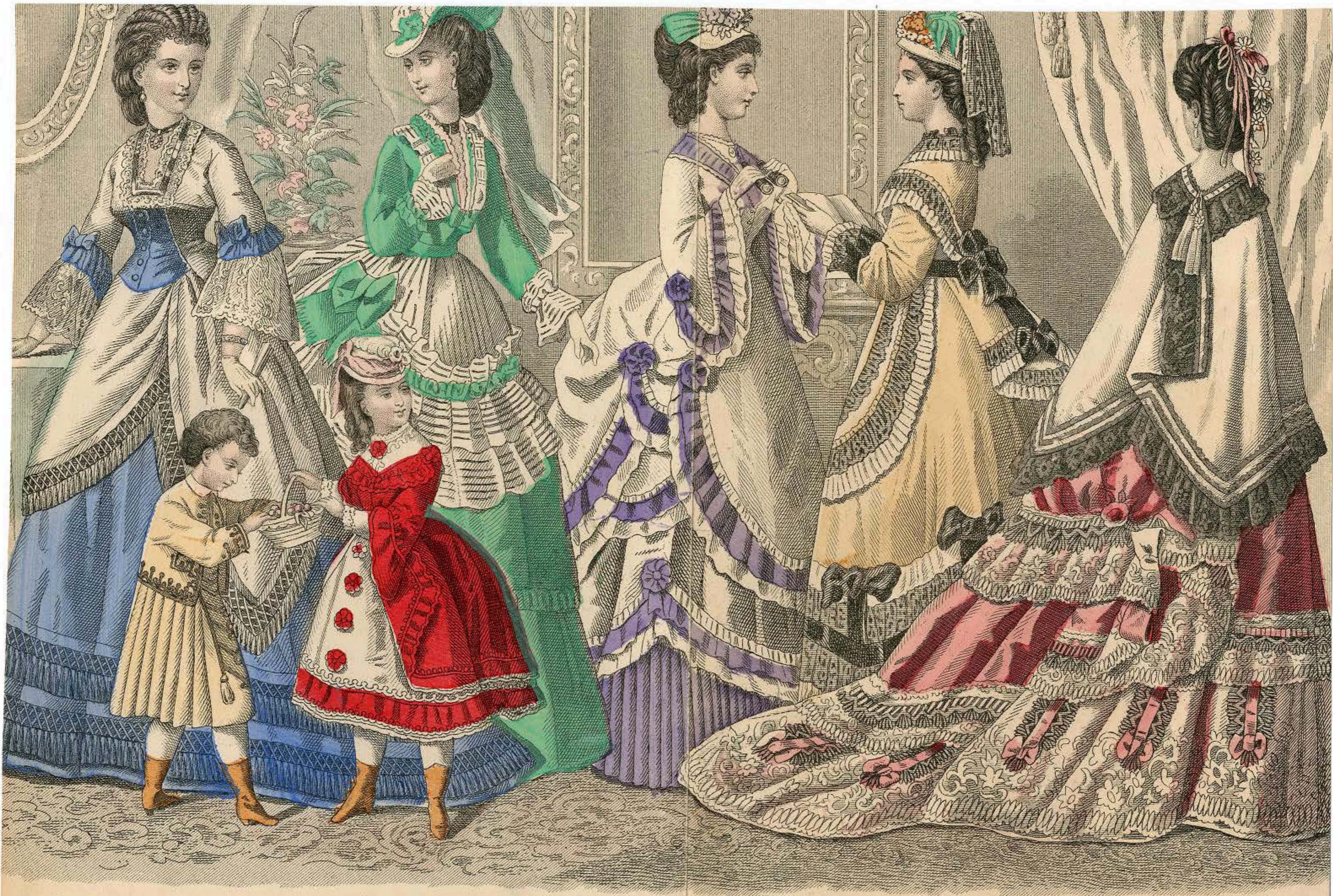
GODEY'S FASHIONS FOR MAY 1871.