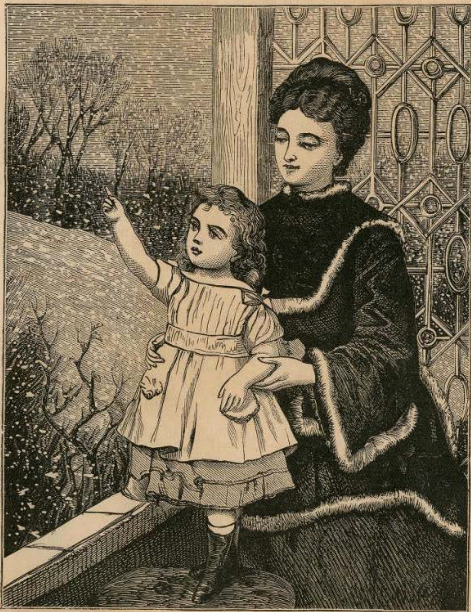
THE FIRST SNOW.