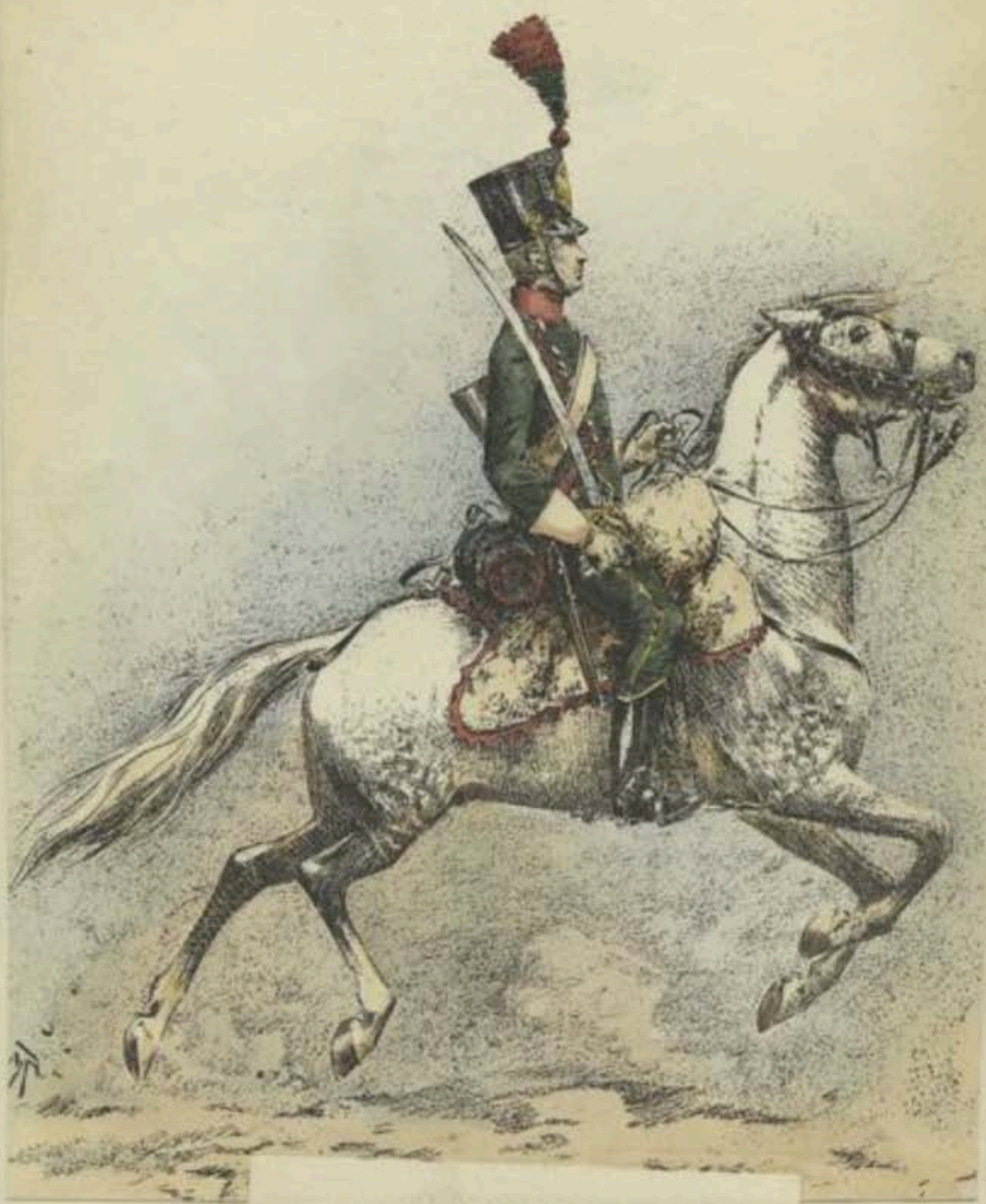
LE 27 e CHASSEURS A CHEVAL