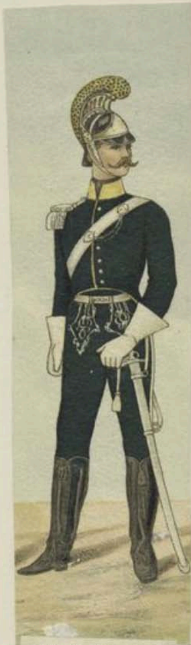
officier de chevau-légers