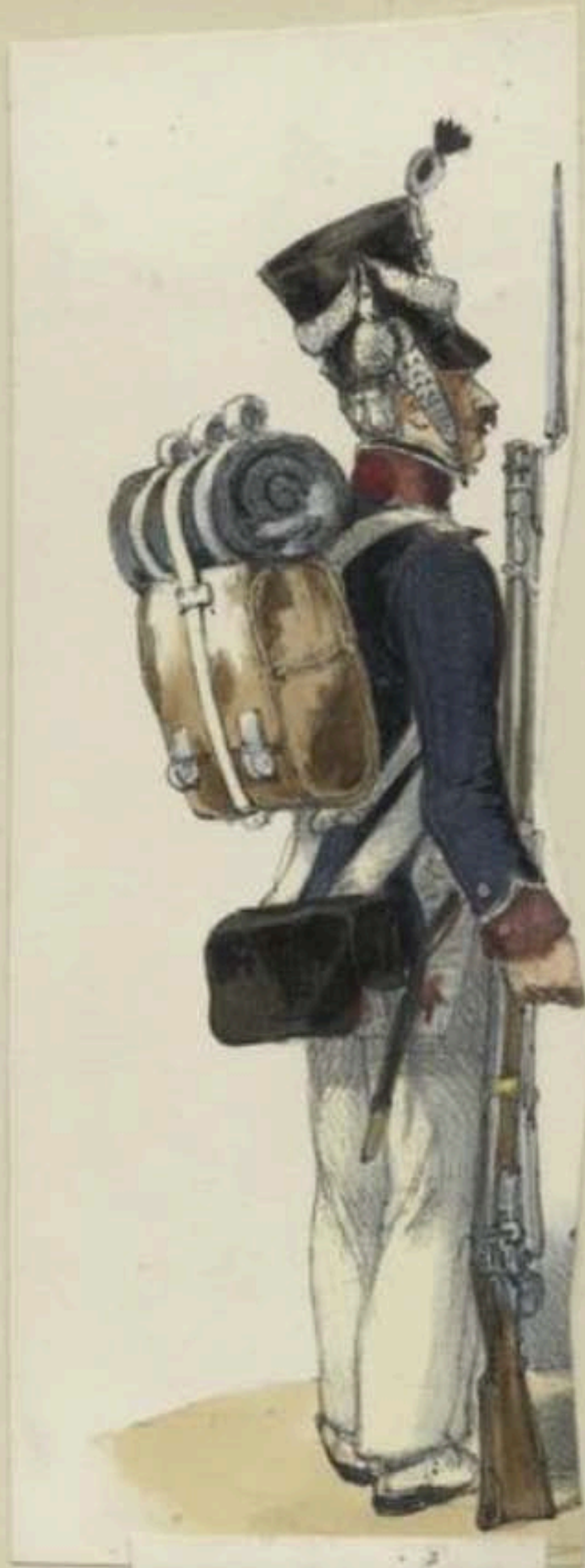
1815. Empire. (G de Nat le mobile.)