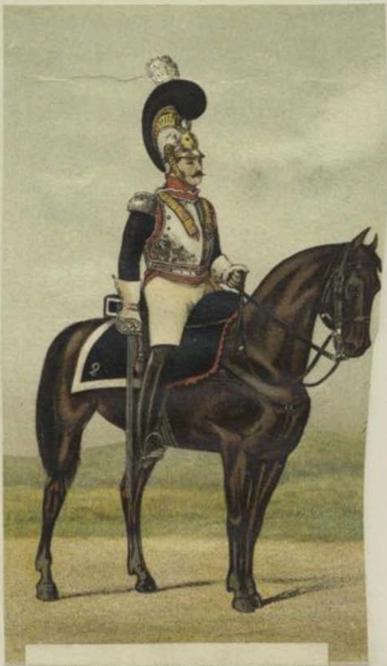
Officier du 2 me Cuirassiers (belge). 1820.