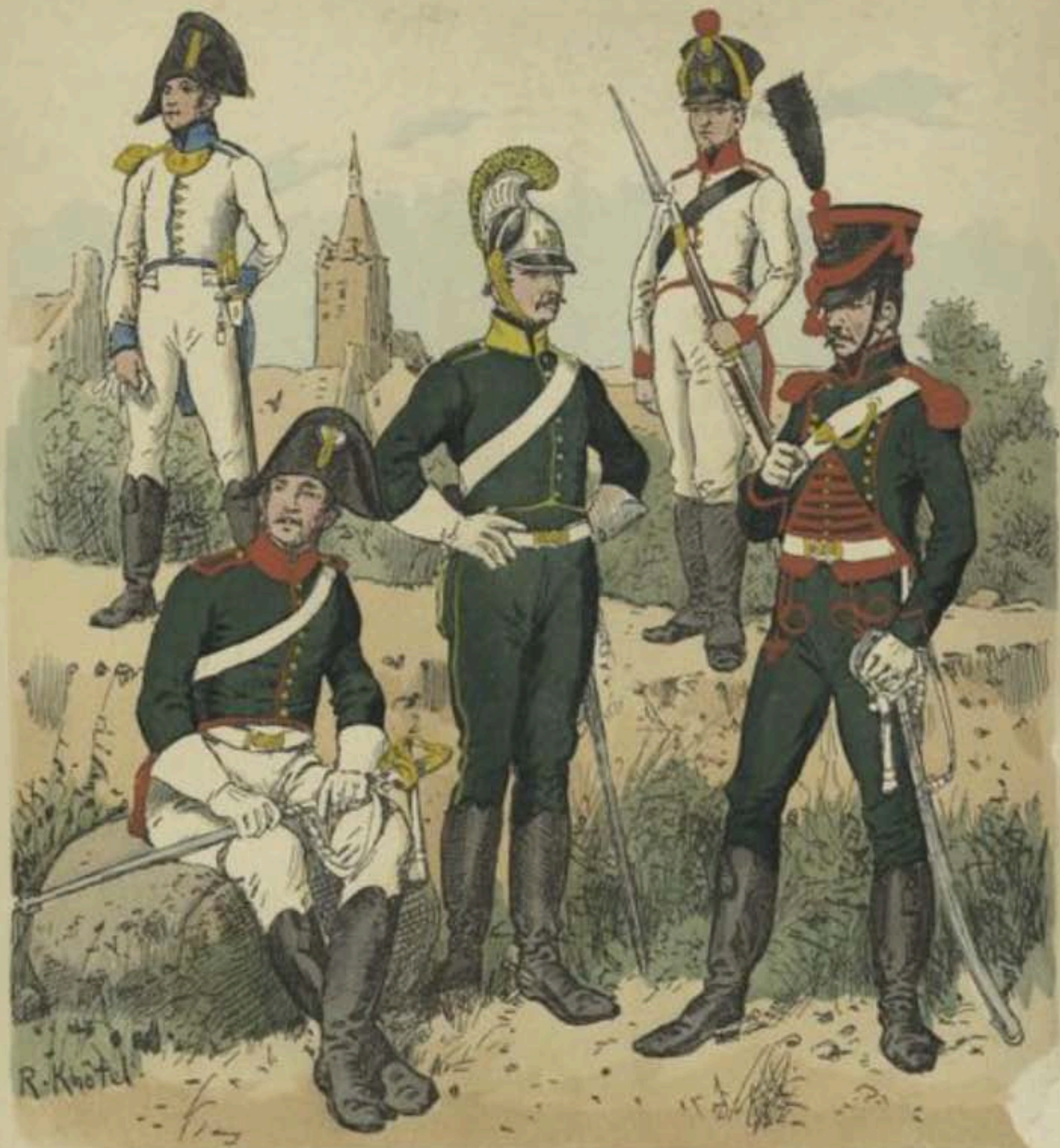
Offizier vom 3. Inf.-Rgt. Maréchaussée (Gendarm). Chevauleger.