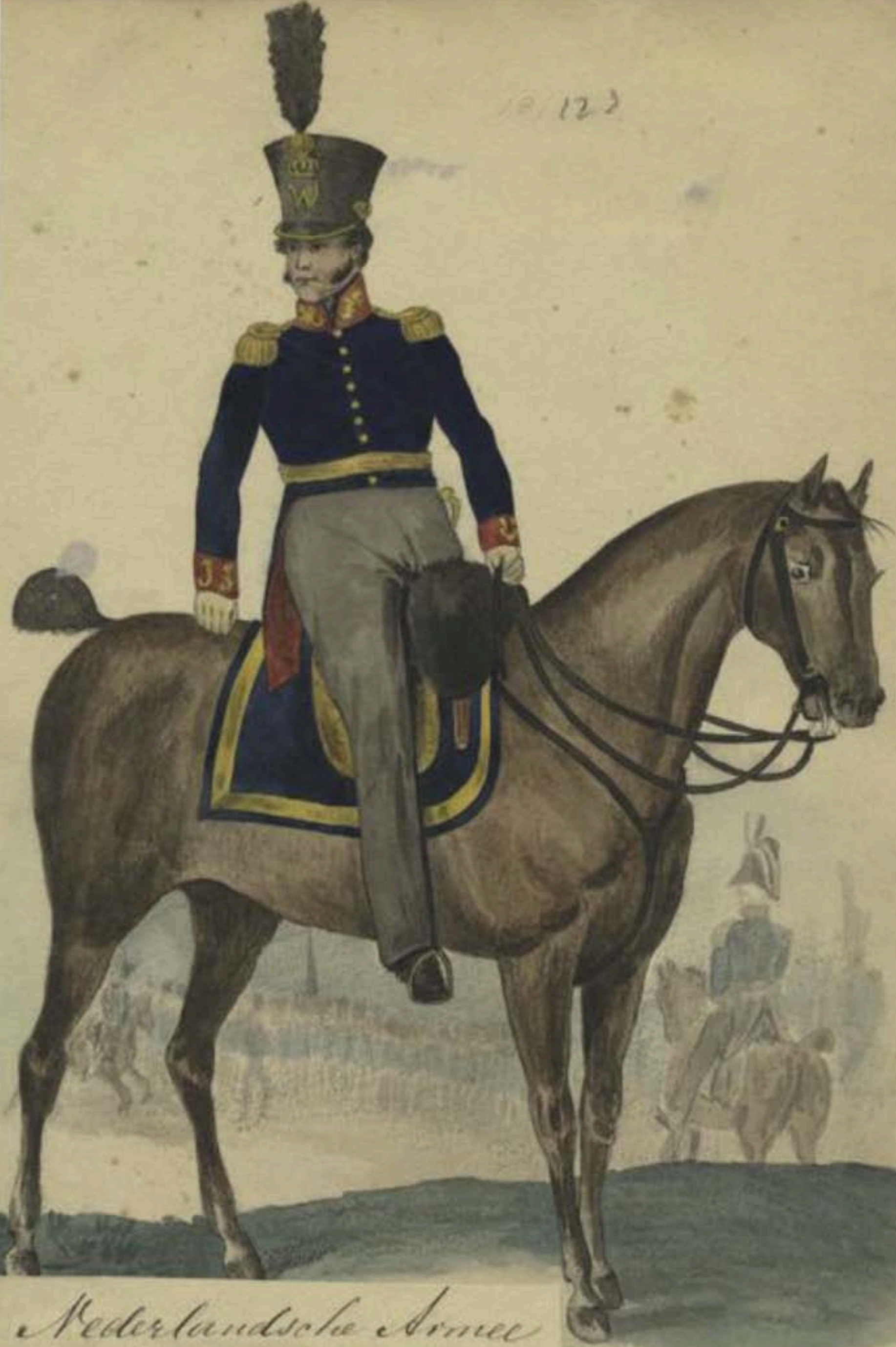
Nederlandsche Armee Kolonel van der Generalen Staf.