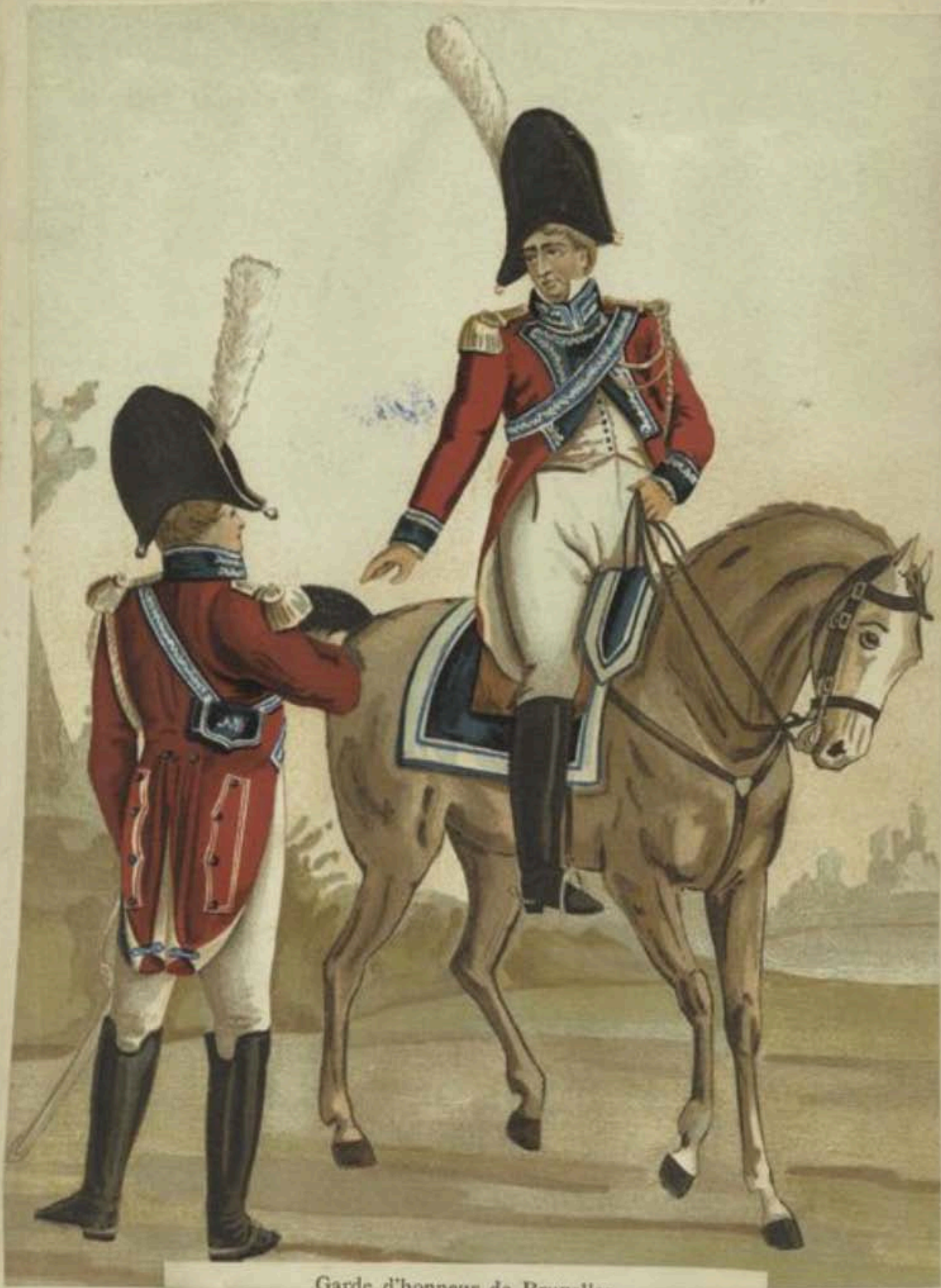
Garde d'honneur de Bruxelles lors de la visite de l'Empereur Napoléon I er , en 1805.