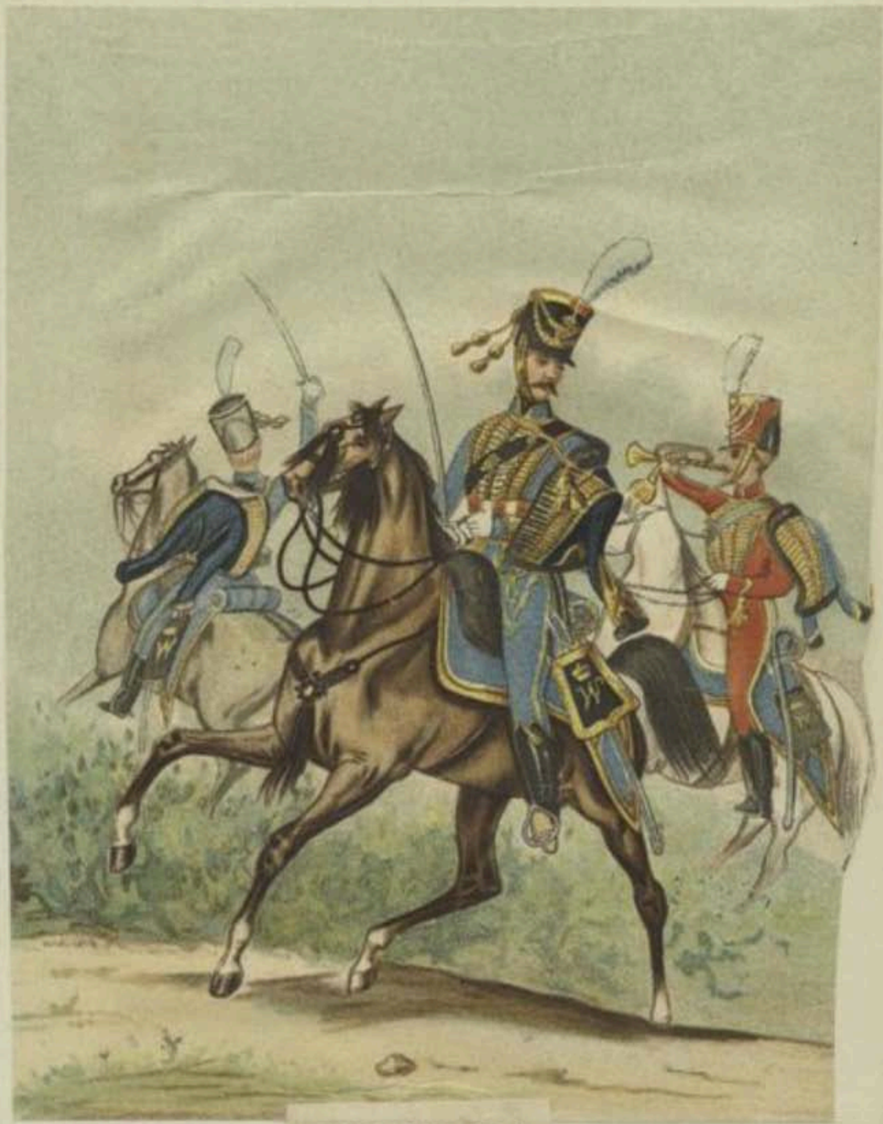
HUSSARDS N° 8. 1815.