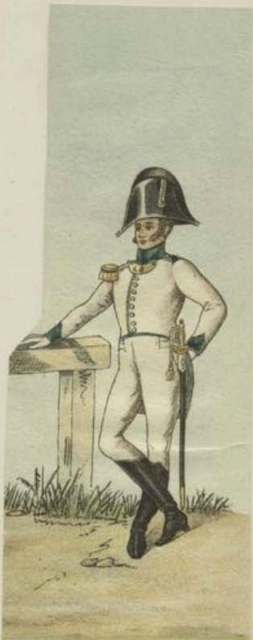
Officier d'infanterie, 1 er régiment.