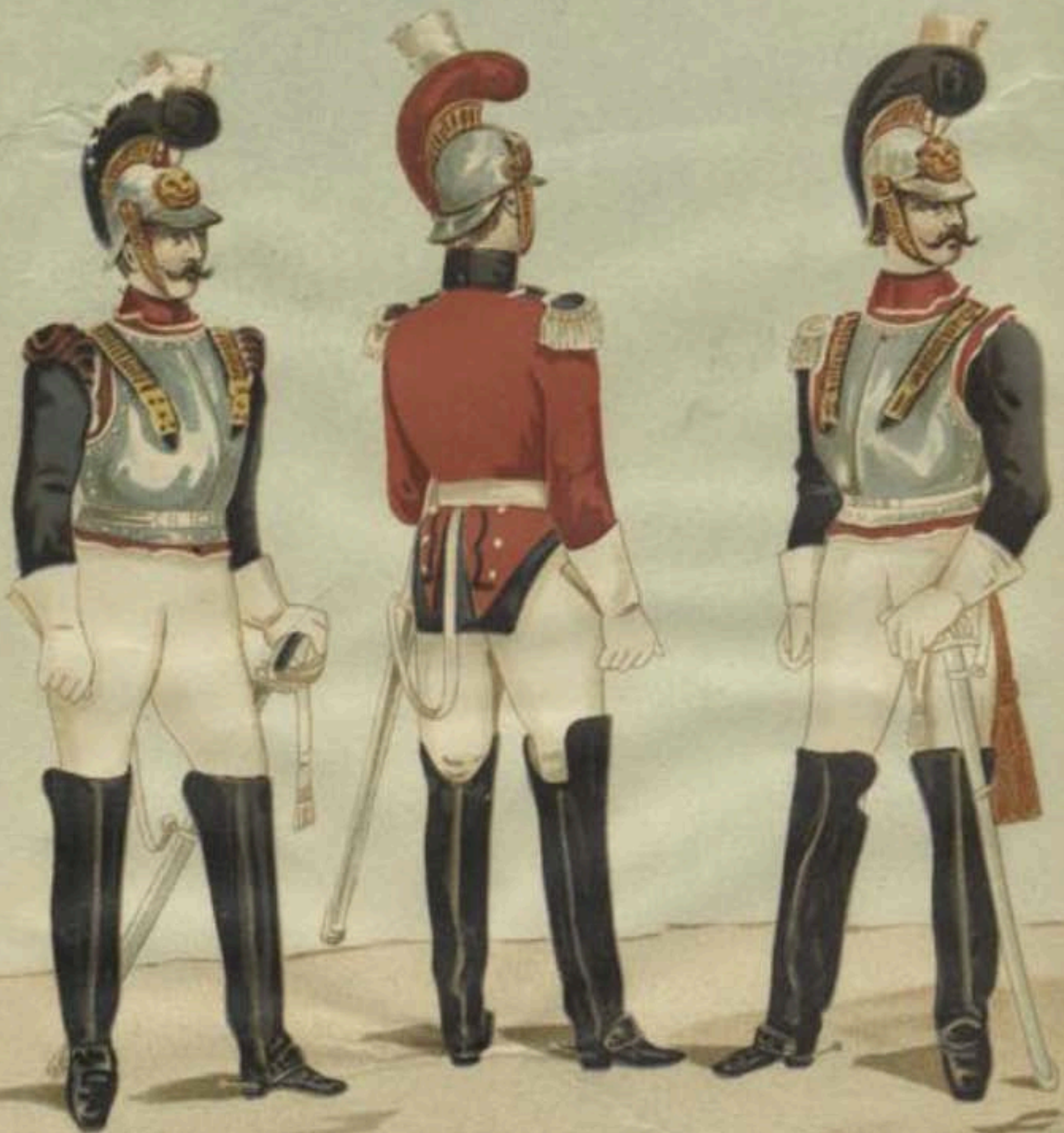
2 e CUIRASSIERS. 1818. Soldat, Trompette et Officier.