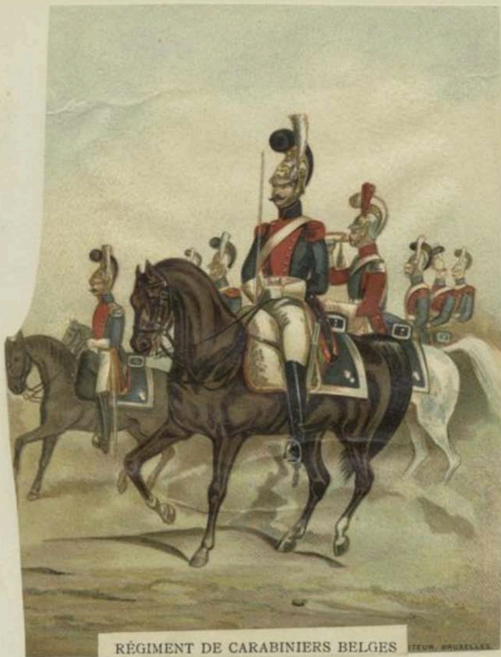
RÉGIMENT DE CARABINIERS BELGES