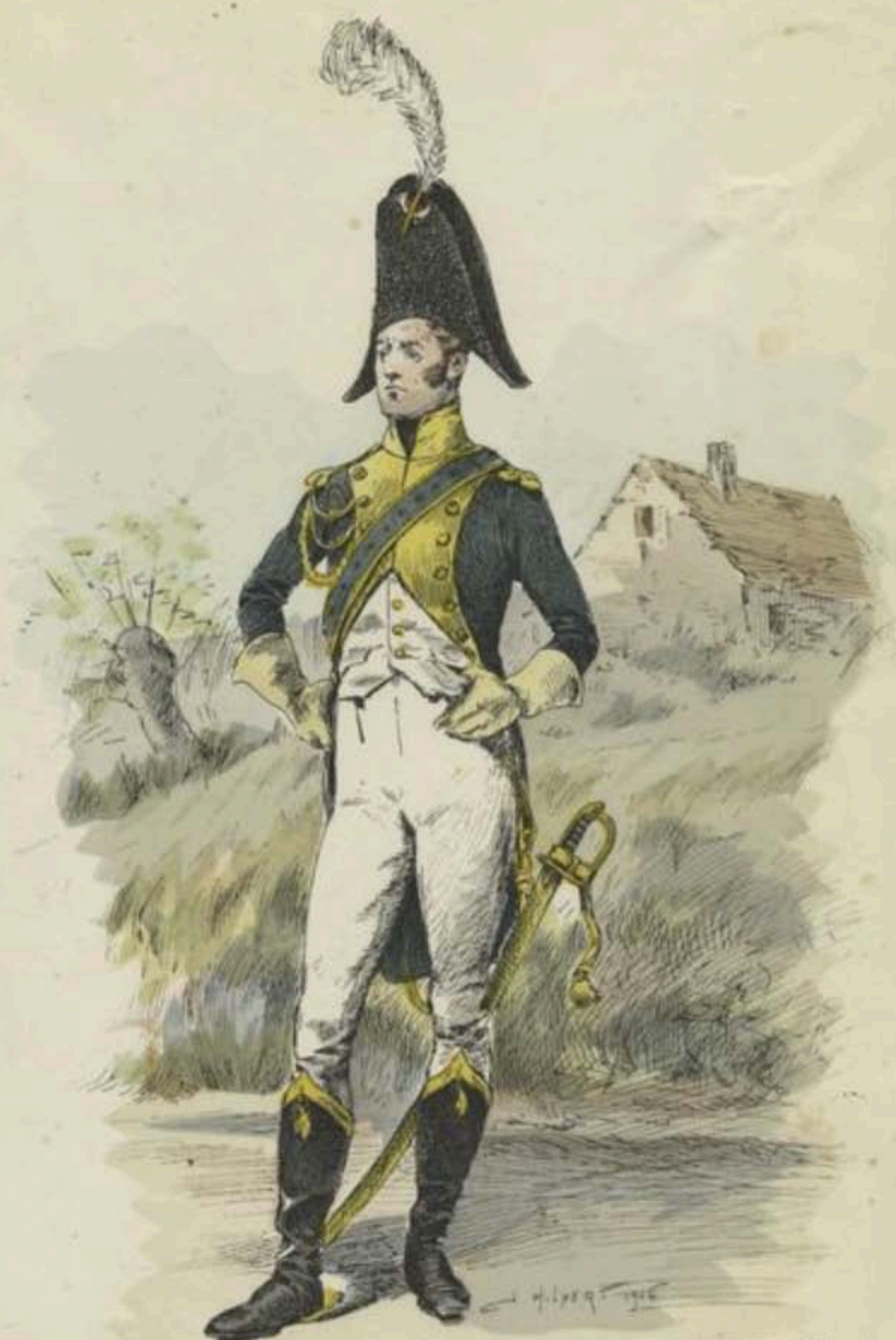
Dessin colorié de J. Illpert