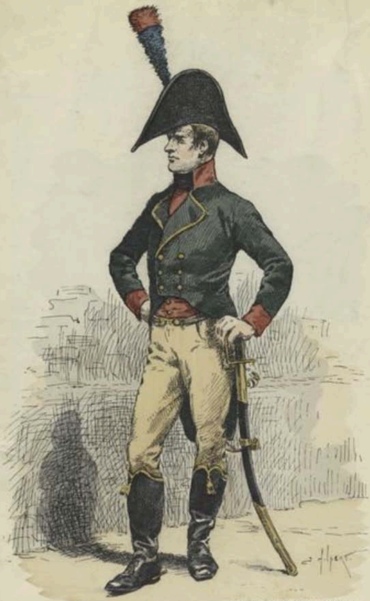
Dessin colorié de J. Hilpert