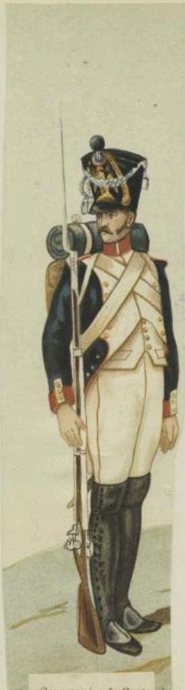
Compagnies du Centre Soldat.