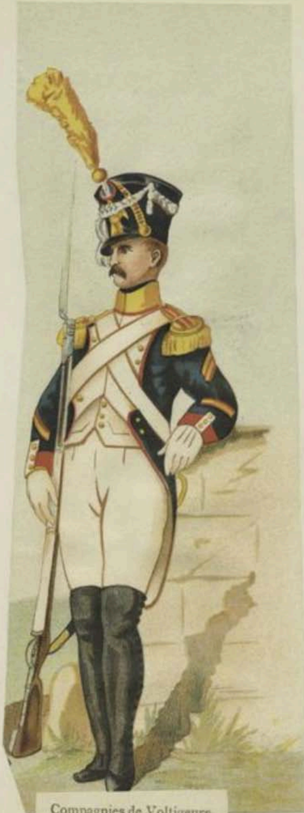
Compagnies de Voltigeurs Sous-Officier.