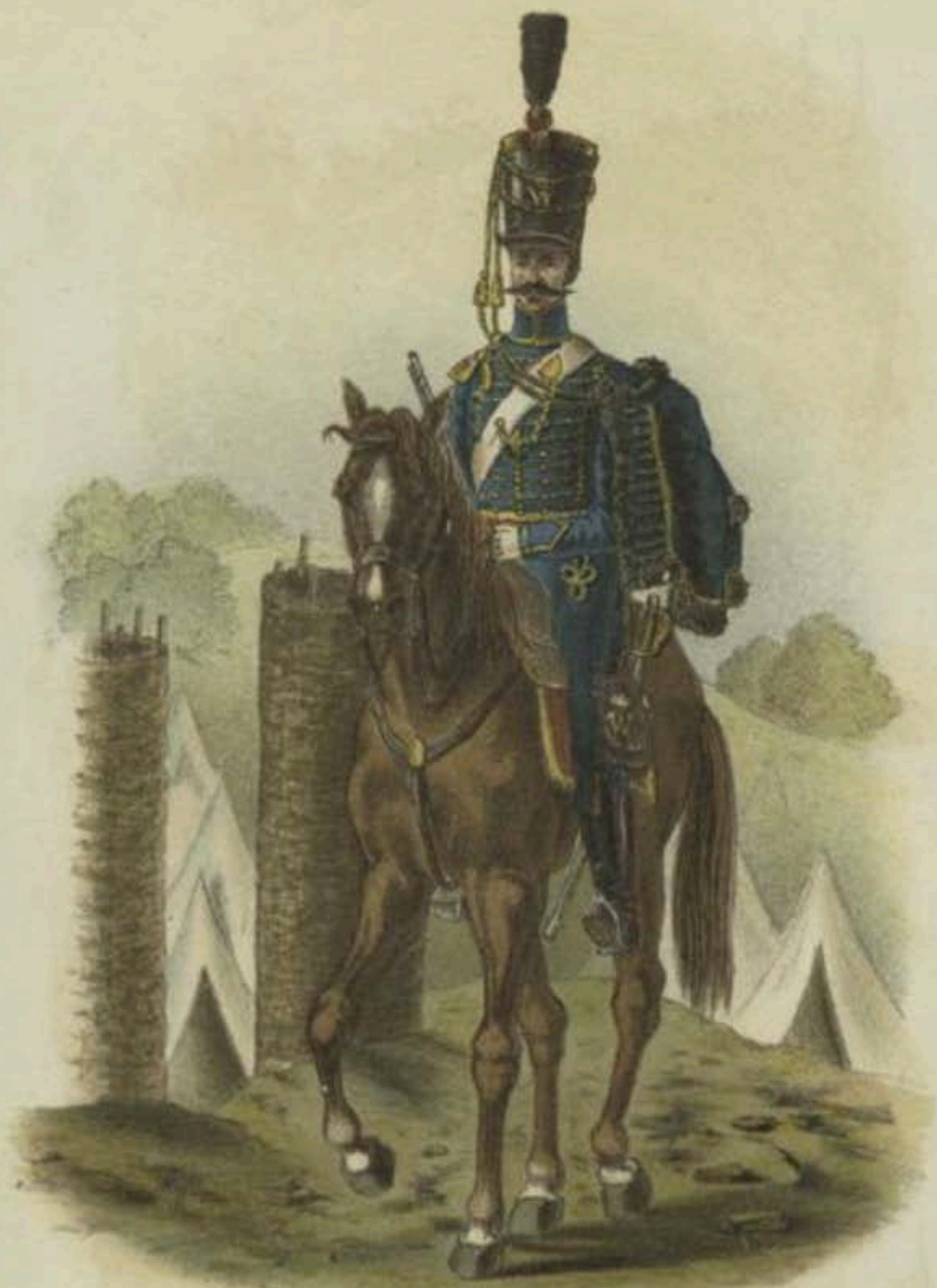
PAYS-BAS 1818 Hussards N° 8.