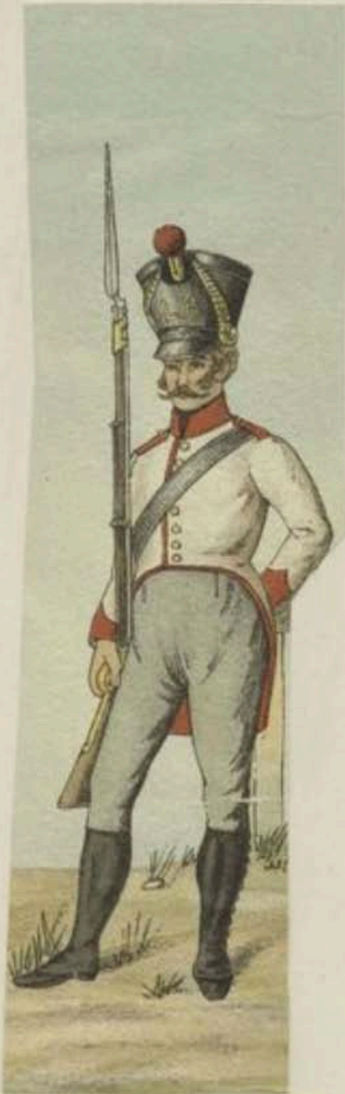
Soldat d'infanterie, 4 e régiment.