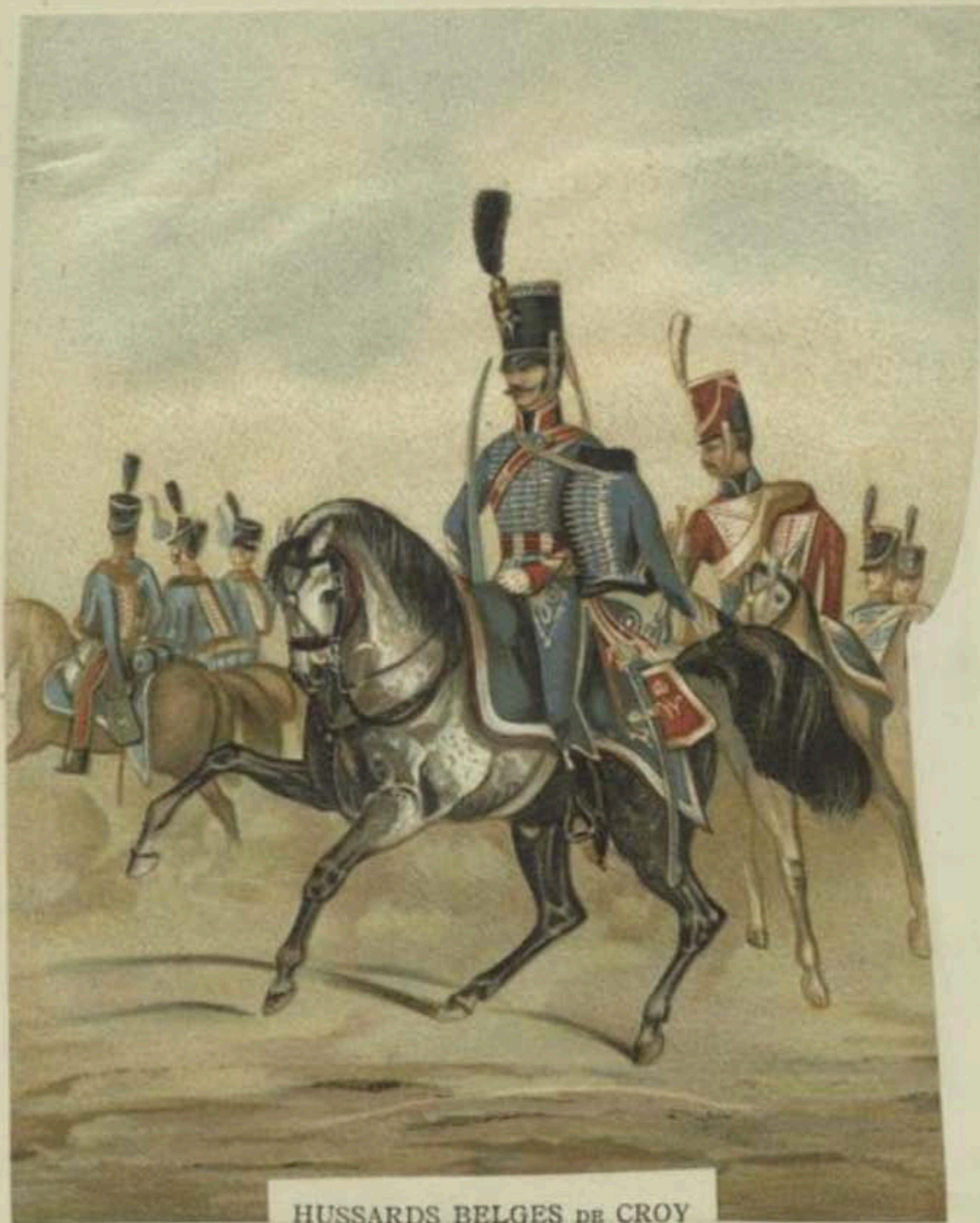
HUSSARDS BELGES DE CROY