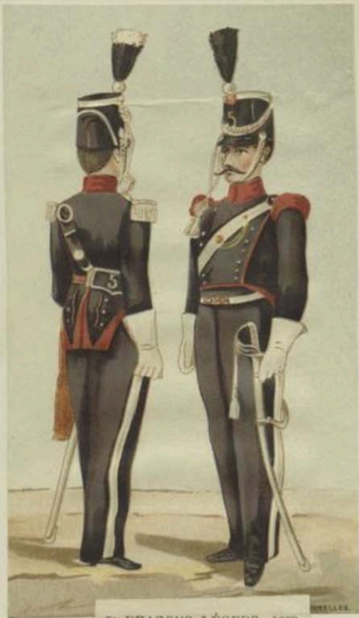
5 e DRAGONS LÉGERS. 1820. Officier et Soldat.