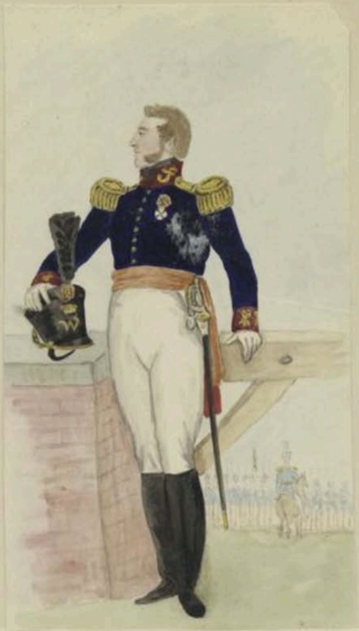
Quartier Maître Général - Colonel de l'Etat-major.