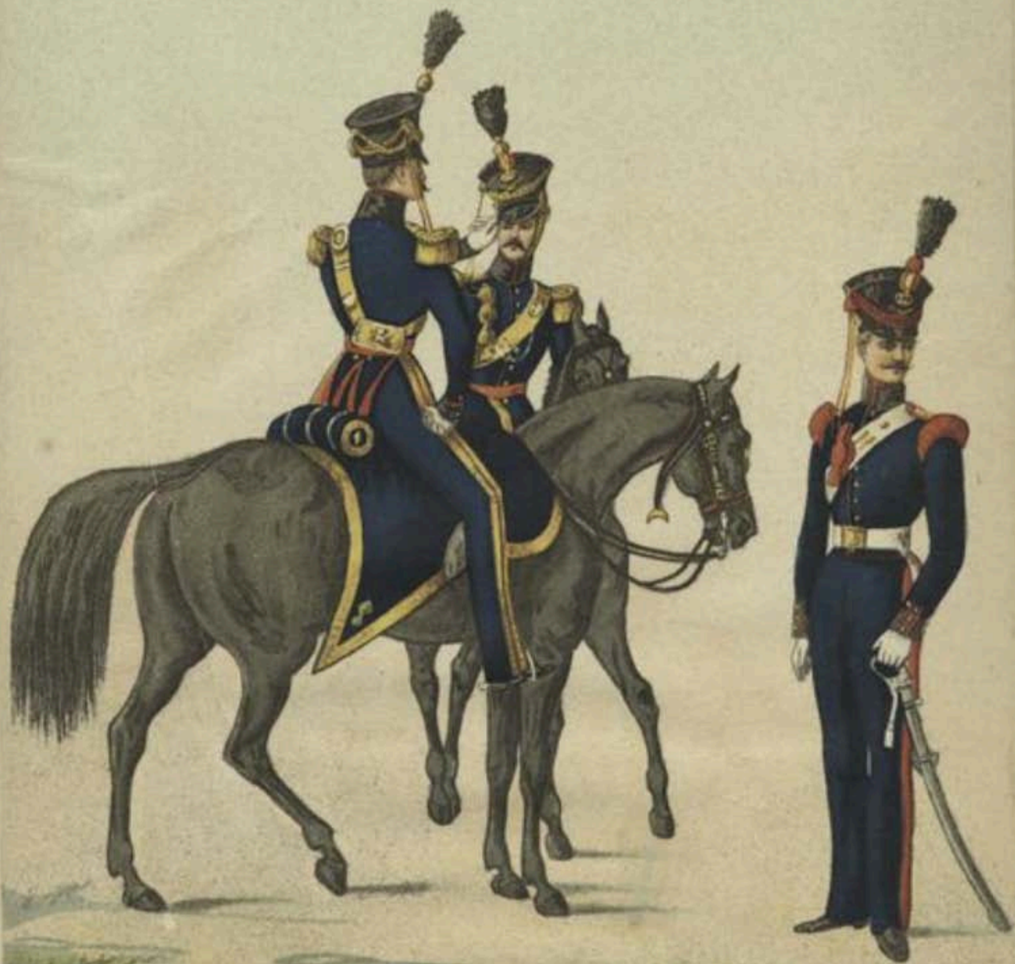
Artillerie à cheval en 1829.