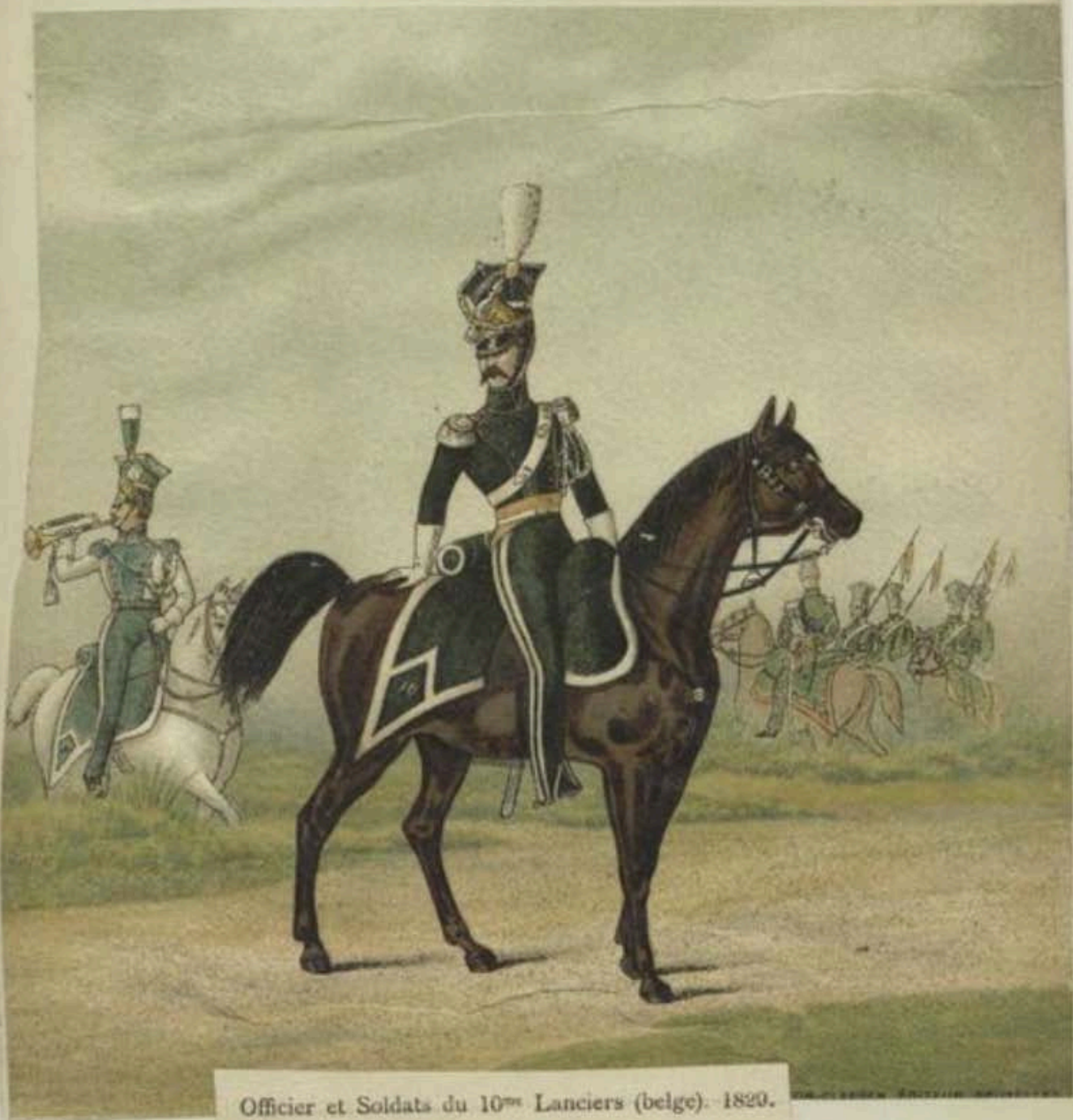
Officier et Soldats du 10 me Lanciers (belge). - 1820.