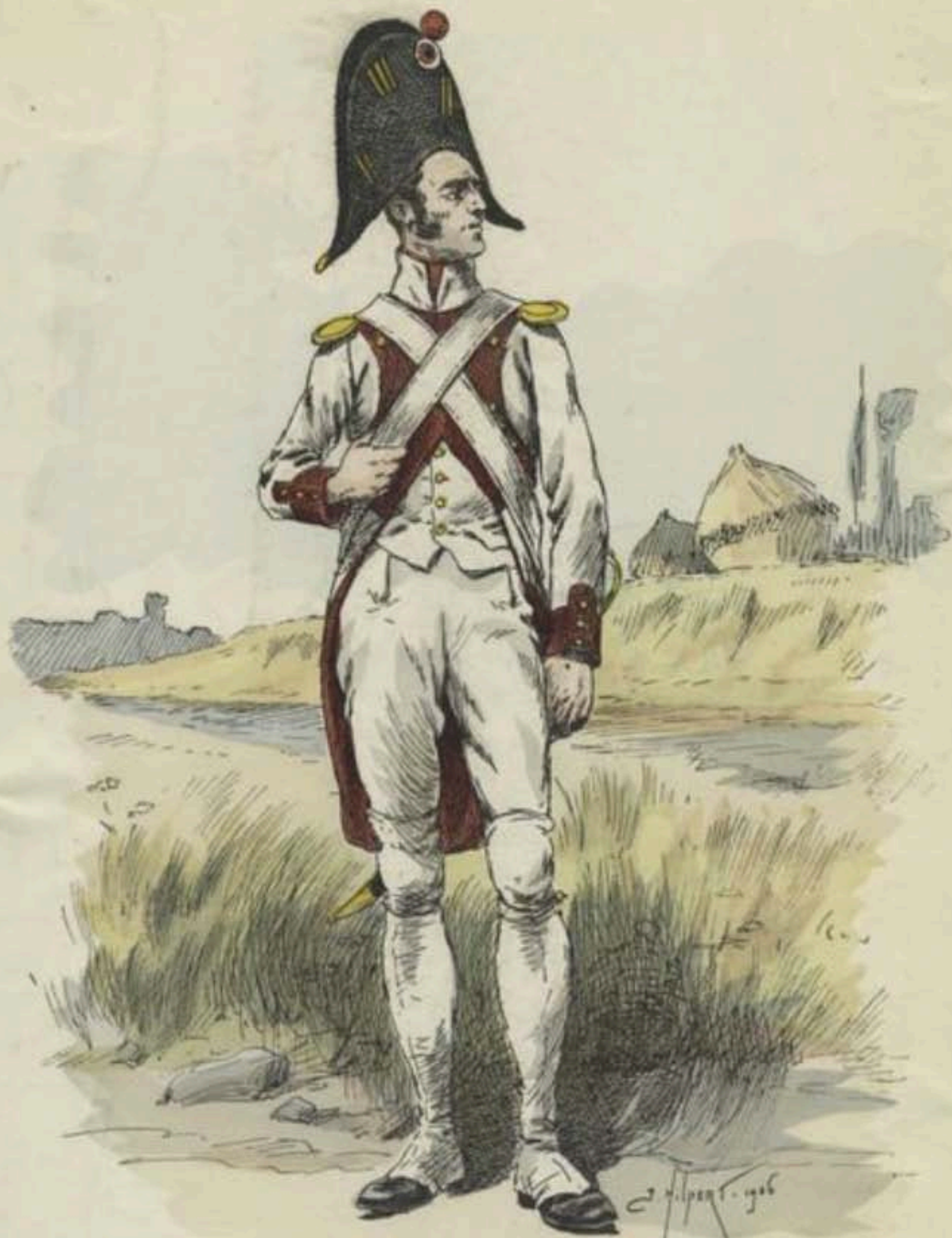
Dessin colorié de J. Hilpert