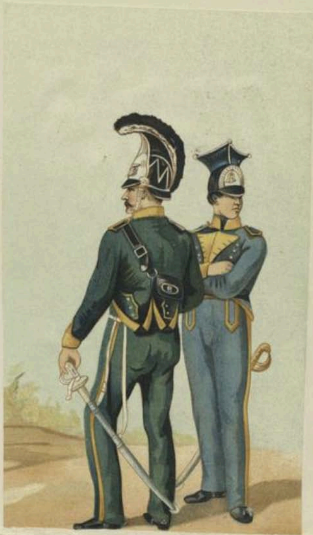
Escorte d'honneur bruxelloise lors de l'entrée à Bruxelles de Guillaume I er , roi des Pays-Bas, le 27 Septembre 1815.