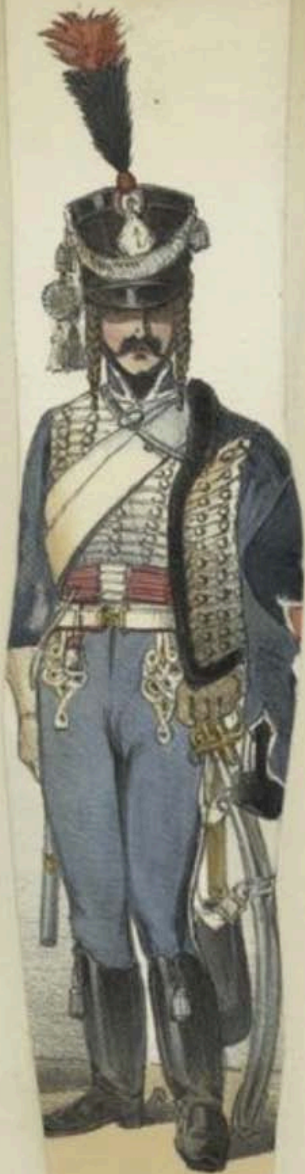
1810. ( Empire ) ( 8 e Regiment )