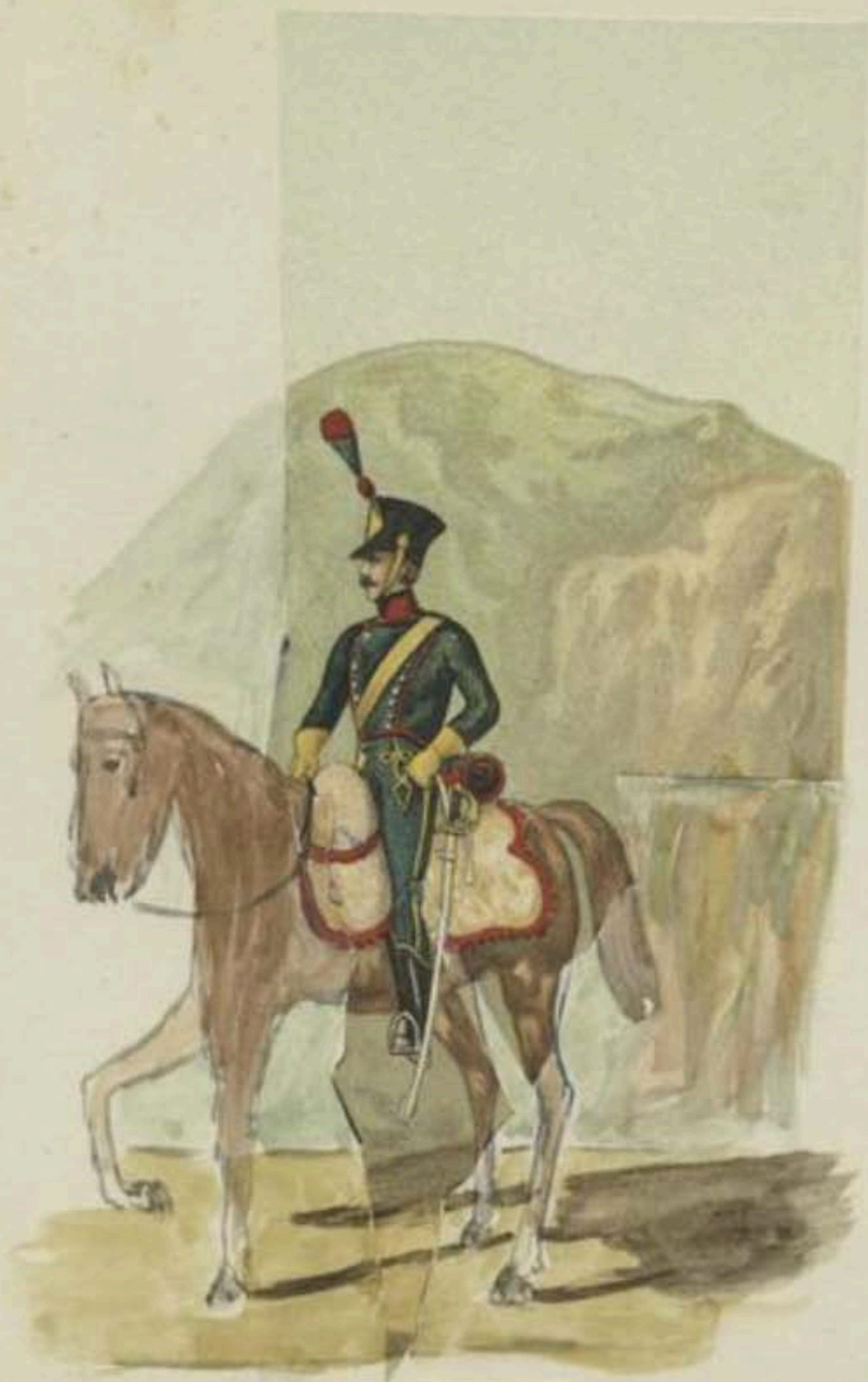
27 e Chasseurs à cheval. 1812