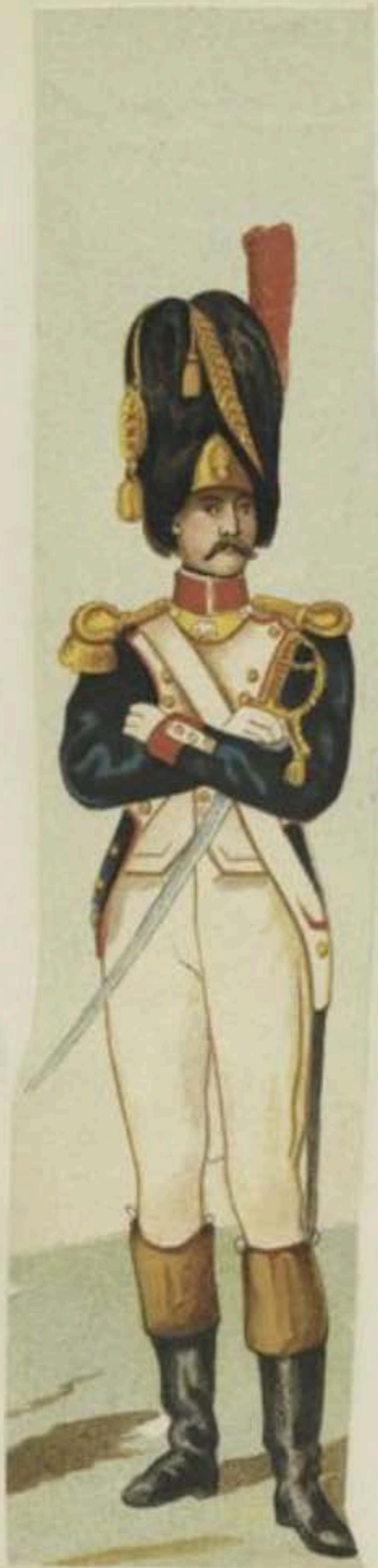
LE 112 e DE LIGNÉ (BELGE). 1800