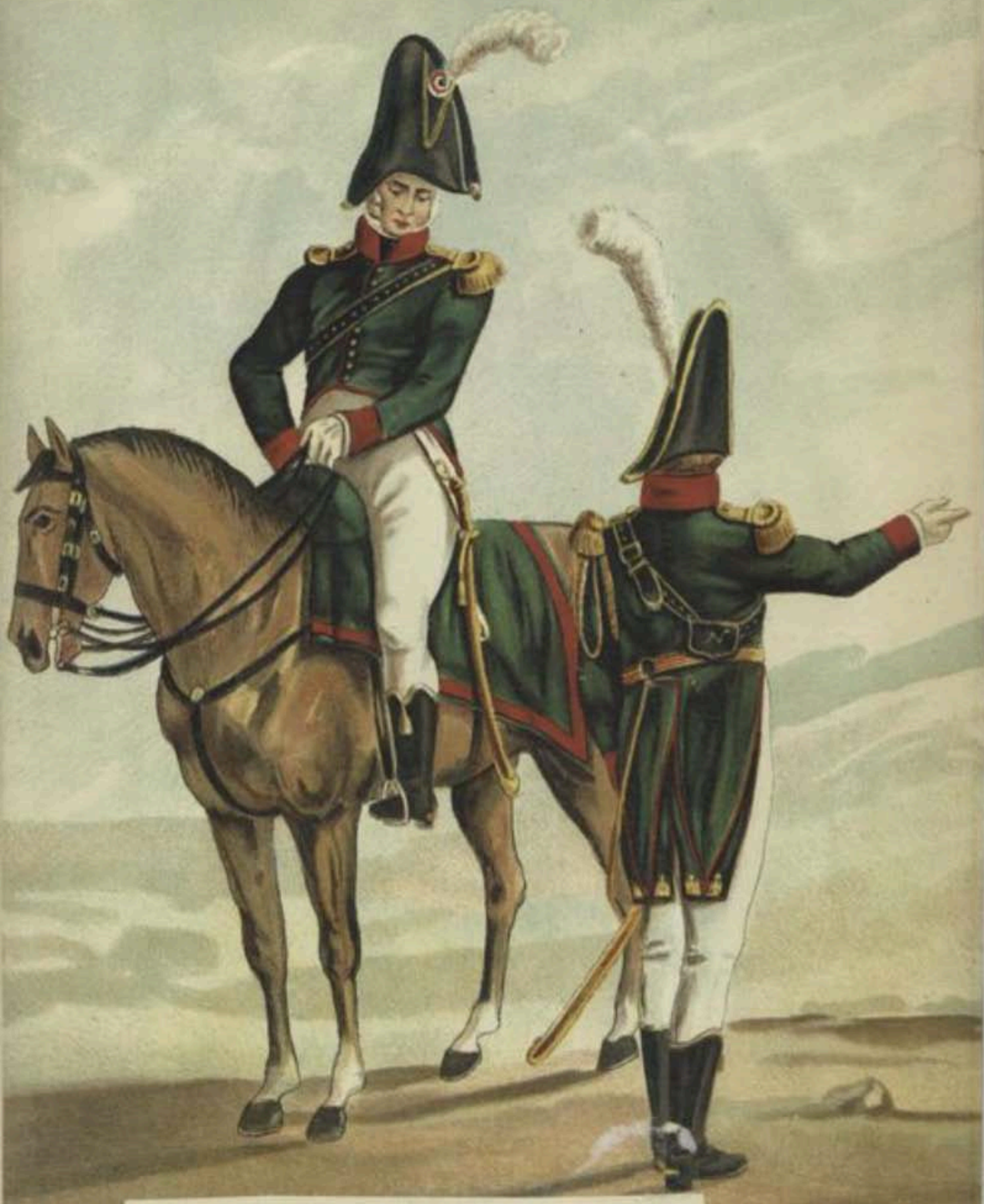
Garde d'honneur de Bruxelles lors de la visite de l'Empereur Napoléon I er , en 1810.