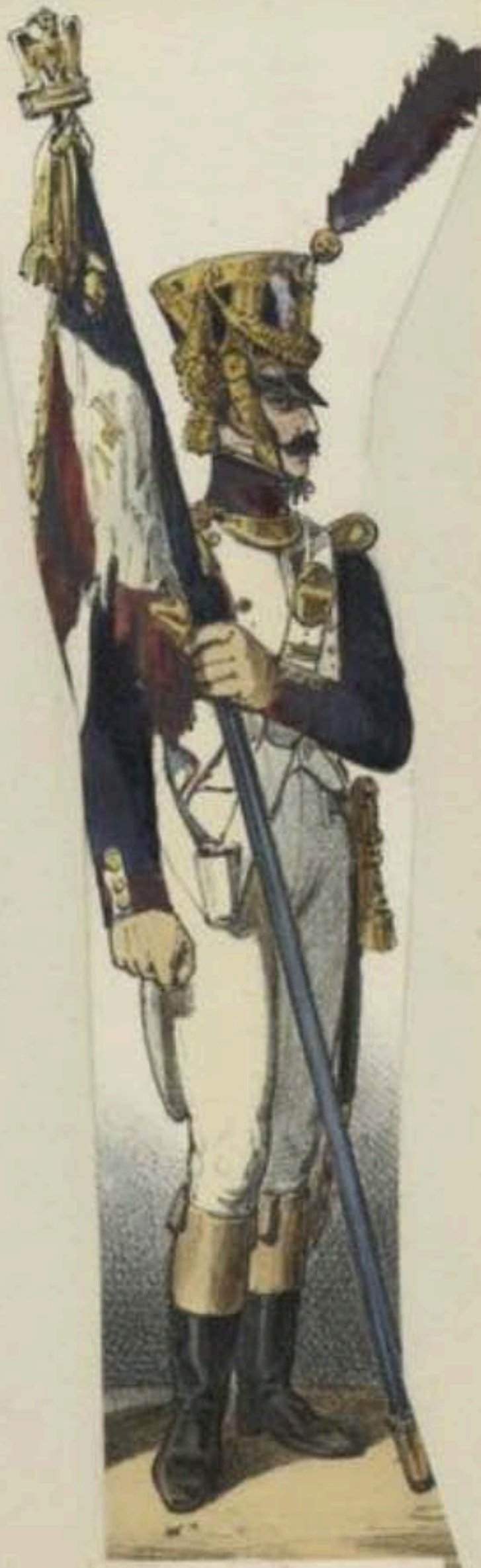
Empire. (Troupe de ligne.)