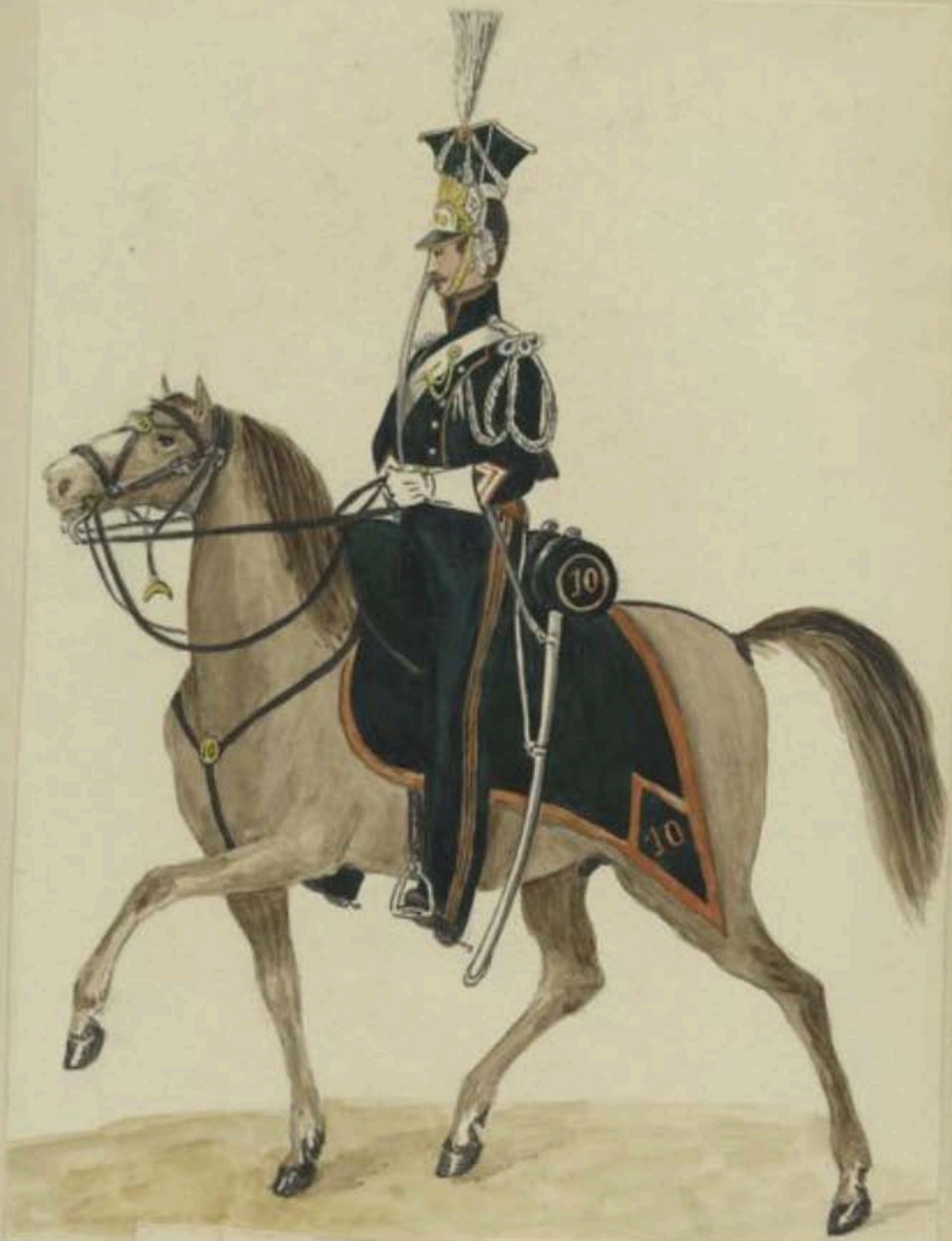
Lancier, Groupe Belge en 1828.