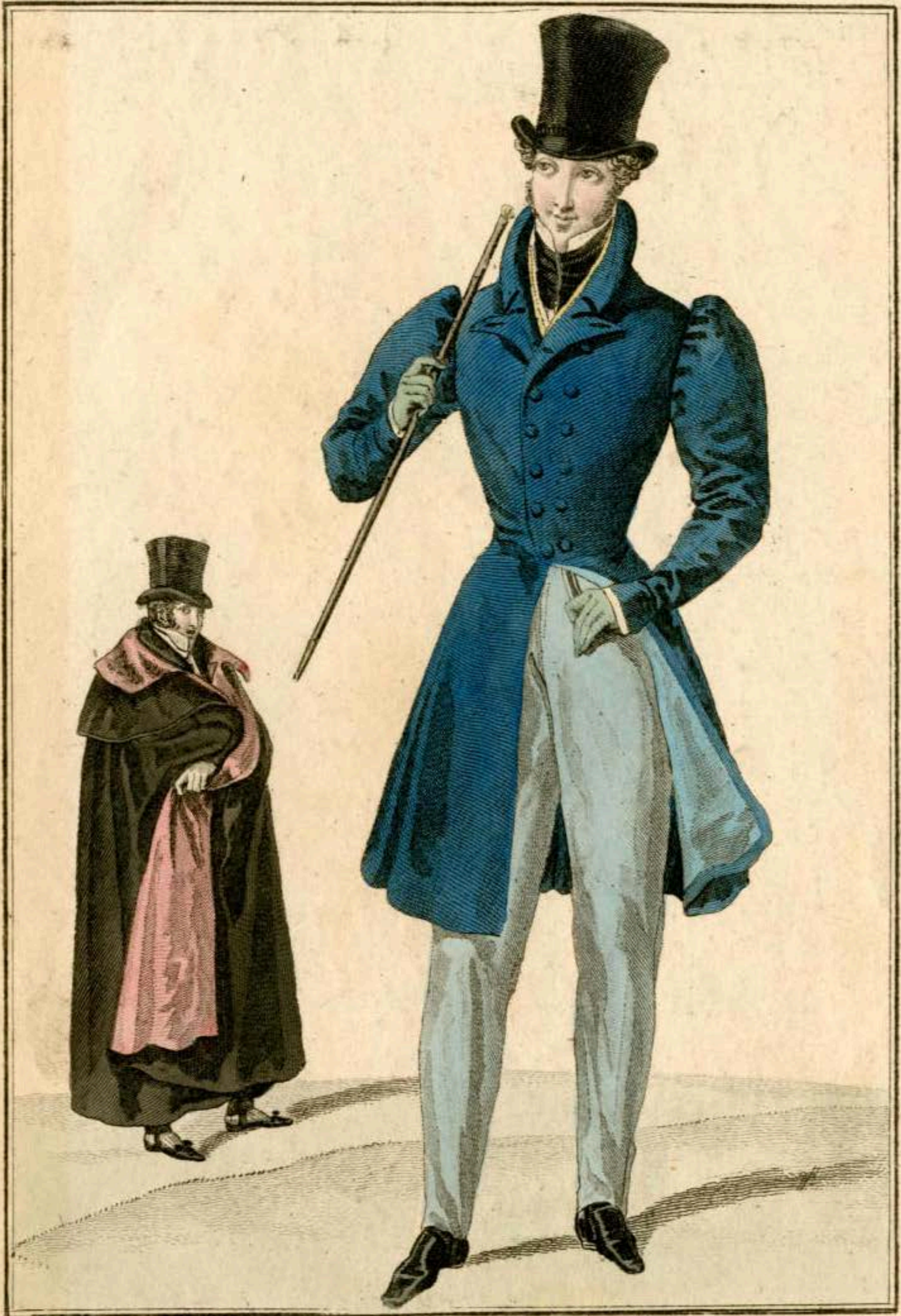
Redingote de drap garnie de boutons de soie. Pantalón de drap. Gilet de casimir imprimé. Col de maroquin. Canne de baleine. Manteau de drap doublé de pluche.