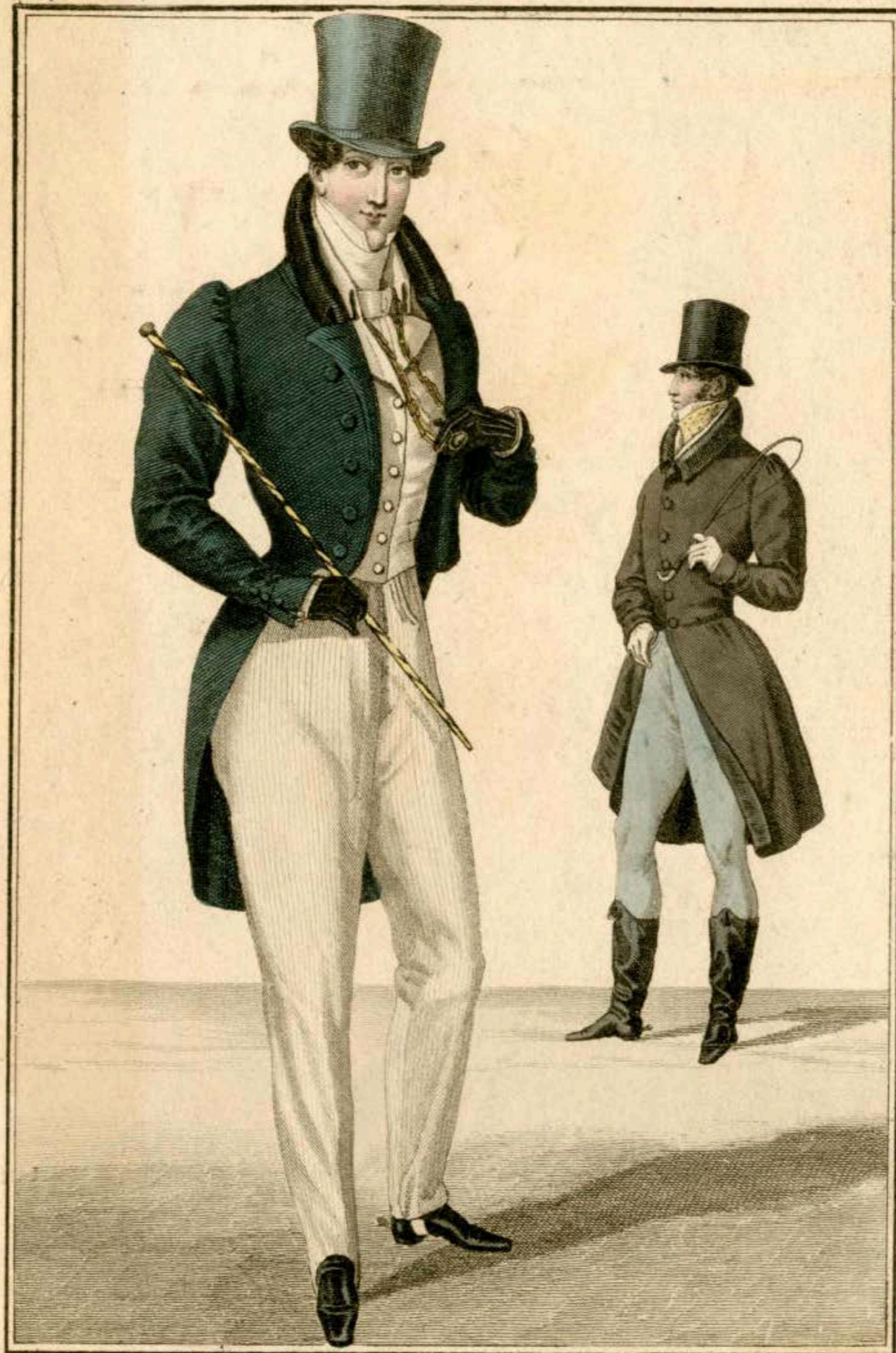
Chapeau de soie. Habit de drap à collet de velours et boutons de soie. Gilet de piqué. Pantalon de bazin. Canne rubannée. Chapeau de castor. Redingote de drap. Pantalon de tricot.