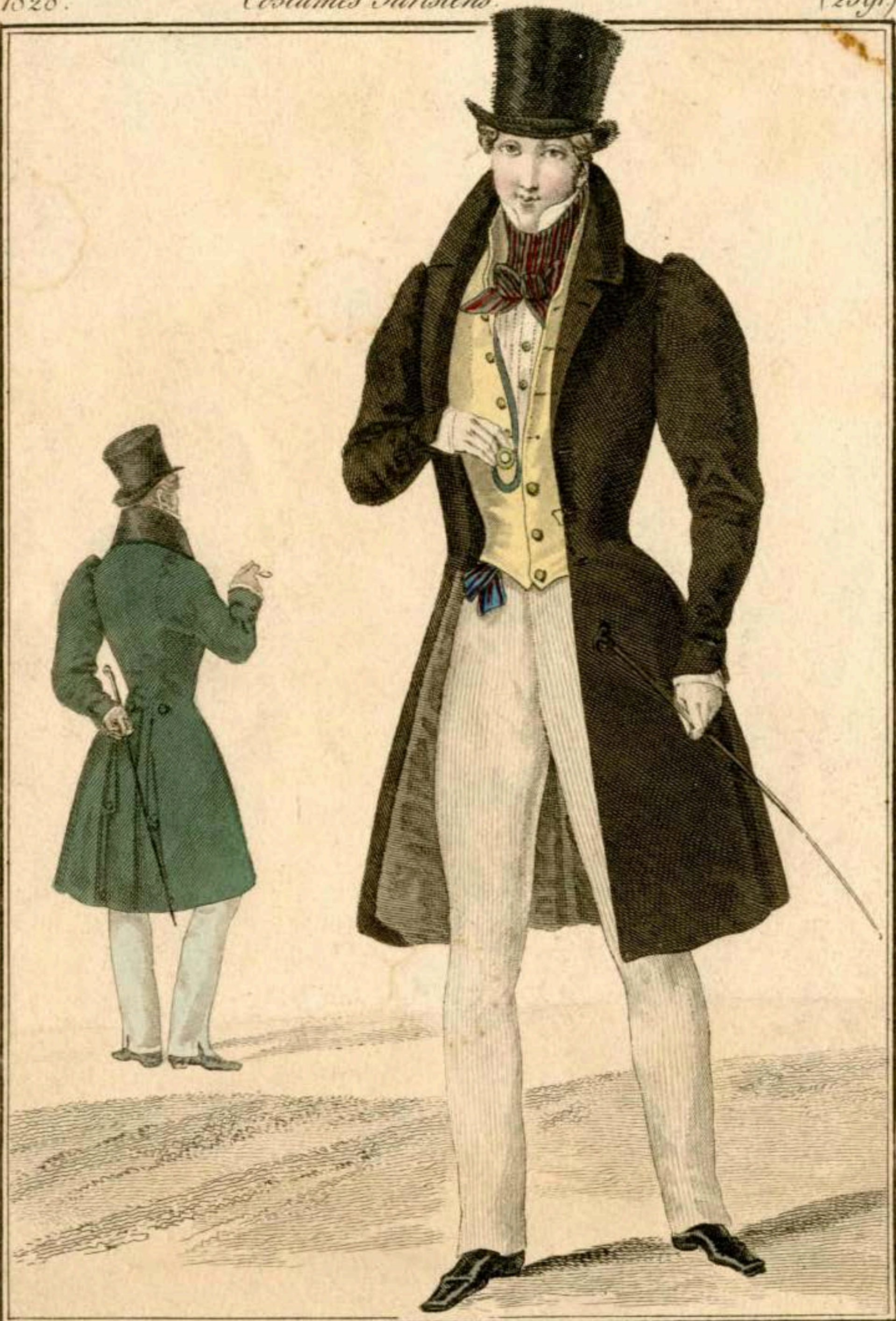
Longchamp. — Chapeau de castor. Redingote de drap. Gilet de poil de chèvre à boutons d'or. Pantalon de velours à côtes. Cravate de satin.