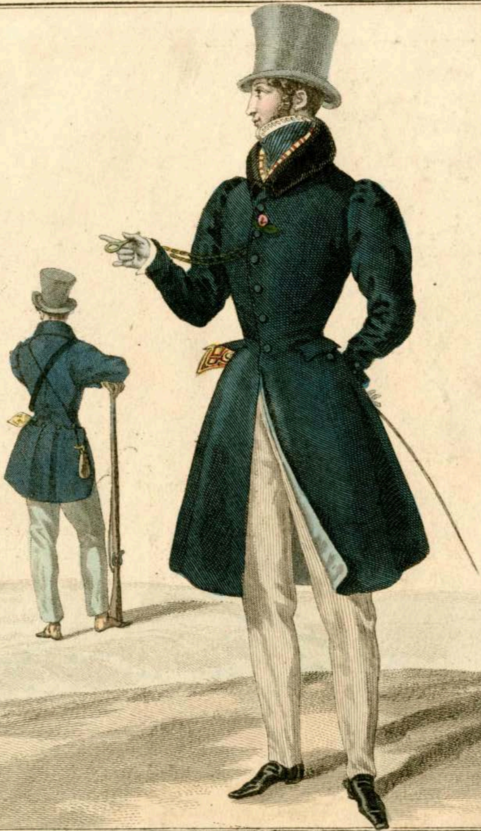
Chapeau de soie. Redingoté de drap à collet de velours garnie de boutons de métal. Pantalón de poil de chèvre. Veste de chasse.