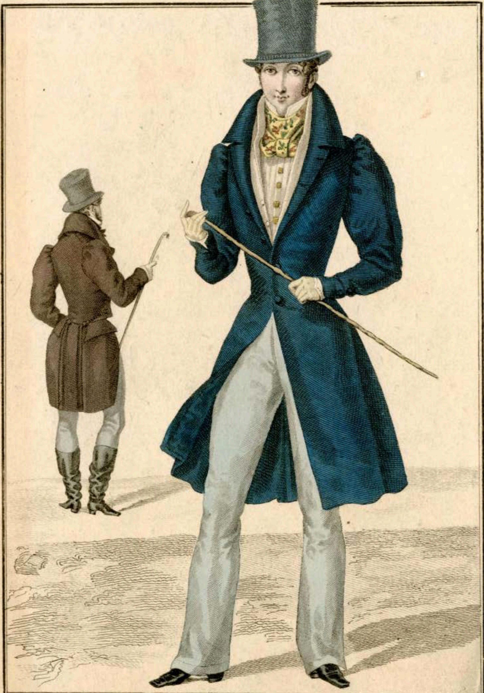
Chapeau de soie. Redingote de drap. Gilet de piqué. Pantalón de fil. Cravate de foulard. - Habit de drap. Pantalón de tricot. Bottes molles.