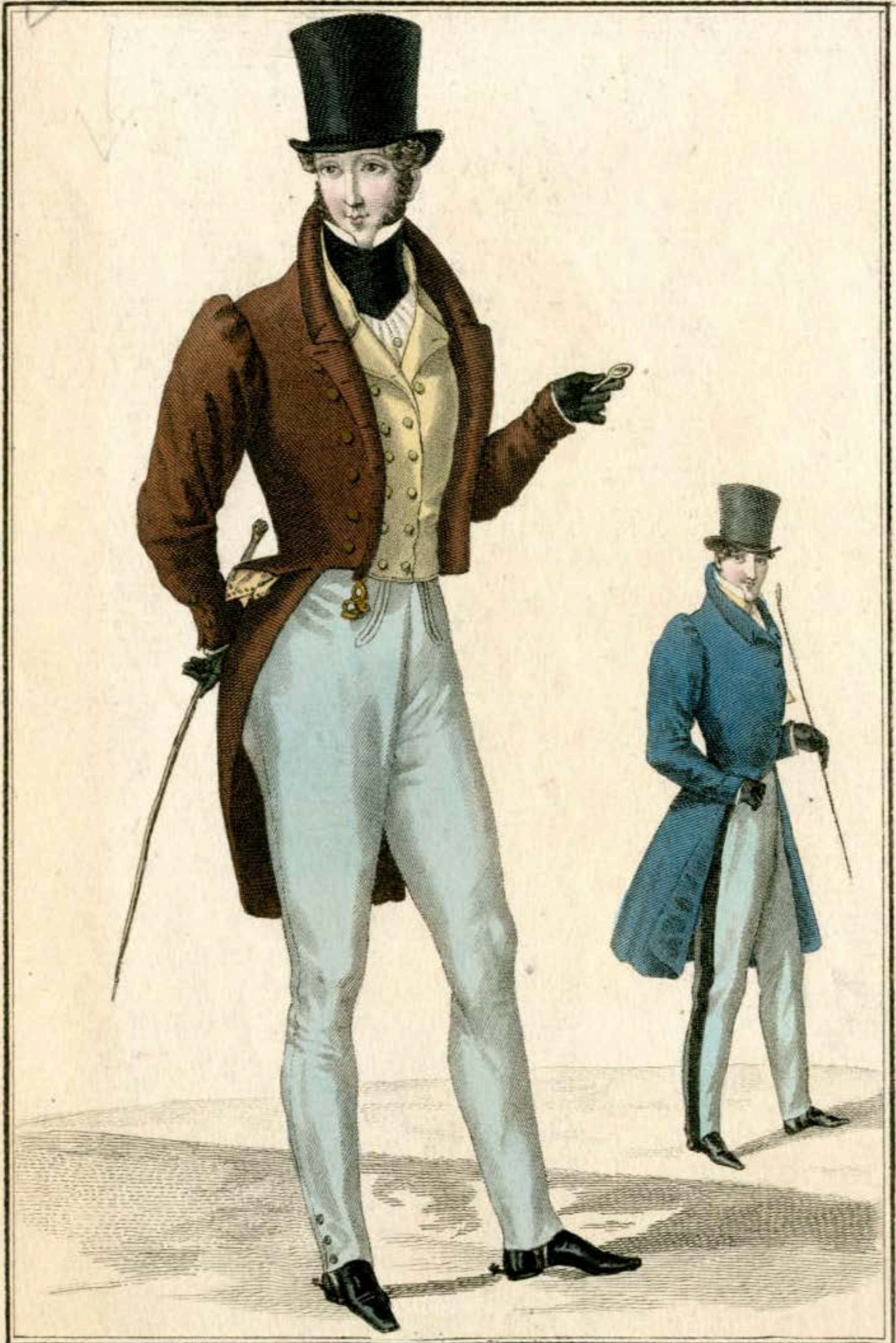
Costume de Longchamp. Habit de drap paille brûlé garni de boutons d'or mat. Gilet de casimir à boutons d'or. Pantalon de casimir. Redingote de drap bleu flore. Pantalon à bandes de velours.