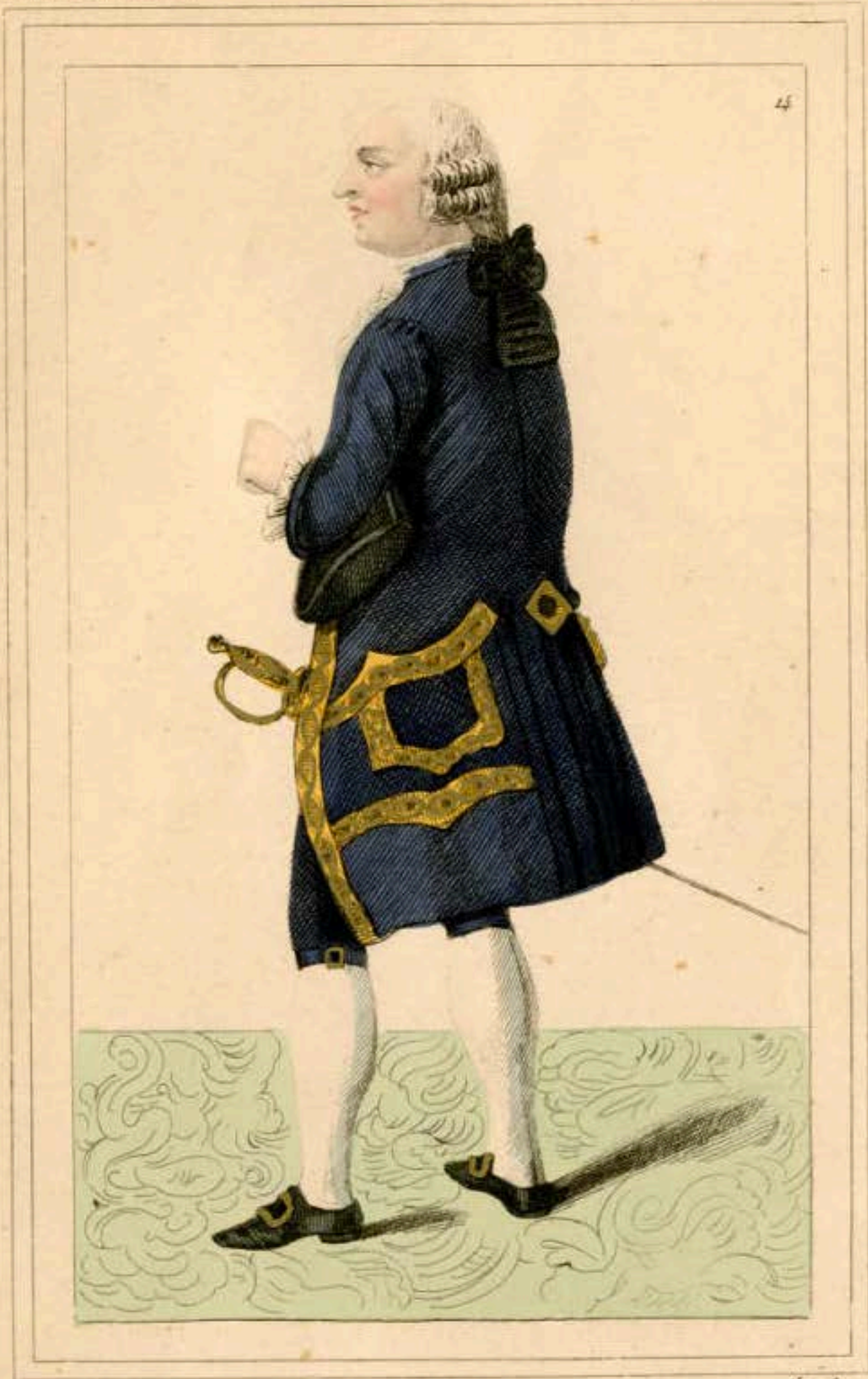
SEIGNEUR DE LA COUR DE LOUIS XVI.