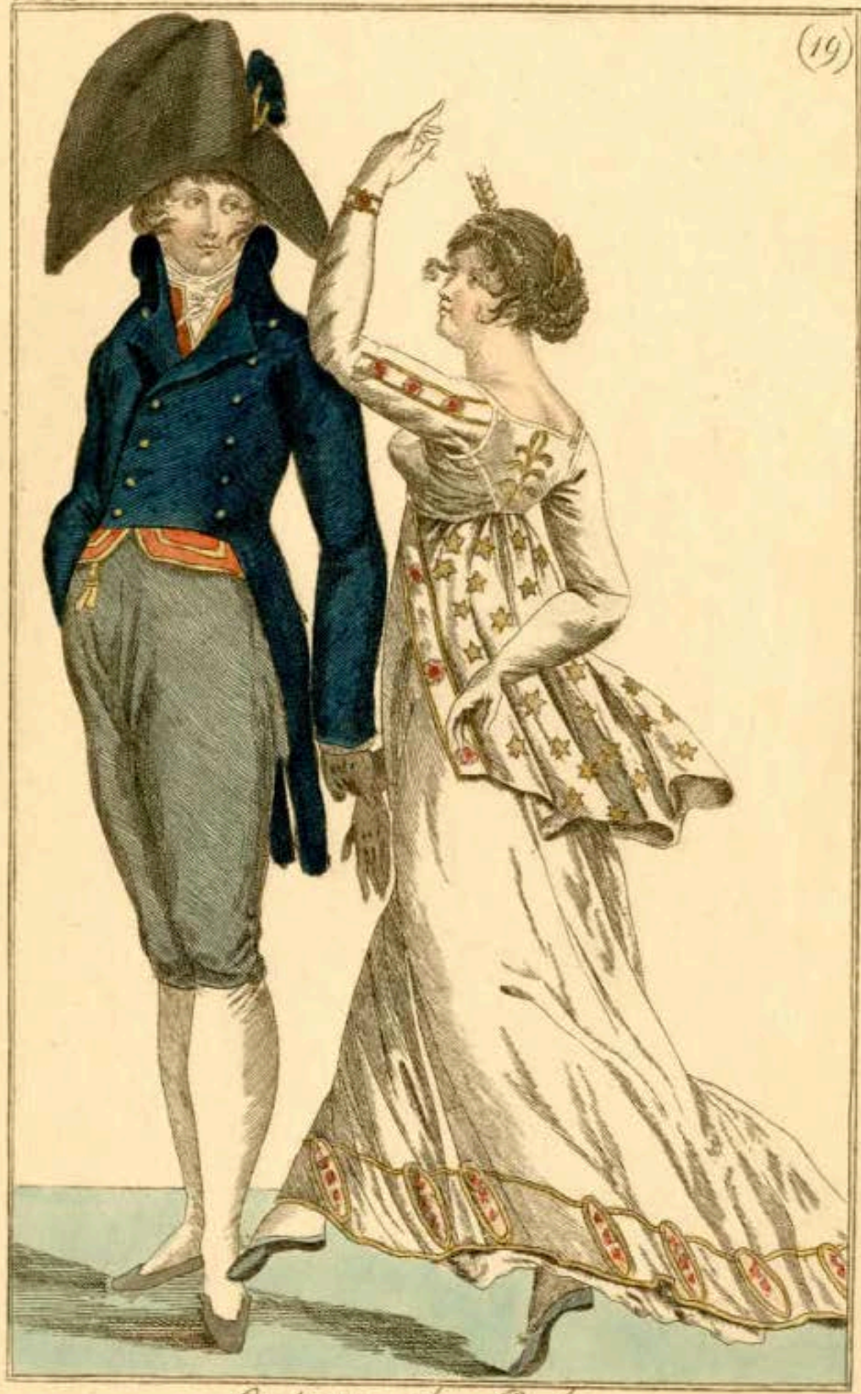
Costume de Bal.