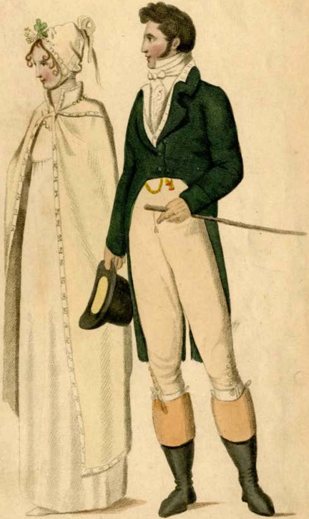
MORNING DRESSES for June 1807

Engraved & Coloured exclusively for Le Beau Monde & Library of Fashionable Magazines.