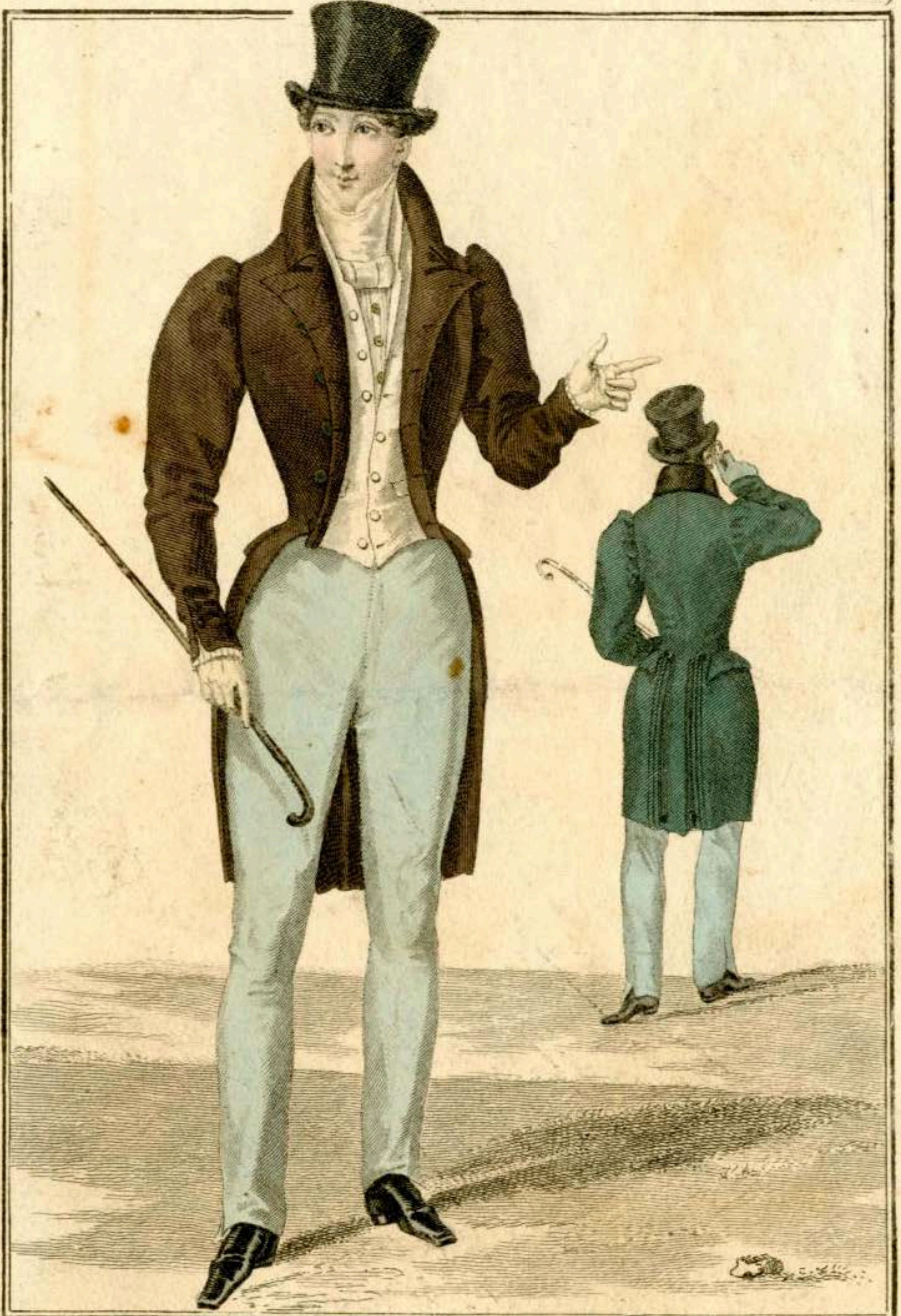
Chapeau de castor. Habit couleur fumée de Novarin garni de boutons d'acier et à basques plissées par derrière de chez M. Baillly, Rue Colbert, N° 2. Pantalón de castmir-mérinos, ouvert dans le milieu.