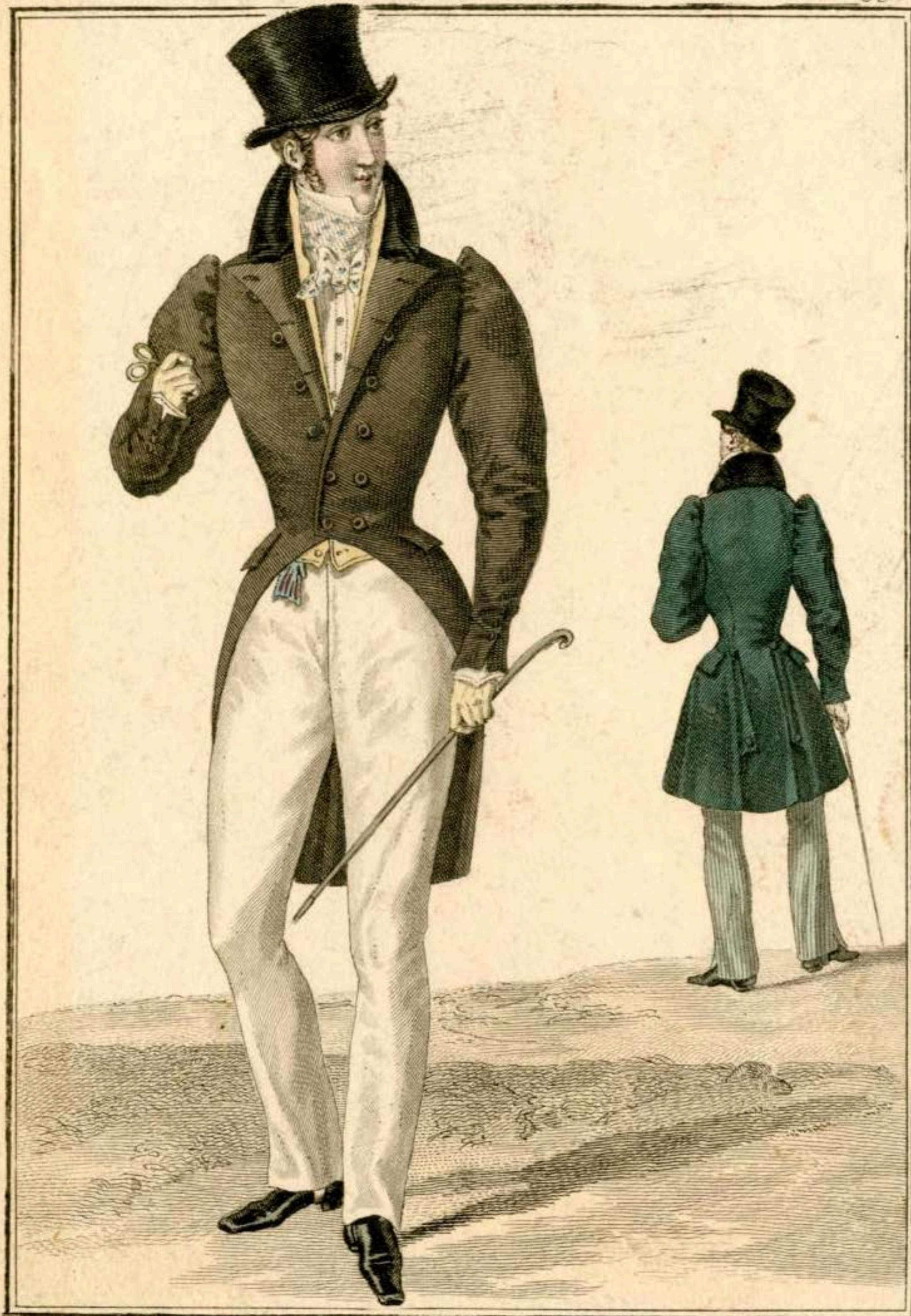
Habit dont le devant est coupé en biais, à collet de velours et à boutons d'acier par M. Bailly. Pantalon de baren anglais. Gilet de poil de chèvre - Redingote à poches sur les côtés.