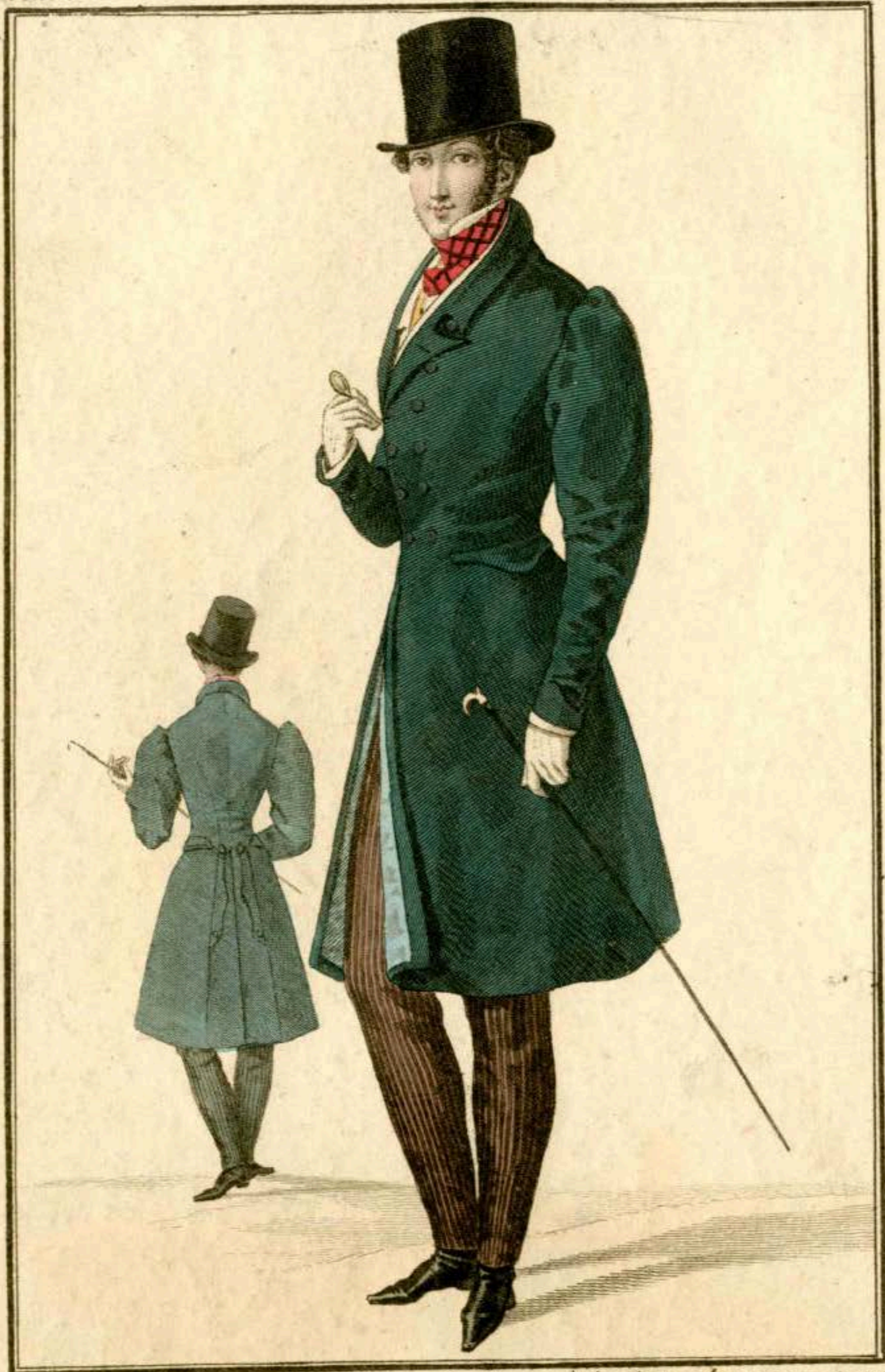
Redingote de drap toute plate par derrière et à boutons de nacre, par M. Barroux, Rue de Richelieu, N. 10. Pantalon de velours à côtes. Gilet de velours épinglé sur un gilet de velours plain.