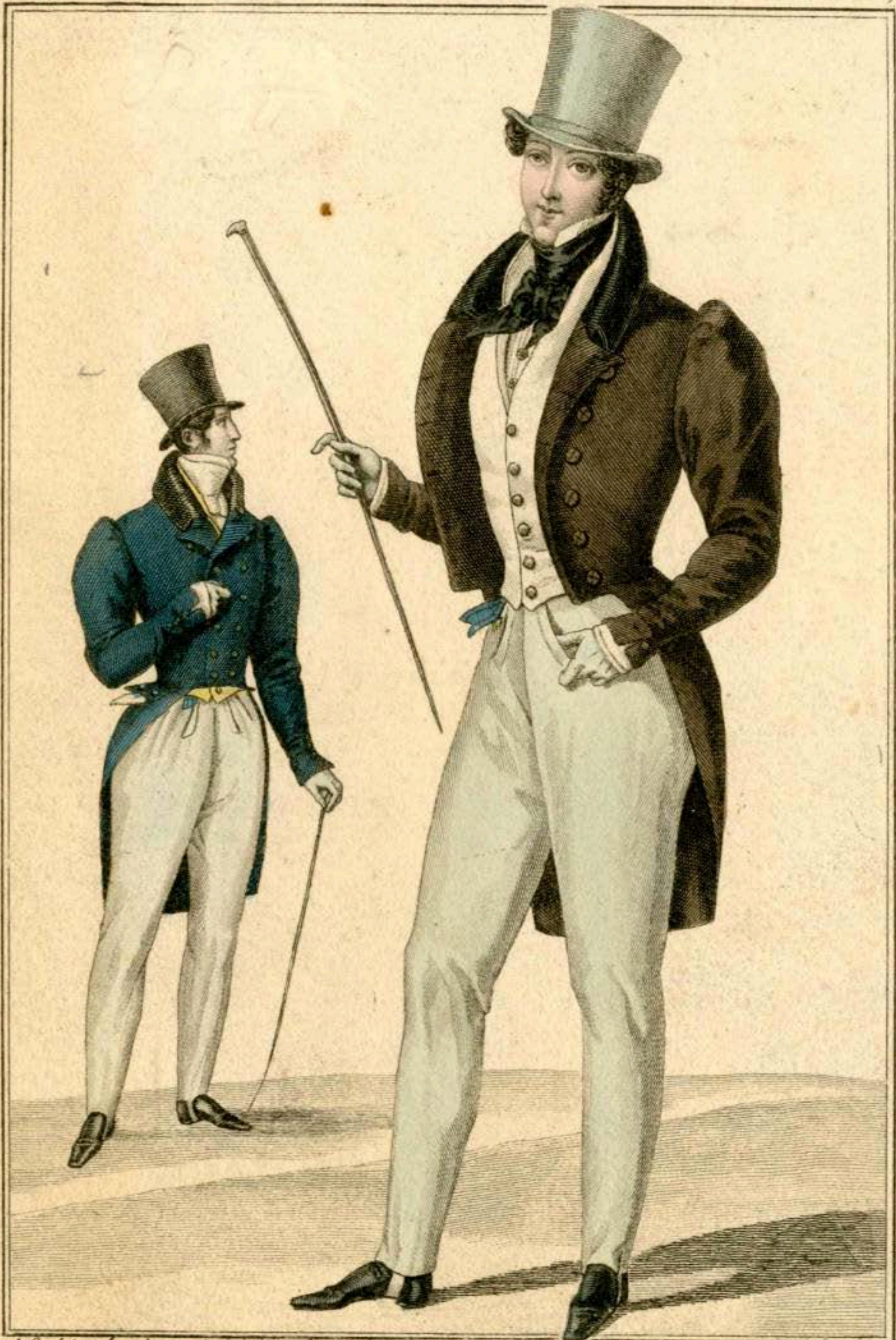
Habit de drap à collet de velours et boutons de soie. Gilet de piqué à boutons d'or. Cravate de soie. Pantalon de poil de chèvre. Habit à boutons ciselés et dorés. Gilet de poil de chèvre. Pantalon de casimir.