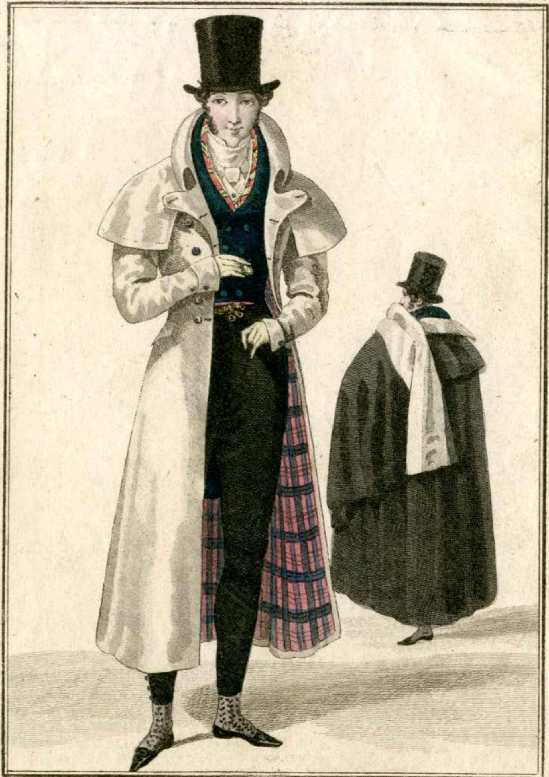
Redingote d'alpaga doublée en madras et garnie de boutons de nacre. Habit à boutons d'or. Gilet de velours écossais par dessus un gilet de piqué. Pantalon de tricot. Bas brodés.