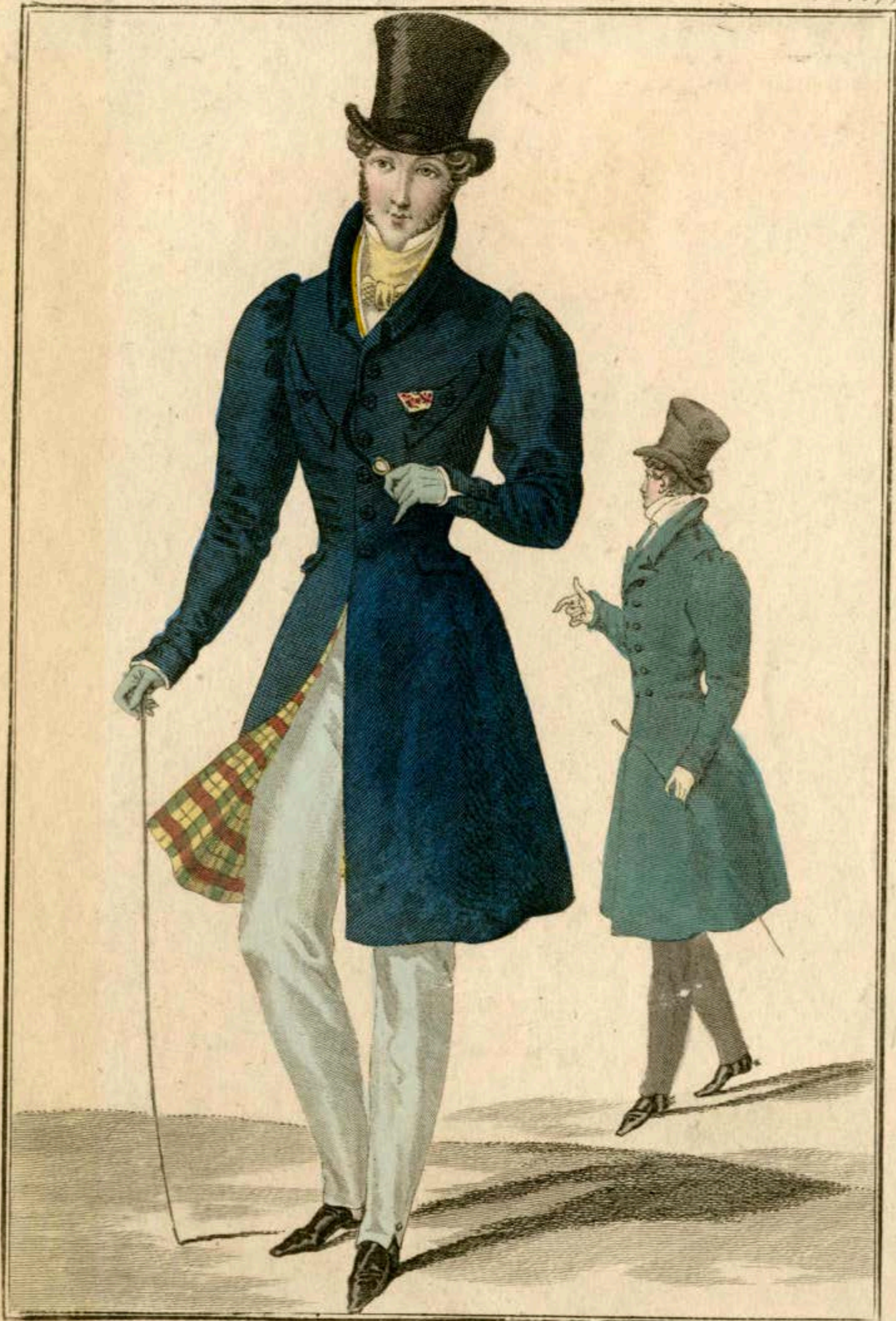
Chapeaux de castor. Redingotes de drap. Boutons imitant la soie de l'invention de M. Christophe fils, breveté, rue des Enfants rouges, N. 7. Pantalons de casimir.