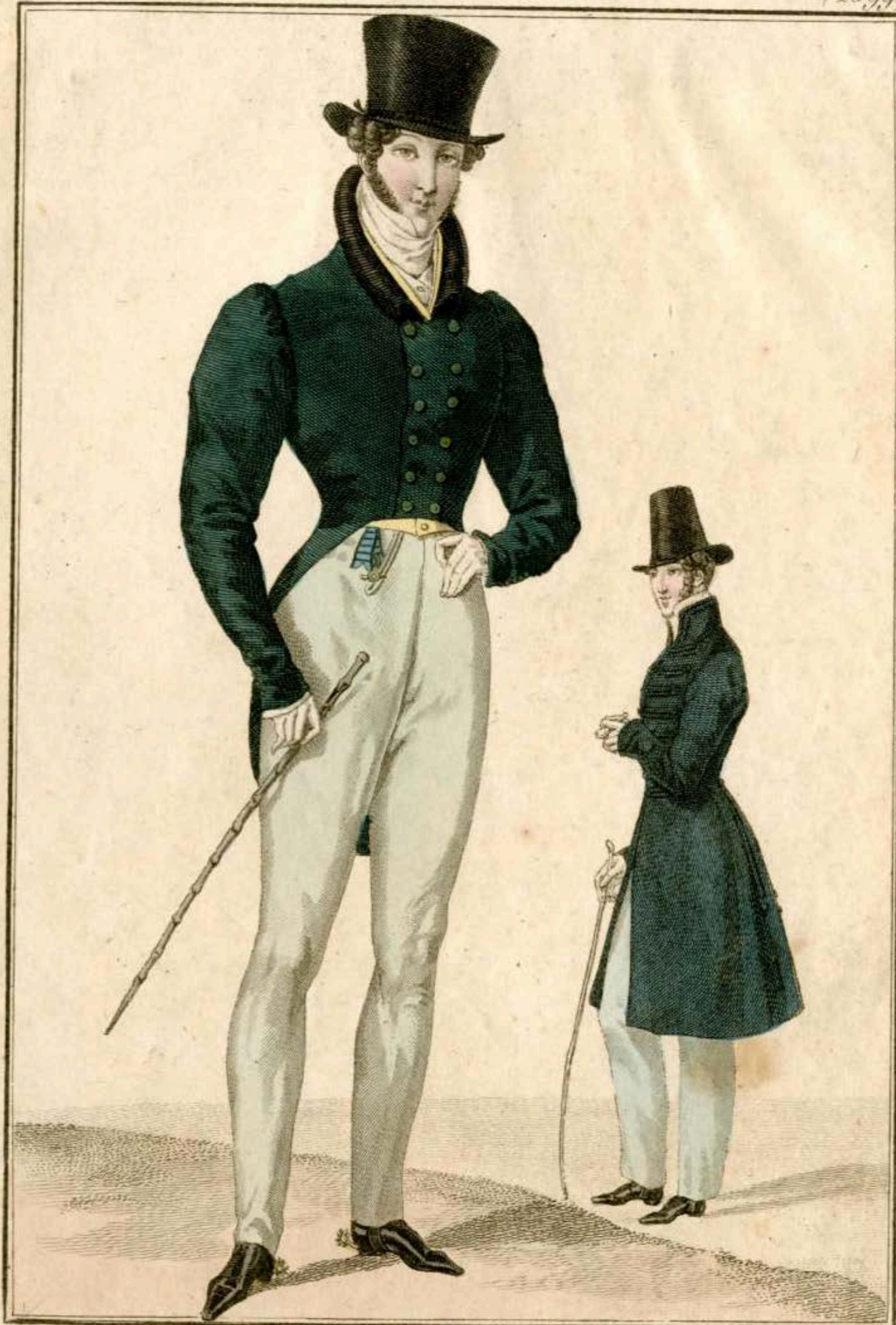
Costume pour monter à cheval. Chapeau de castor. Habit de drap à collet de velours et boutons bombés. Gilet de casimir. Pantalons de casimir. Redingote polonoise à brandebourgs et olives de soie. Pantalons de casimir.