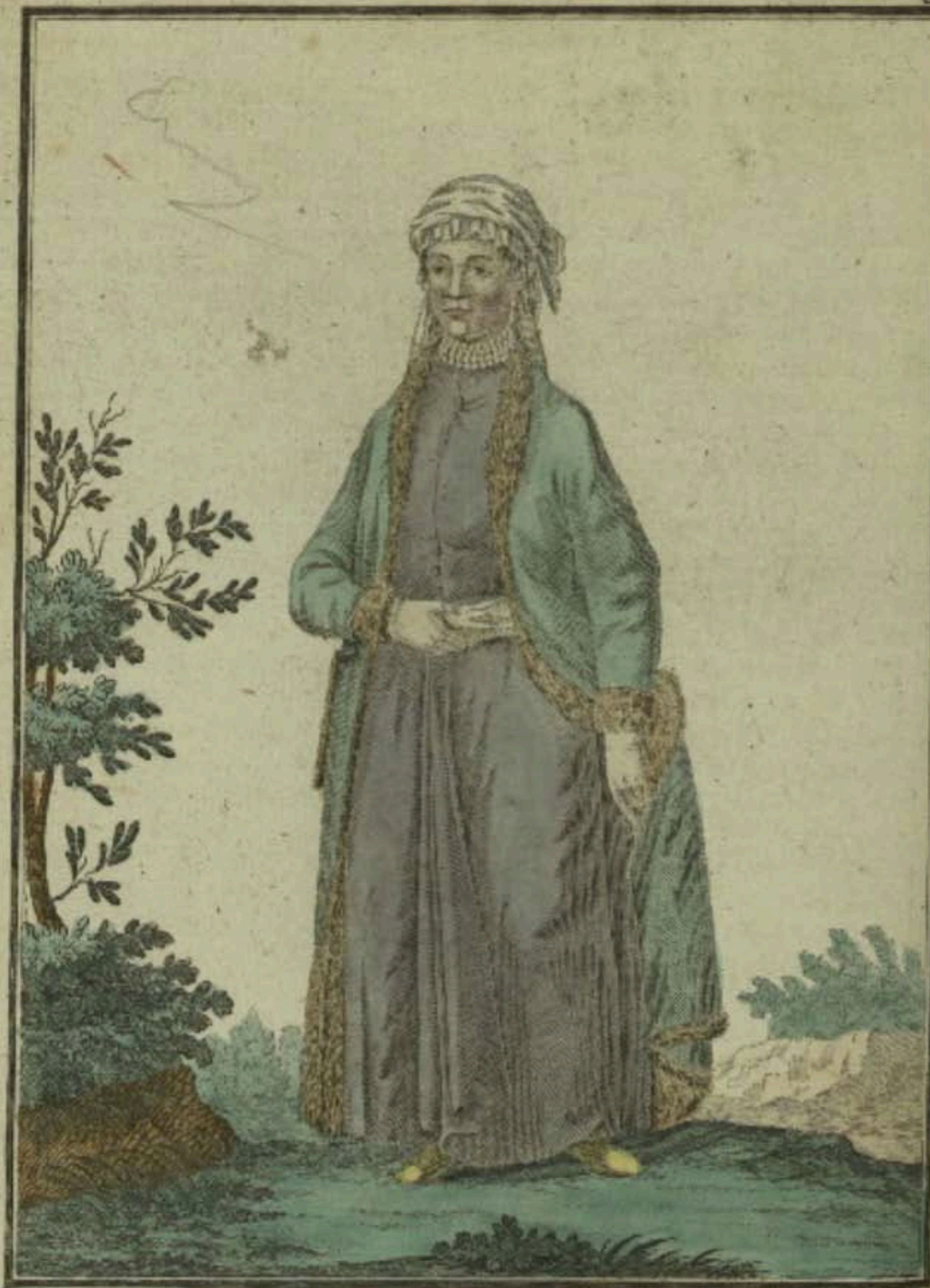
Армянка. Eine Armenianerin. Une Arménienne.