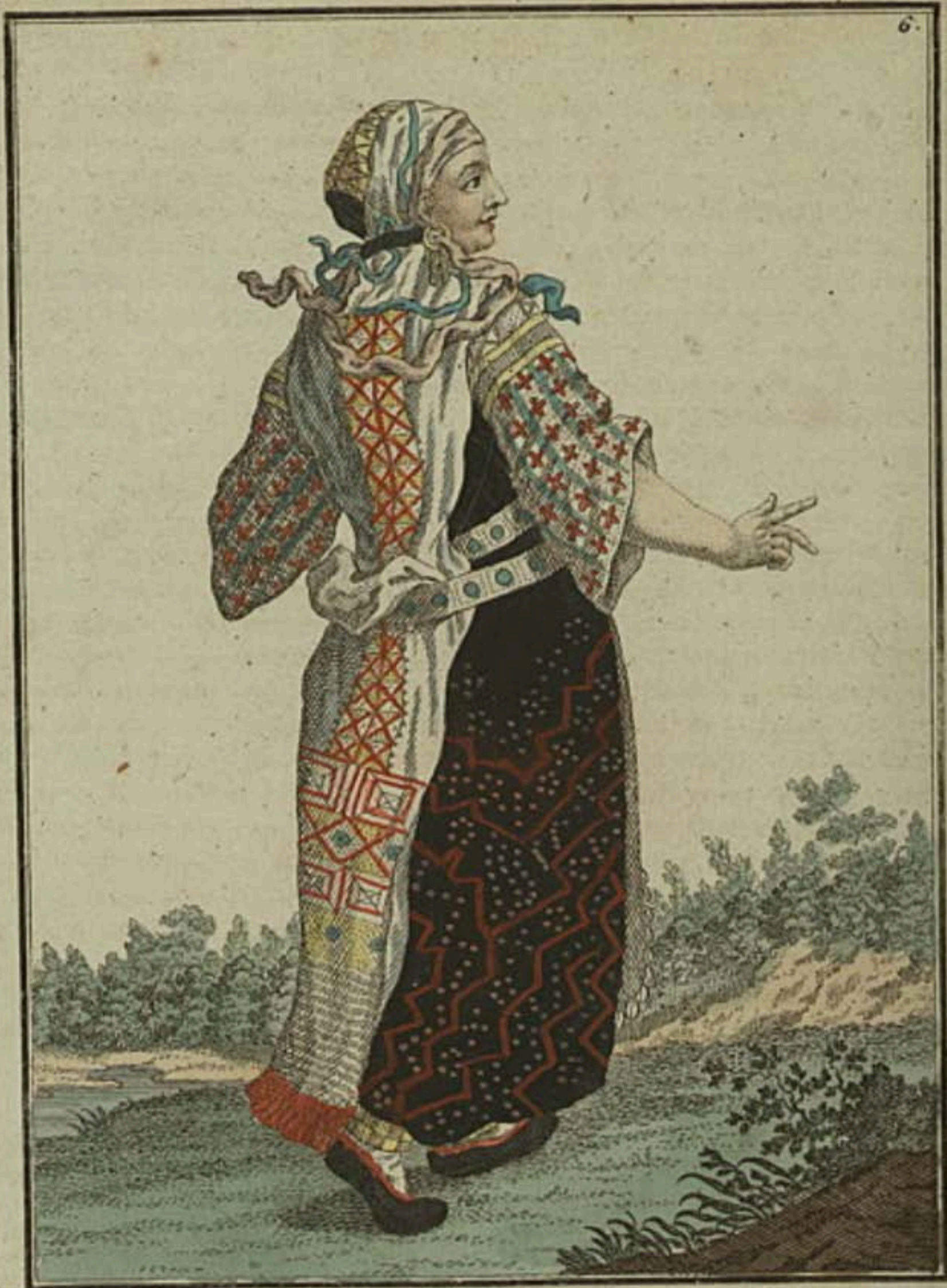
Чухонка въ уборномъ платьѣ со спины. Eine Sinnen im Feiertags-Kleide rückwärts. Feme sinoise dans son habit des fetes par derriere.