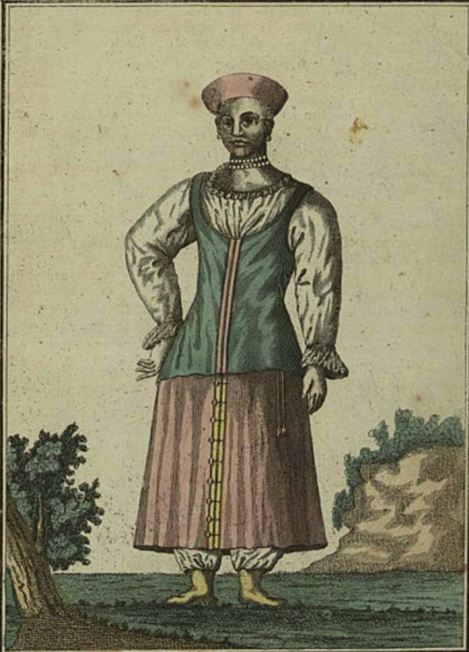
Донская Козарка. Eine Donische Cosacquin. Une Femme des Cosagues de Don.