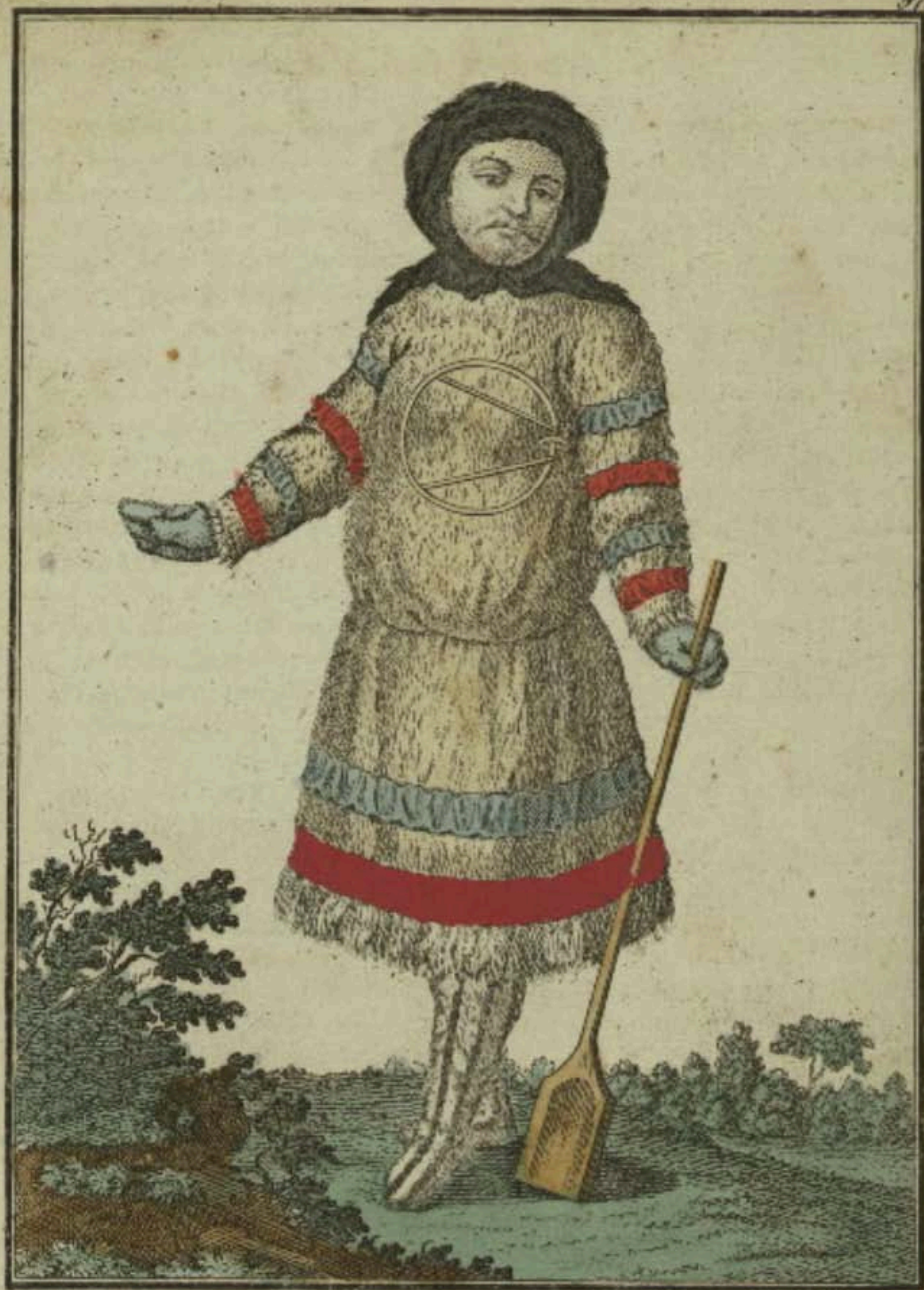
Самоядка спереди. Eine Samojedin vorwärts. Femme Samojede par devant.