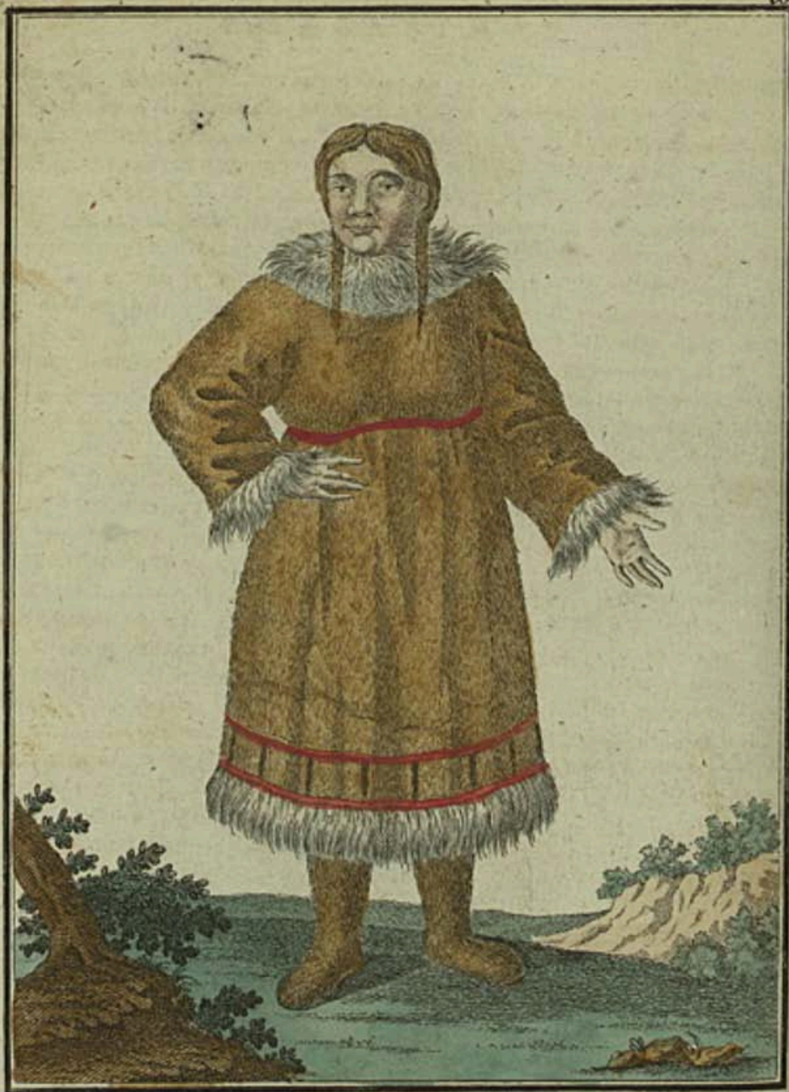
Камчадалка въ простомъ платьѣ. Eine Kamtschadalische Frau in gewöhnlicher Kleidung. Une Kamtschadale en habit ordinaire.