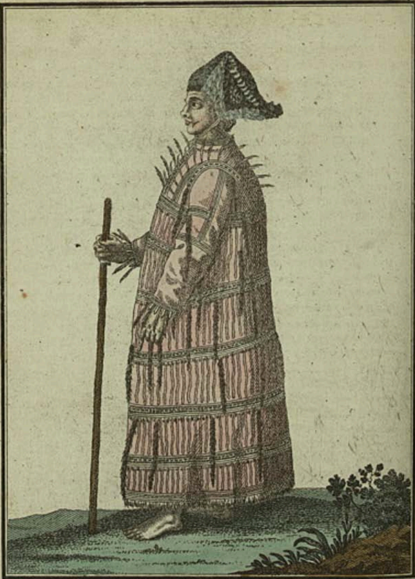
Алуты. . Ein Aleute. Aleutien.