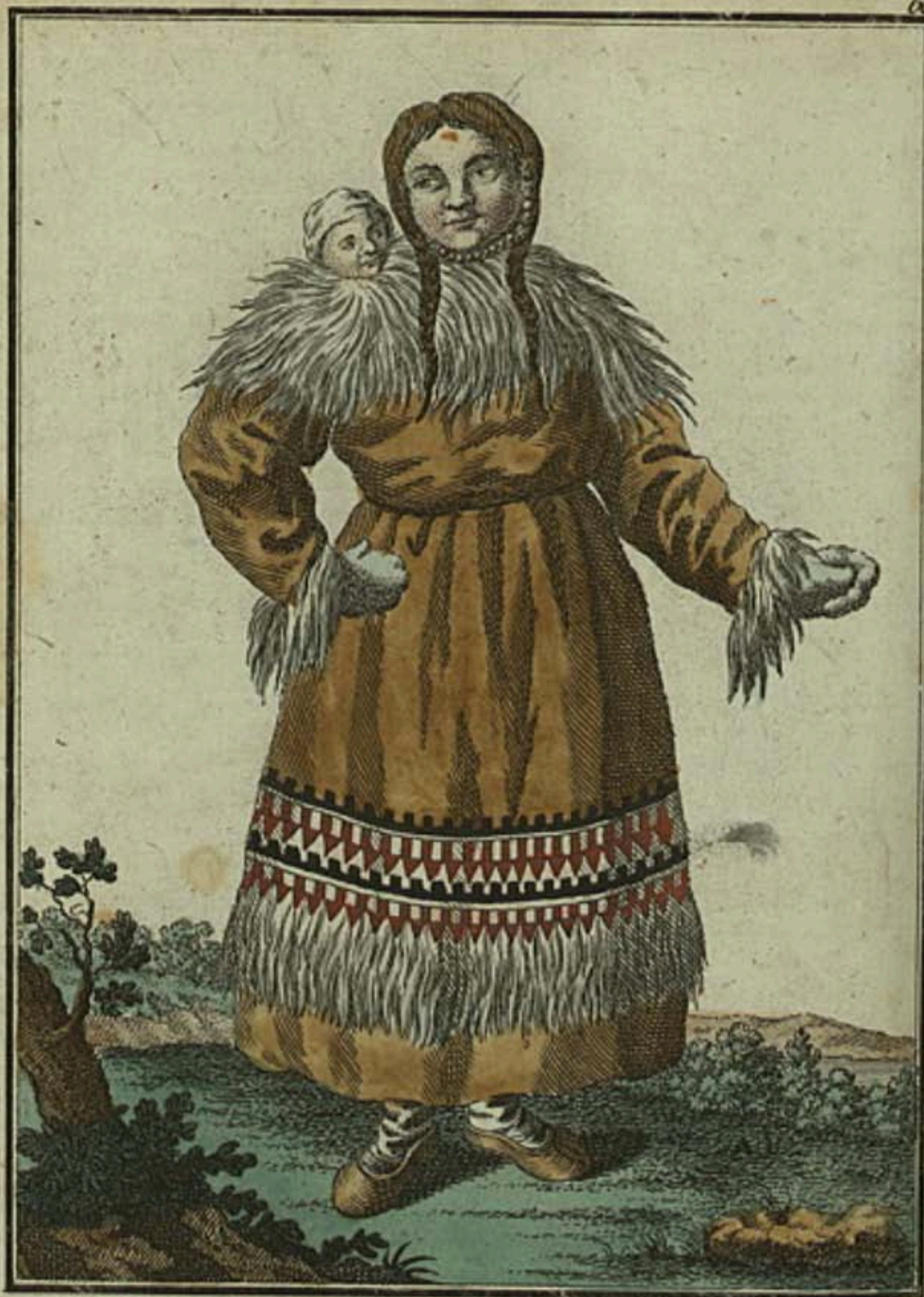
Камчадалка въ хорошемъ платьѣ. Eine Kamtschadalische Frau zierlich gekleidet. Une Kamtschadale en habit de fête.