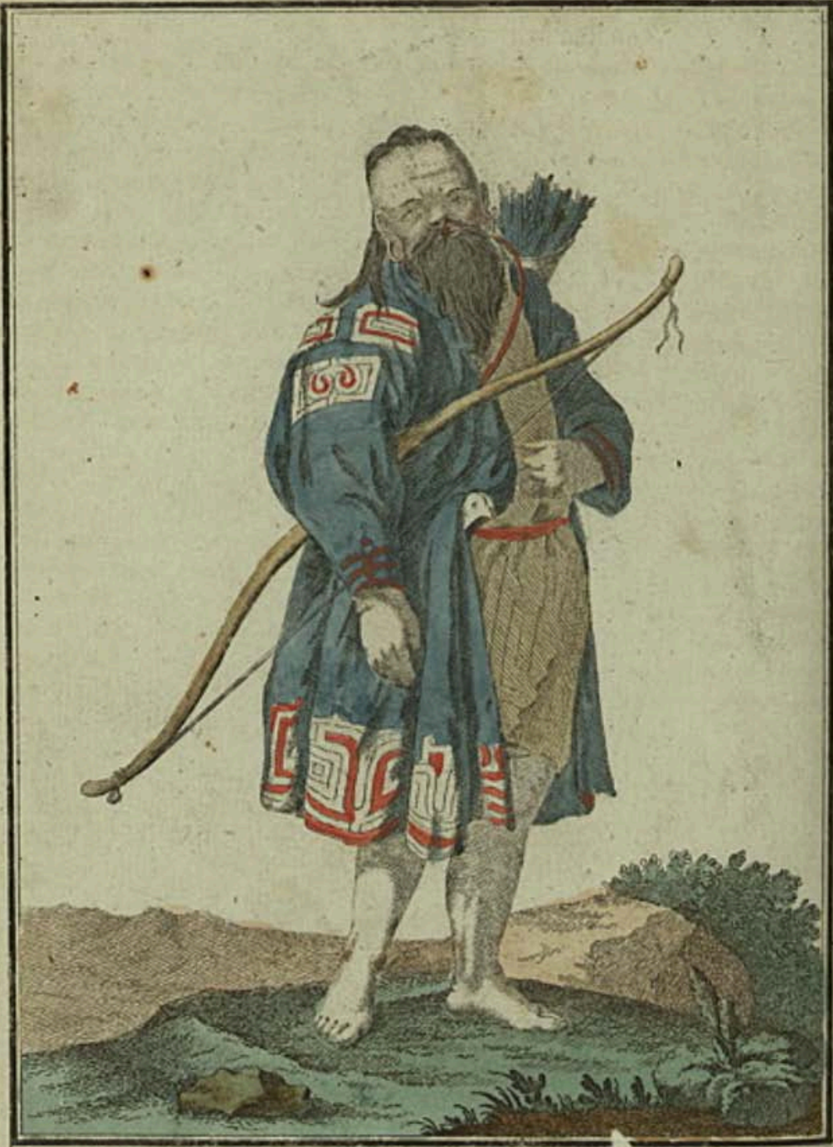
Курилецъ. Ein Kurill. Kourilien.