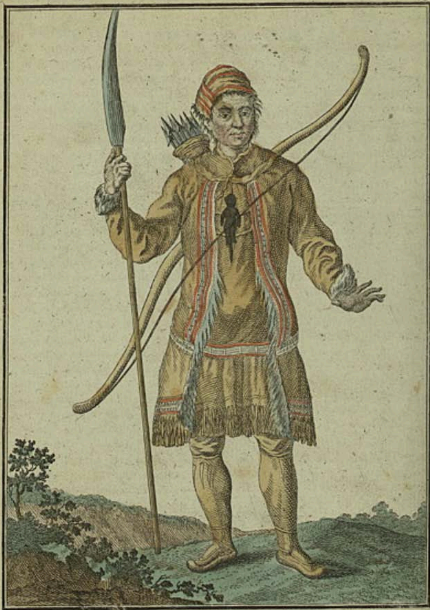
Мунззб на охотѣ. Ein Tungus im Jagd-Kleid. Un Toungouse en habit de chasse.