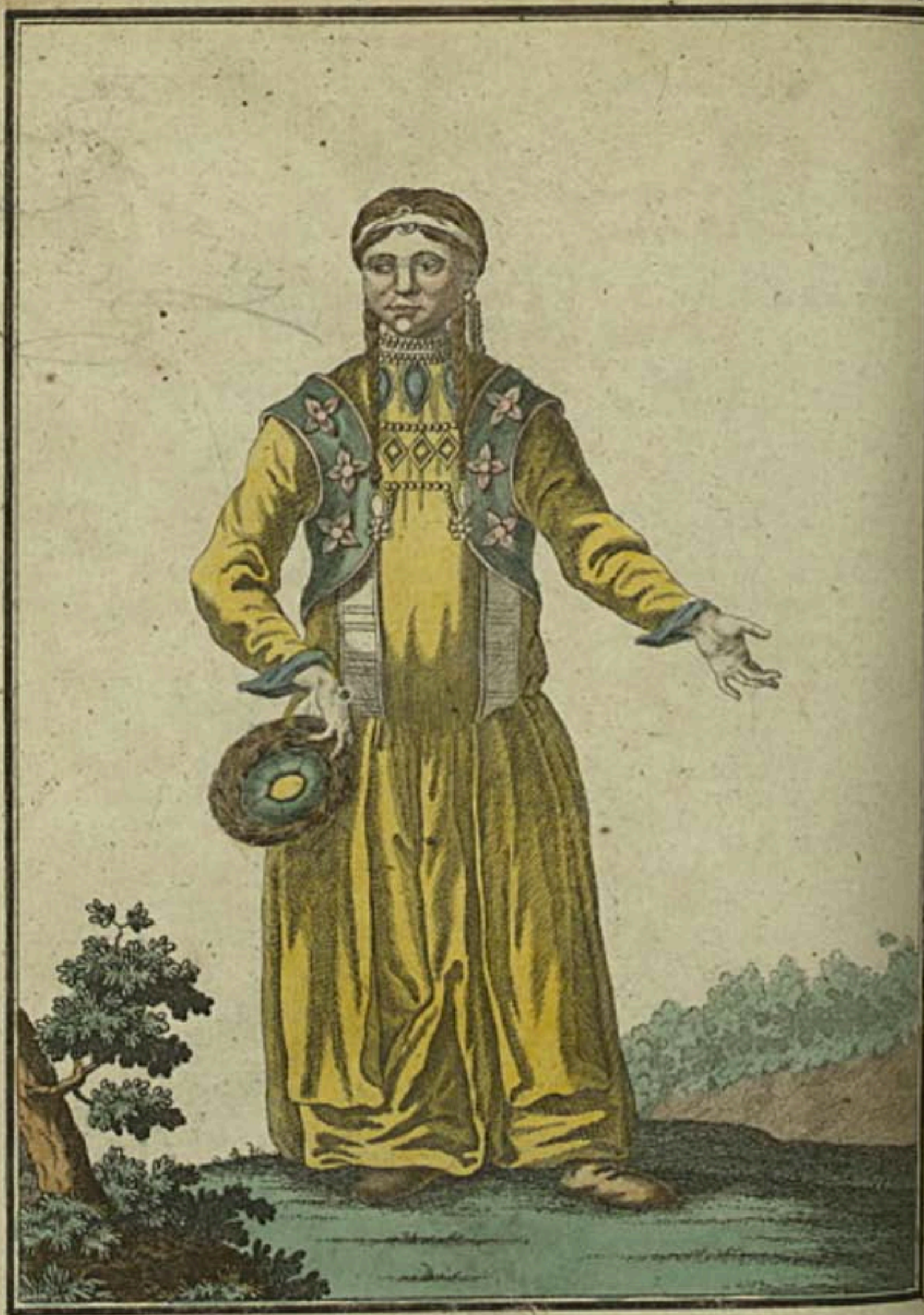
Брацкая Баба въ удинскомъ Острогѣ съ лица. Ein Bratzkisches Weib zu Uldinskoi Ostrog vorwärts. Femme Bratzquienne à Uldinskoi Ostrog par devant.