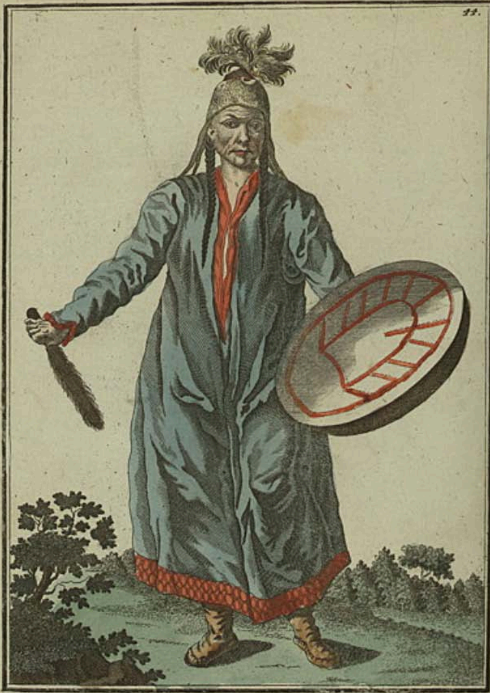
Шаманка въ красноярскомъ ѡбздѣ. Eine Schamanka im Krasnojarskischen District. Une Chamanne ou Devineresse du district de Krasnojarsk.