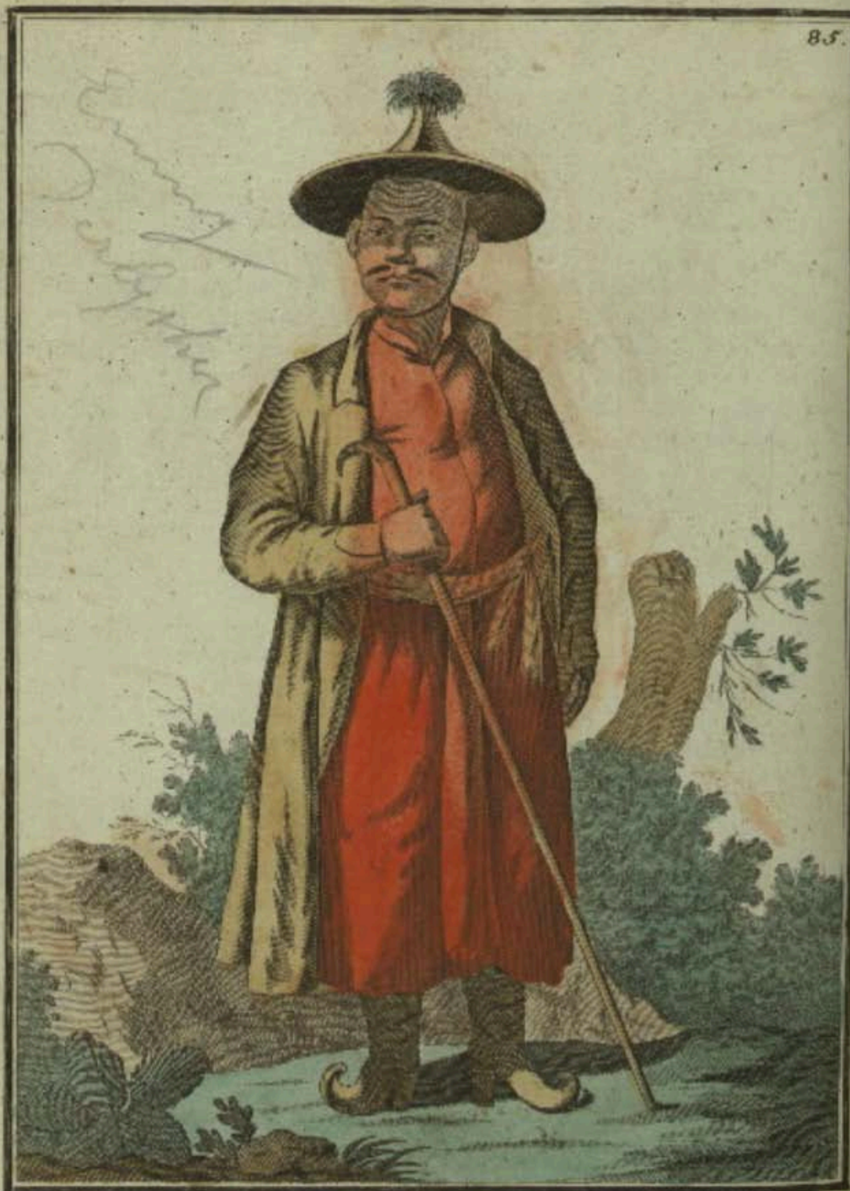
Монгольскій Лама или Духовный. Ein Mongolischer Lama od. Geistlicher. Lama, ou Prêtre Mongol.