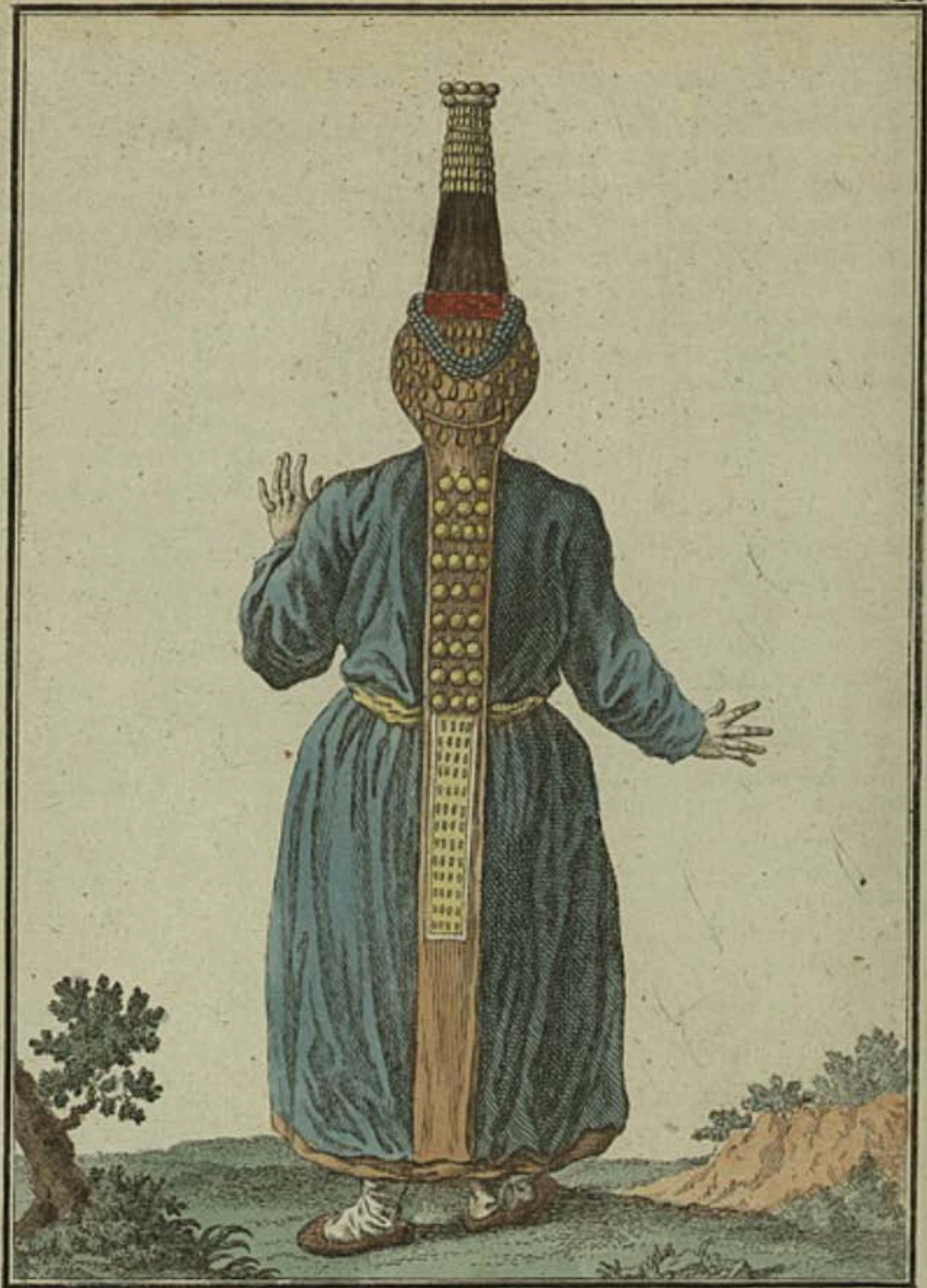
Черемиска сзади. Eine Tcheremisin rückwärts. Femme Tcheremise par derriere.