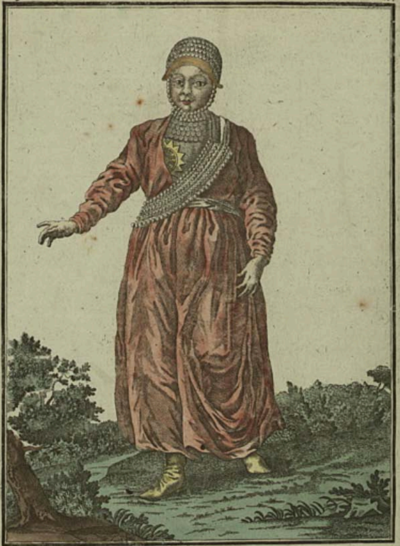
Tamarka Kazanckaja cnepeu. Eine Kasansische Tatarin vorwärts. Femme Tattare de Casan par devant.