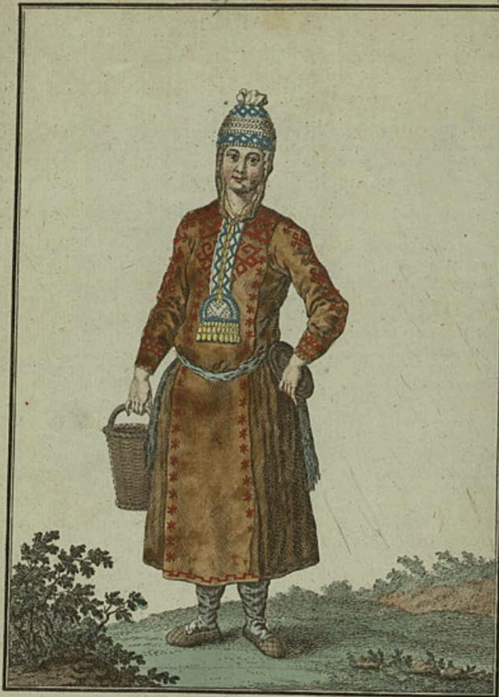
Чувашанка спереди. Eine Tschuwaschin vorwärts. Une Tchouwachaine par devant.