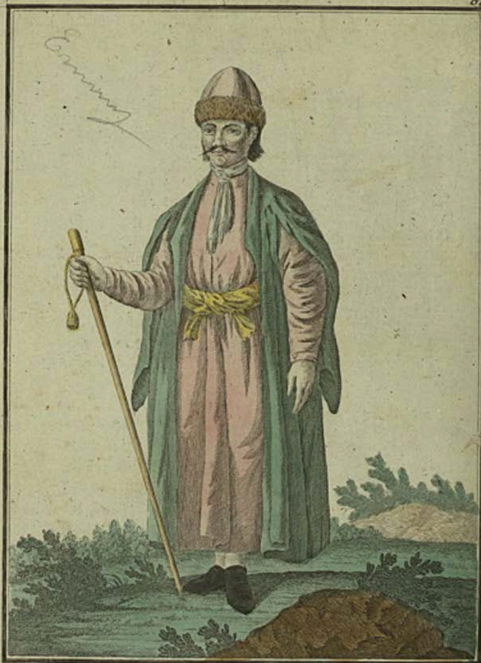
Арменитъ. Ein Armeniäner. In Armenien.