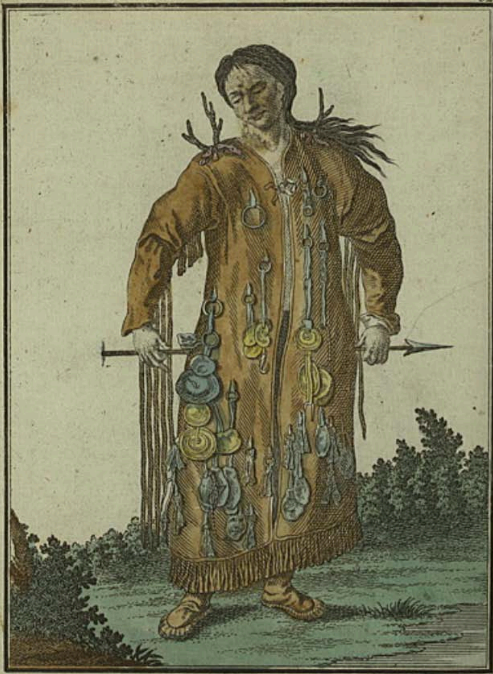
Тунгуской Шаманъ при рѣкѣ Аржунѣ съ лица. Ein Tungusischer Schaman am Argun Fluss vorwärts. Devin tounquoise auprès de l'Argoun par devant.