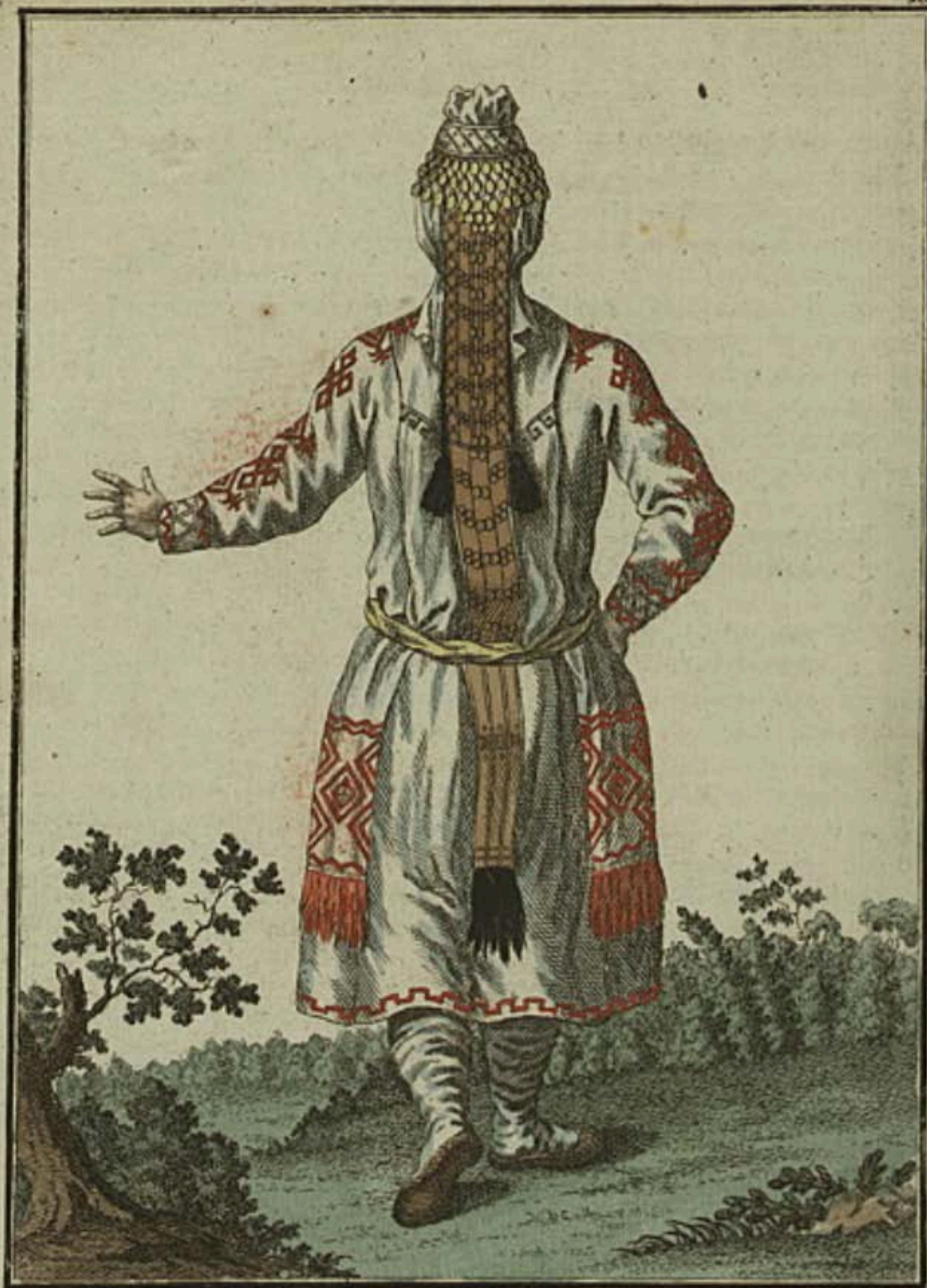
Чувашанка въ Лѣтнѣмъ платьѣ. Eine Tschuwaschin im Sommer Kleide. Une Tchowache en habit d'été.