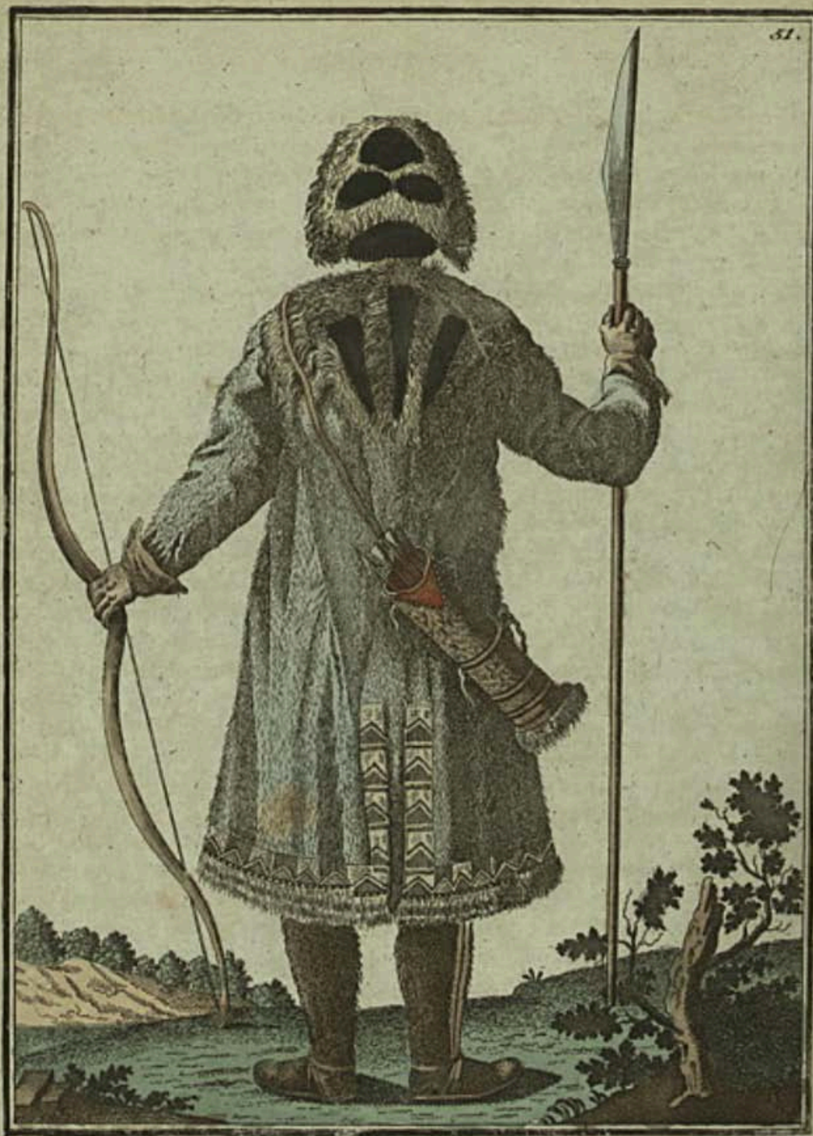
Якутъ въ охотѣмъ плащъ сзади. Ein Jakut im Jagd Kleid von hinten. Un Jakout en habit de chasse par derrière.