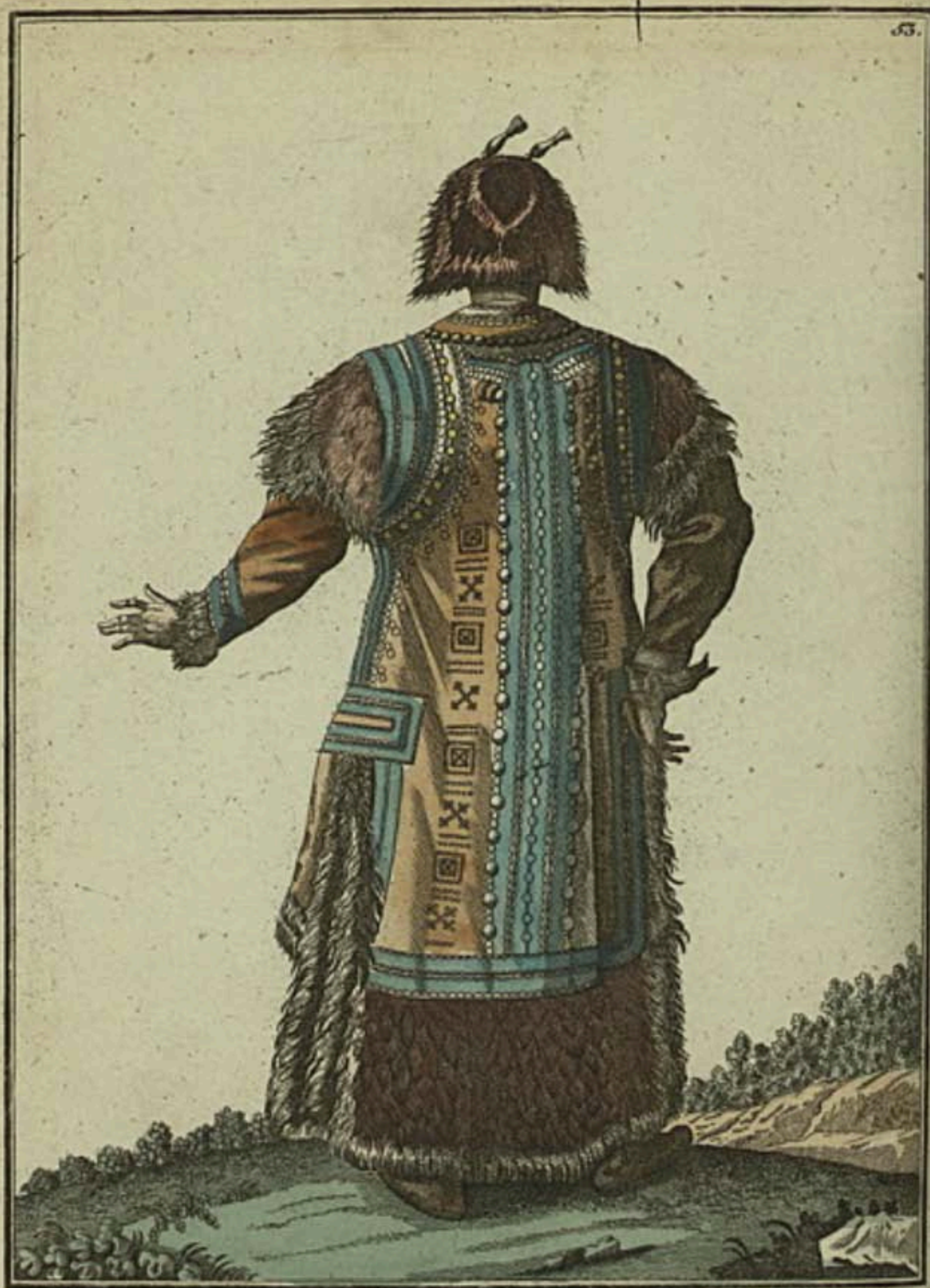
Якутская баба сзади . Eine Tackutin rückwärts : , Femme Yakoute par derriere :