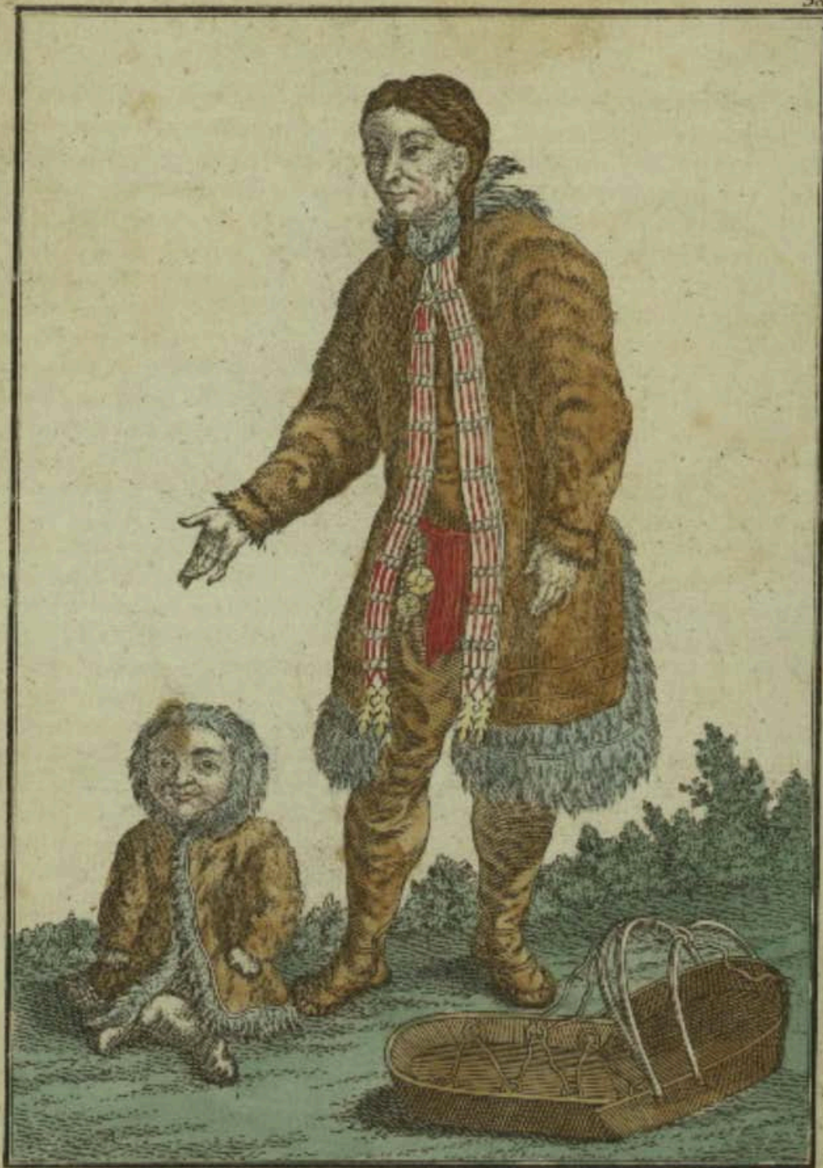
Самоедка въ лѣтнемъ платьѣ. Eine Samojedin im Sommer-Kleid. Femme Samojede en habit d'été.