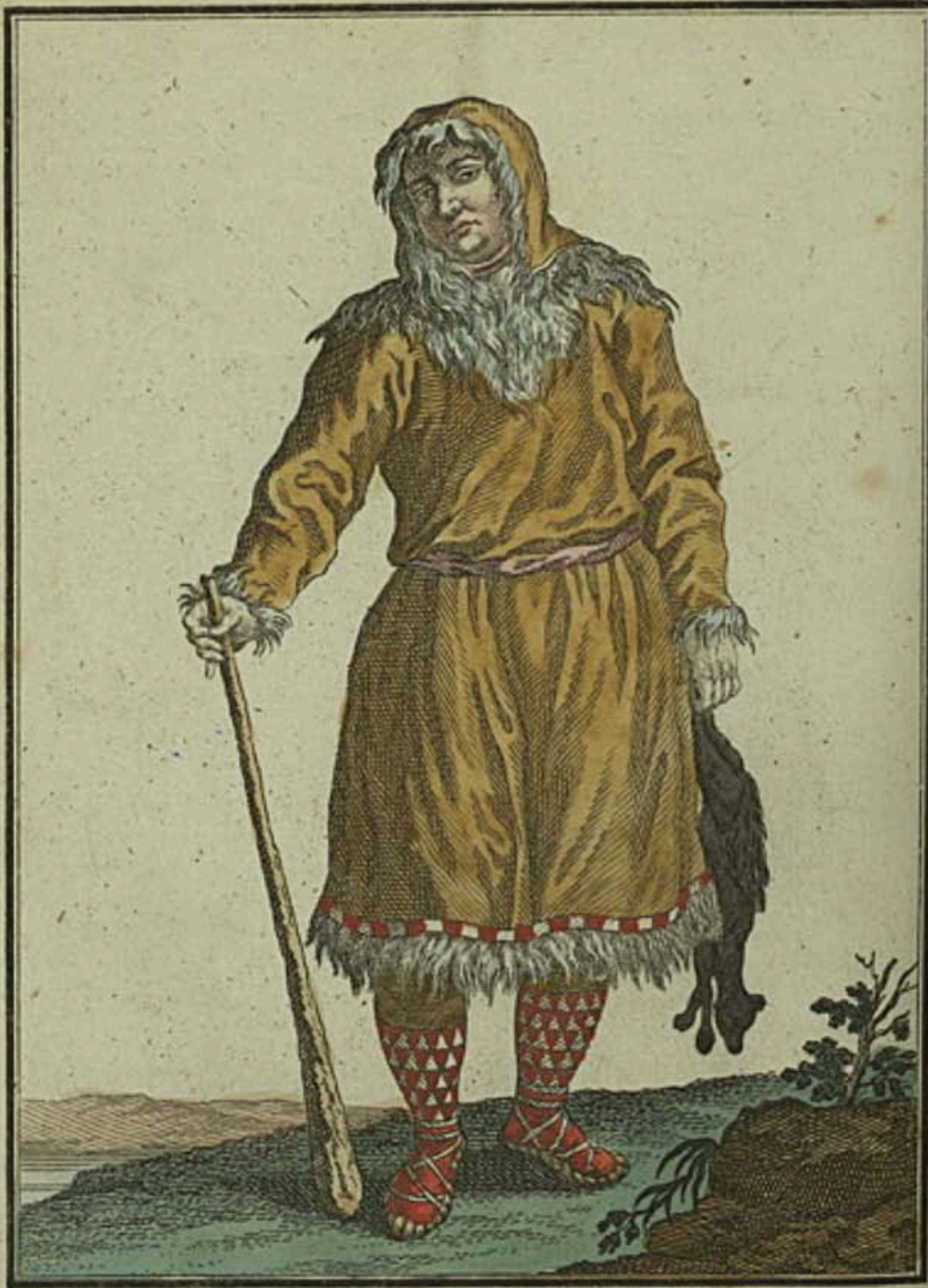
Коракъ. Ein Koräke. Koräk.