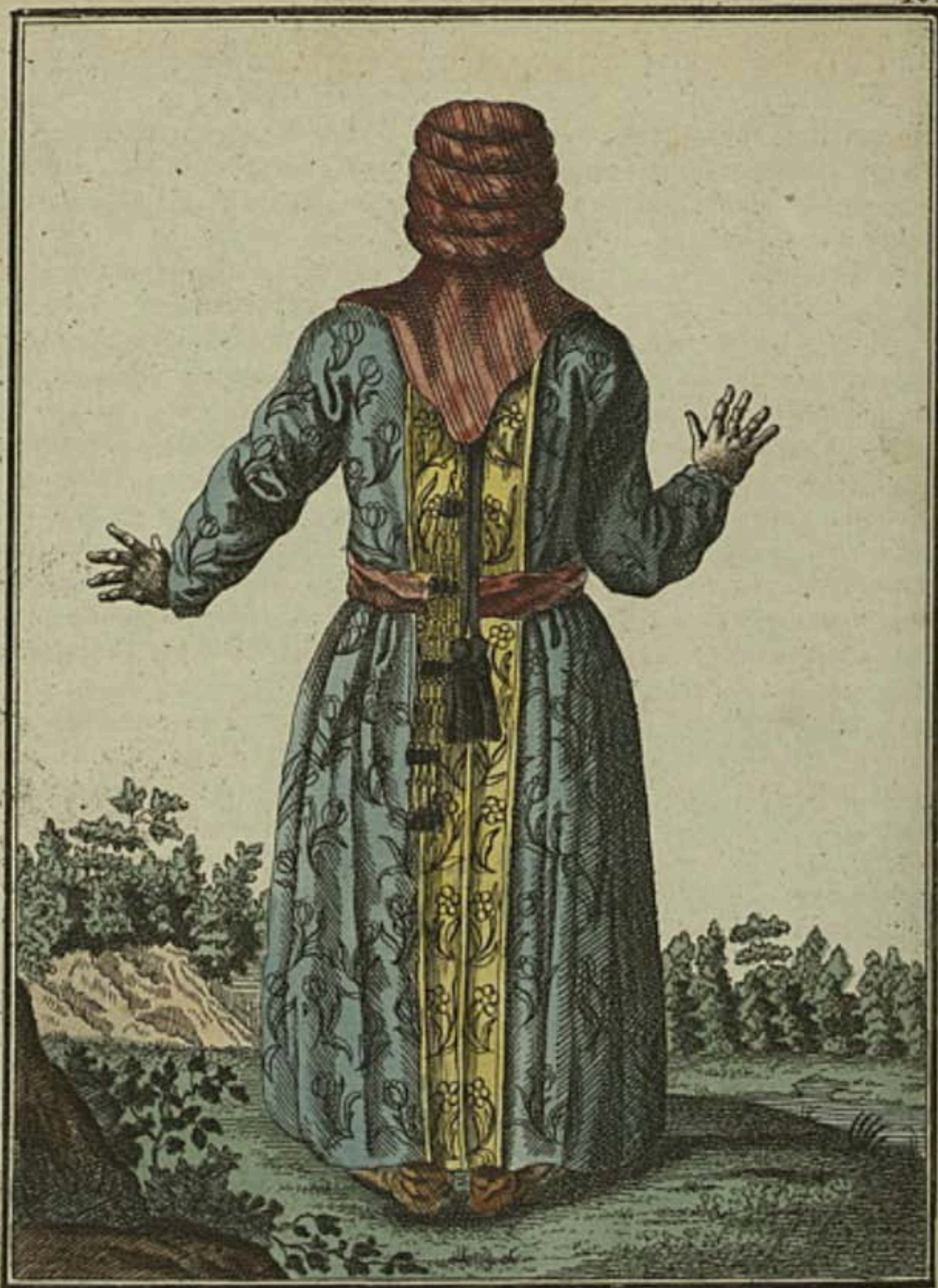
Kirgisiene сѣ тыла. Eine Kirgisin rückwärts. Une Kirguisienne par derriere.