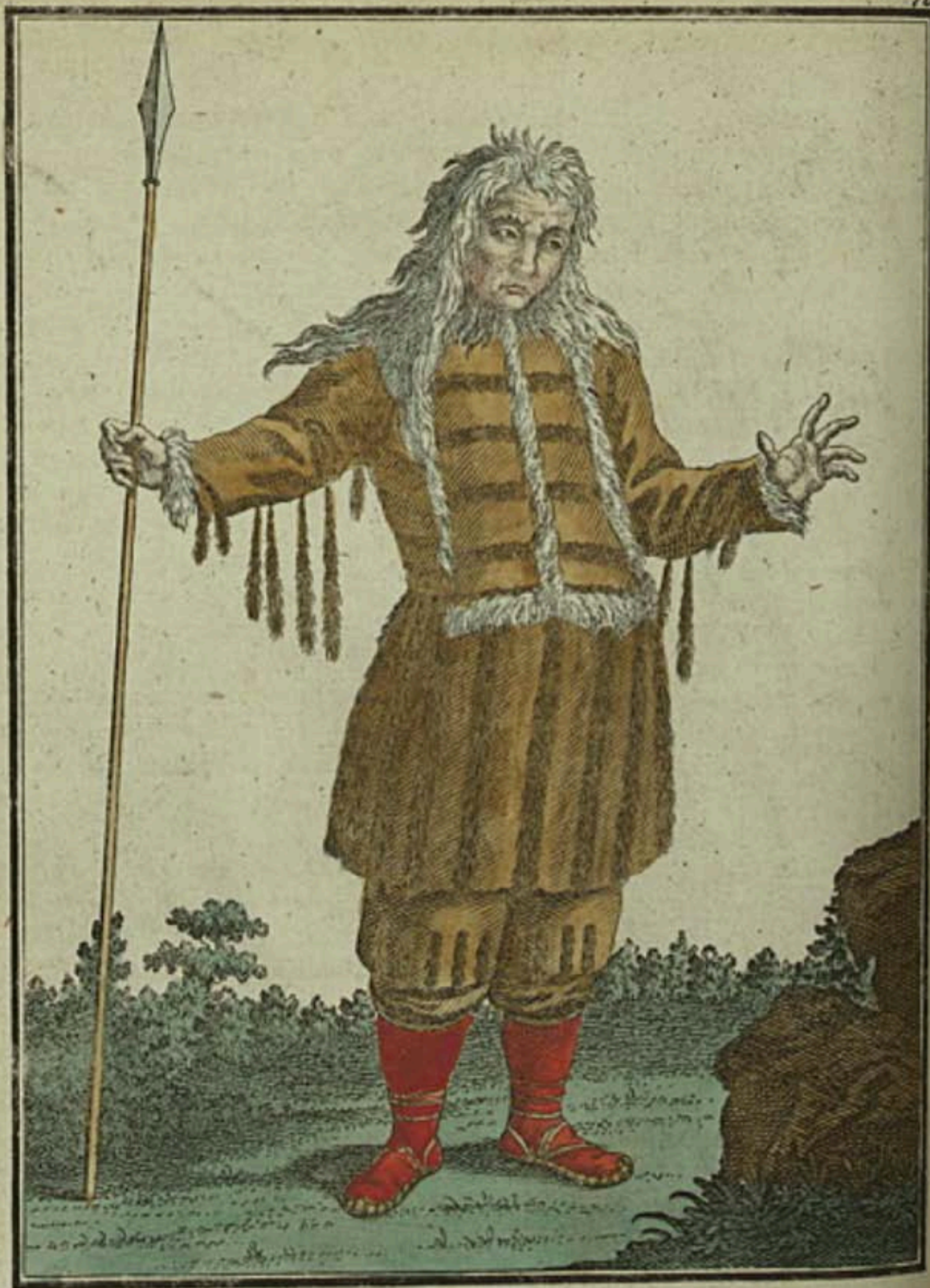
Корякъ въ уборнамъ платьѣ. Ein Koräk im Staats Kleide. Un Korek en habit de fête.