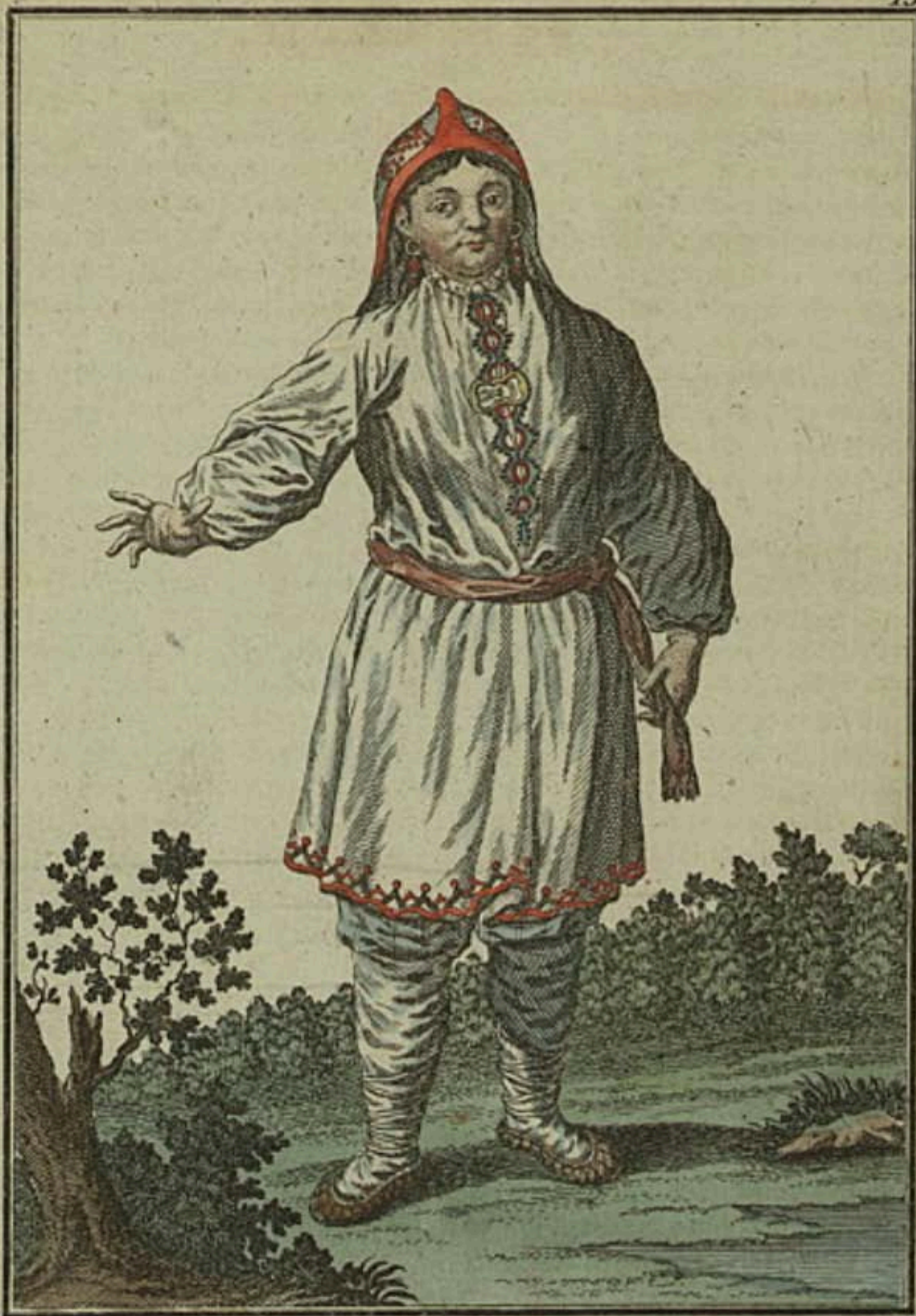
Чермыска въ лѣтнемъ платьѣ. Eine Tcheremissin im Sommer-Kleide. Femme Tcheremissienne en habit d'été.