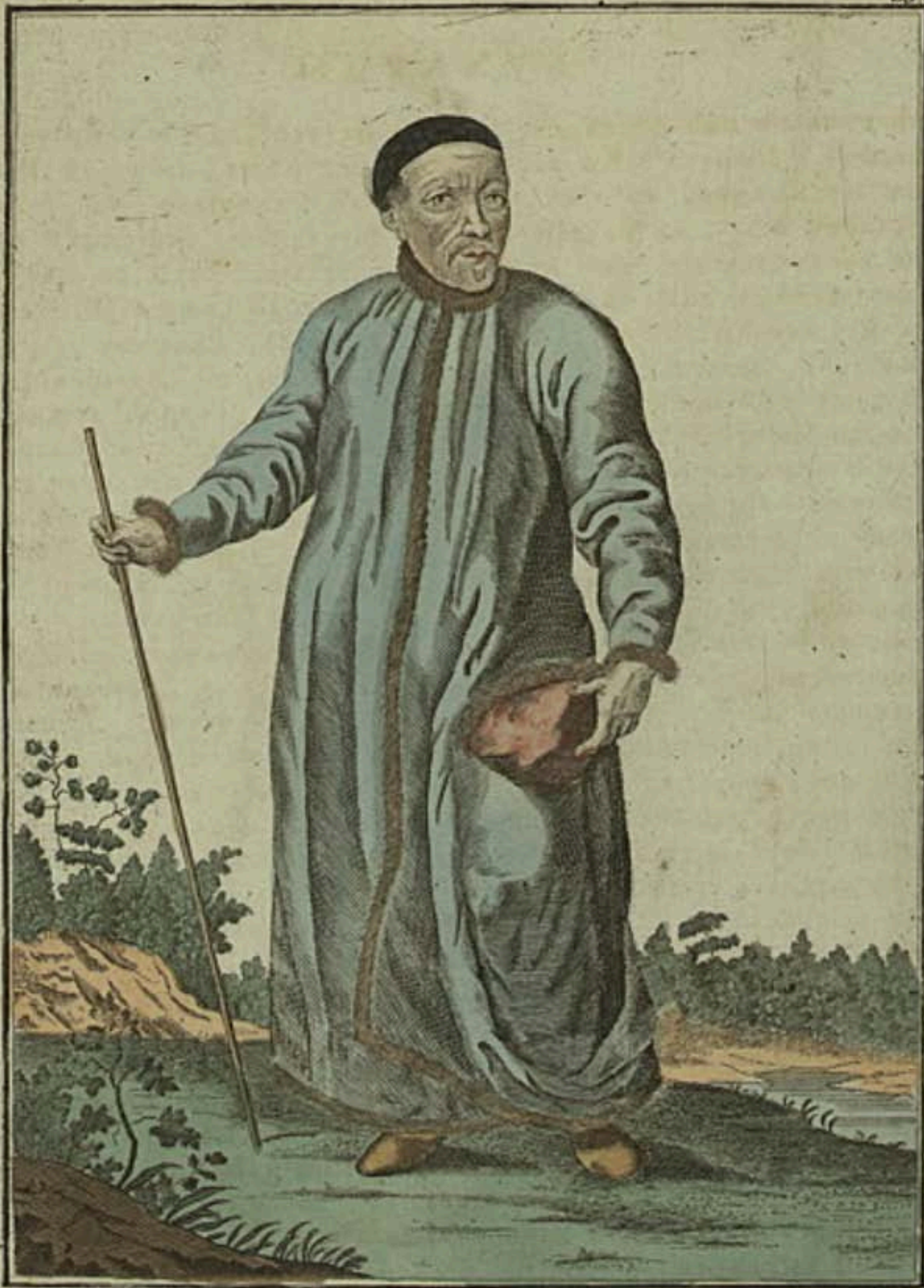
Сибирскоѣ Бухарѣ . Ein Sibirischer Buchar . Un Bouchar de Siberie .