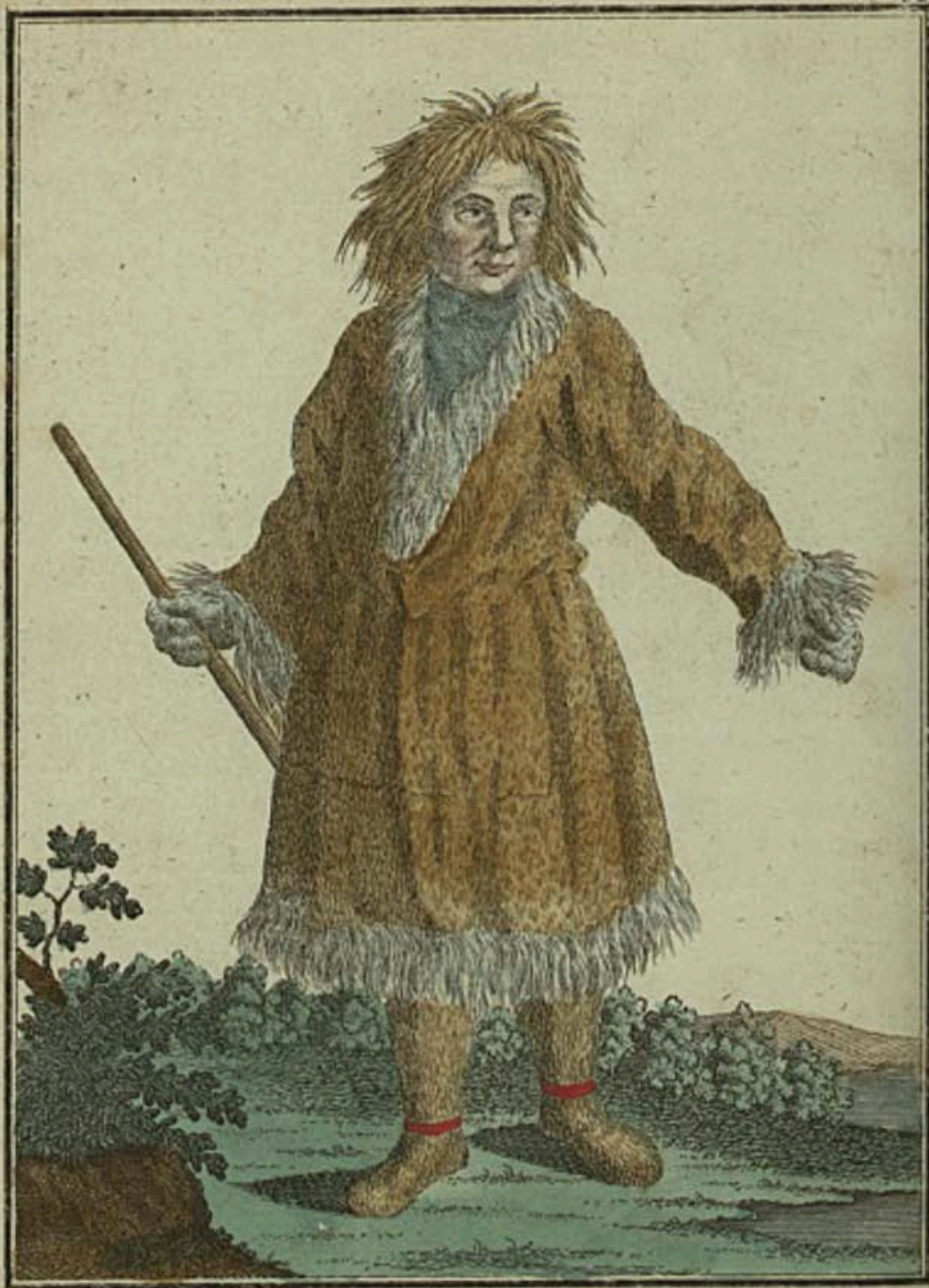
Камтадалъ въ зимнемъ платьѣ. Ein Kamtschadal im Winter-Kleide. Un Kamtschadale en habit d'hiver.