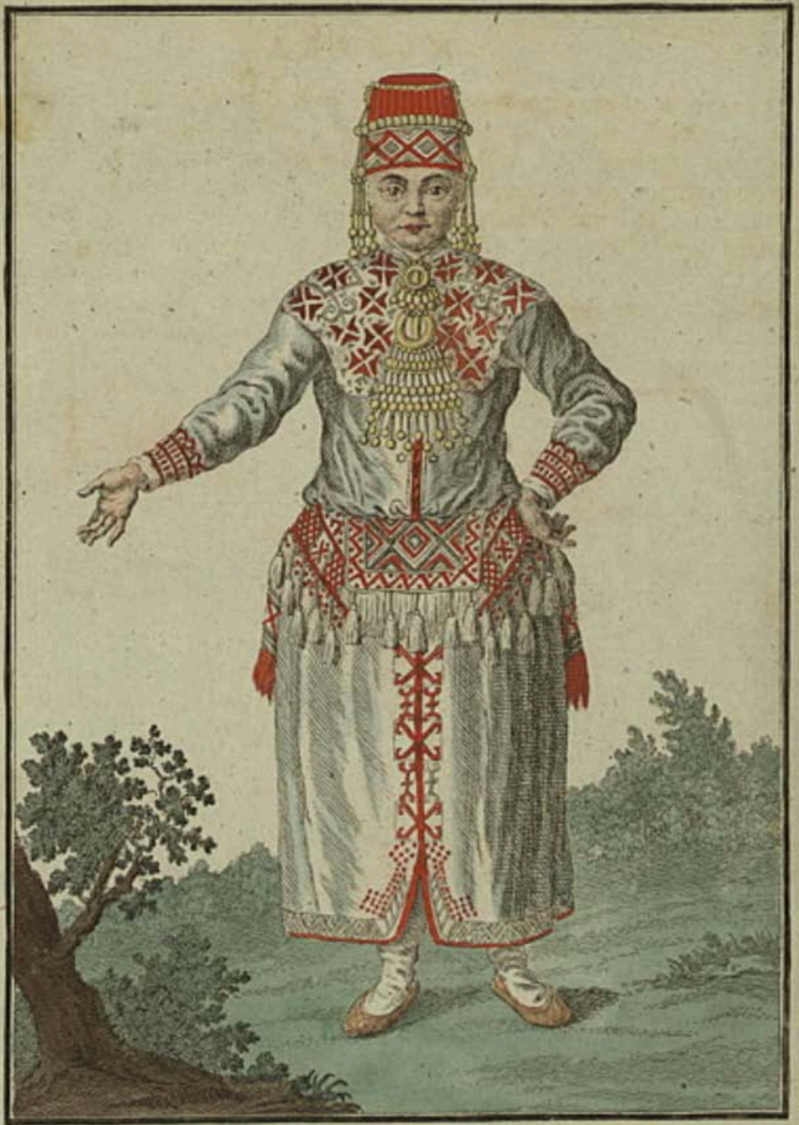
Мордовка съ лица Eine Morduanerin vorwärts. Femme Morducane par devant.