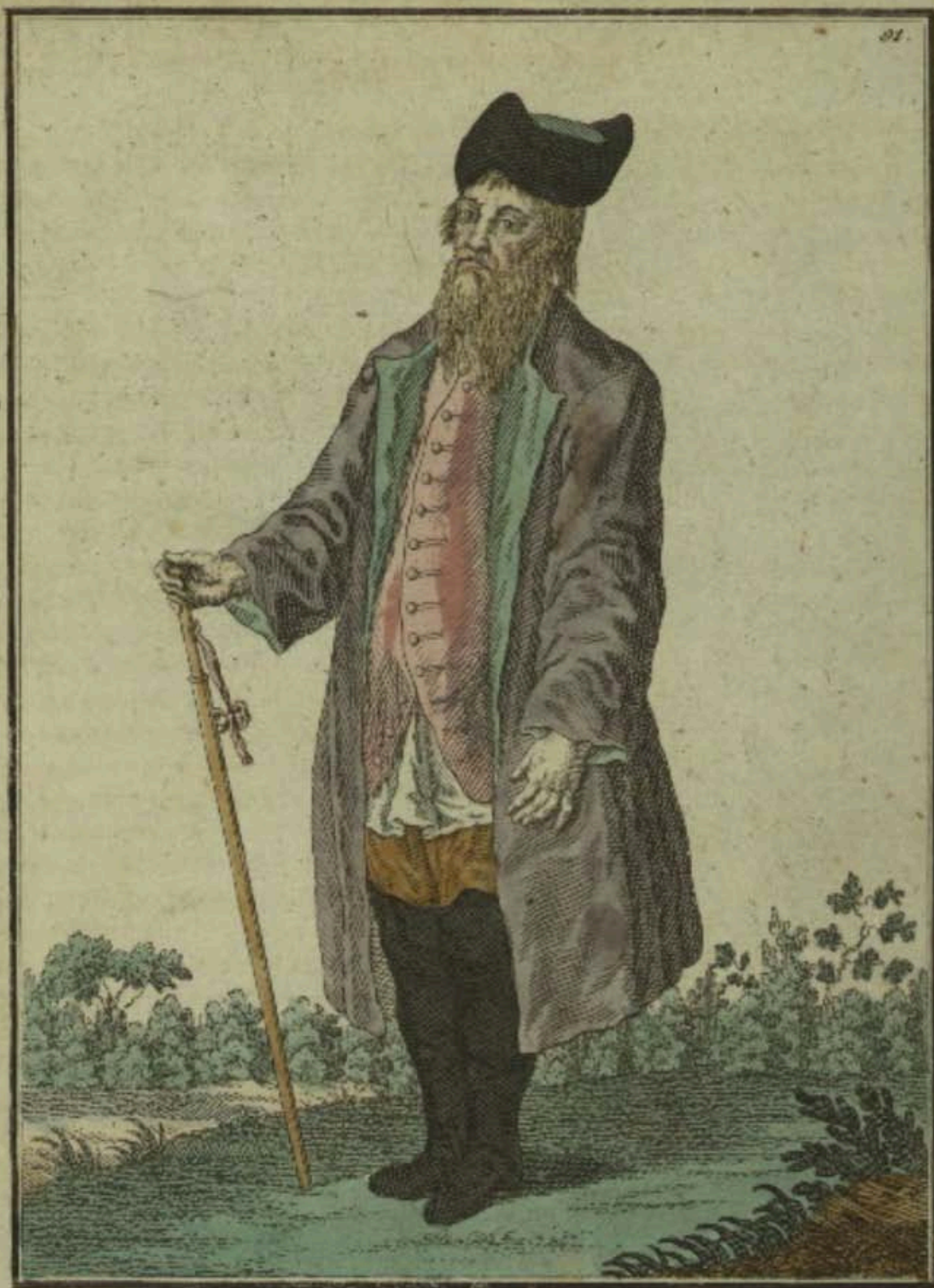
Калужской Купецъ. Ein Kaufman aus Caluga. Marchand de Kaluga.