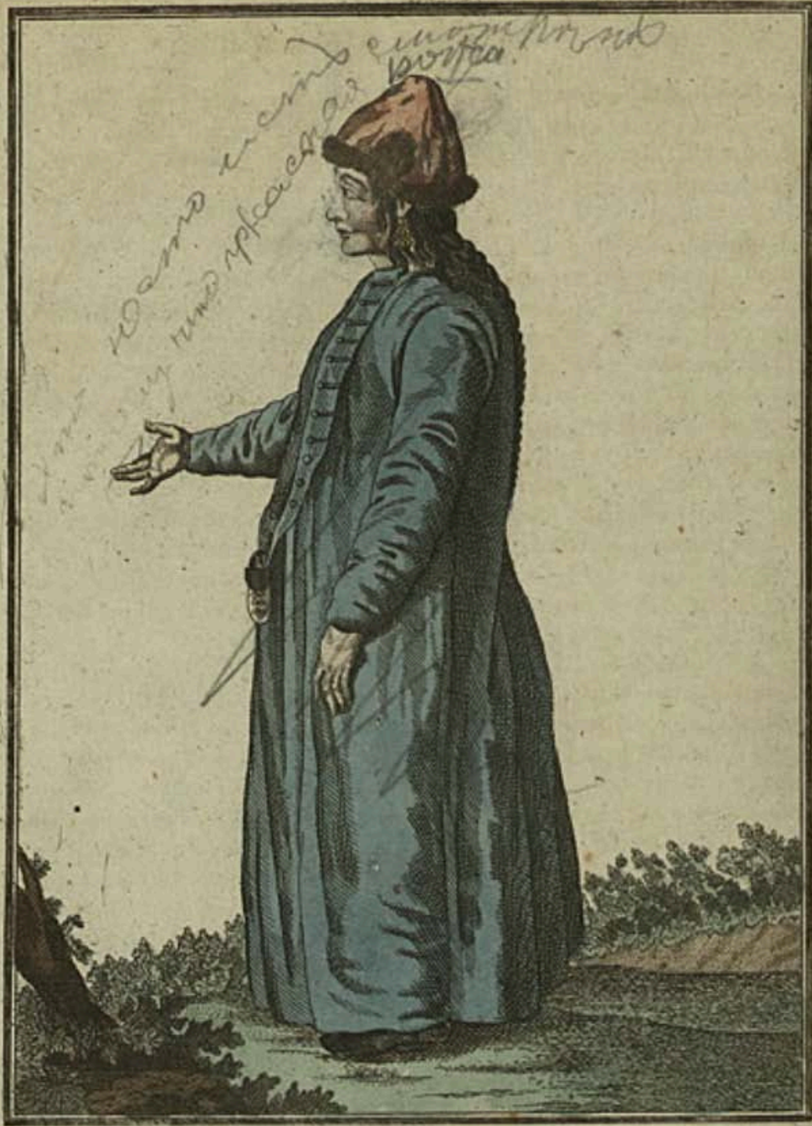
Барабинская дѣвка. Ein Barabinzisch Mäidgen. Fille Barabinzoise.