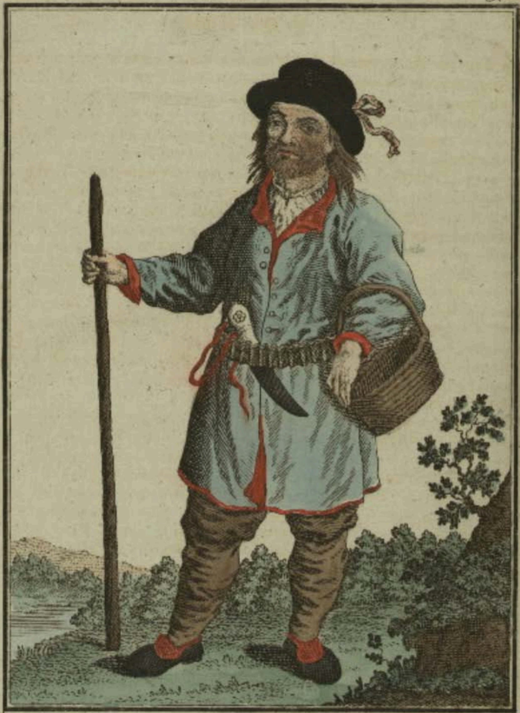
Чухонской мужикъ. Ein Finnischer Bauer. Paisan de Finlande.