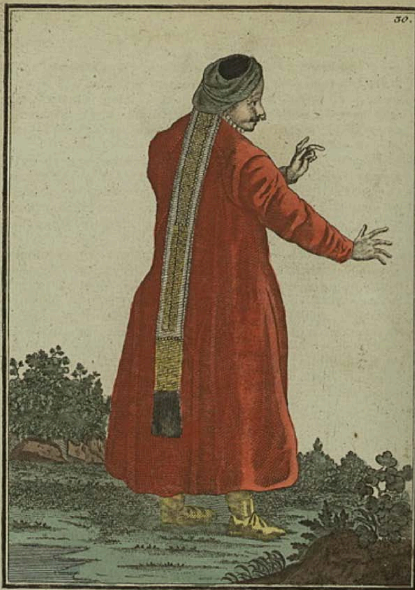
Ногайская манарка . Eine Nogaische Tatarin . Femme de Tatares Nogais .