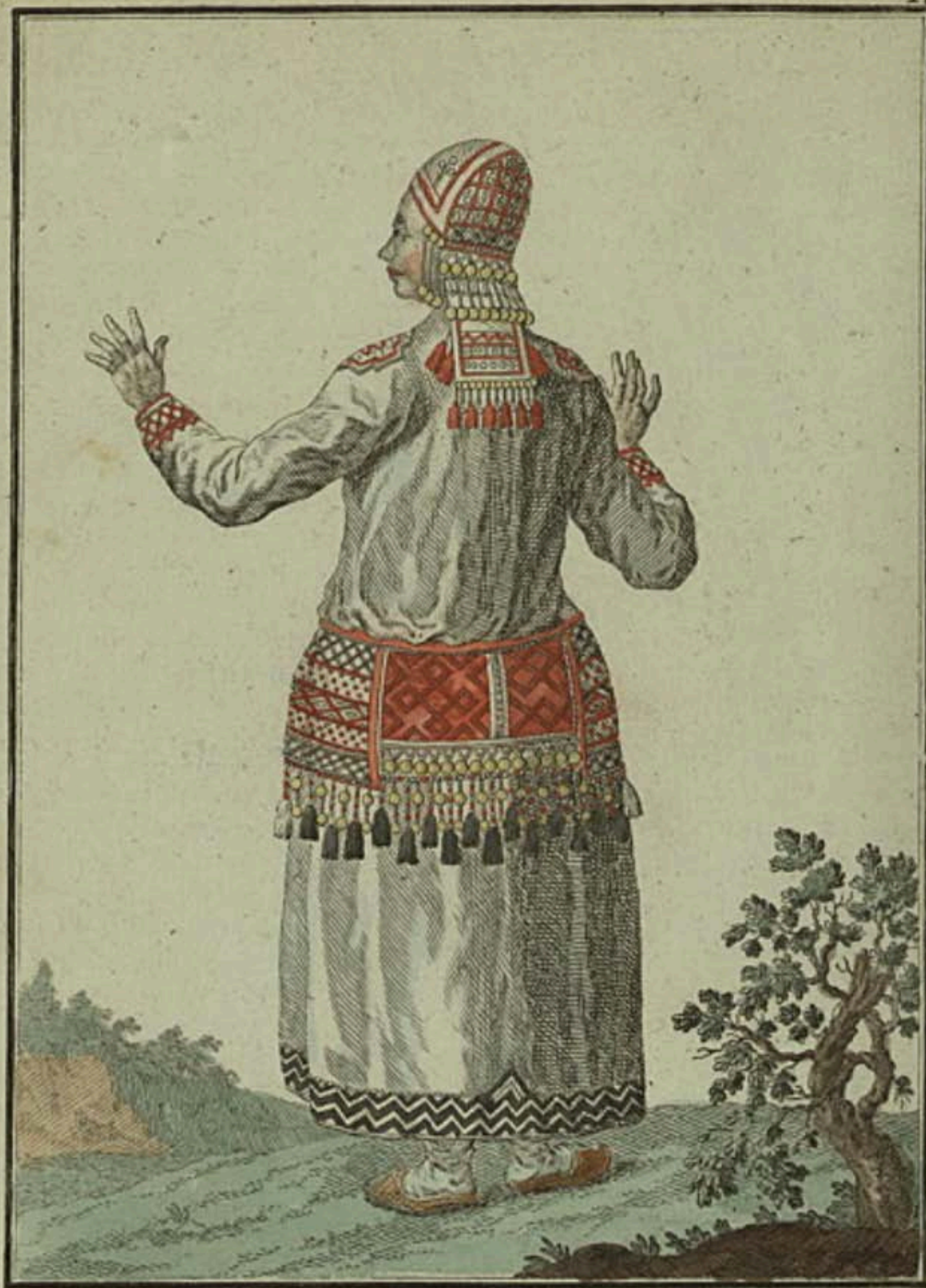
Мордовка со ступною. Eine Morduanerin rückwärts. Mordouane par derrière.