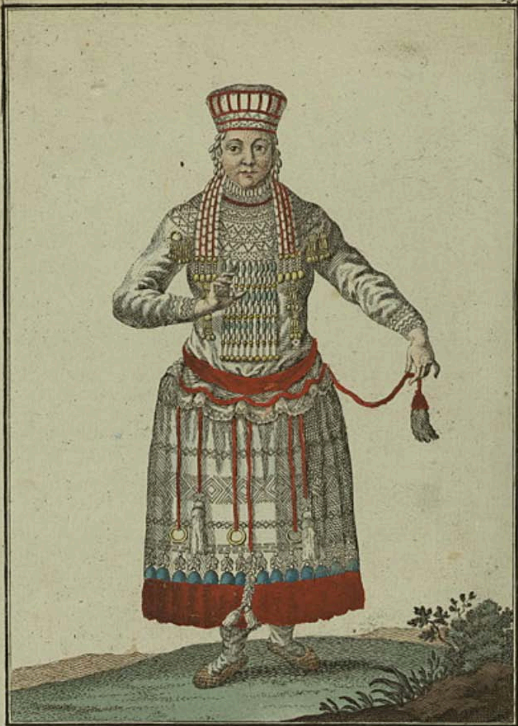
Мокшанка спереди. Eine Mockschanerin vorwärts Une Moquechaine par devant.