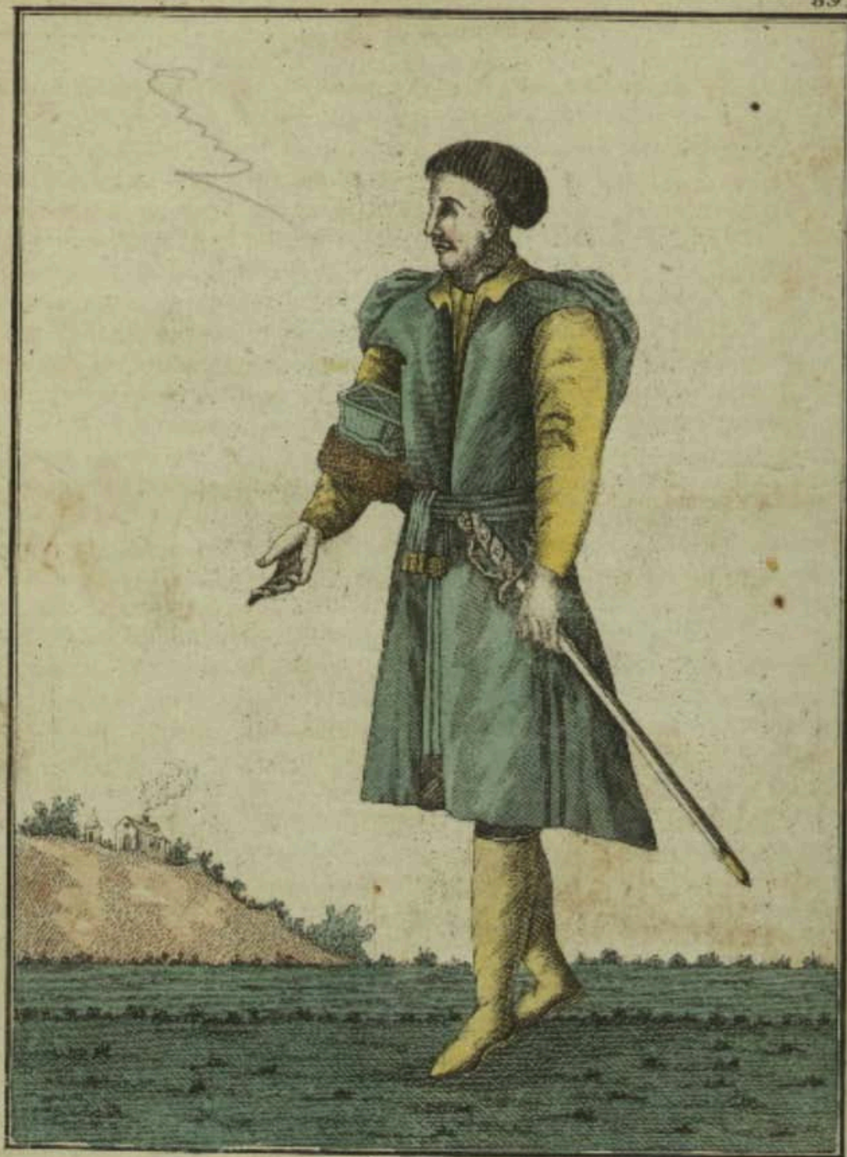
Польскъ. Ein Polack. Un Polonois.