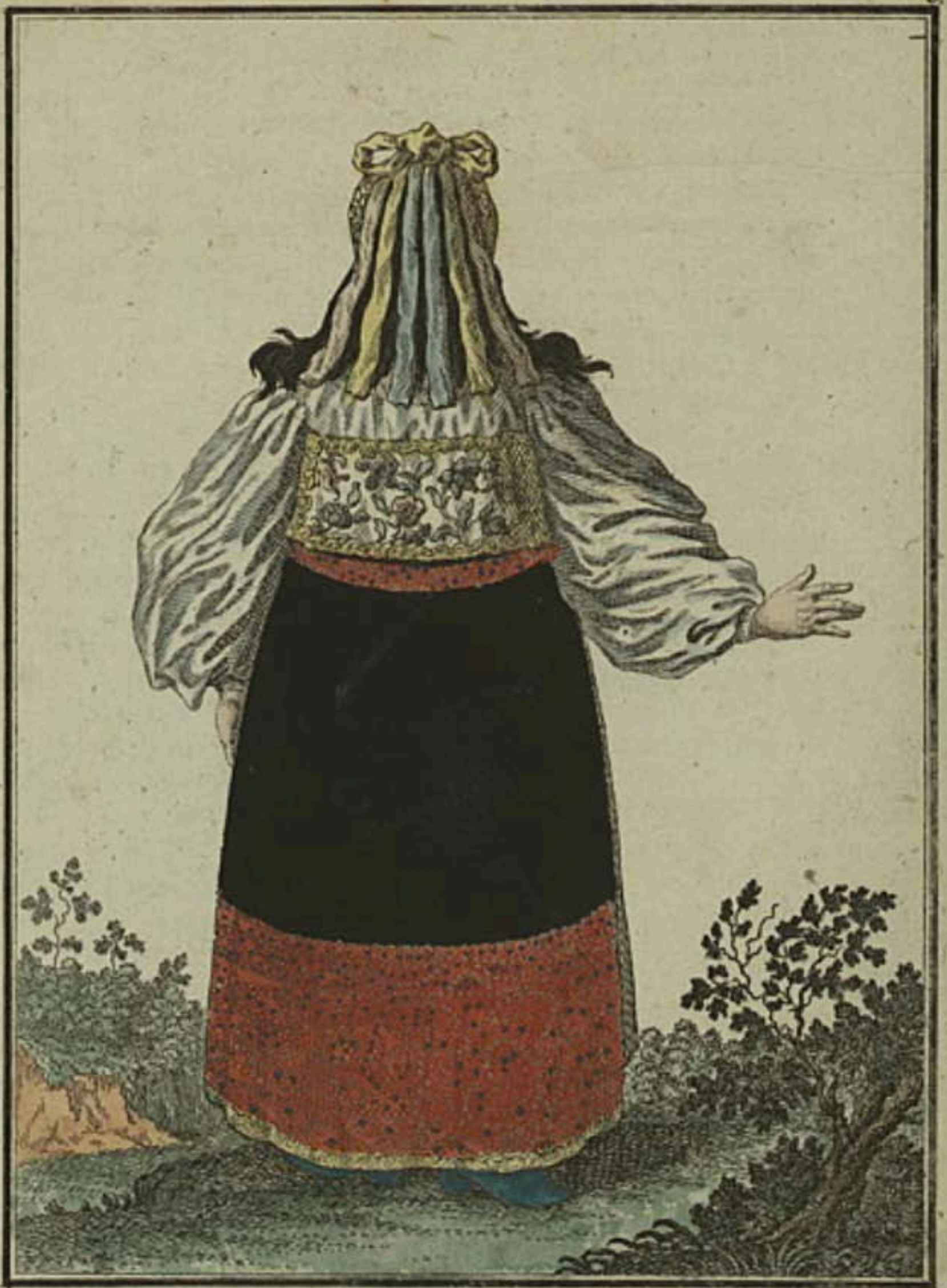
Эстляндская баба съ тыла. Eine Estländische Frau rückwärts. Femme Esthoniennne par derriere.