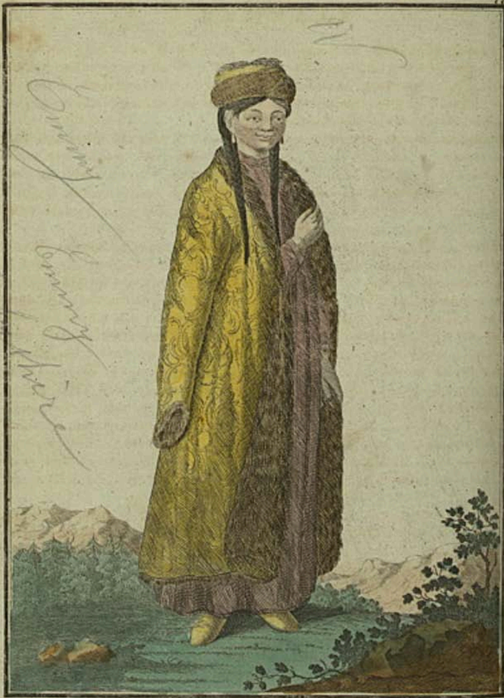
Калмычка. Eine Kalmückin. Une Femme Kalmuque.