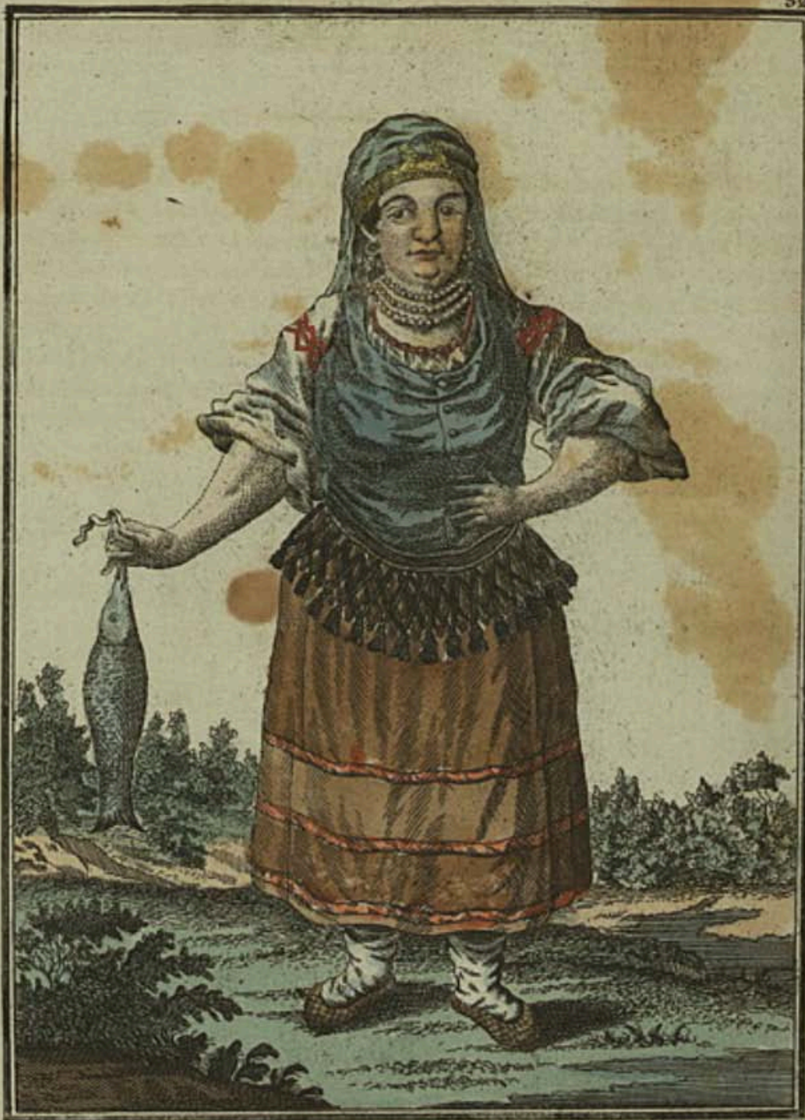
Кабардинка . Eine Kabardinerin . Une Kabardinienne .