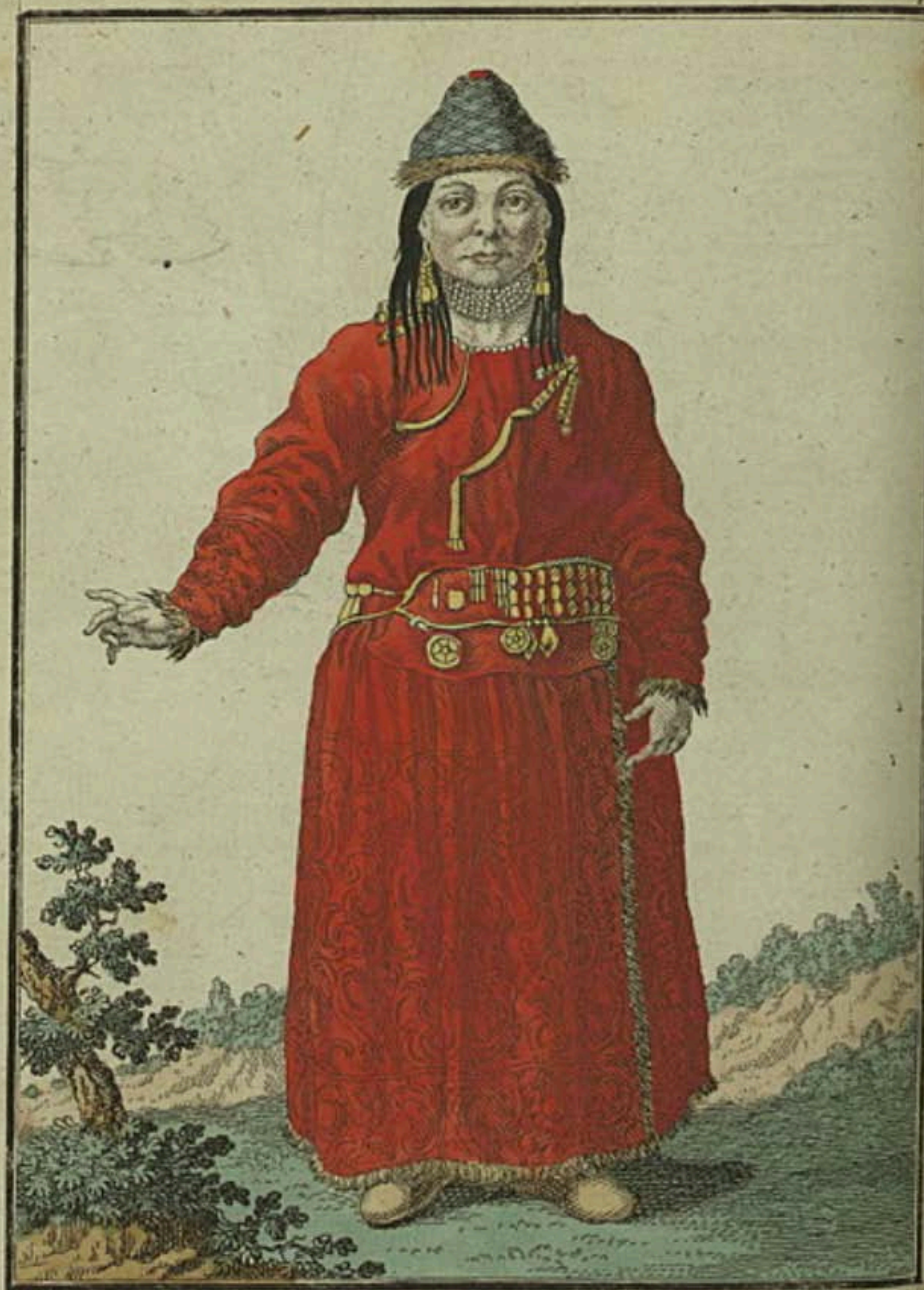
Брацкая Дѣвушка въ Удинскомъ Острогѣь спереди Eine Bratzkische Jungfer zu Udinskoi Ostrog vorwärts Fille Bratzke à Udinskoi Ostrog par devant.