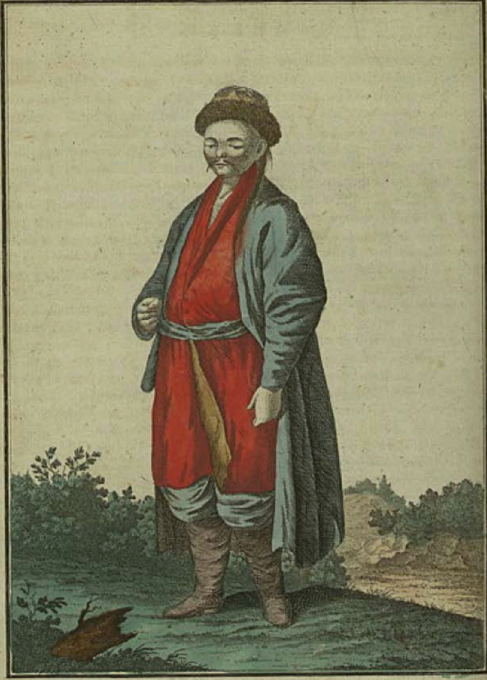
Калмыкъ. Ein Kalmuck. Un Kalmuque.