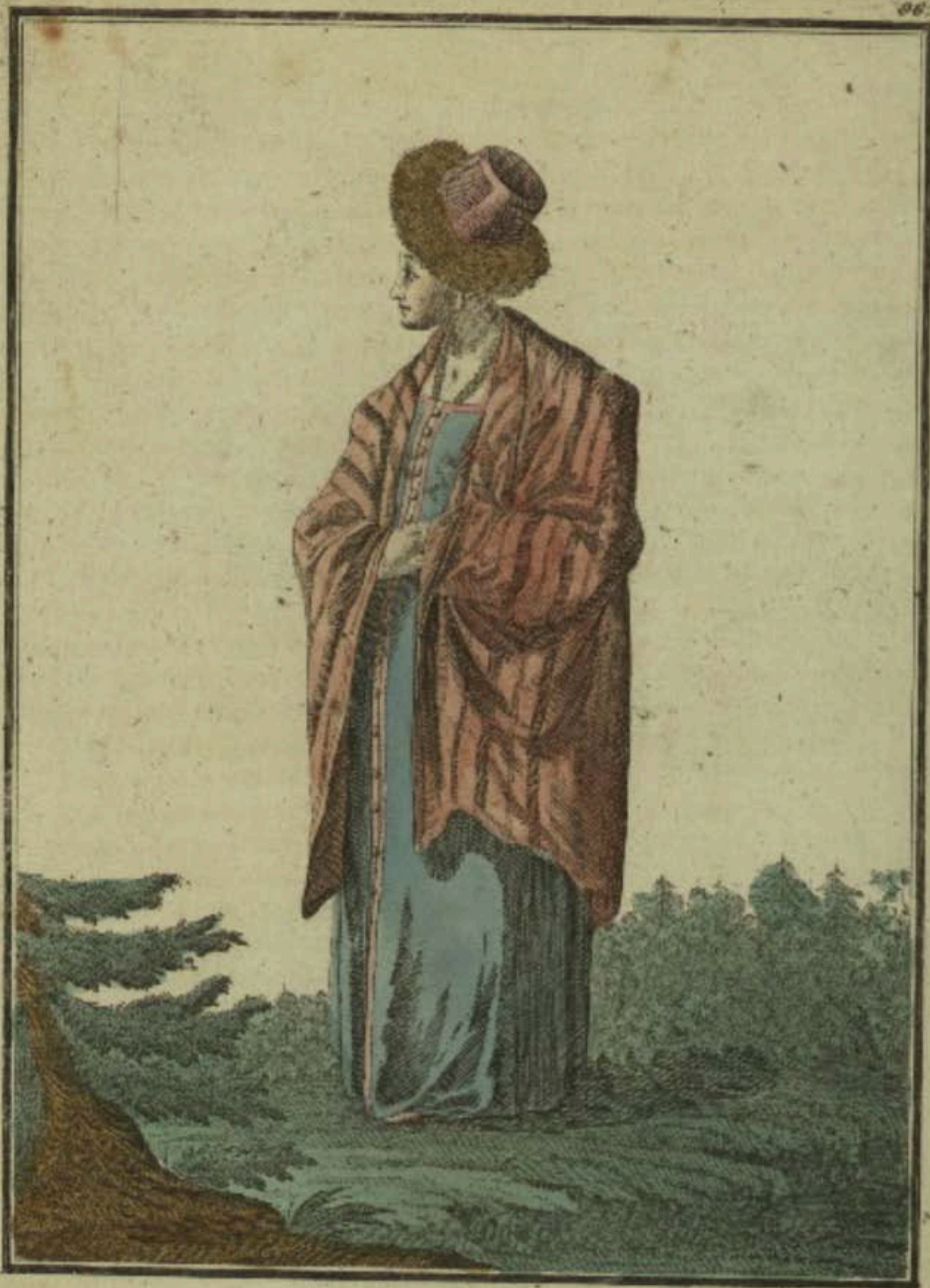
Валдайская баба. Ein Waldaiſches Weib. Femme de Waldaij.