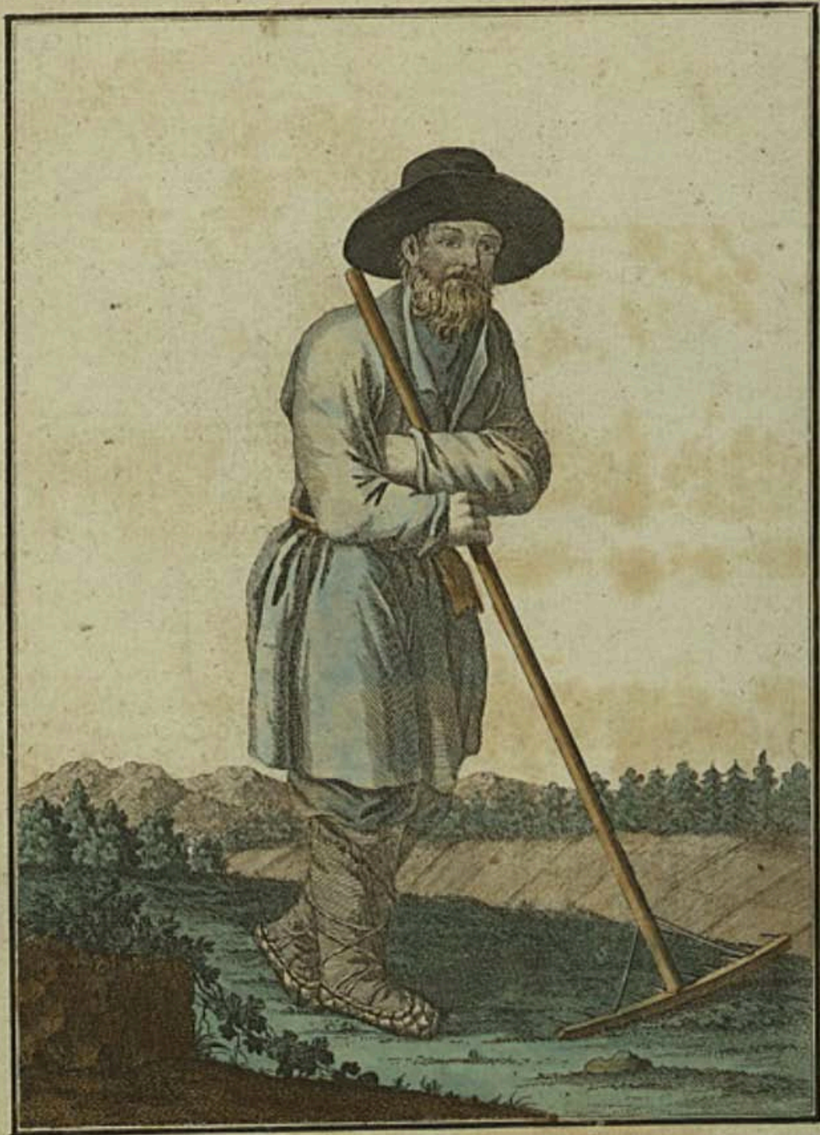
Російскій Кочевник. Ein Russischer Bauer. Un Pajfan Russe.