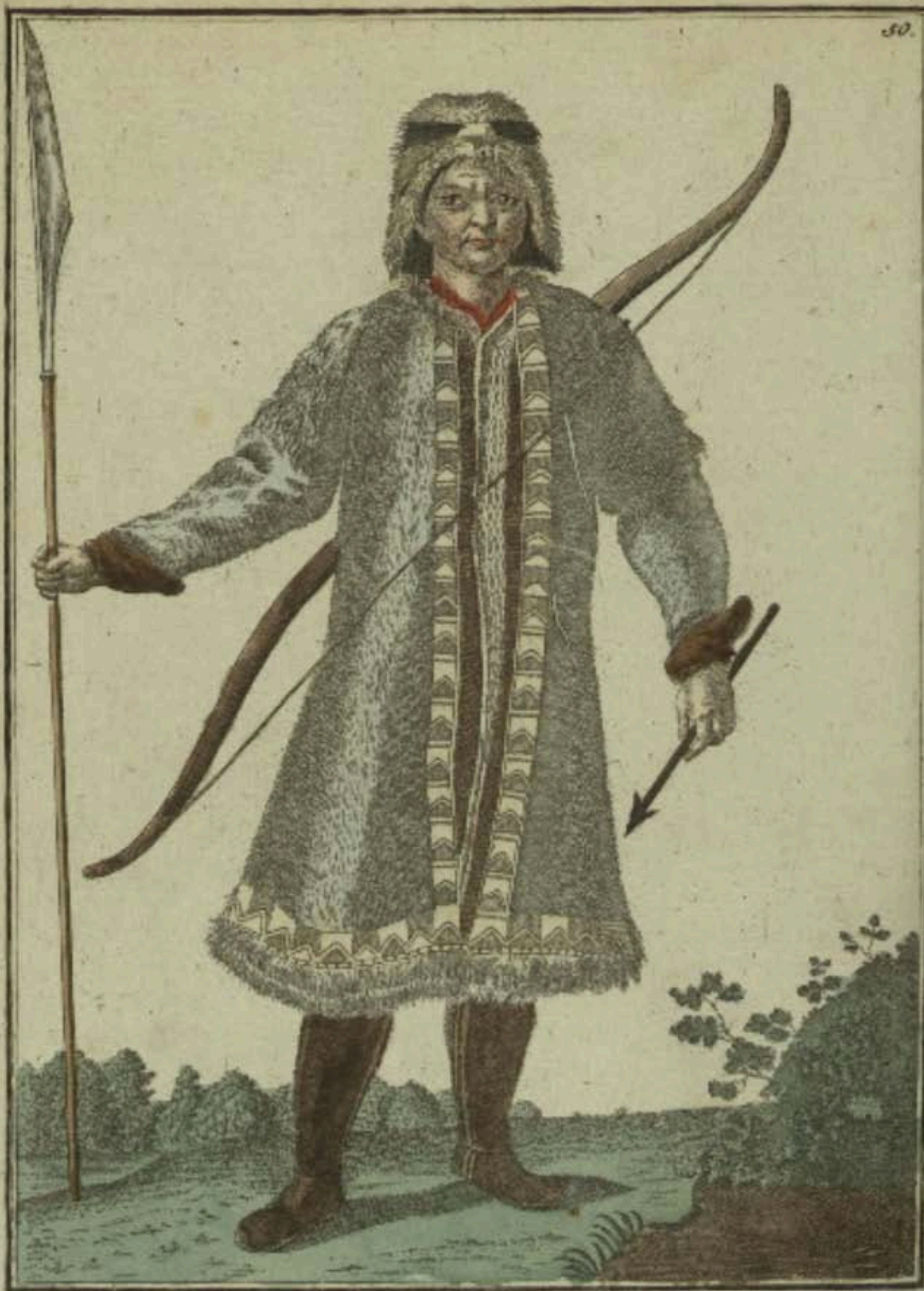
Якутъ въ охотѣмъ маньѣхъ спереди. Ein Jakut im Jagd Kleid vorwärts. Un Jacout en habit de chasse par devant.