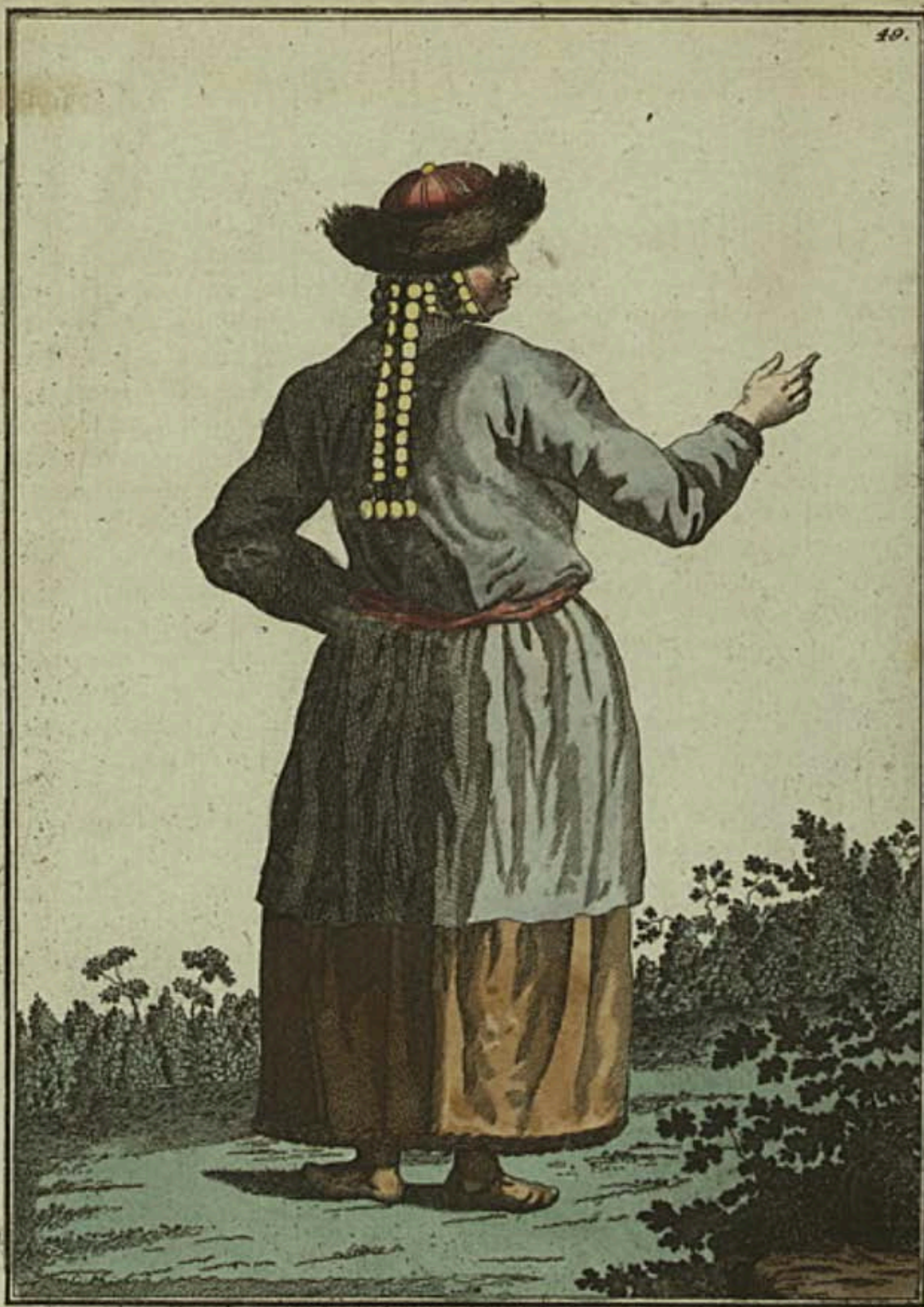
Татарская Девушка въ Кузнецкѣ со спины. Ein Tatarisch Mägdgen zu Kusnetzck rückwärts. Fille tatarre Koumetsk par derriere.