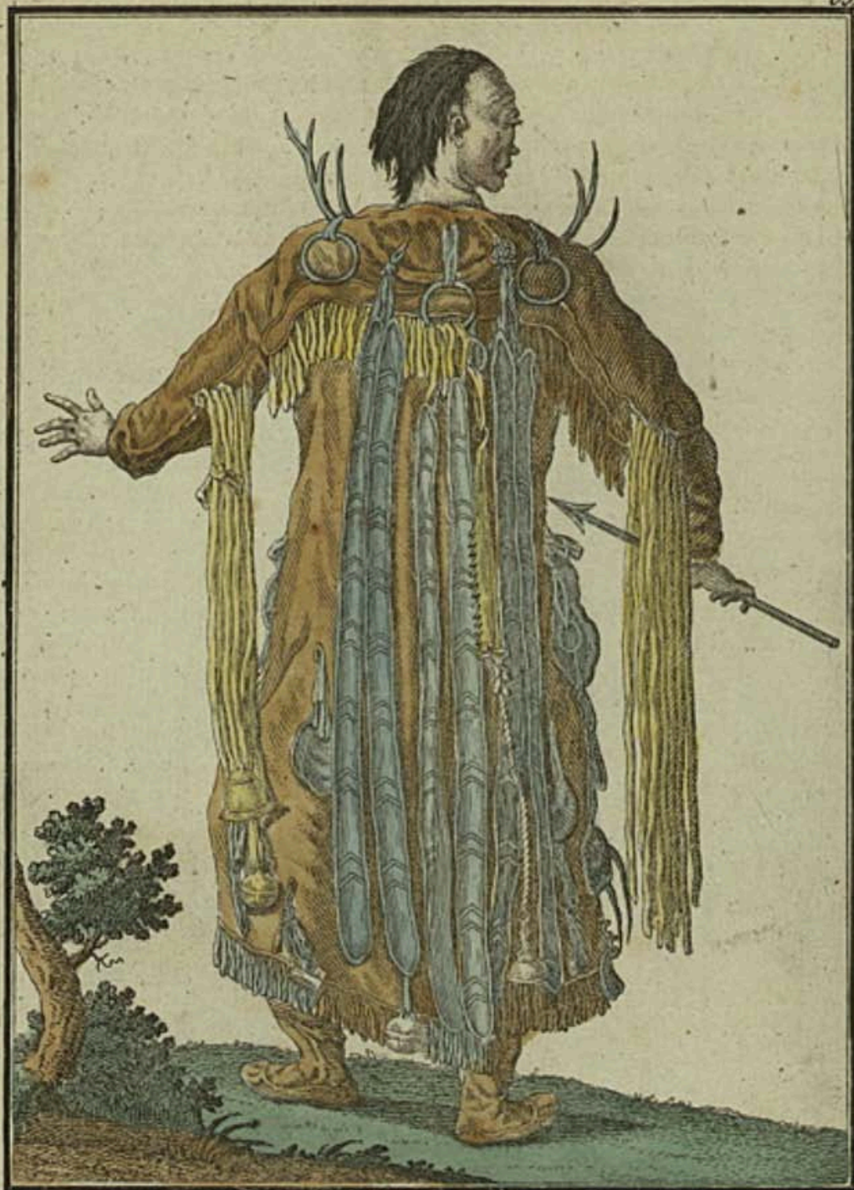
Тунгуской Шаманъ при рѣкѣ Аргунь сзади. Ein Tungusischer Schaman am Argun Fluss rückwärts. Devin toungouse auprès de l'Argoun par derrière.