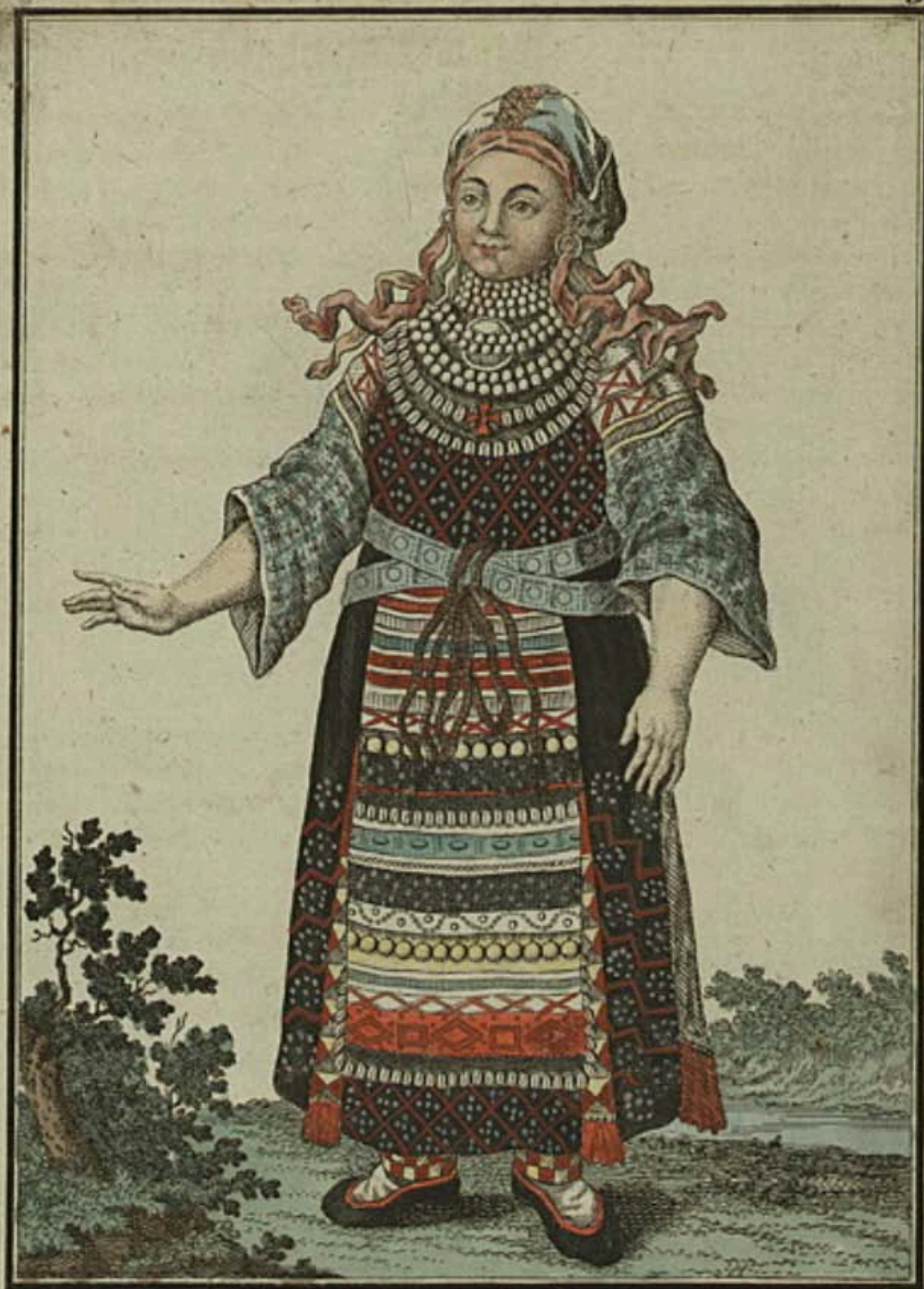
Чухонка въ уборномъ платьѣ. Eine Finnin im Feiertags-Kleide. Femme finoise dans son habit des fêtes.