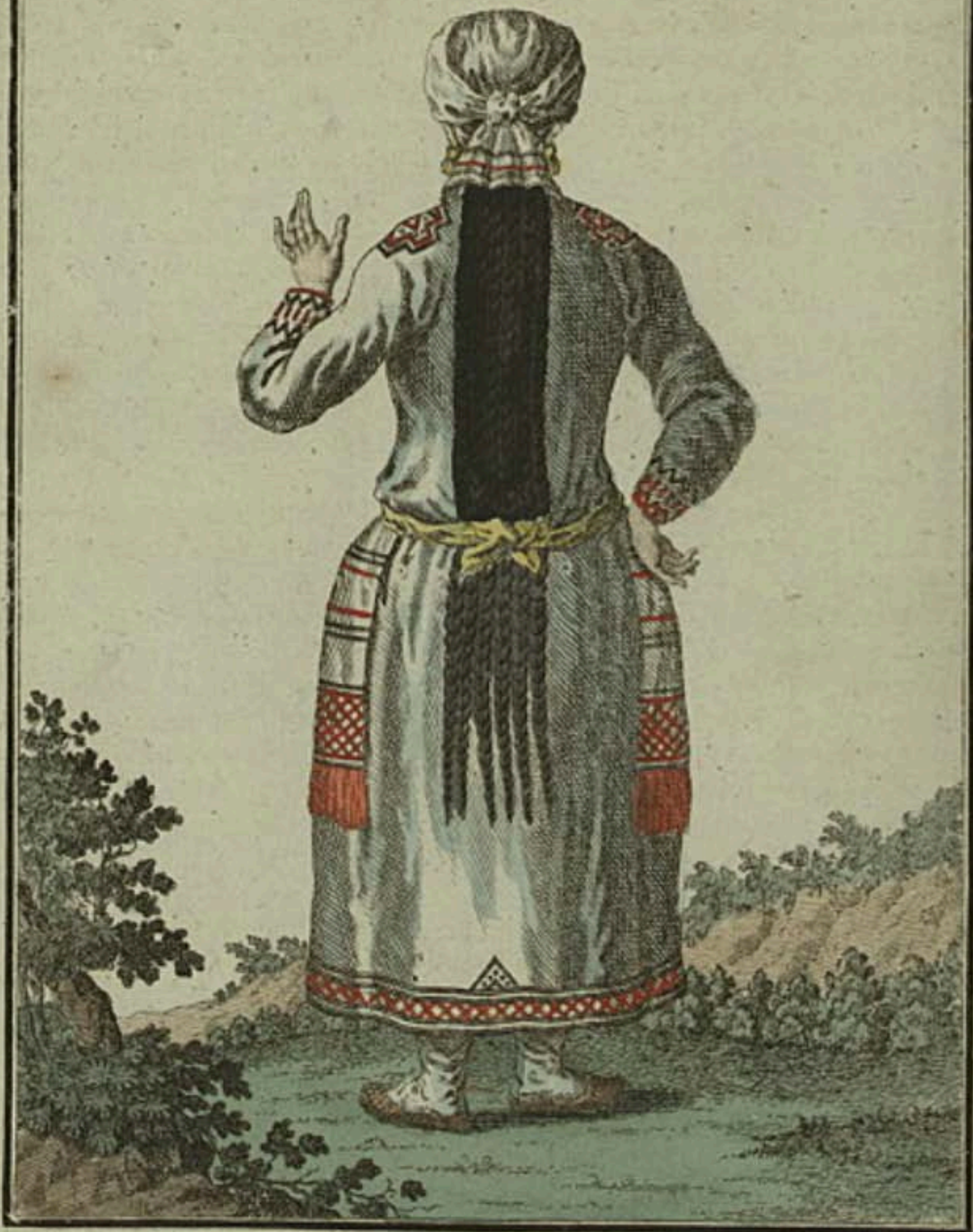
Мордовская дѣвушка съ пыла. Ein Morduanisches Mädchen rückwärts. Fille Morduane par derrière.