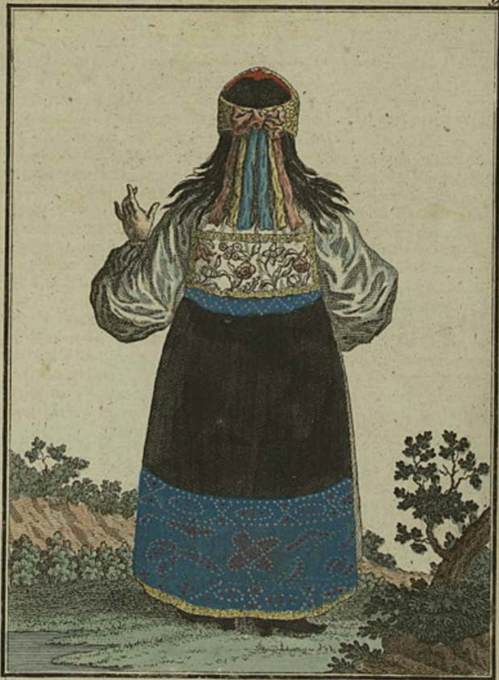
Эстляндская дѣвушка съ пыла. Ein Estländisches Mädchen rückwärts. Fille Esthoniennne par derrière.