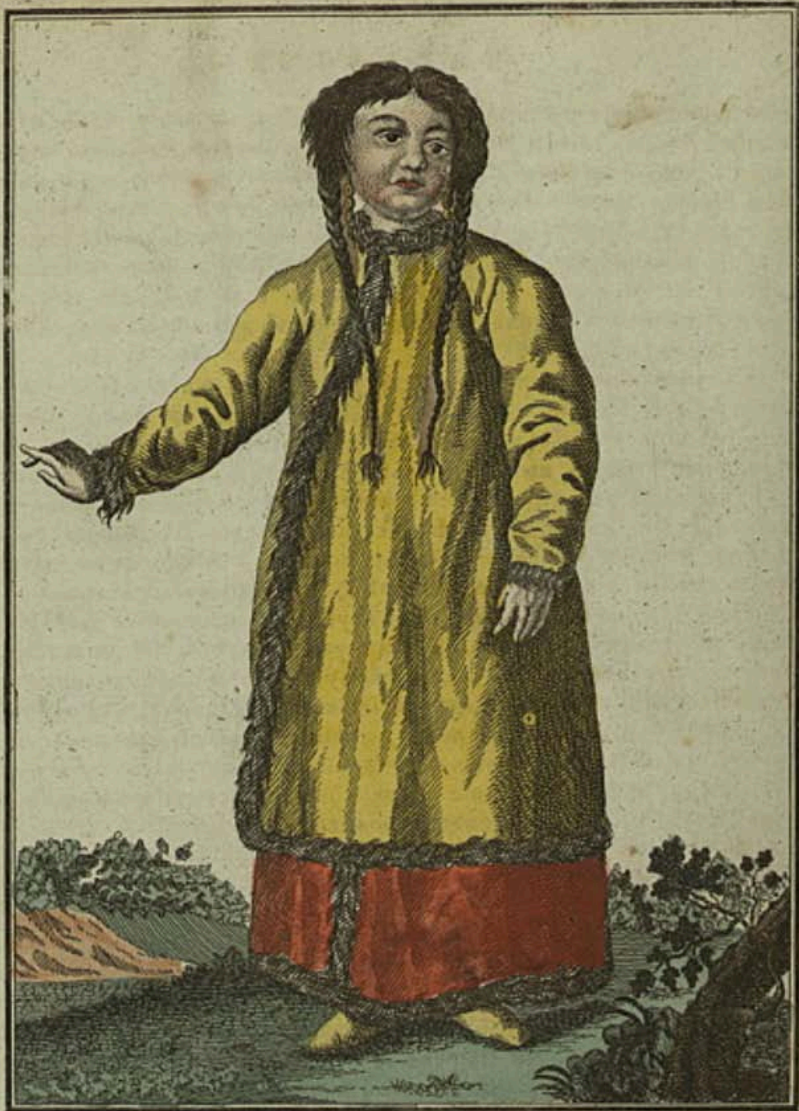
Барабинская баба. Eine Barabinzische Frau. Femme Barabinzoise.