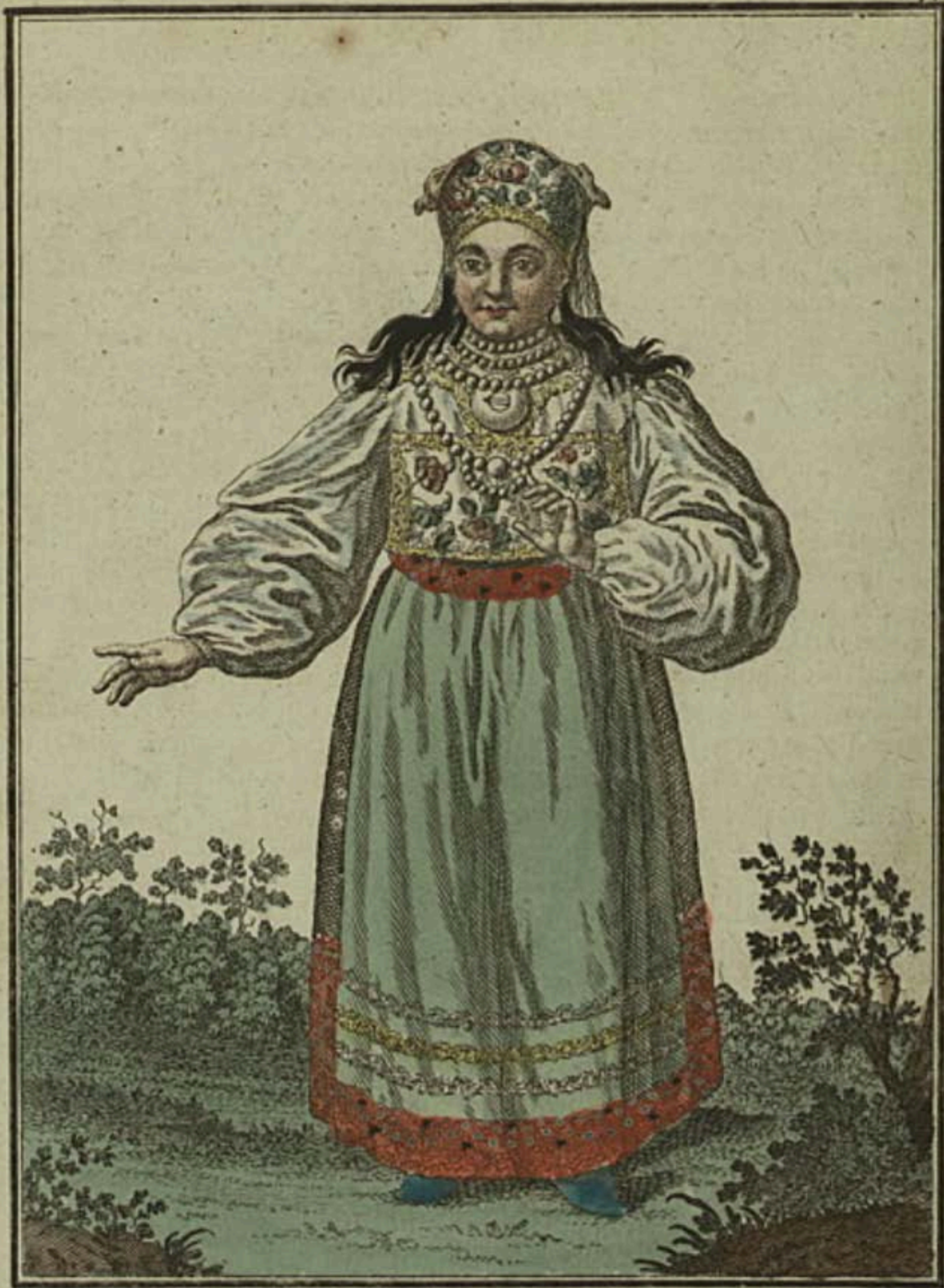
Эстляндская баба съ лица. Eine Estländische Frau vorwärts. Feme Esthoniennne par devant.