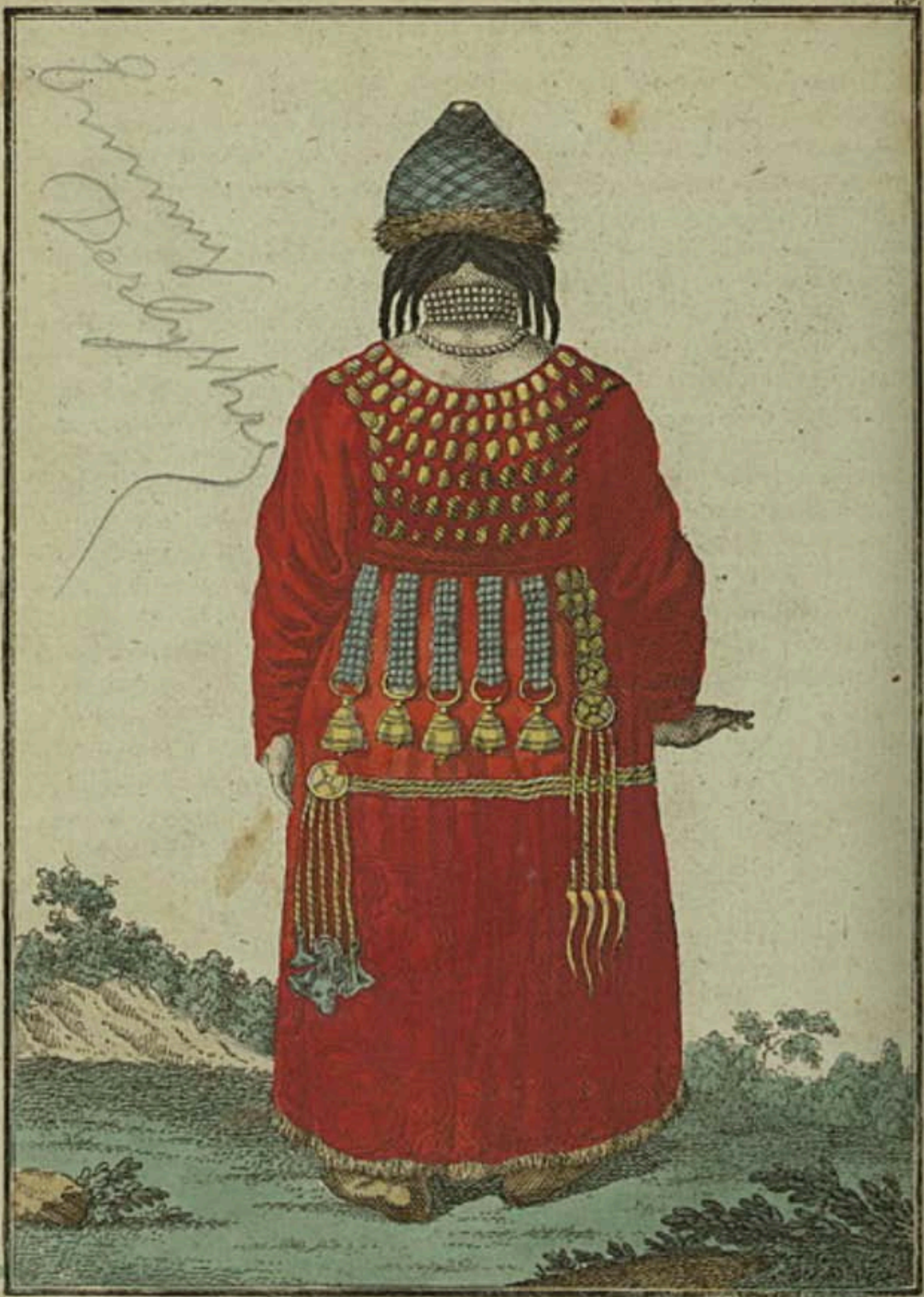
Брацкая Дѣвушка въ Удинскомъ Острогѣ сзади. Eine Bratzkische Jungfer zu Udinskoi Ostrog rückwärts. Fille bratzke a Udinskoi Ostrog par derrière.