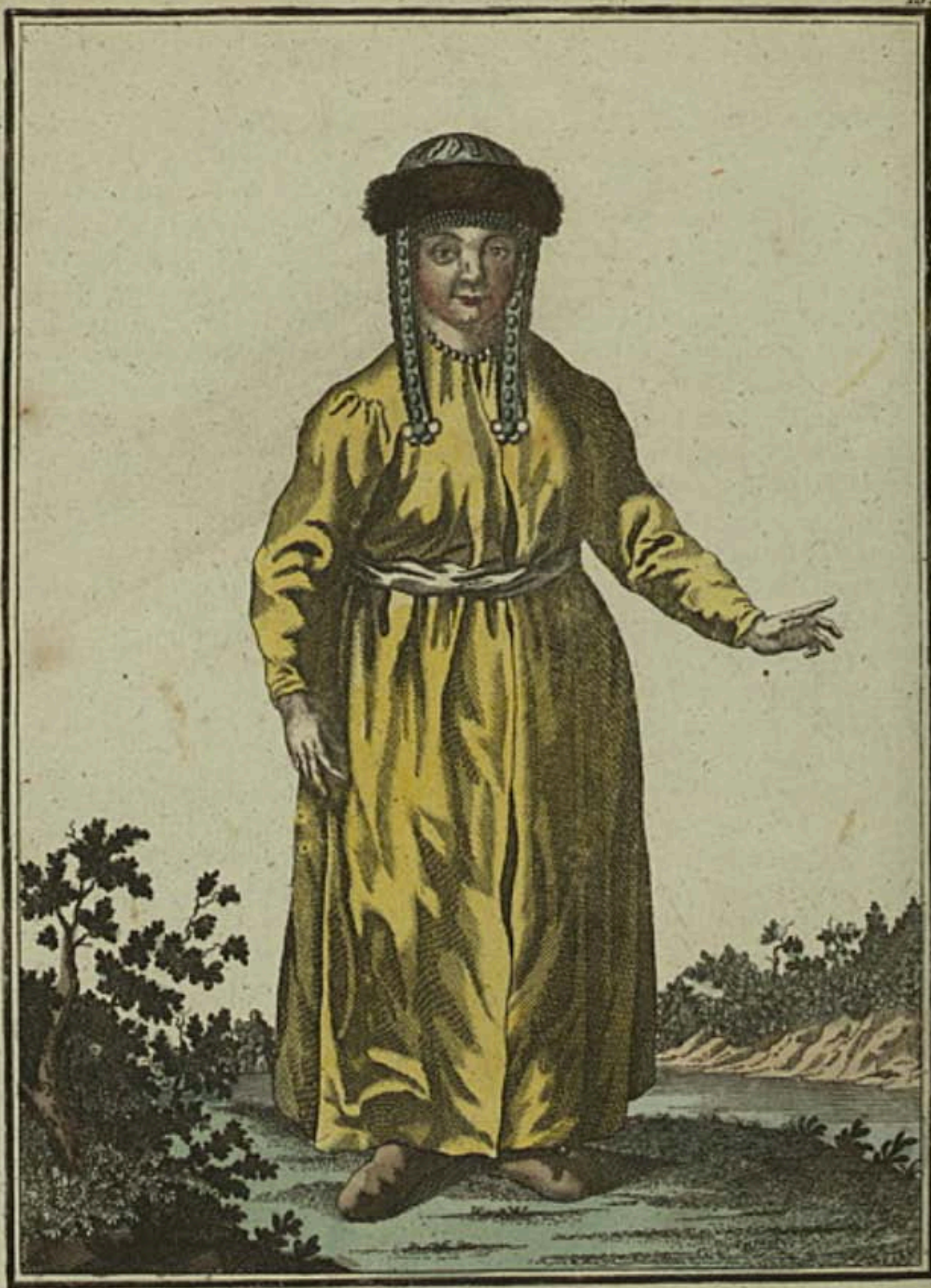
Татарская баба въ Кузнецкѣ съ лица. Ein Tatarisches Weib zu Kusnetzck vorwärts. Femme tatare à Kouznetsk par devant.