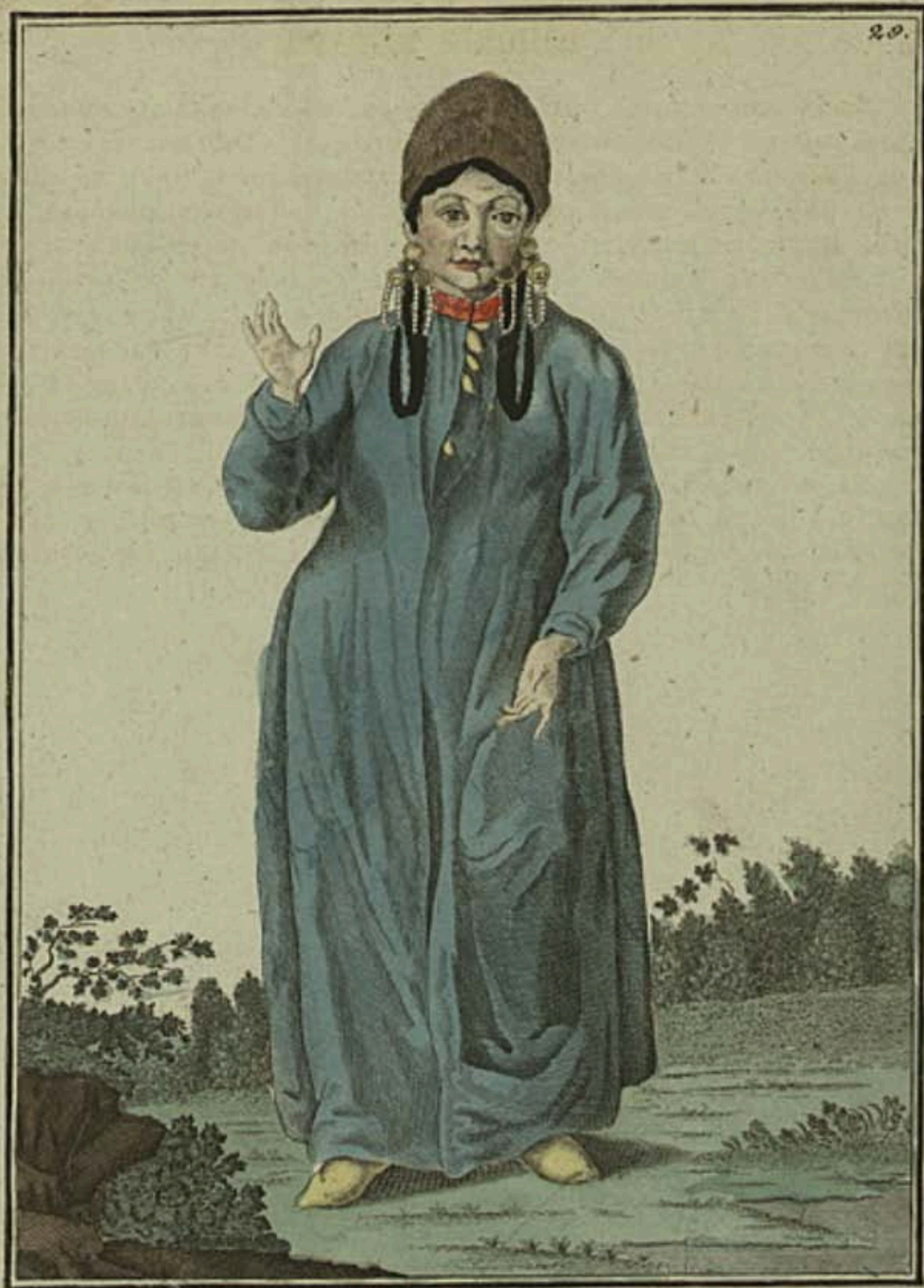
Чатская татарка . Eine Tschatskische Tatarin . Femme tatare de Tschatsk .