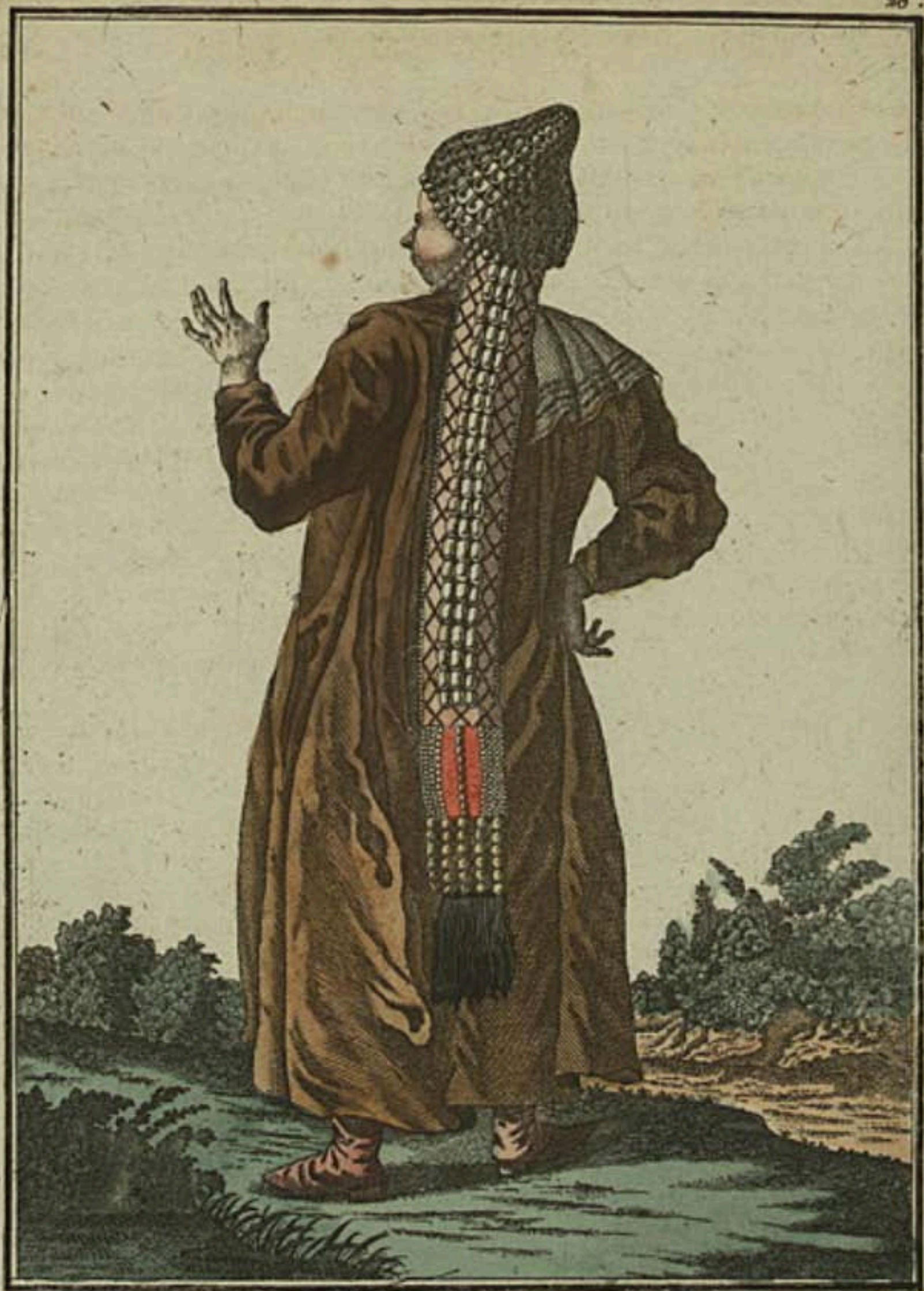
Татарка казанская сзади. Eine Kasanische Tatarin rückwärts. Femme Tattare de Casan par derrière.