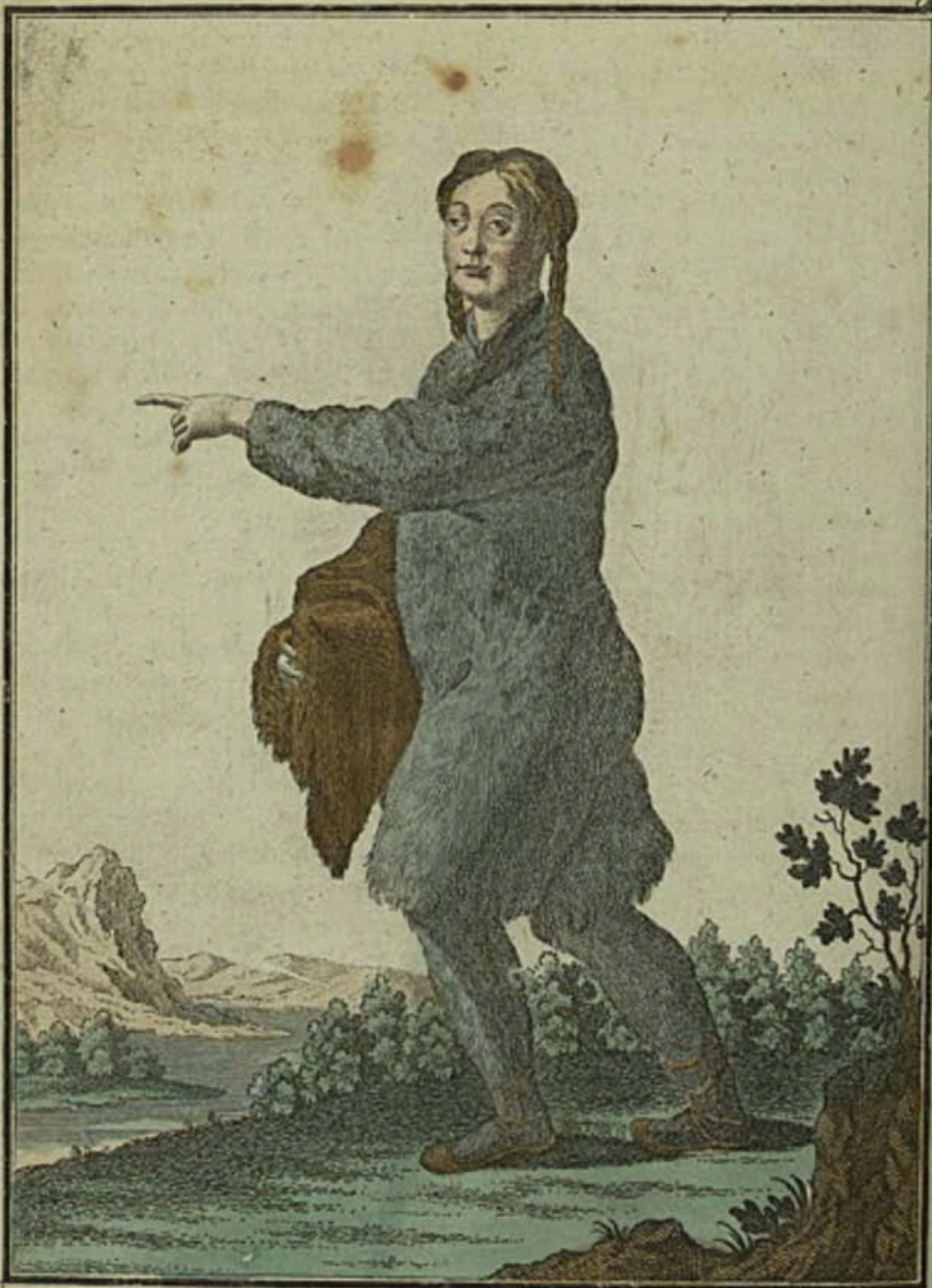
Чукотская баба въ обыкновенную одежду. Eine Tschuktschin angekleidet. Femme Tschouktchiene en son habit ordinaire.