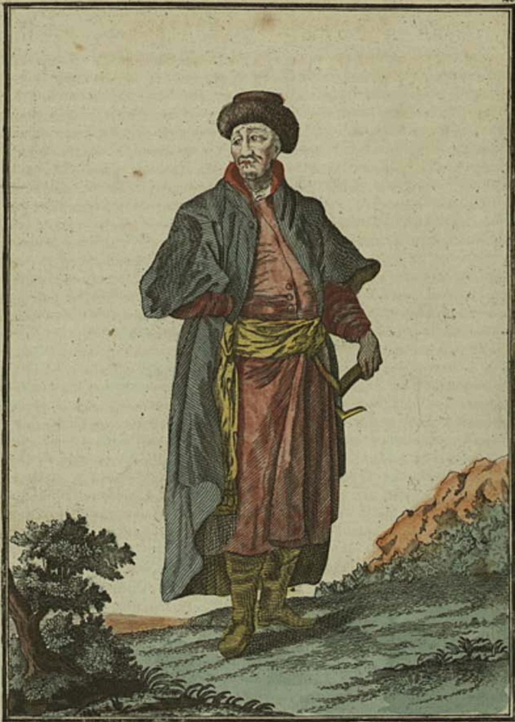
Казанскоу Татаринѣ . Ein Kasanischer Tattar . Tattare de Kasan .