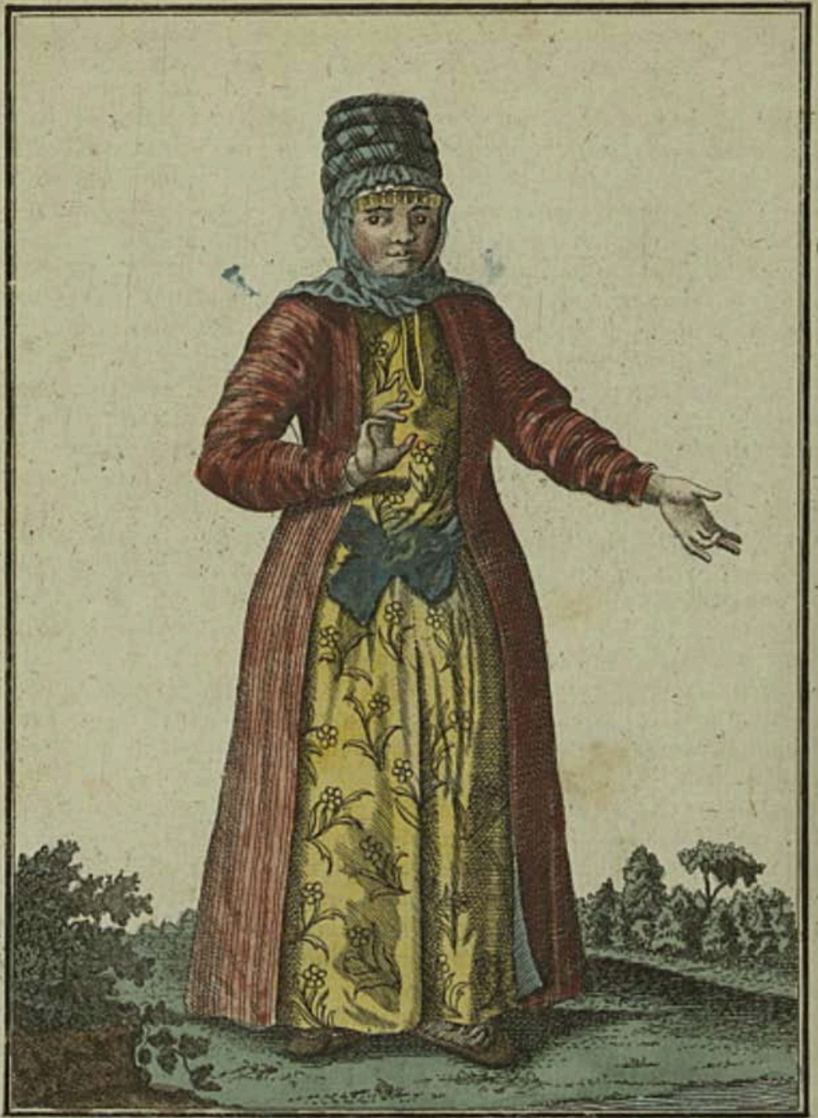
Kirgizka съ лица. Eine Kirgizin vorwärts. Une Kirgizienne par devant.