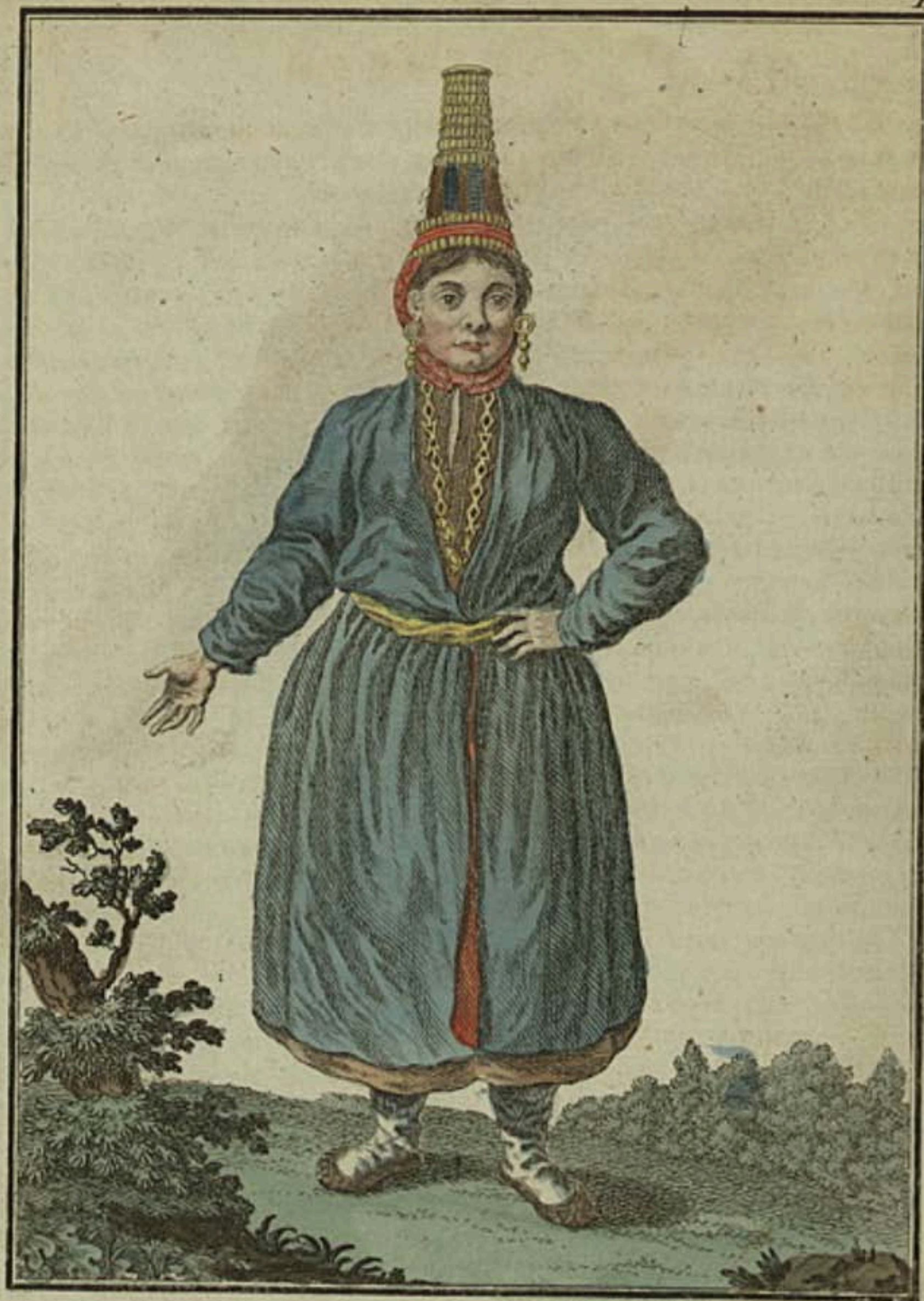
Черемиска спередн. Eine Tcheremisin vorwärts. Femme Tcheremisse par devant.