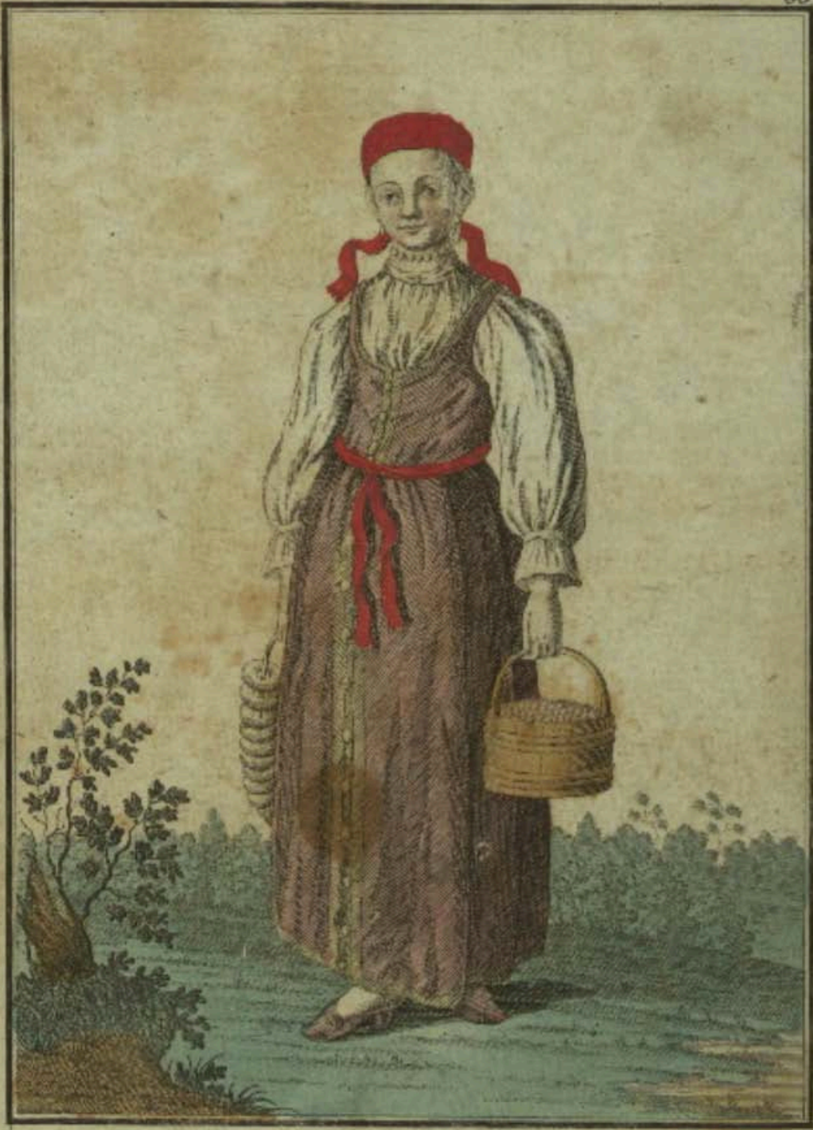
Бараніка. Аіока. Ein Waldaiſch. Mädchen. Une Fille de Waldai.