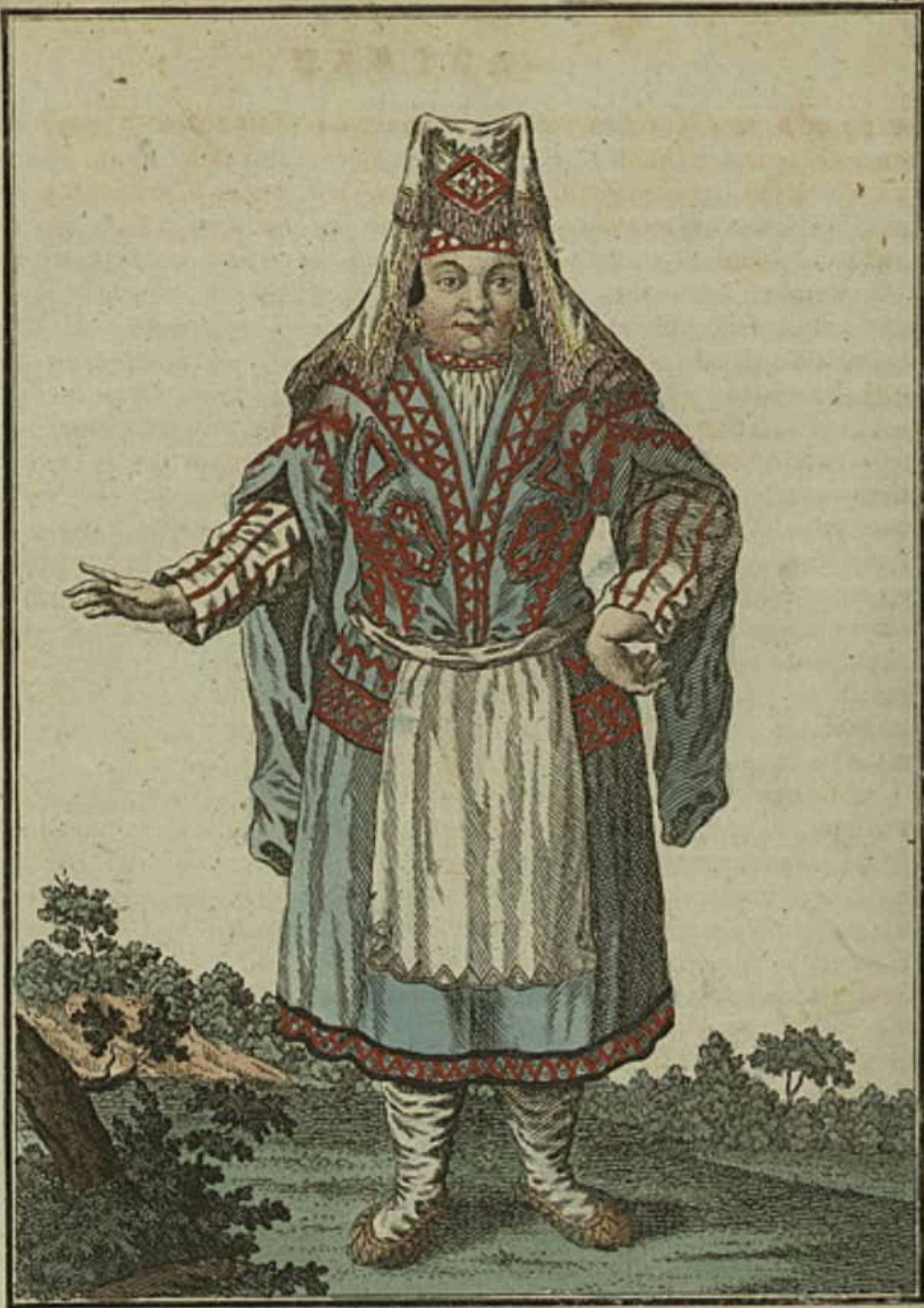
Вотявка. Eine Wotiakin. Feme Wotiakiene.