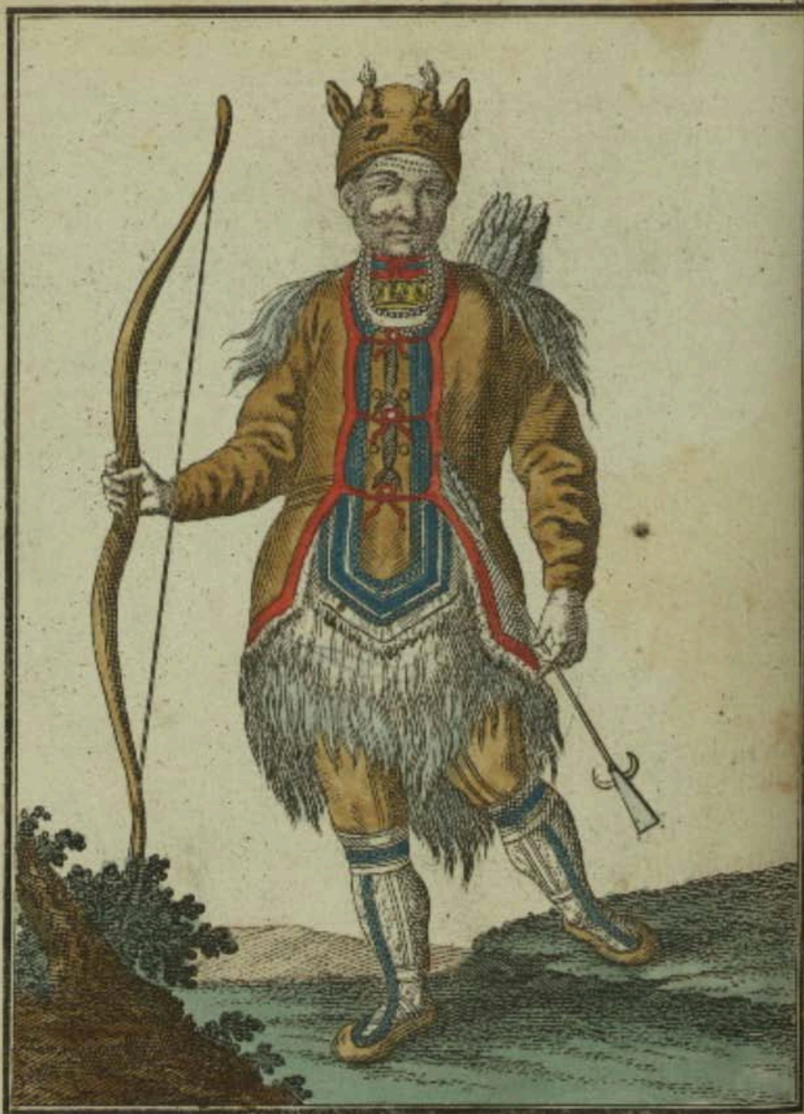
Алунгузъ. Ein Tungus. Un Toungoise.