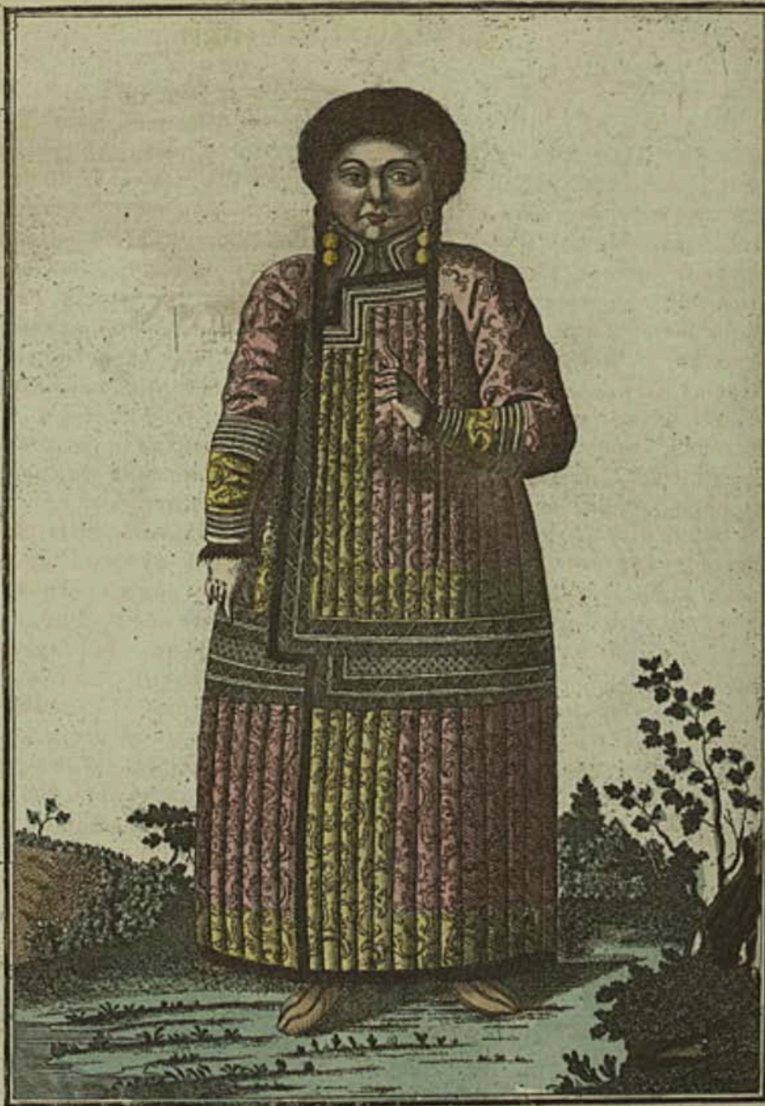
Качинская татарская баба . Ein Katschinskisches Tataren Weib . Femme tatare de Katchin .