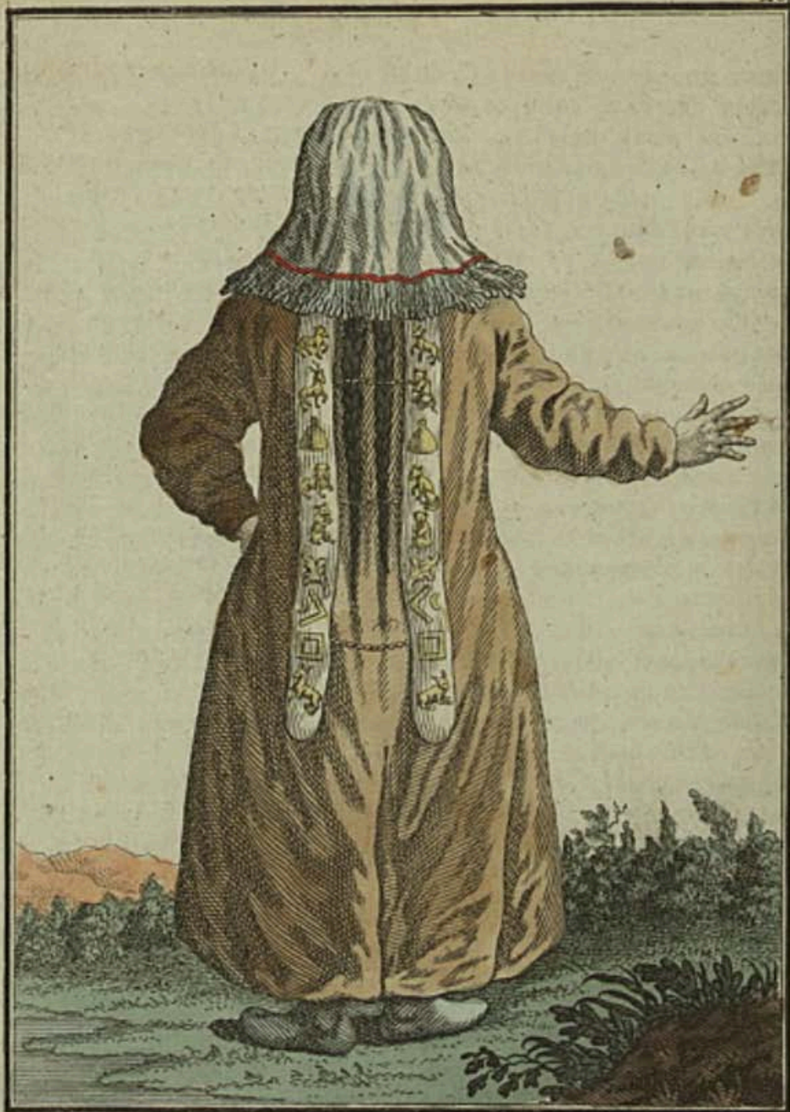
Остіявка съ пыла. Eine Ostiakin rückwärts. Une Ostiake par derrière.