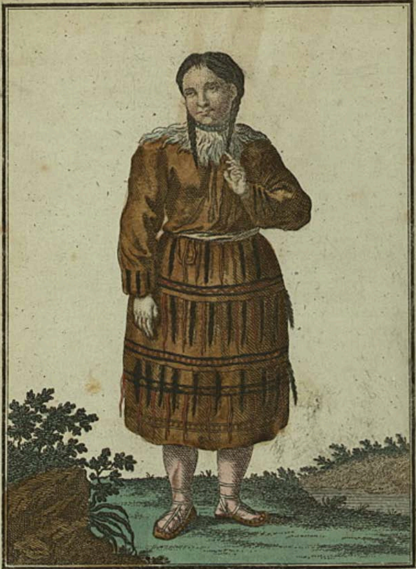
Камчадалка въ великолѣпномъ уборствѣ Eine Kamtschadalin im grössten Schmuck. Une Kamtschadale dans sa plus grande parure.