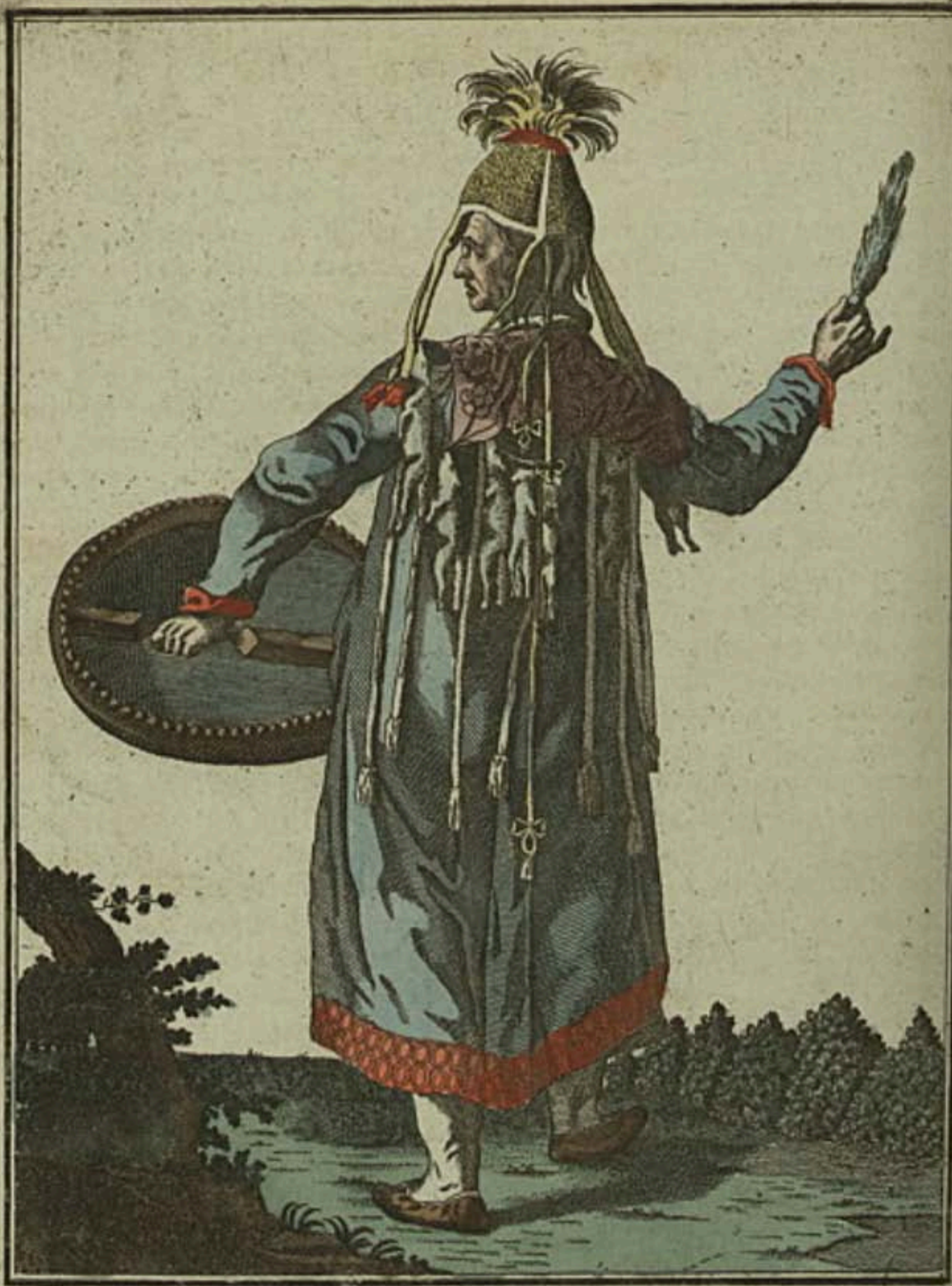
Шаманка красноярская съ пѣла . Eine Krasnojarskische Schamanka rückwärts . Une Chamane ou Devineresse de Krasnojarsk par derrière .