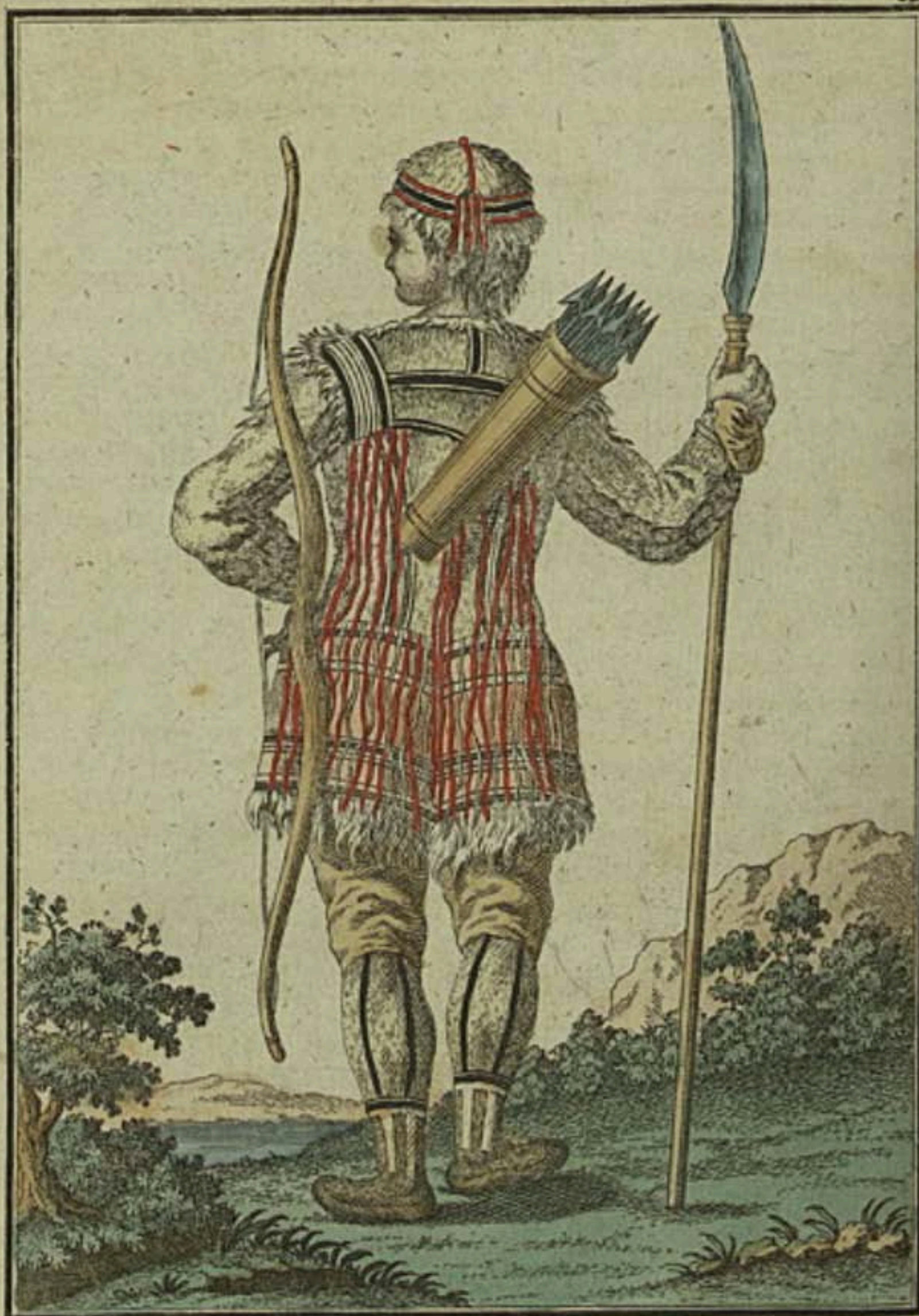
Тунгузъ въ охотничьемъ платьѣ съ пыла. Ein Tungus im Jagd Kleid rückwärts. Un Tougouse en habit de chasse par derrière.