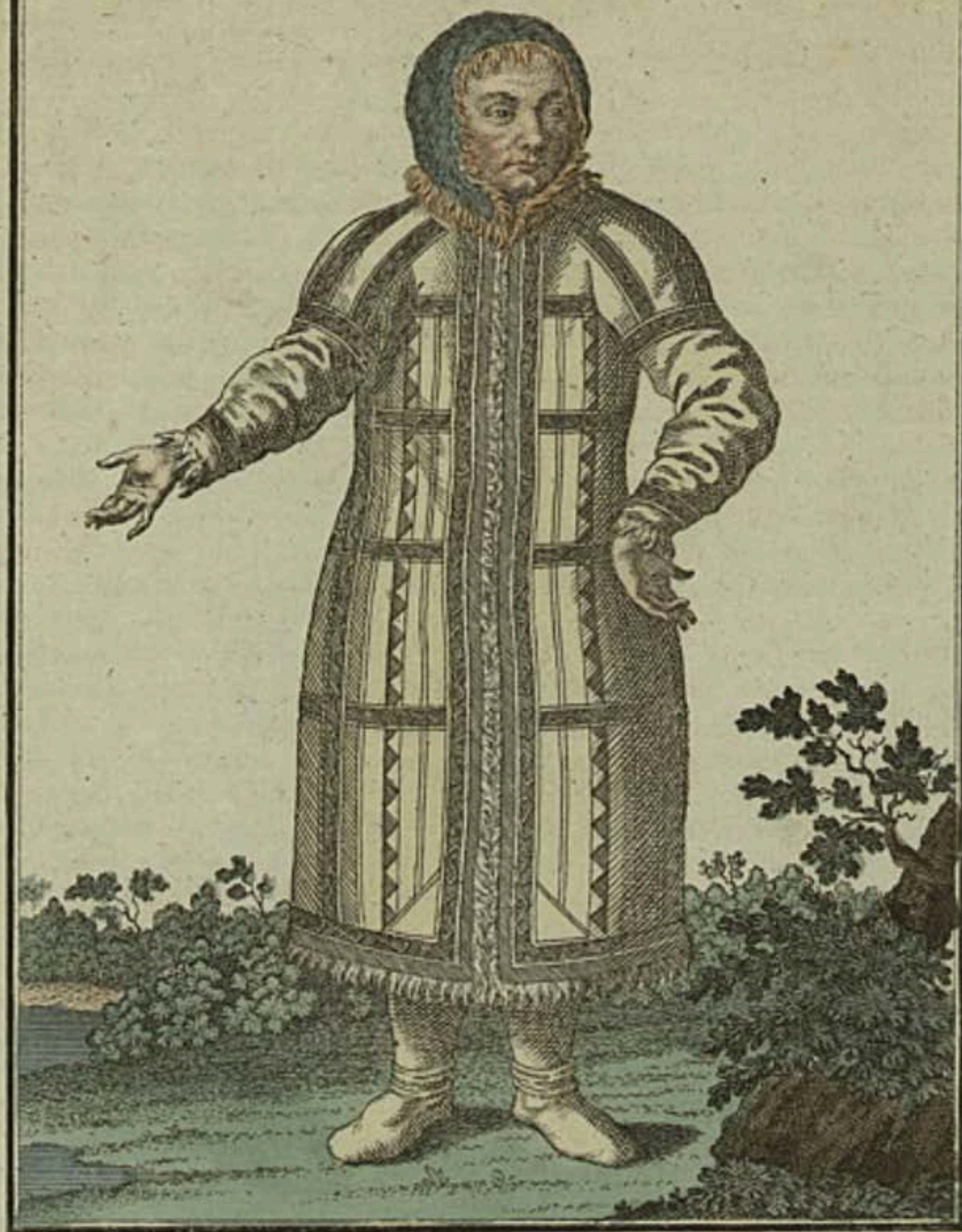
Остякъ при рѣкѣ Обѣ. Ein Ostiacke am Ob Fluss. Ostiak a la riviere d'Ob.