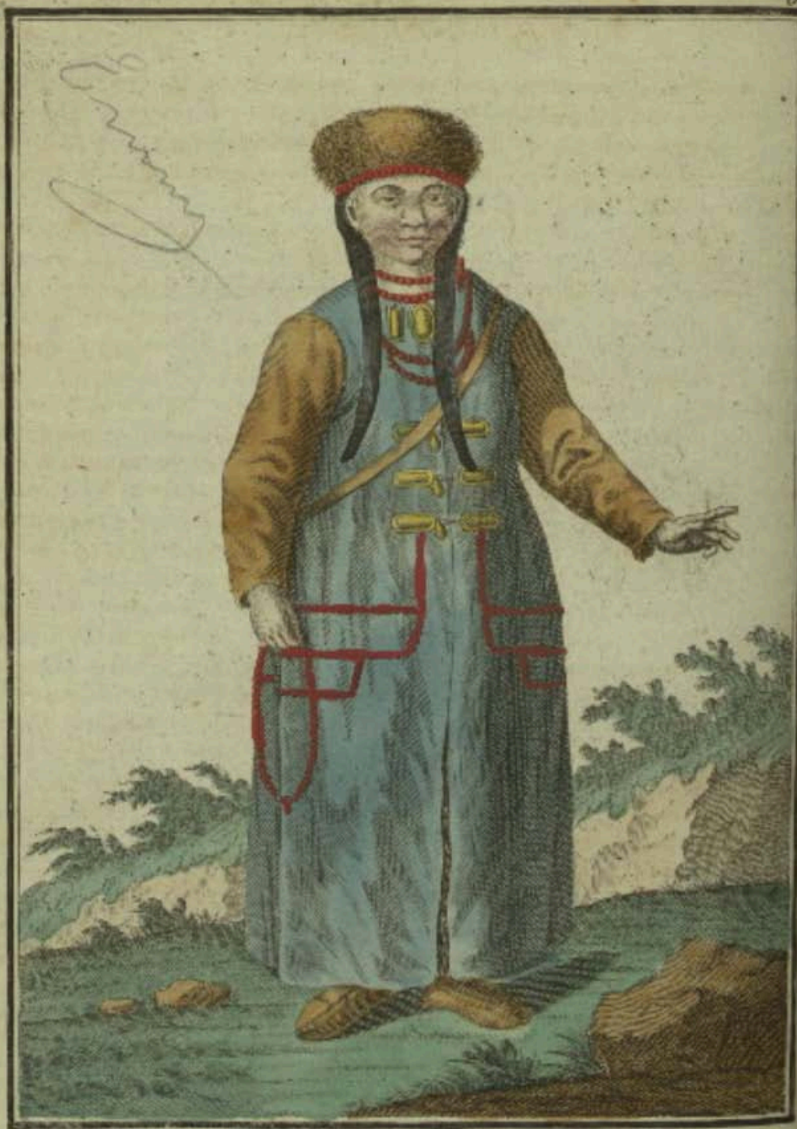
Монгг.ика. Eine Mongolische Frau. Femme Mongole.