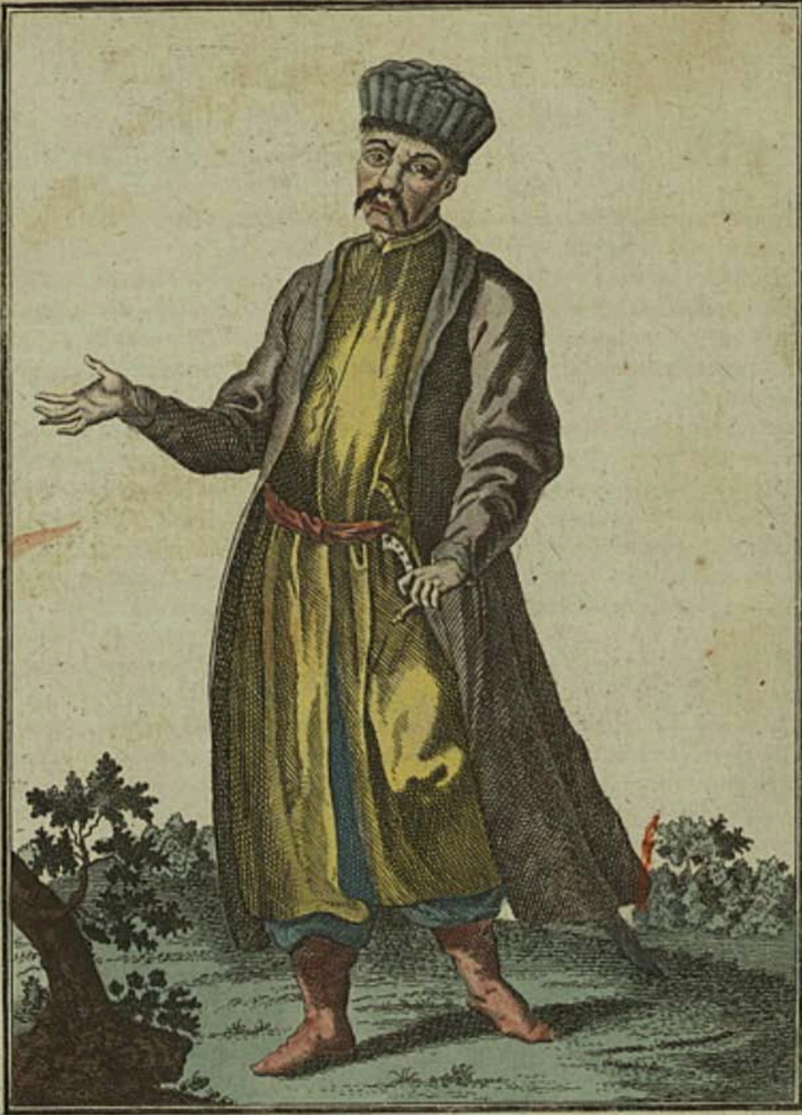
Кабардинецъ. Ein Kabardiner. Un Kabardinien.