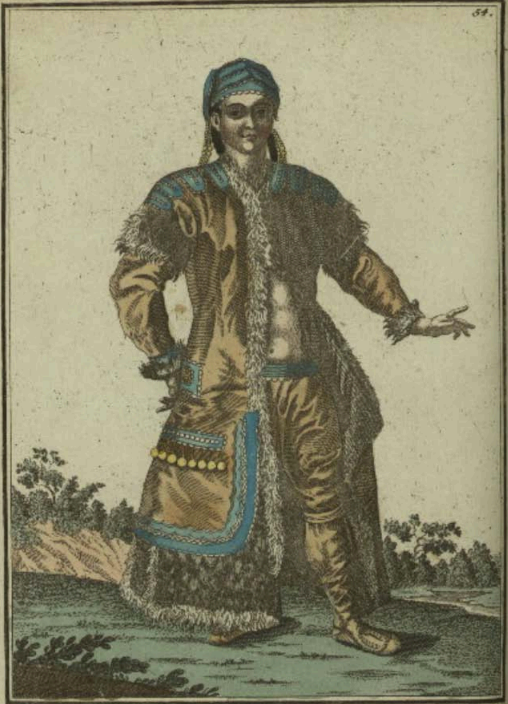
Якутская дѣвка съ лица. Ein Jakutisches Mägdgen vorwärts. Fille Jakoute par devant.