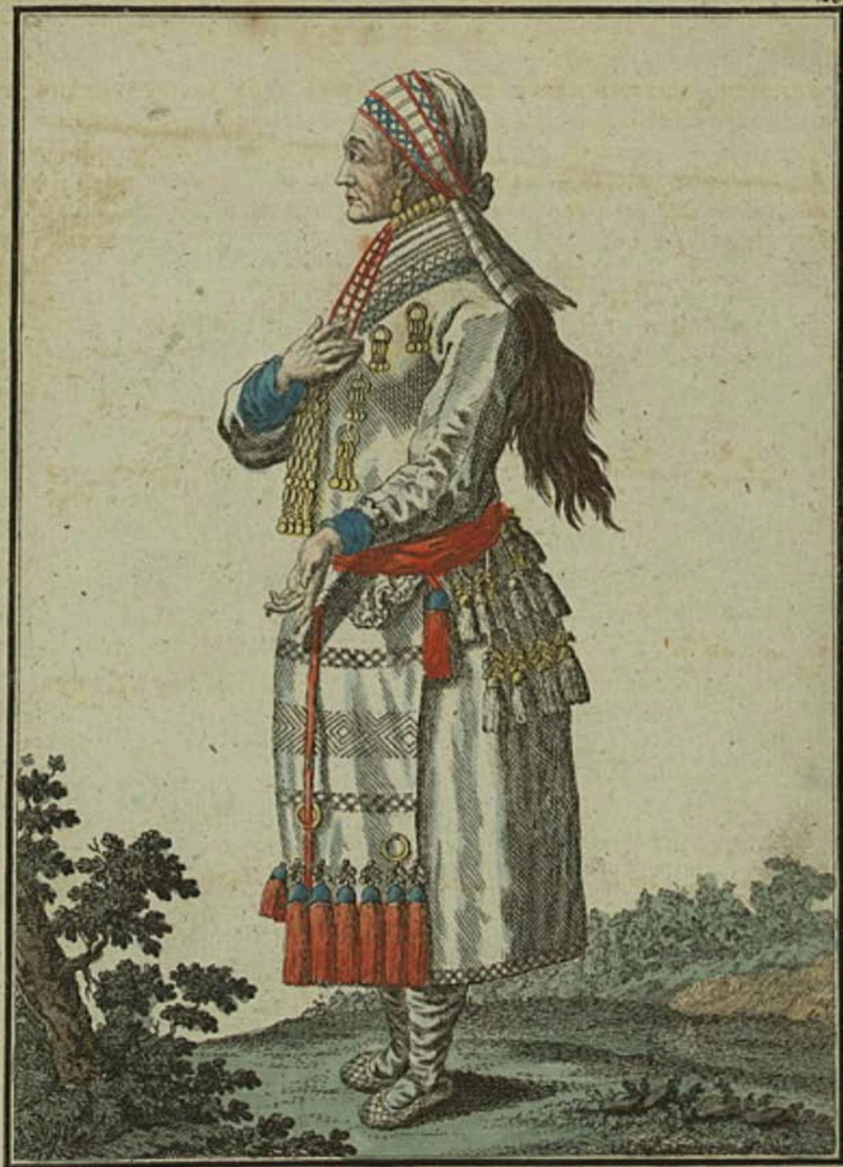
Старуха Мокшанская. Ein altes Weib aus Mockschan. Vieille femme de Moquechaine.