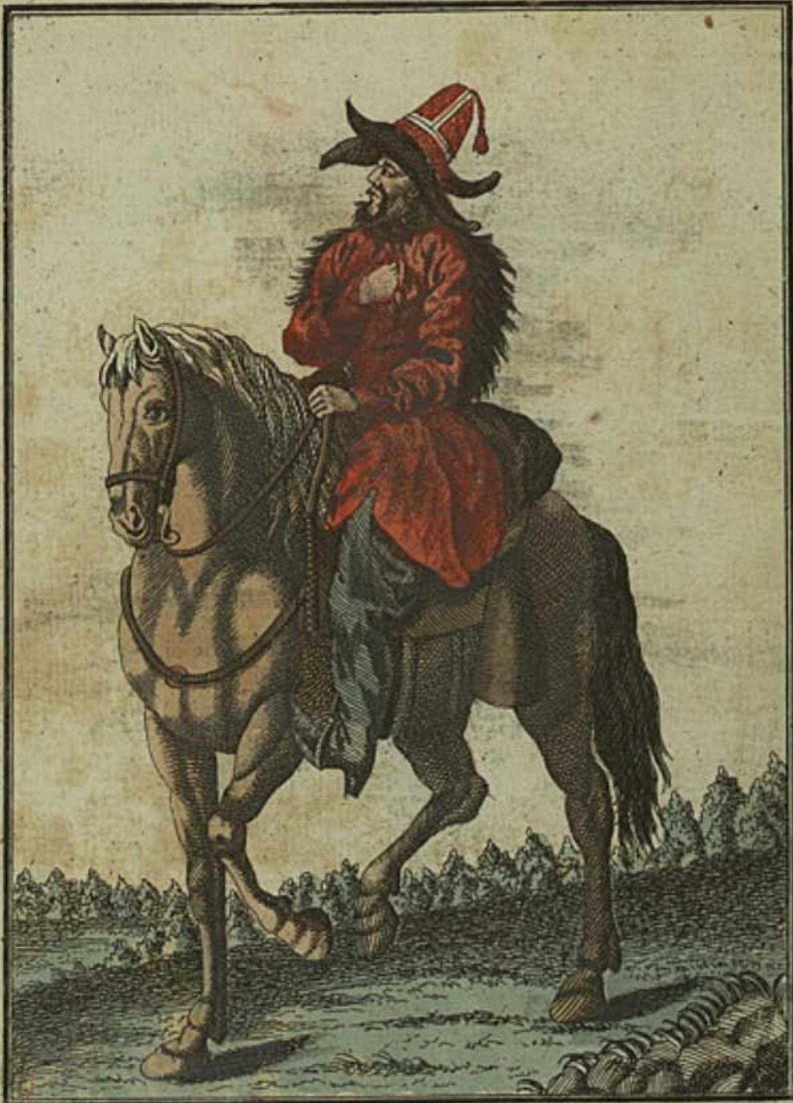
Киргизецъ на конѣ. Ein Kirgise zu Pferde. Kirgise a cheval.