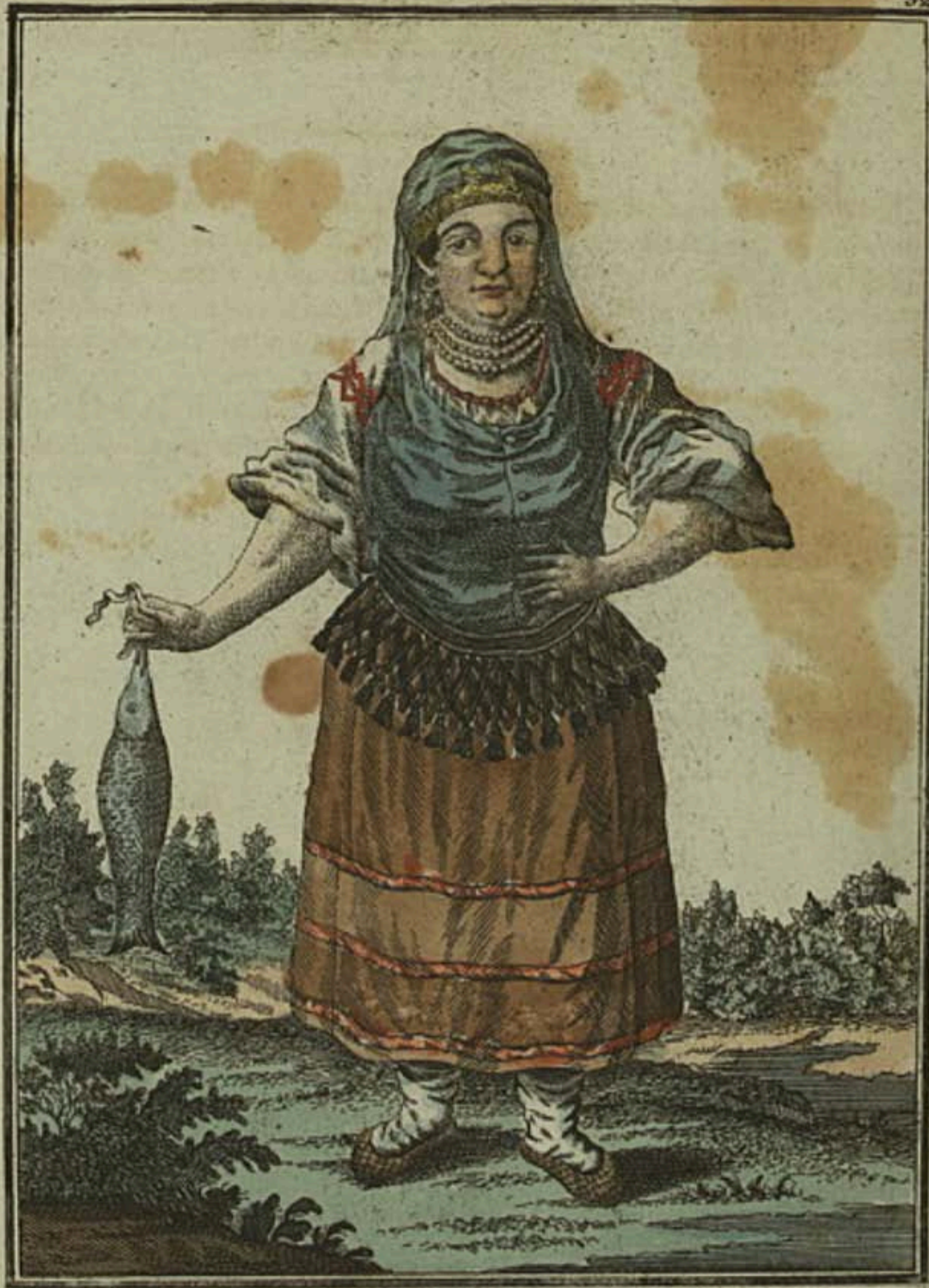
Кабардинка . Eine Kabardinerin . Une Kabardinienne .