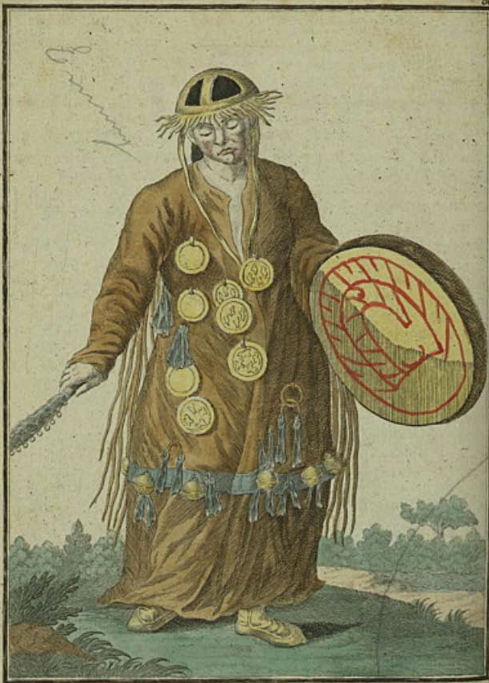
Монгольская Шаманка. Eine Mongalische Schamanka od. Wahrsagerin. Chamane ou Devineresse Mongale.