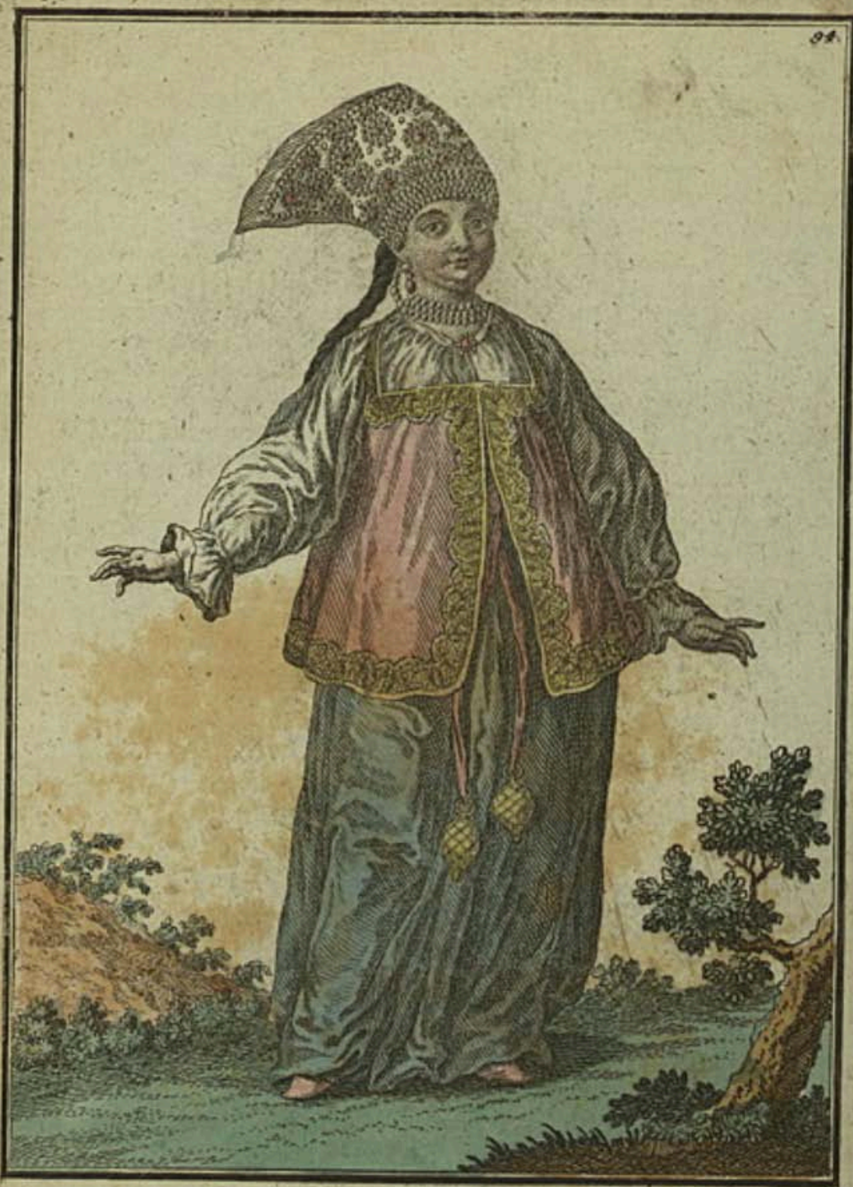
Калужская дѣвица спереди. Eine Jungfer aus Kaluga vorwärts. Fille de Kaluga par devant.