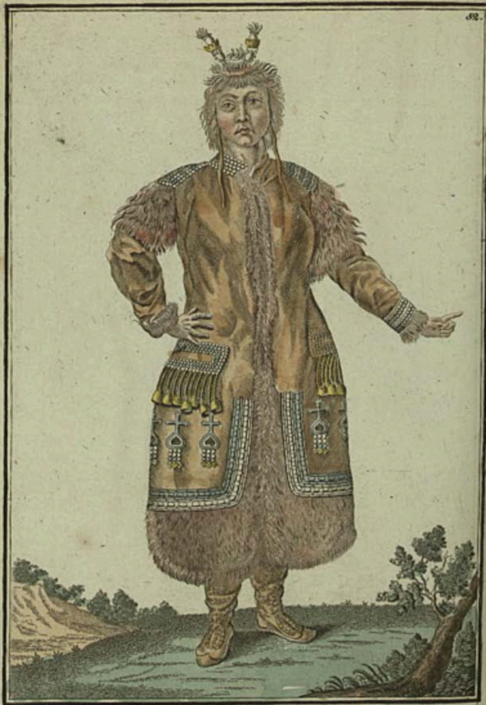
Якутская баба спереди. Une Tackutin vorwärts. Femme Yakoute par devant.