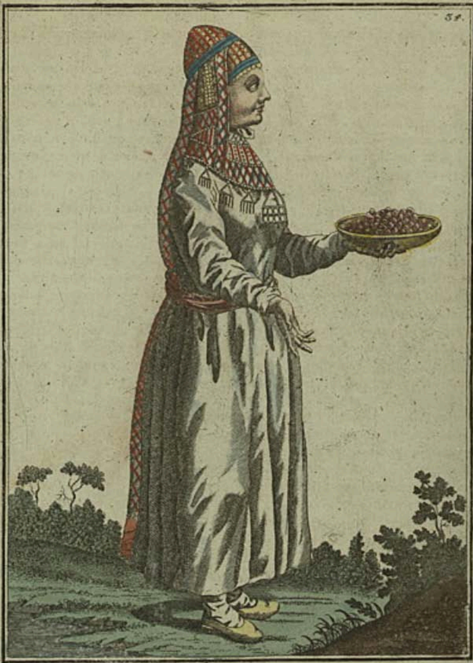
Башкупка Eine Baschkurin Une Baskirienne.