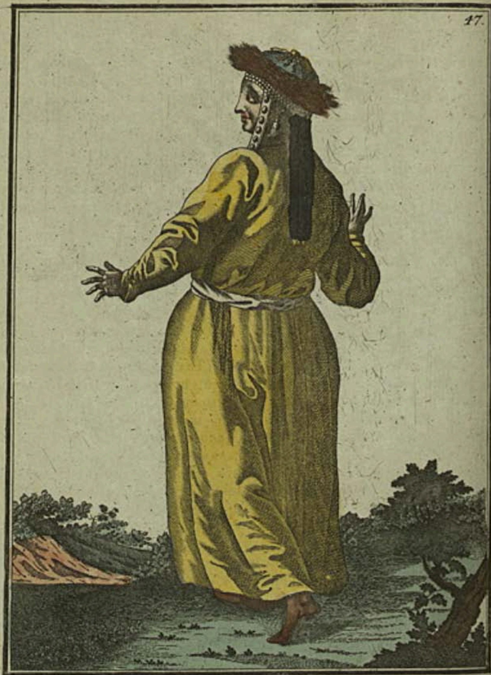
Татарская баба от Кузнецк съ тыла Ein Tatarisches Weib zu Kousnetzck rückwärts Femme tatare à Kousnetzck par derrière