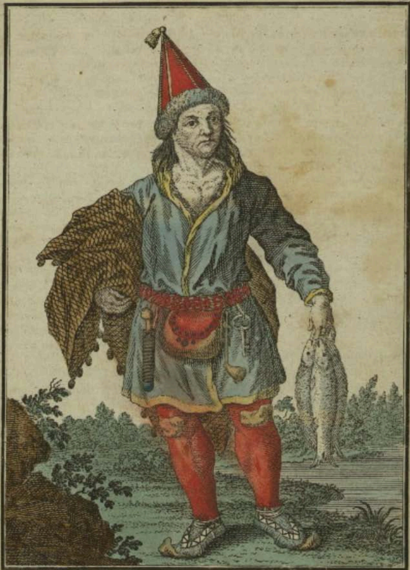
Лопаръ. Ein Lappländer. Un Lapon.