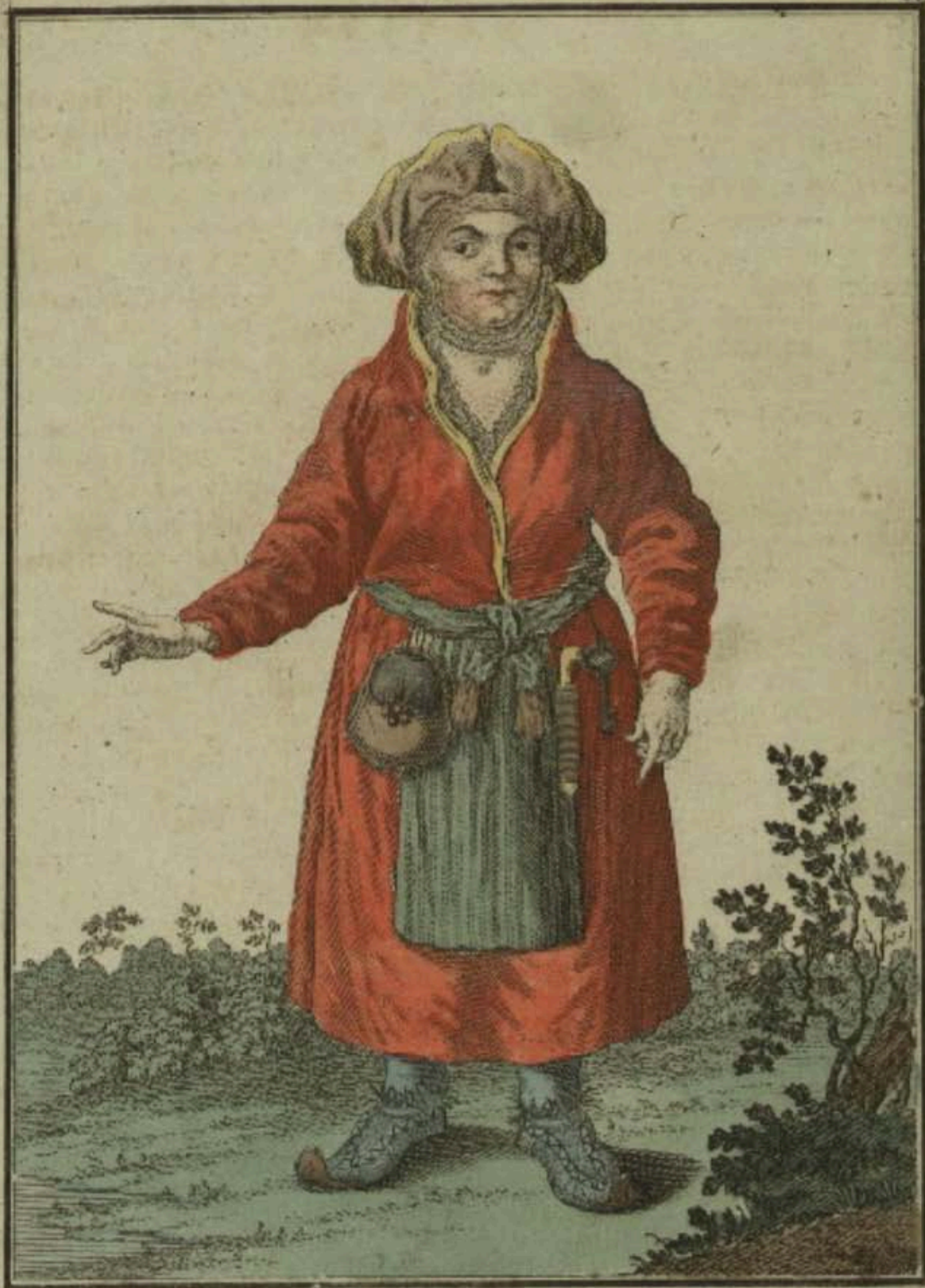
Лопарская баба. Eine Lappländische Frau. Une femme laponne.