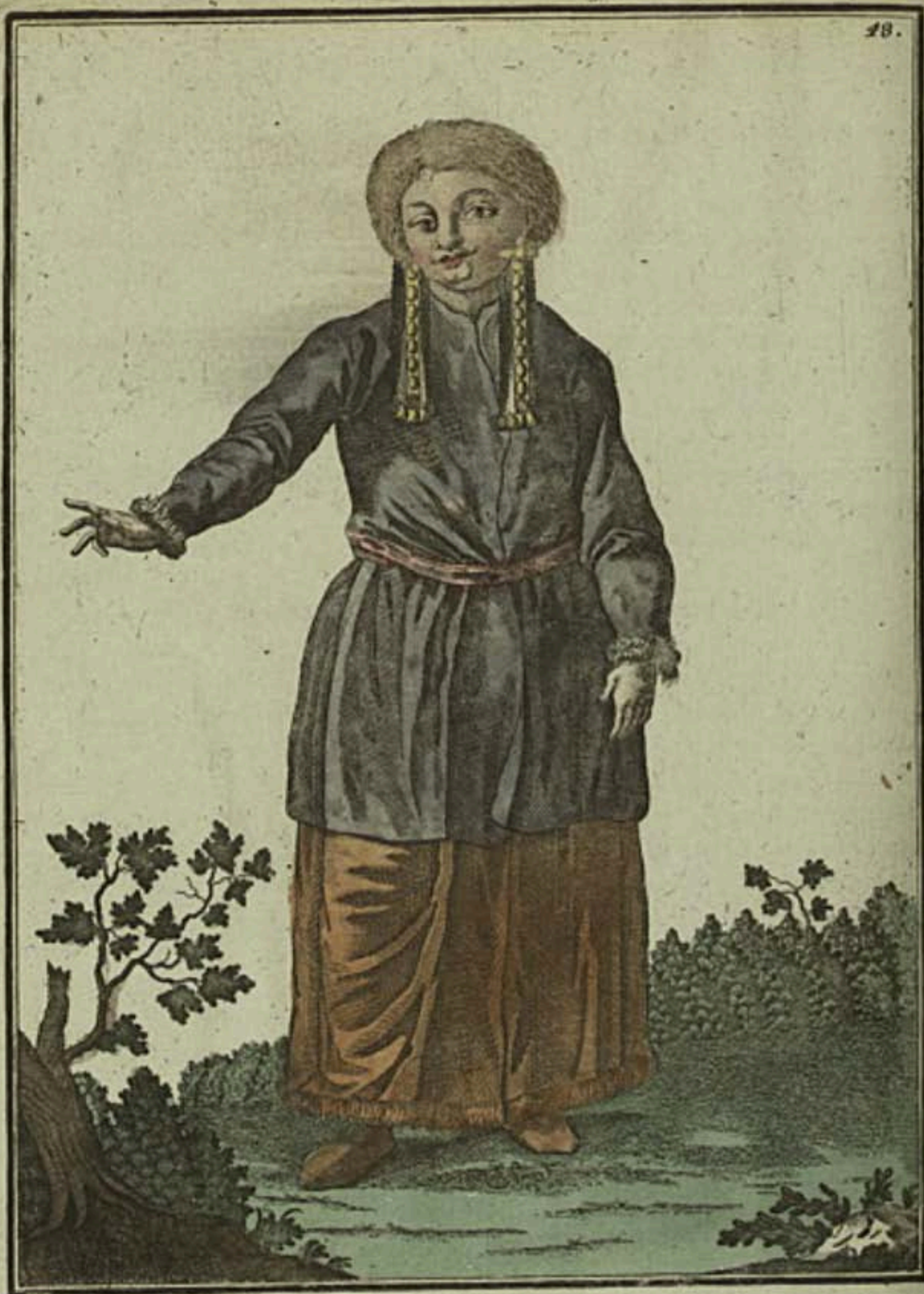
Татарская дѣвушка въ Кузнецкѣ съ лица . Ein Tatarisch Mäddgen zu Kusnetzck vorwärts . Fille tatarre à Kousnetzck par devant .