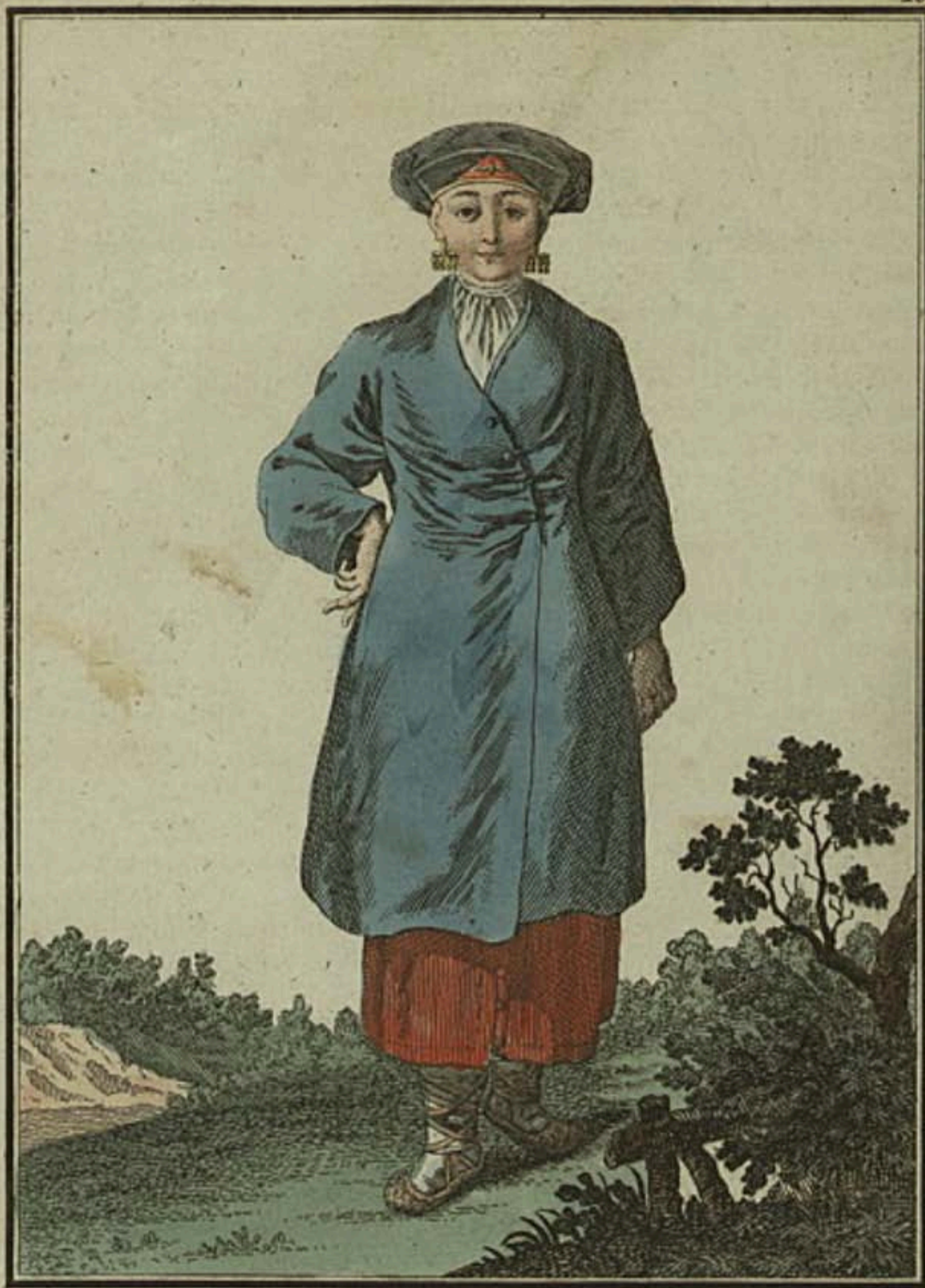
Ингерская крестьянская баба. Ein Ingermanlandisches Bauern Weib. Paysanne d'Ingrie.