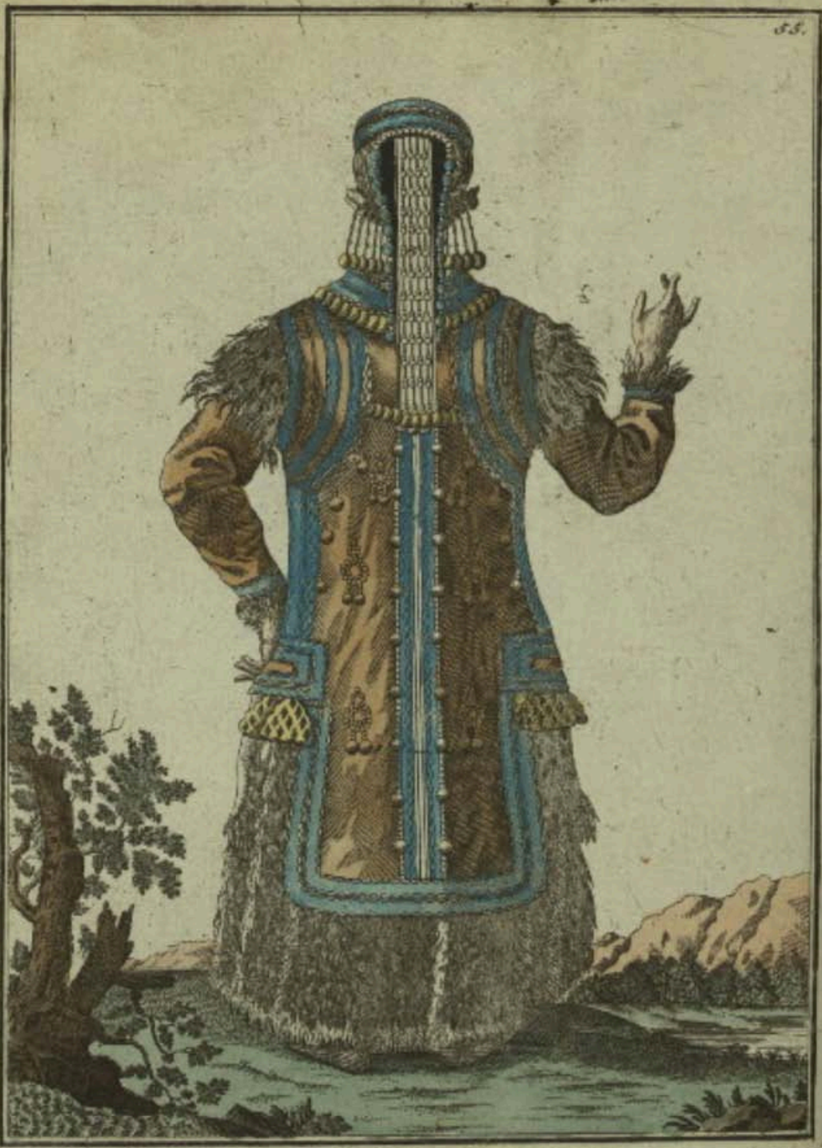
Якутская дѣвка со спиною. Ein Jakutisches Mädchen rückwärts. Fille Jakoute par derrière.