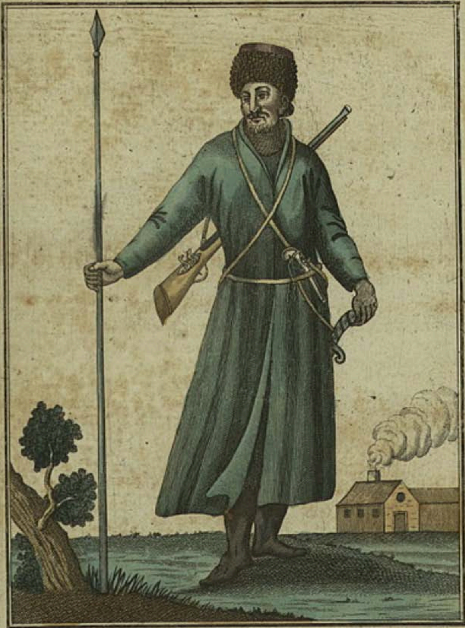
Донскій Козакъ. Ein Donische Cosacq. Un Cosaque Donois.