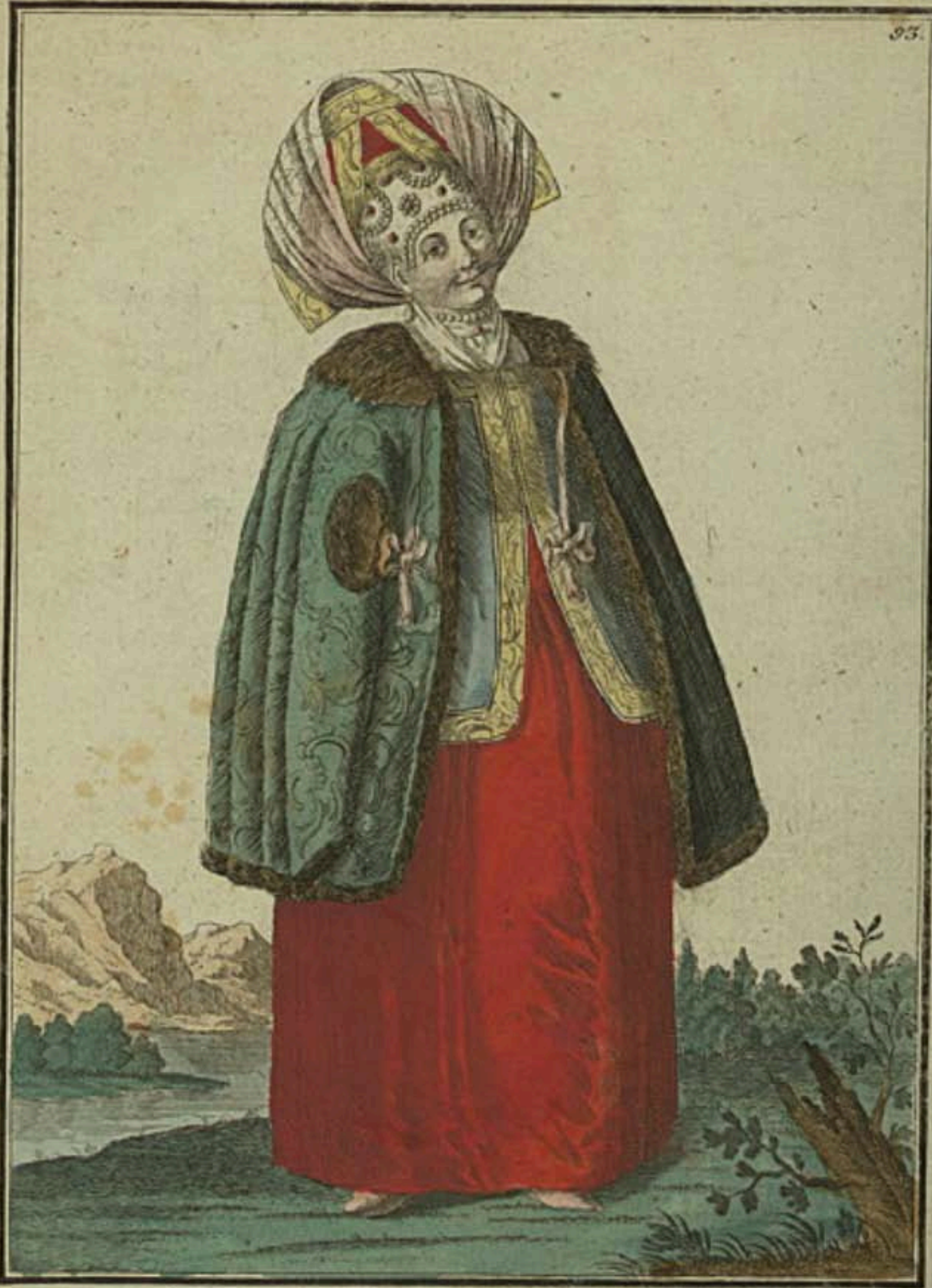
Калужская женщина въ зимнемъ платьѣ. Eine Kalugische Frau im Winterkleide. Une Femme de Kalouga en habit d'hiver.