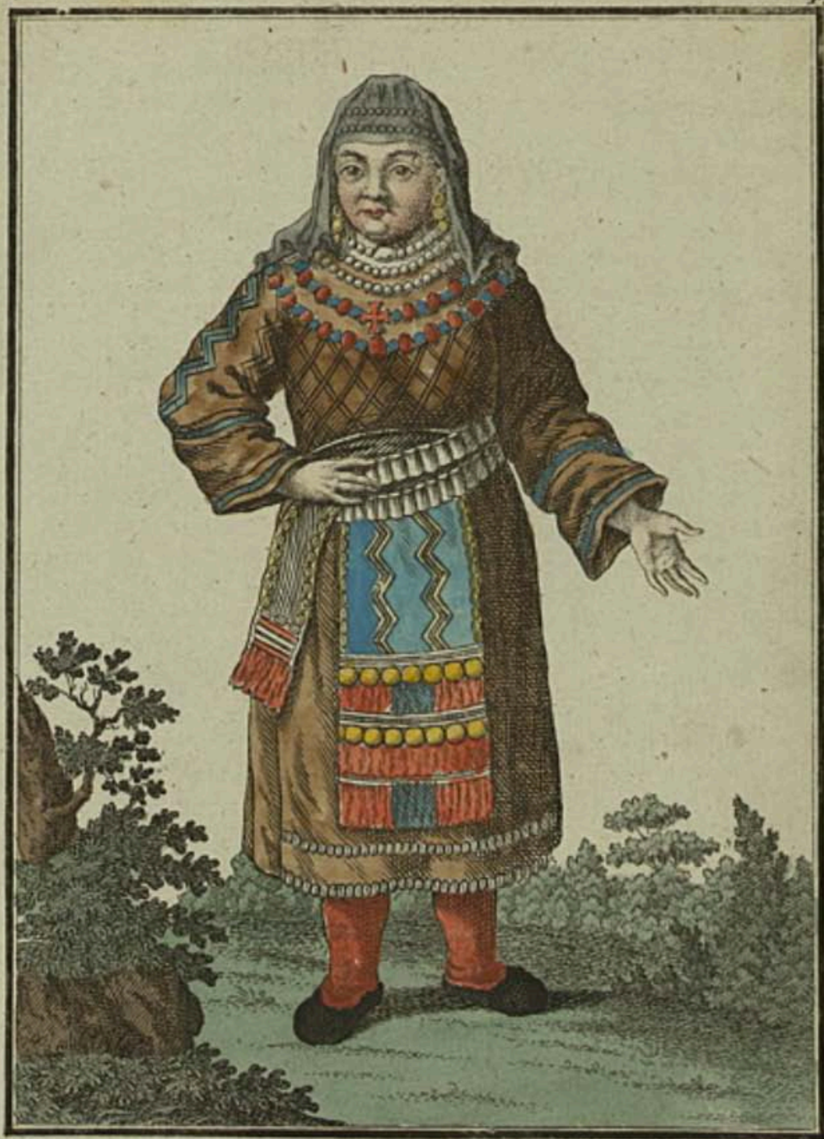
Финская крестьянская баба. Ein Finnisches Bauern-Weib. Paysanne de Finlande.