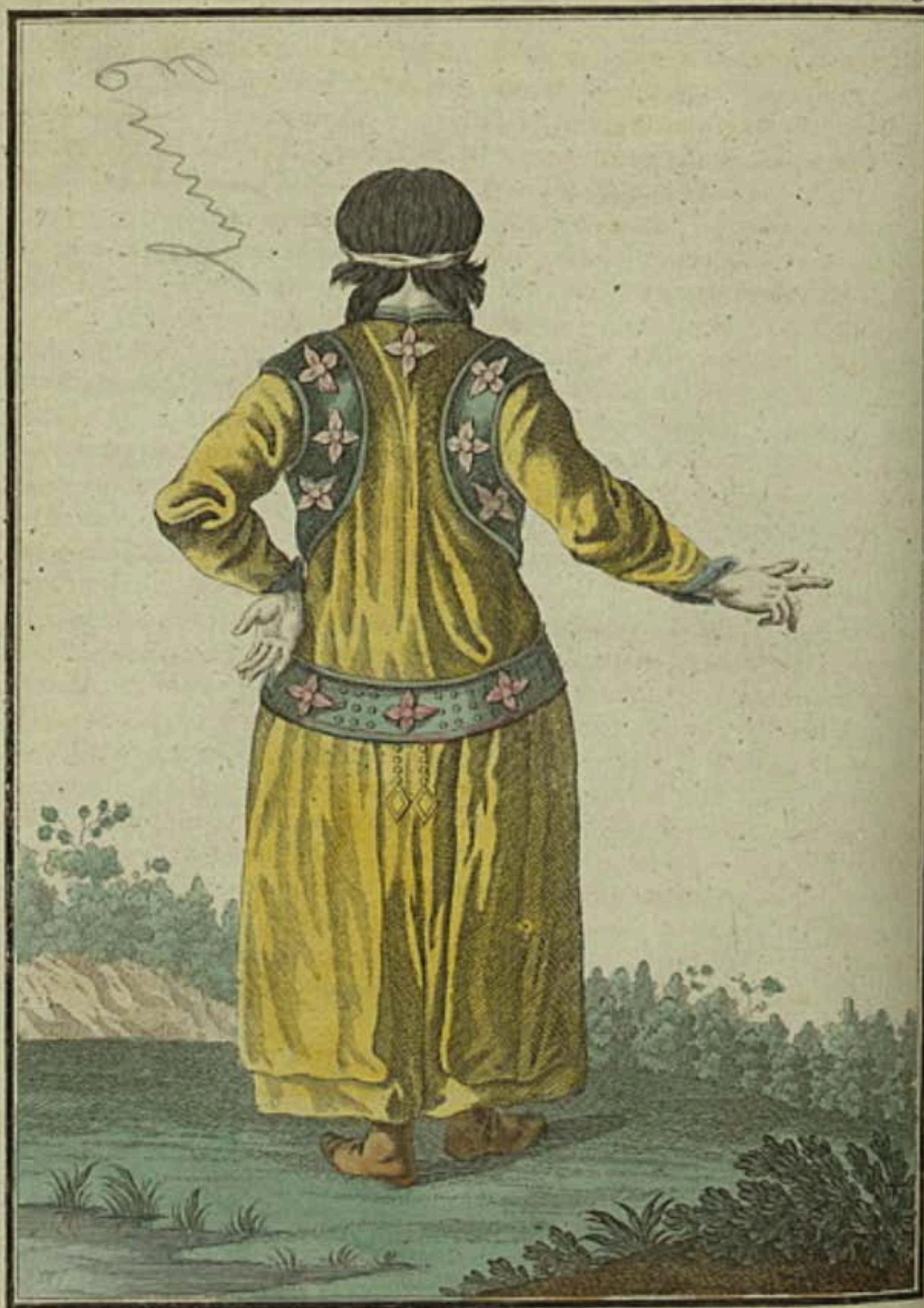
Брацкая баба въ Мінскаму Острогу съ тыла Ein Bratskisches Weib zu Mlinskoi Ostrog rückwärts Femme Bratskiene à Mlinskoy Ostrog par derrière