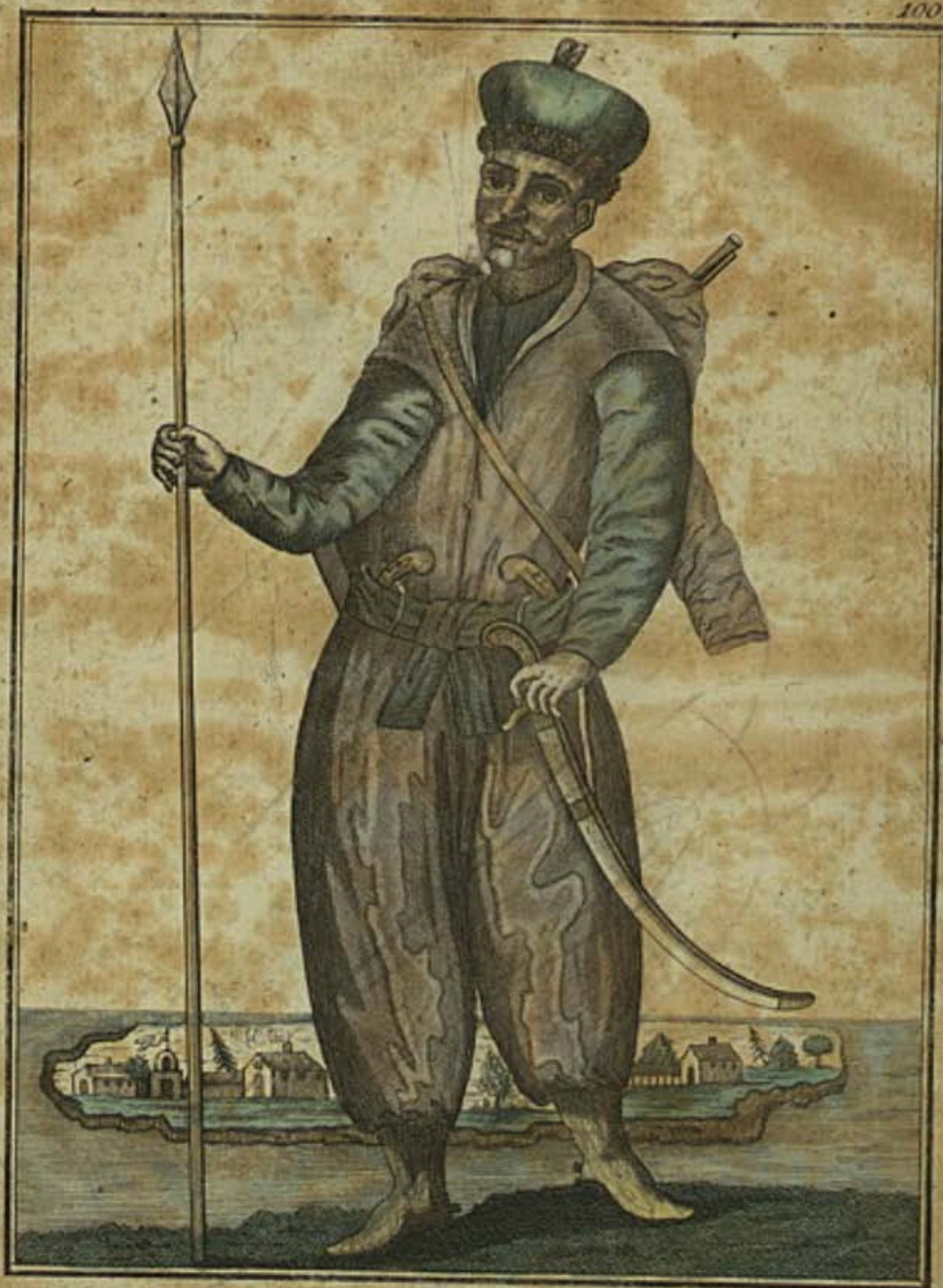
Черноморскій Козакъ. Ein Cossack vom Schwarzen See. Un Cossaque de la Mer Noire.