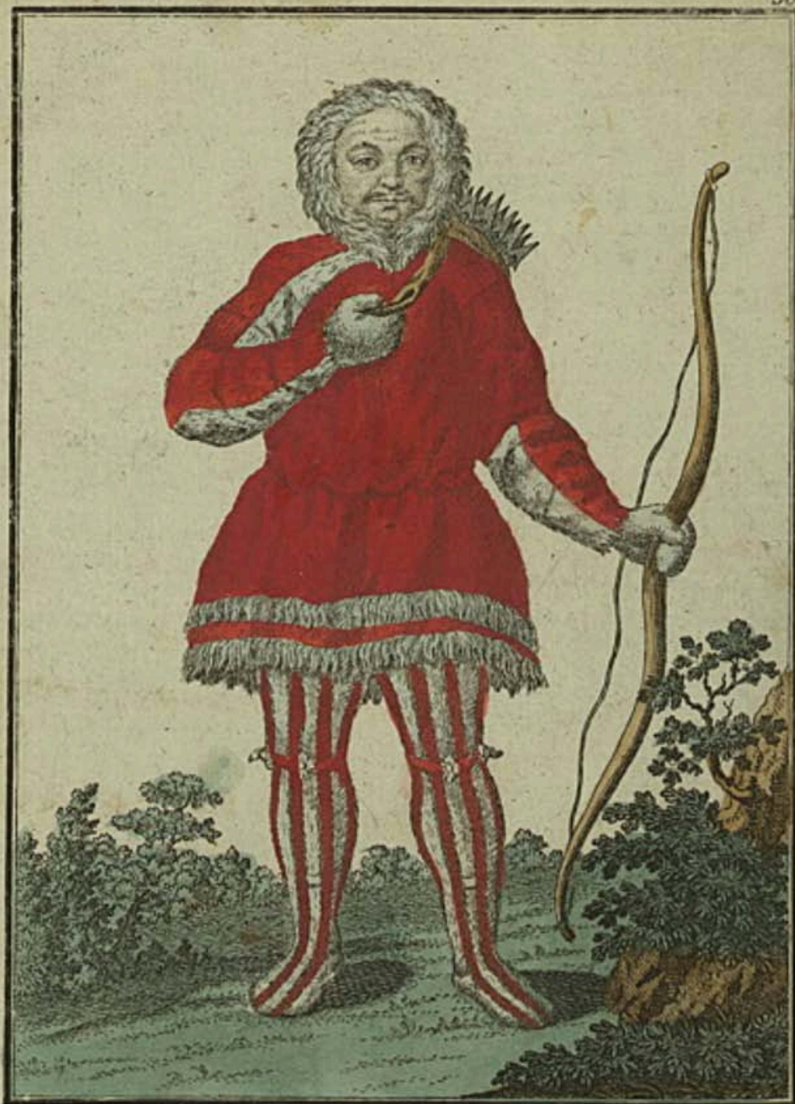
Самоедъ Ein Samojede Un Samiede