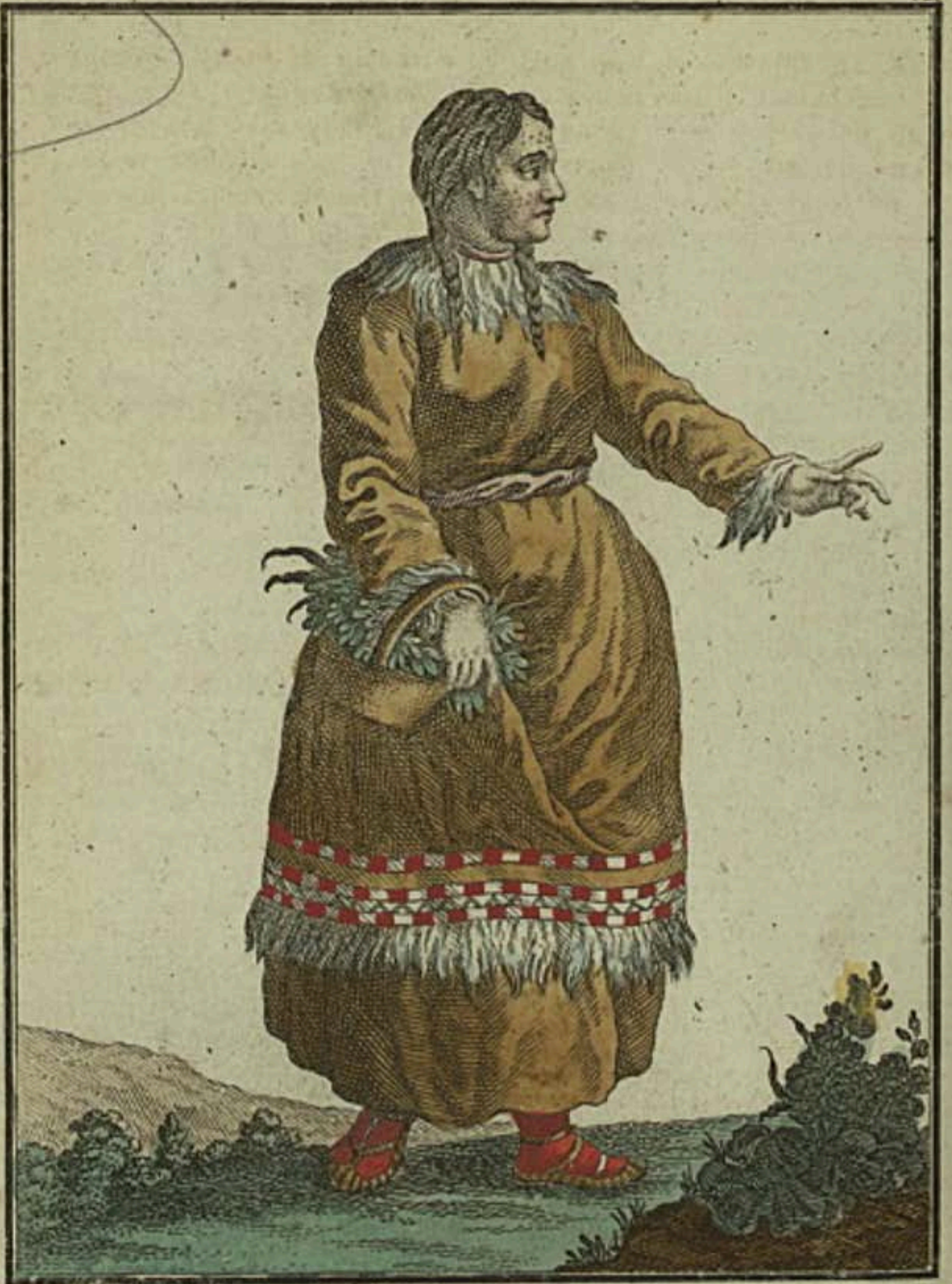
Korarka. Eine Korakin. Une Korakienne.