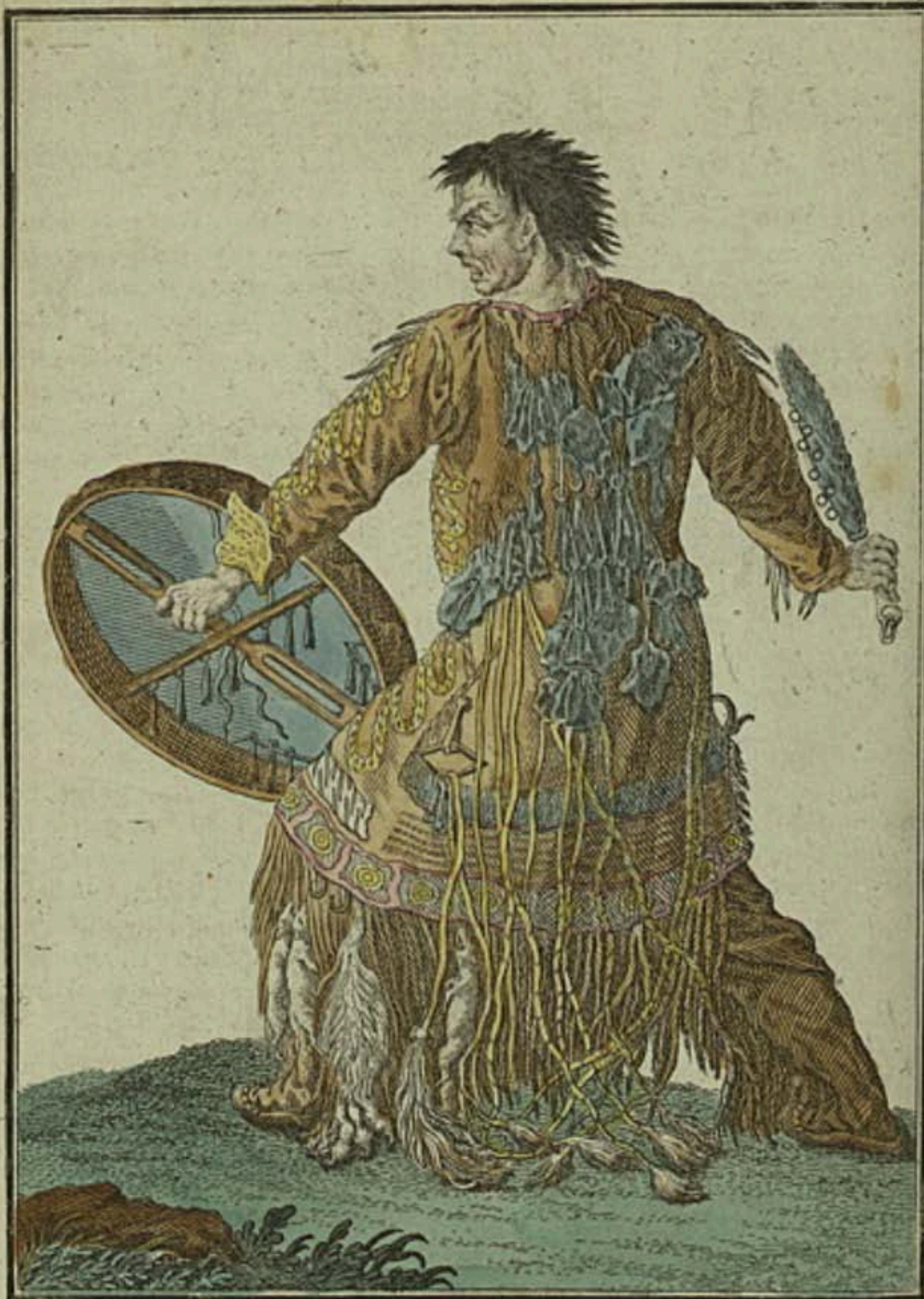
Шаманъ Камчатской. Ein Schaman in Kamtschatka. Devin de Kamtchatka.