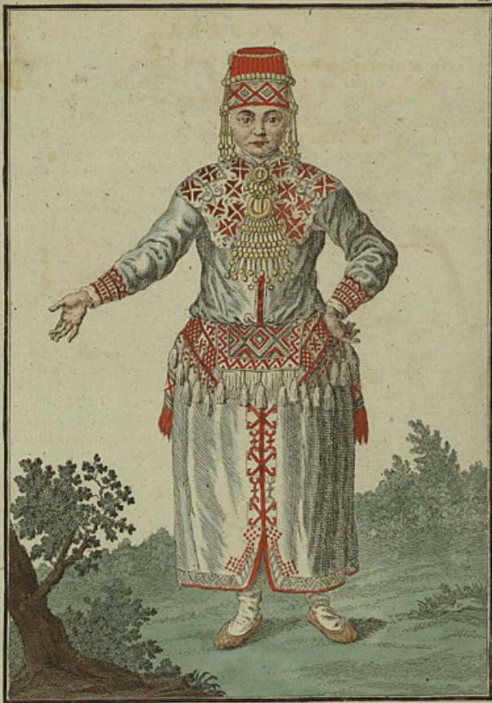
Мордовка съ лица Eine Morduanerin vorwärts. Femme Morducane par devant.