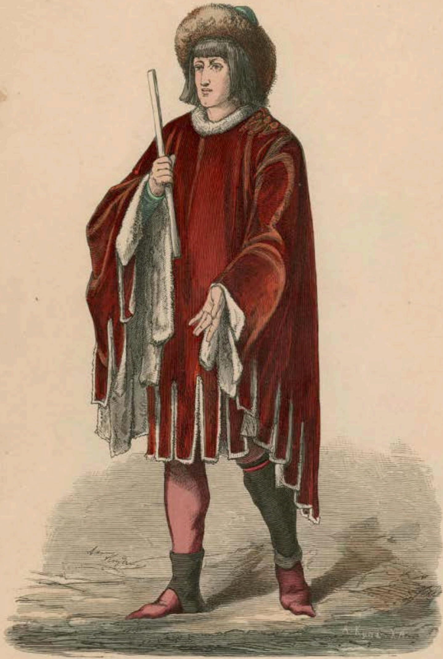
Burgundischer Fürst. Anfang des XV. Jahrhunderts.