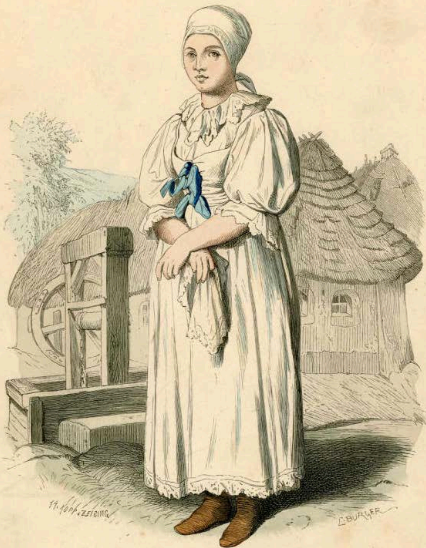
Slovakische Bäuerin aus dem Pressburger Comitatz (Ungarn) in Festtracht.