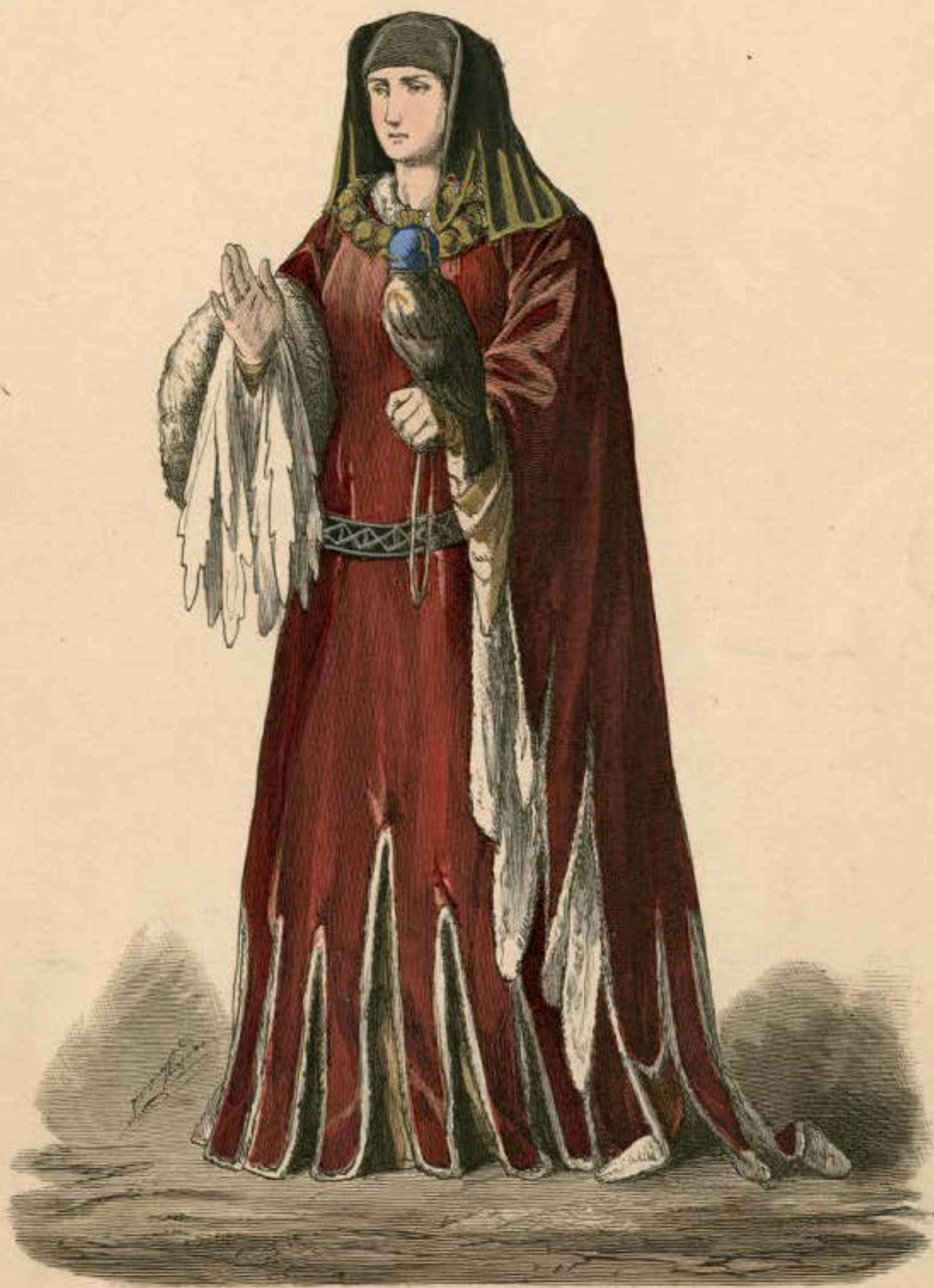
Burgundische Fürstin. Anfang des XV. Jahrhunderts.