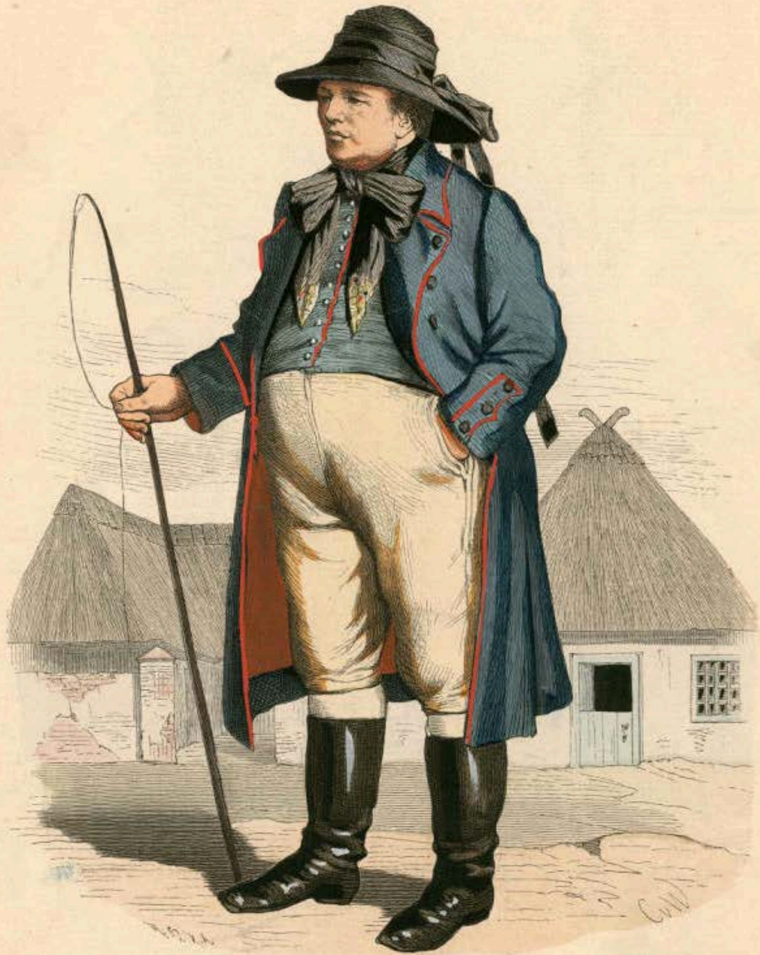
Pommerscher Bauer aus dem Weizacker (Kreis Pyritz).