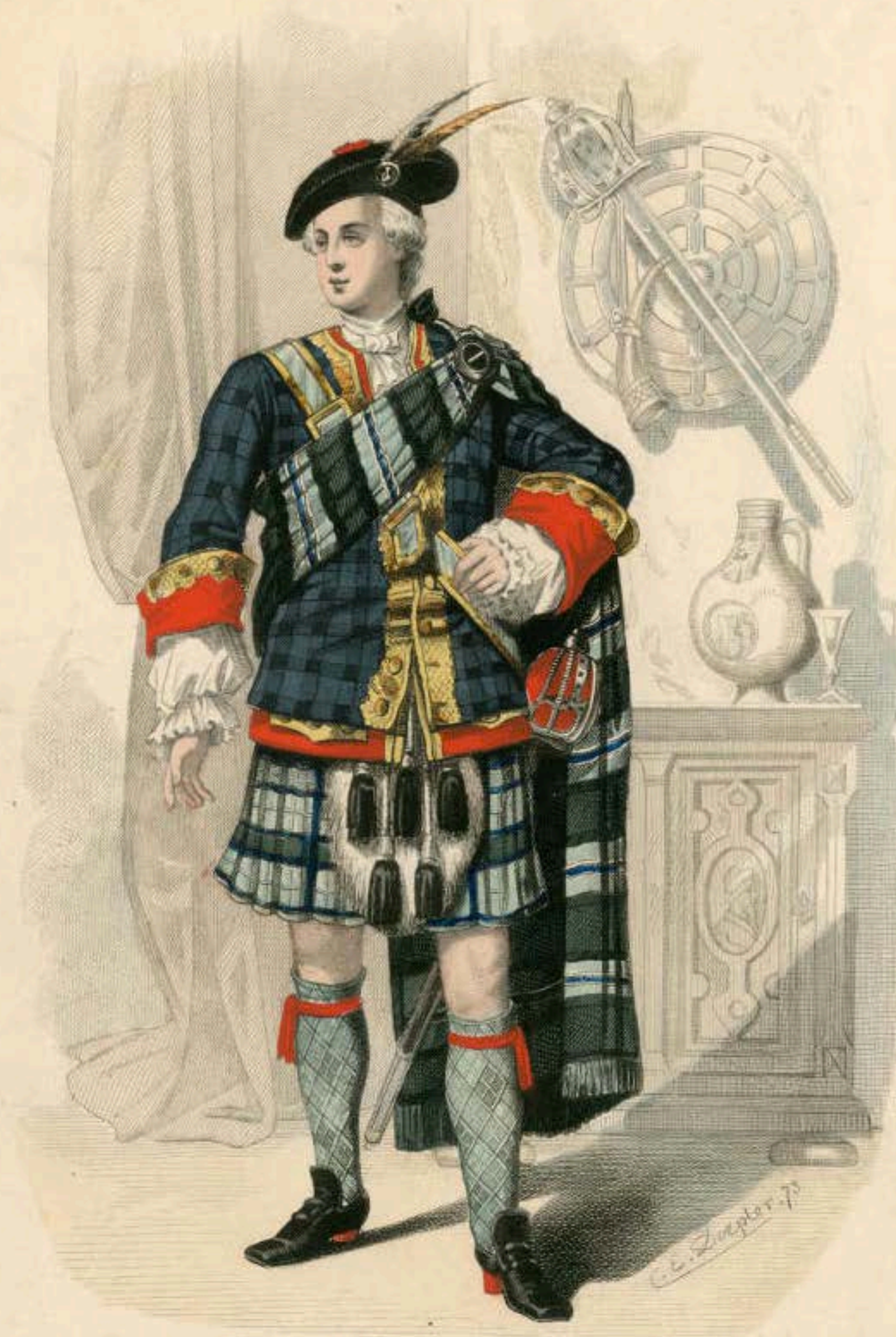
Schottischer Edelmann Anfang des 18 ten Jahrhunderts