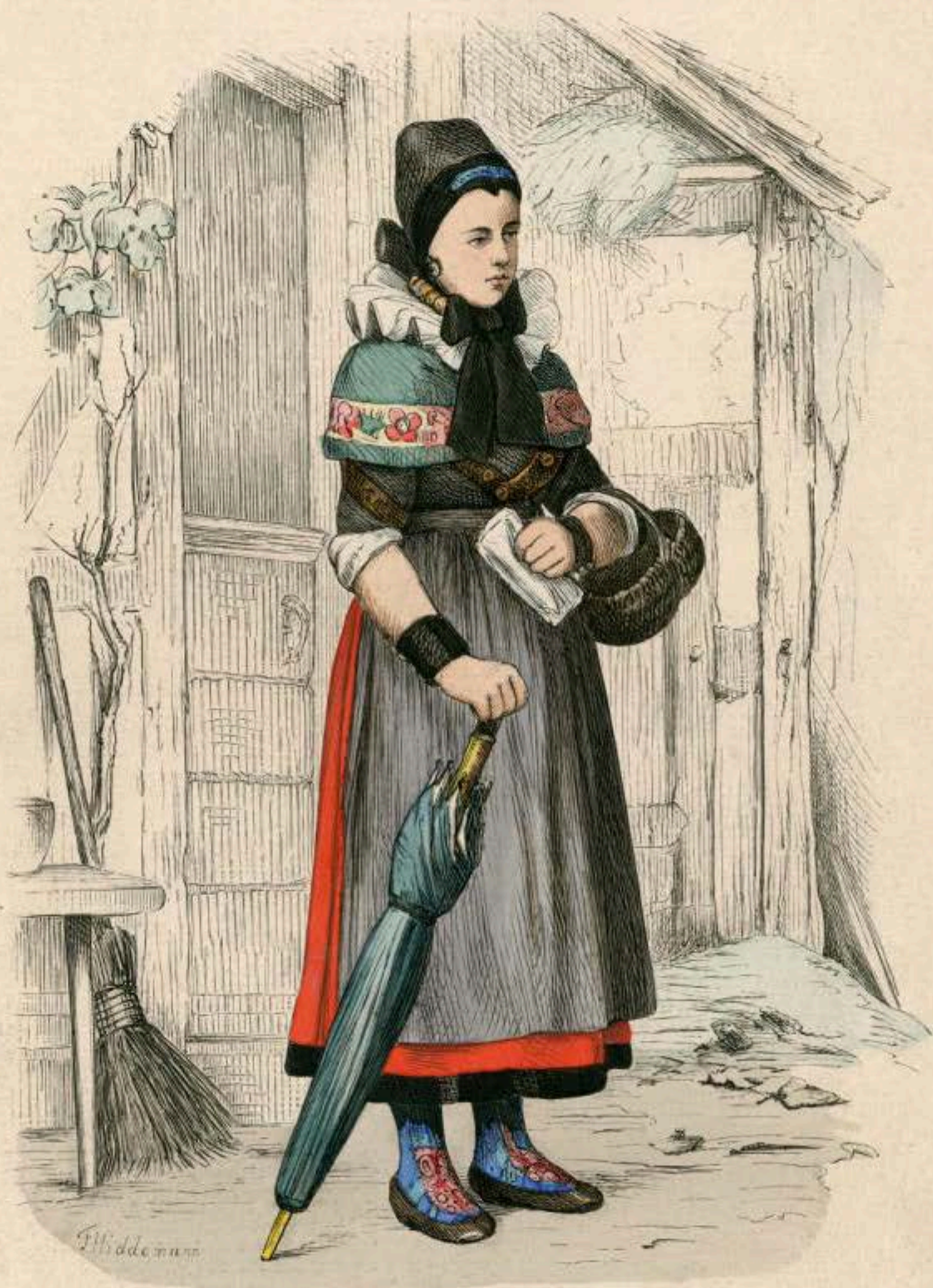
Bäuerin aus Klein-Bremen bei Minden (Westfalen).