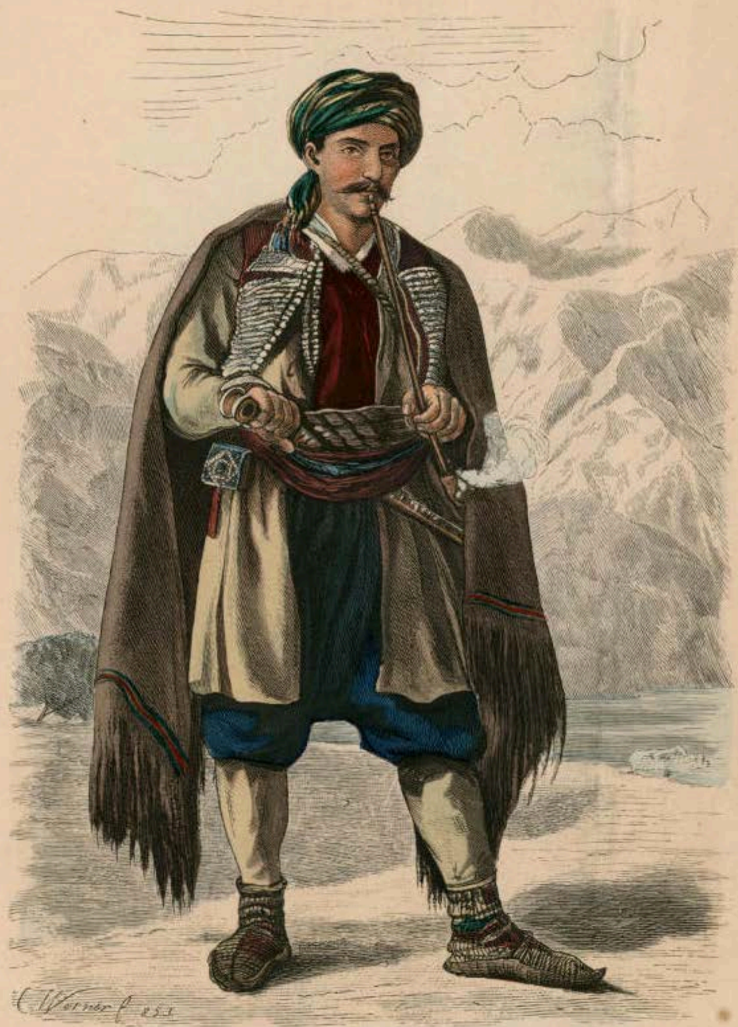
Montenegriner aus Cetinje.