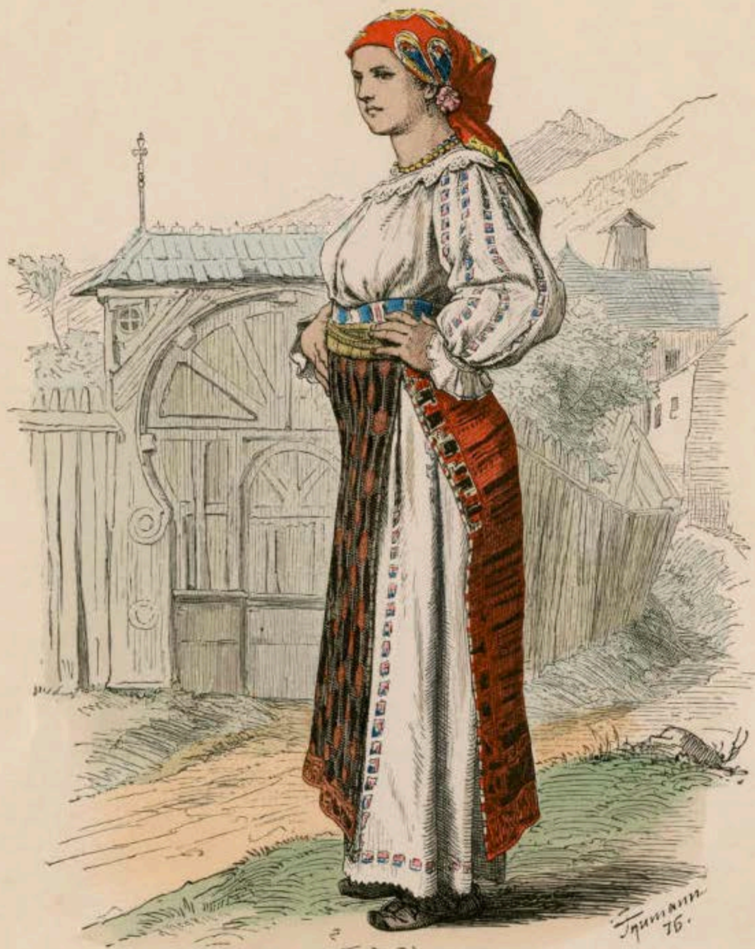
Walachin aus Rustkitza.