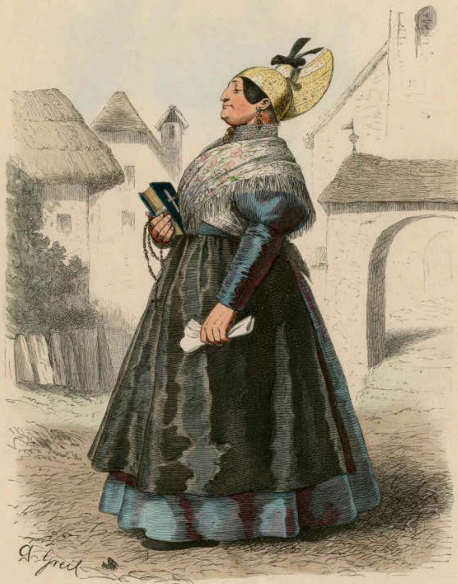
Bauersfrau aus Ober-Oesterreich (Traunkreis).