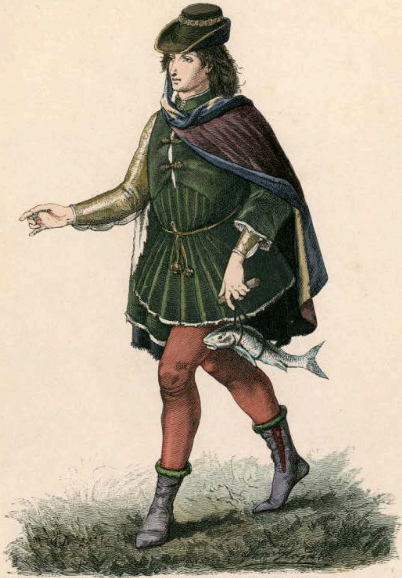
Vornehmer Florentiner. Mitte des XV. Jahrhunderts.