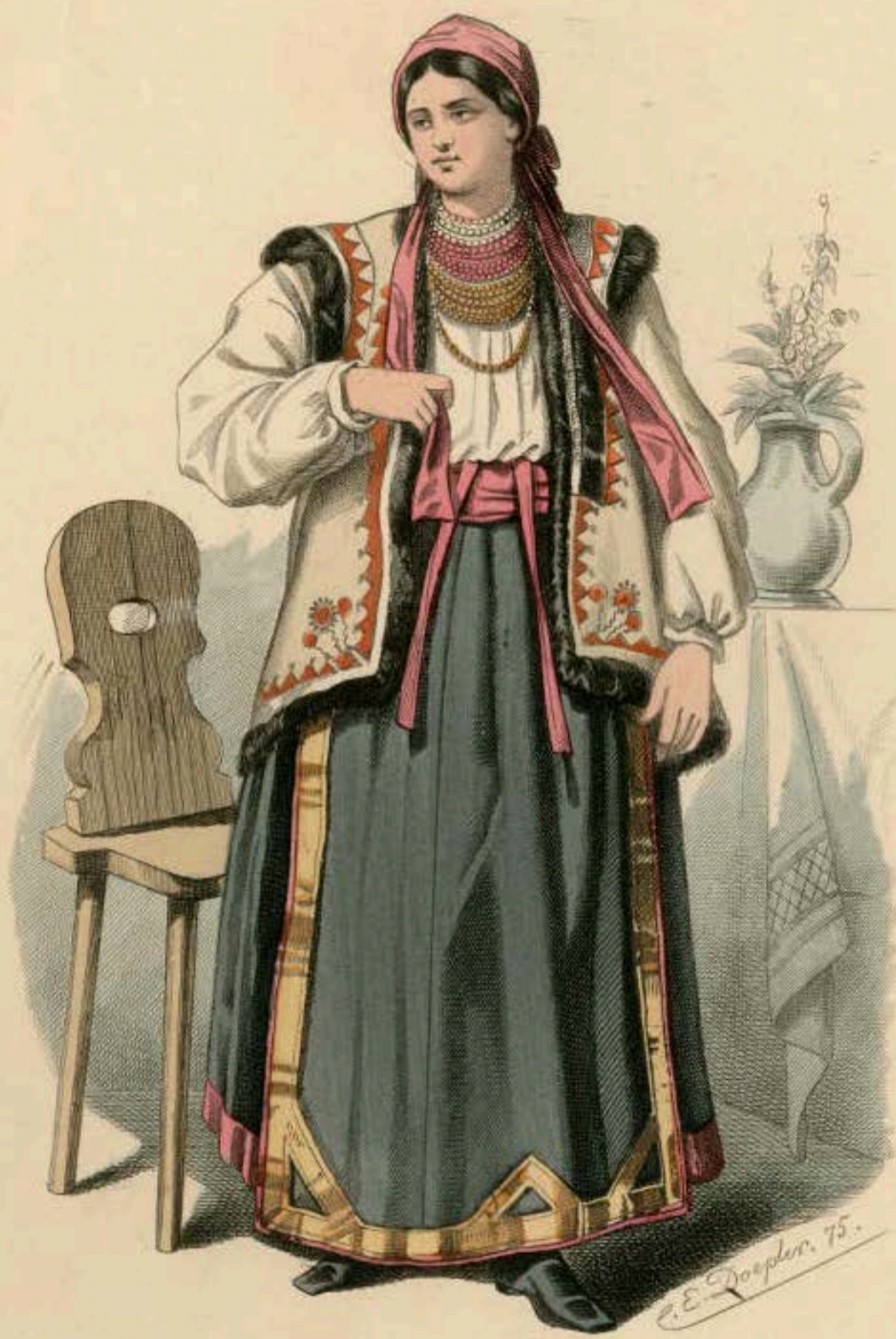
Illustration von C. E. Doppler