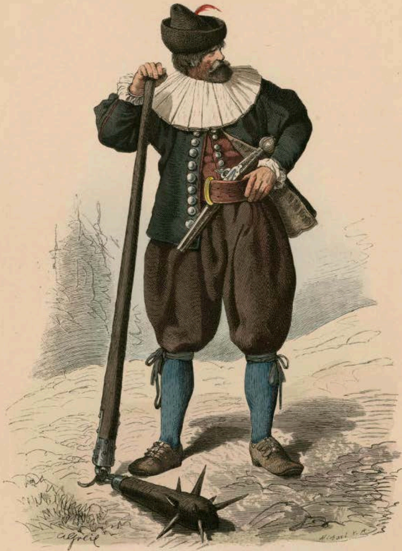
Oberösterreichischer Bauer. Zeit des österreichischen Bauernkrieges, 1626.