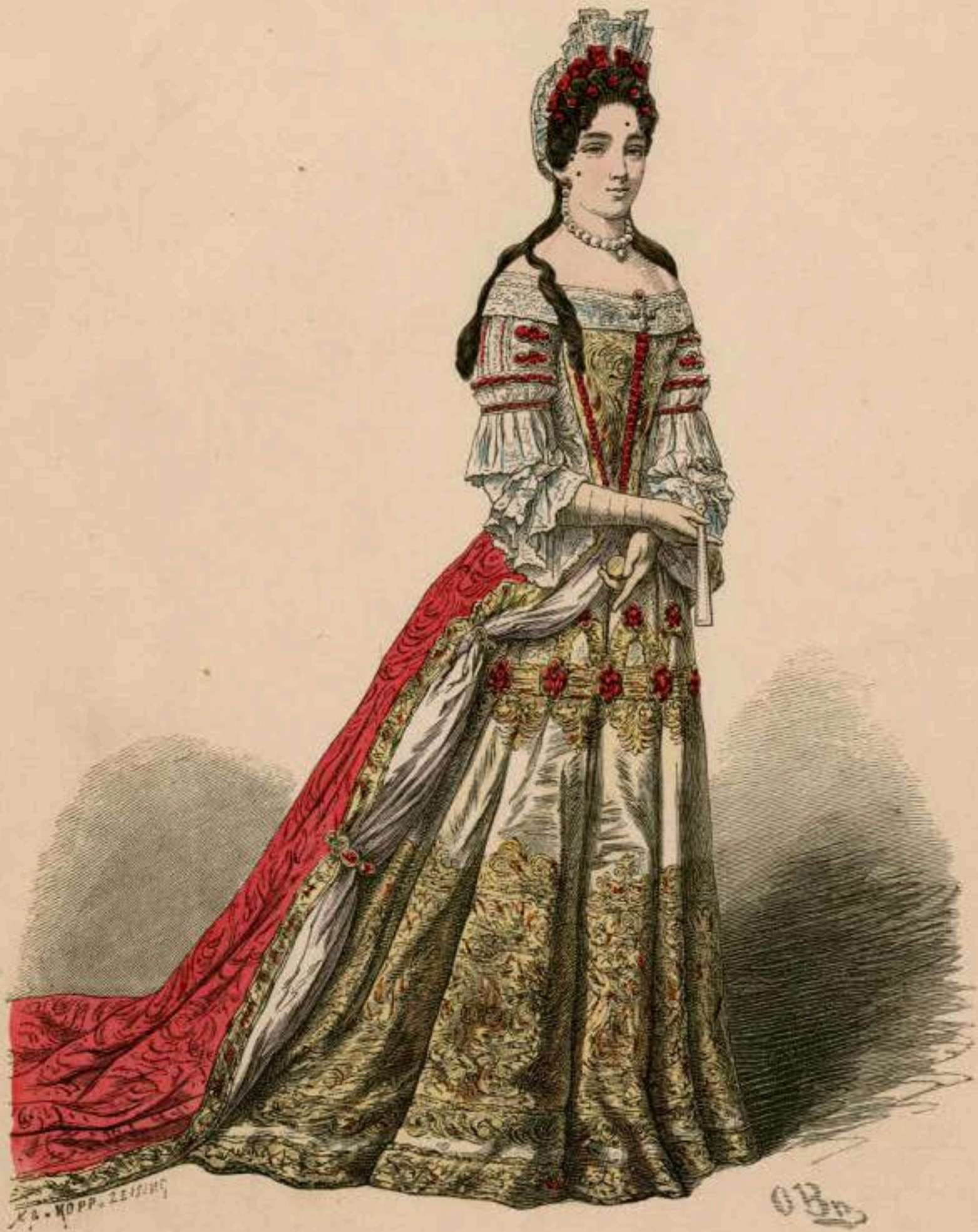
Kostüm vom Hofe Ludwigs XIV.