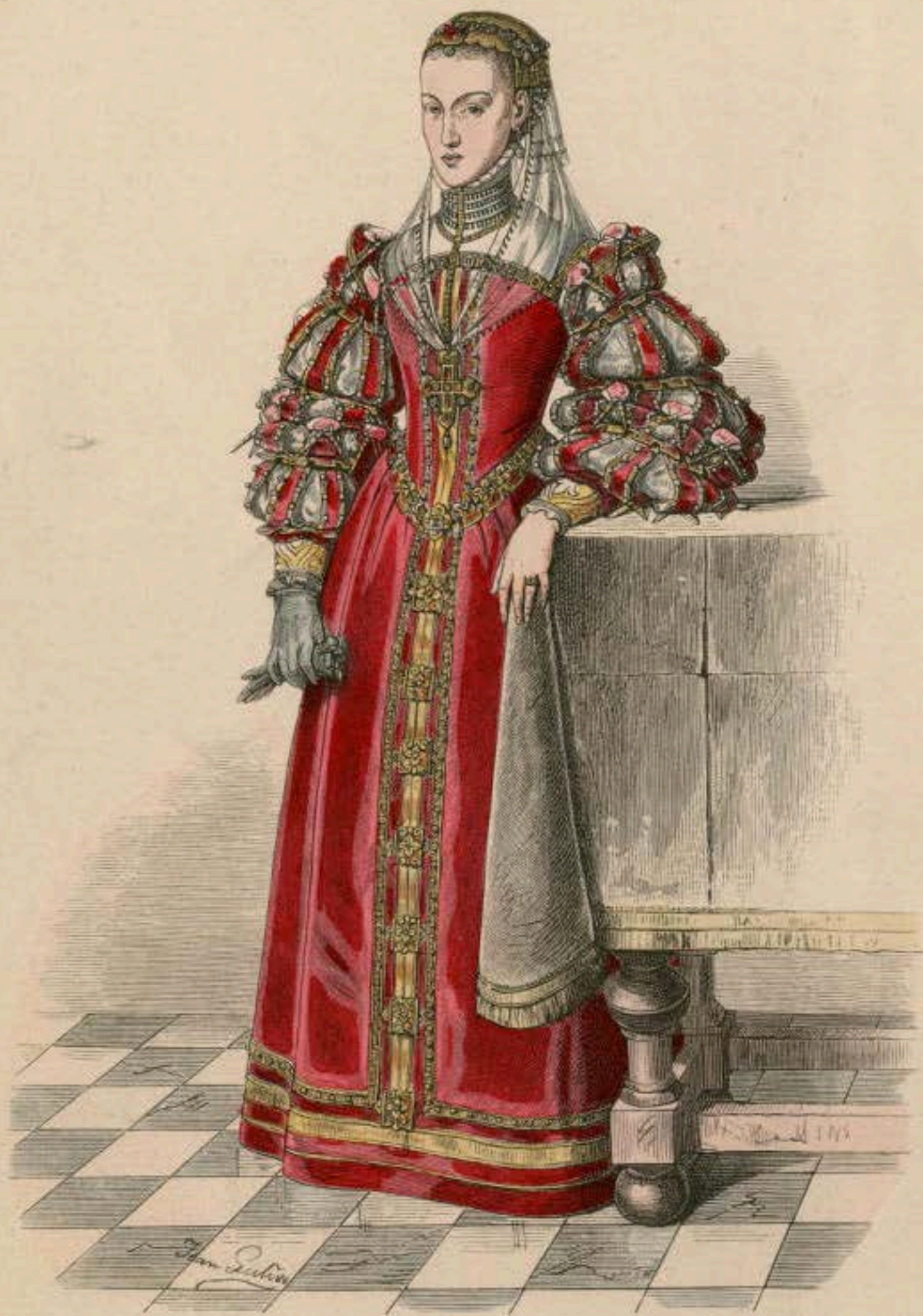
Johanna, Grossherzogin zu Florenz, geb. Erzherzogin zu Oesterreich. Geb. 1547; gest. 1578.