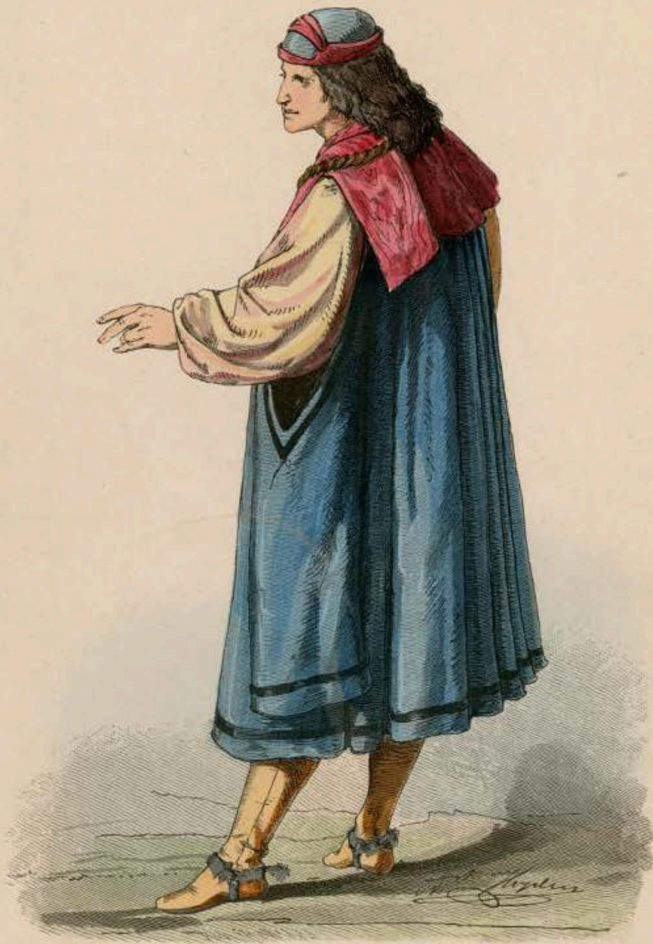
Burgundischer Edelmann. XV. Jahrhundert.