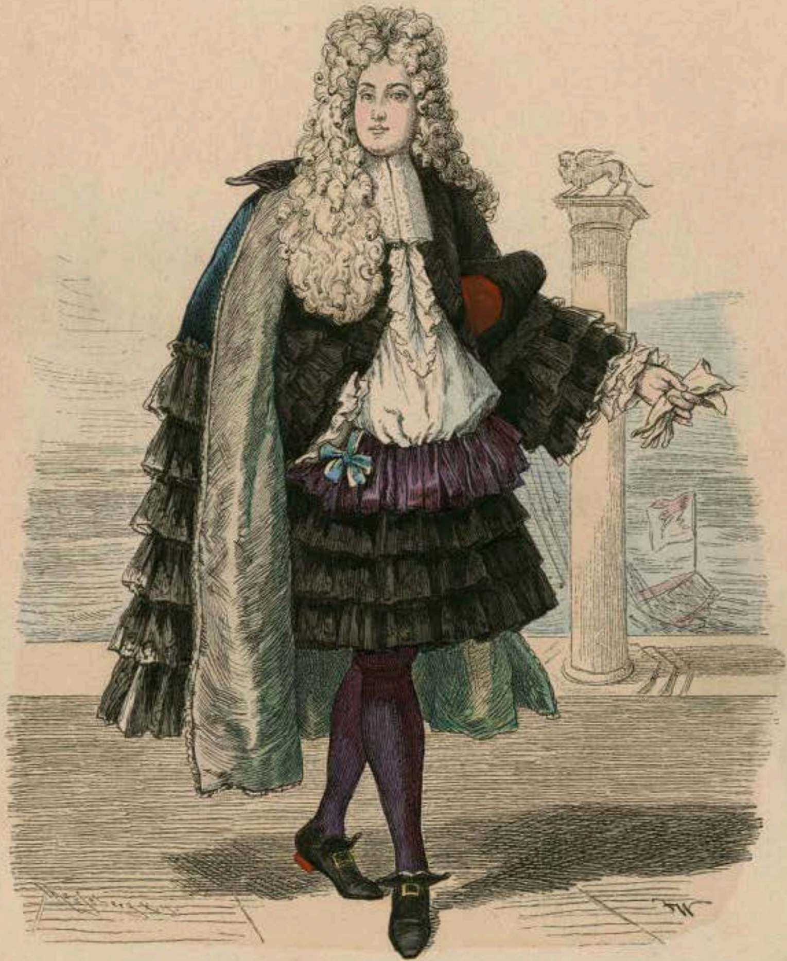
Venetianischer Edelmann. Zweite Hälfte des XVII. Jahrhunderts.