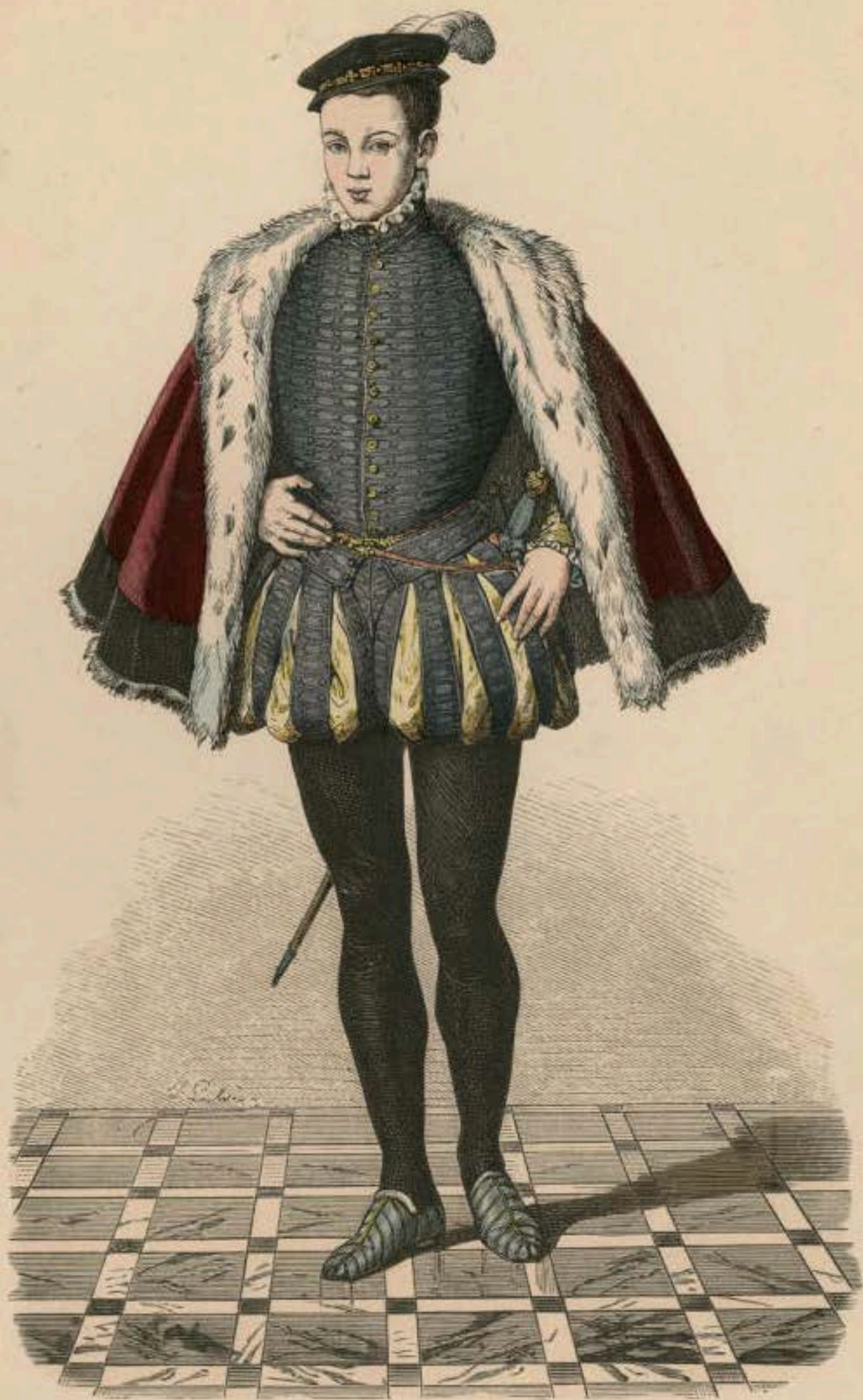
Don Carlos, Infant von Spanien.