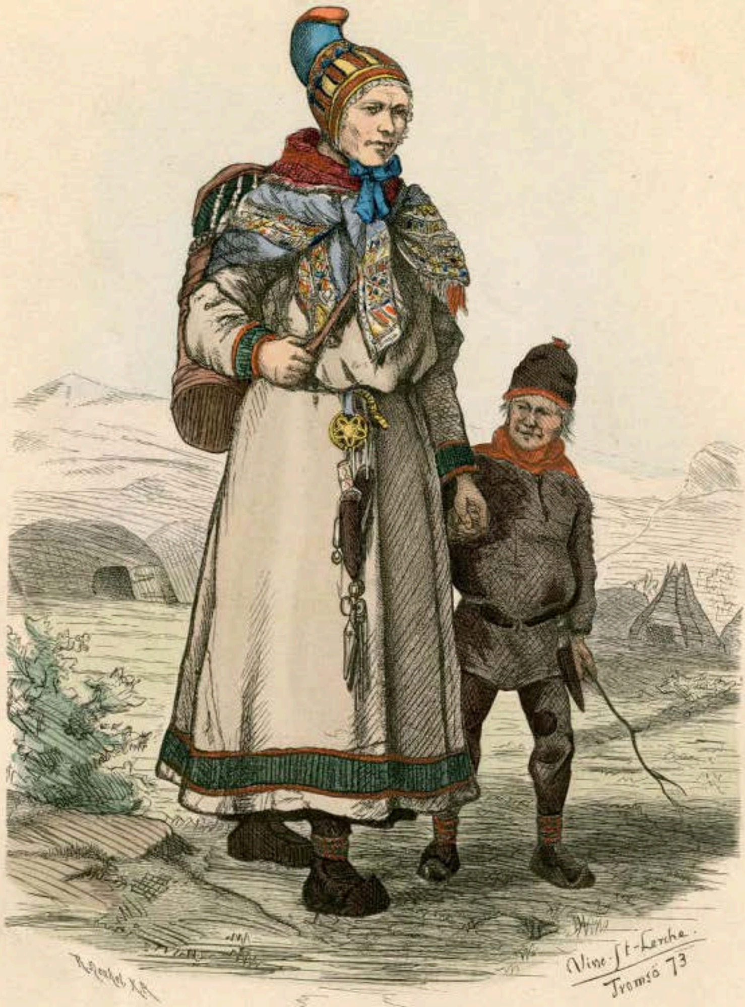
Lappen-Frau aus Karasjock in Finmarken (Norwegen).