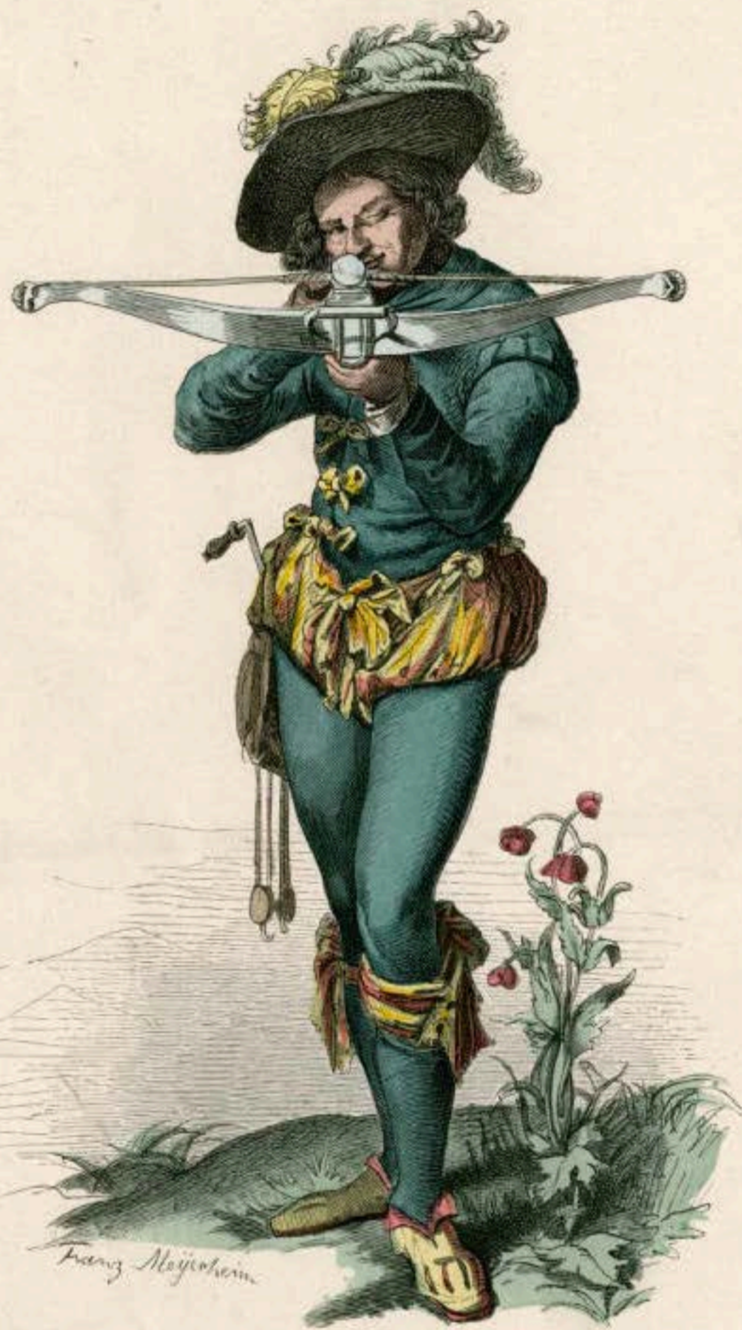
Scheibenschütze. Ende des XVI. Jahrhunderts.