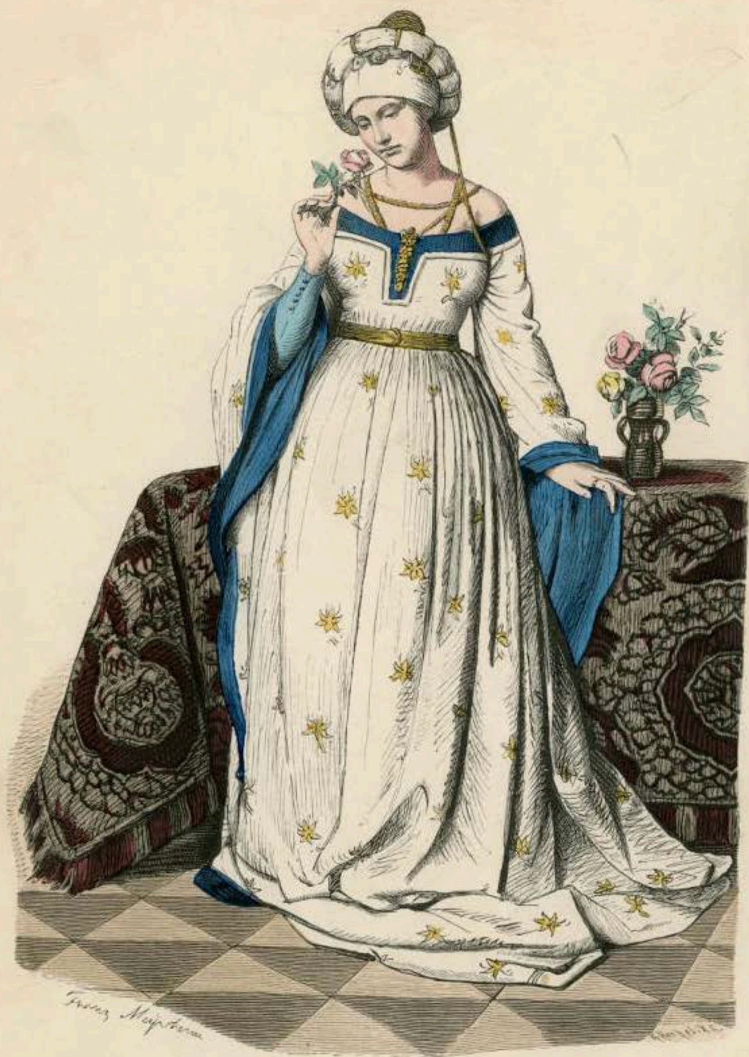
Vornehme deutsche Frau. Zweite Hälfte des XV. Jahrhunderts.