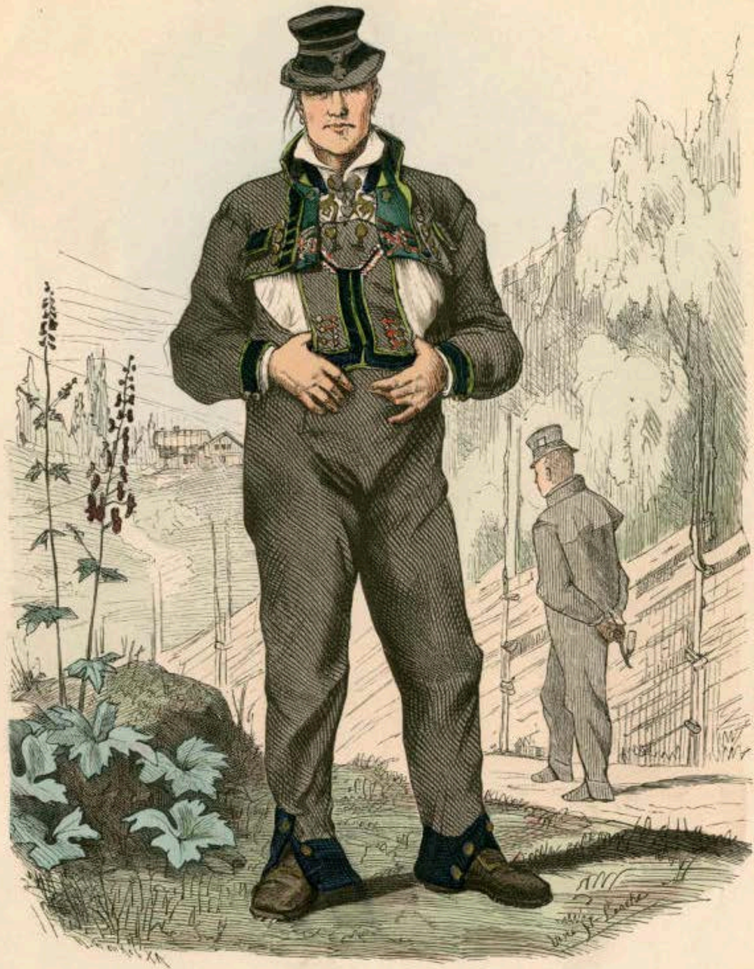
Junger Bauer aus Valle in Sättersdalen (Norwegen).