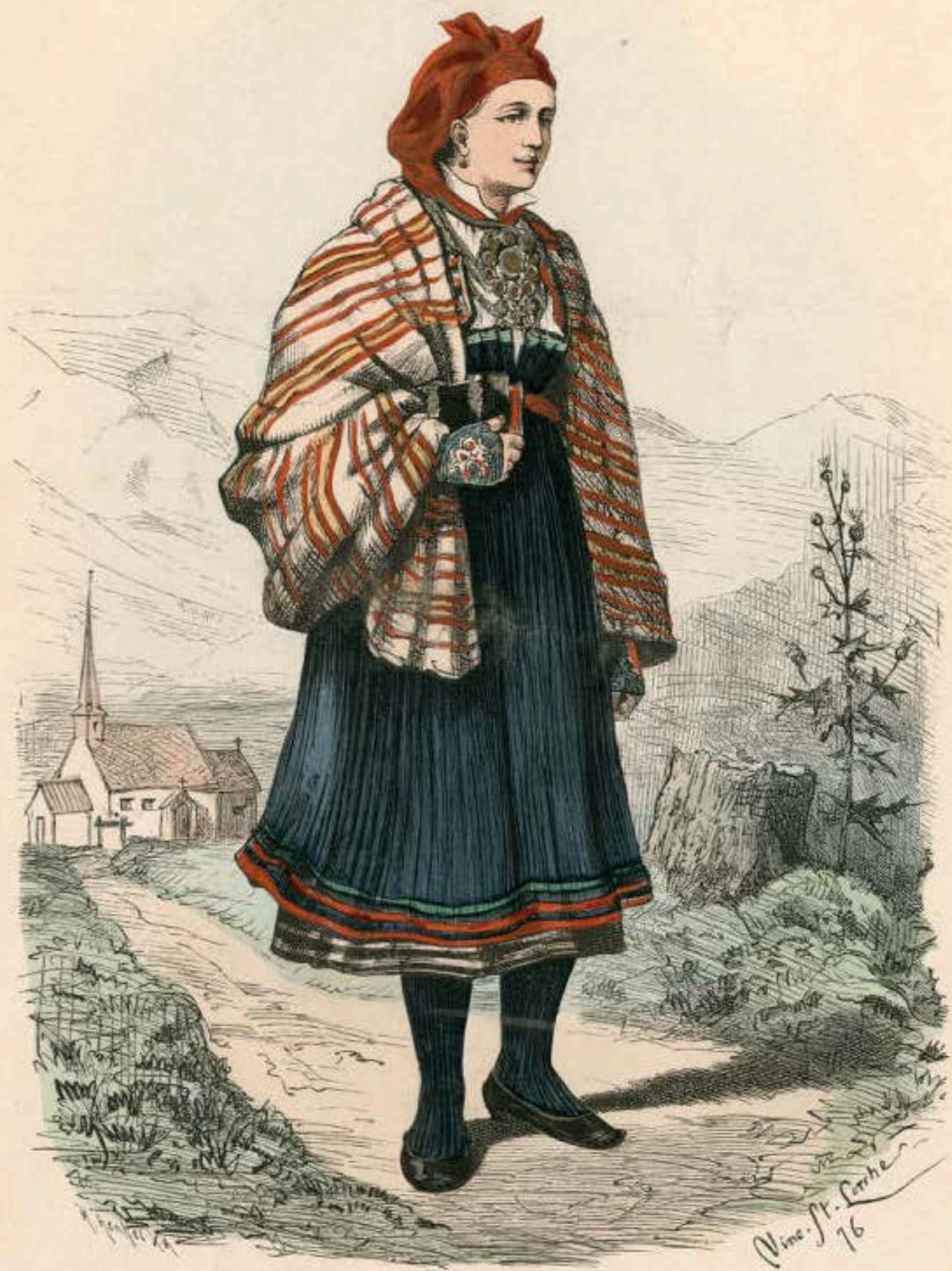
Bauernmädchen aus Valle in Sätersdalen (Norwegen).