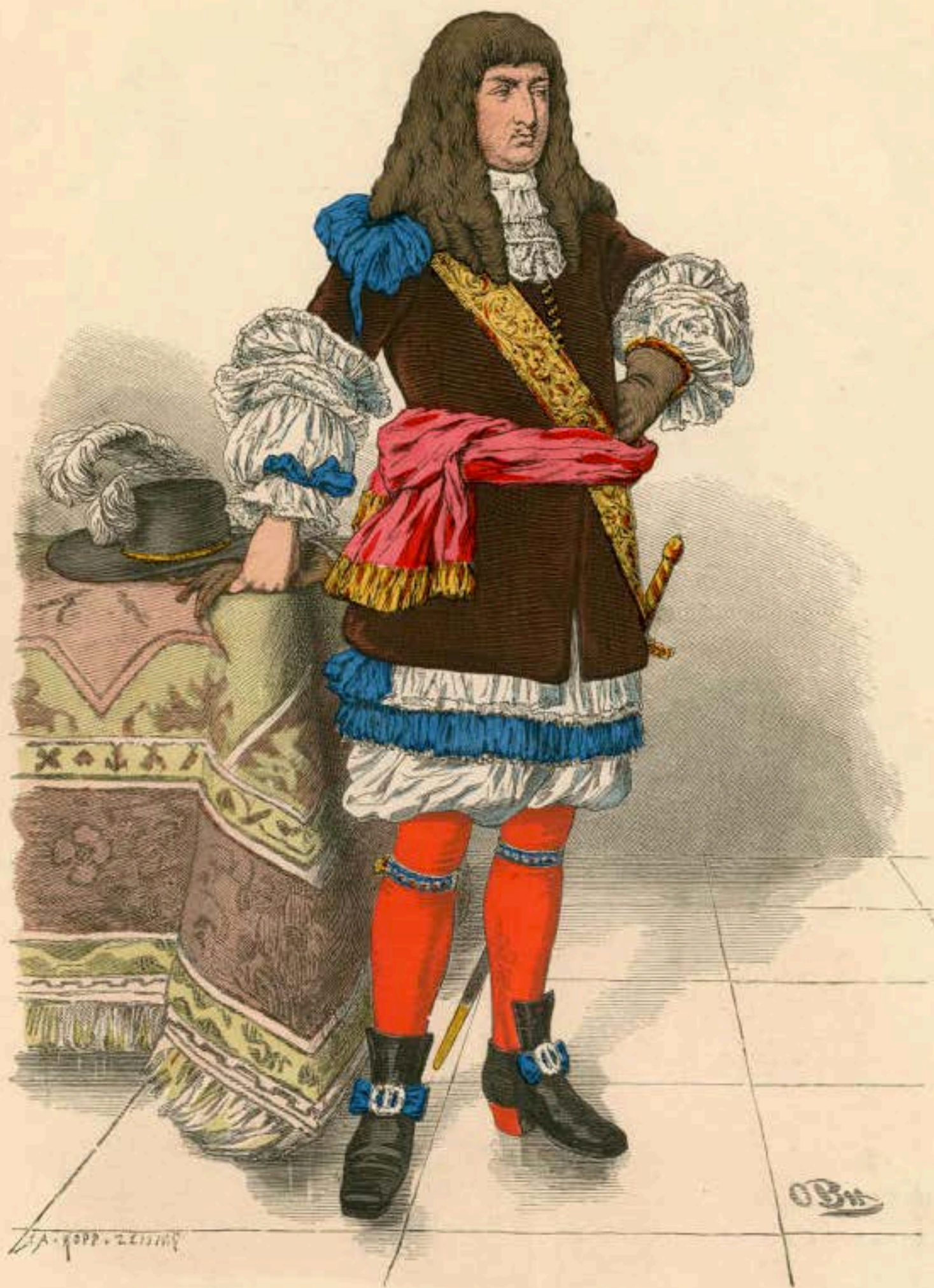
Tracht eines vornehmen Mannes. Um 1670—1680.