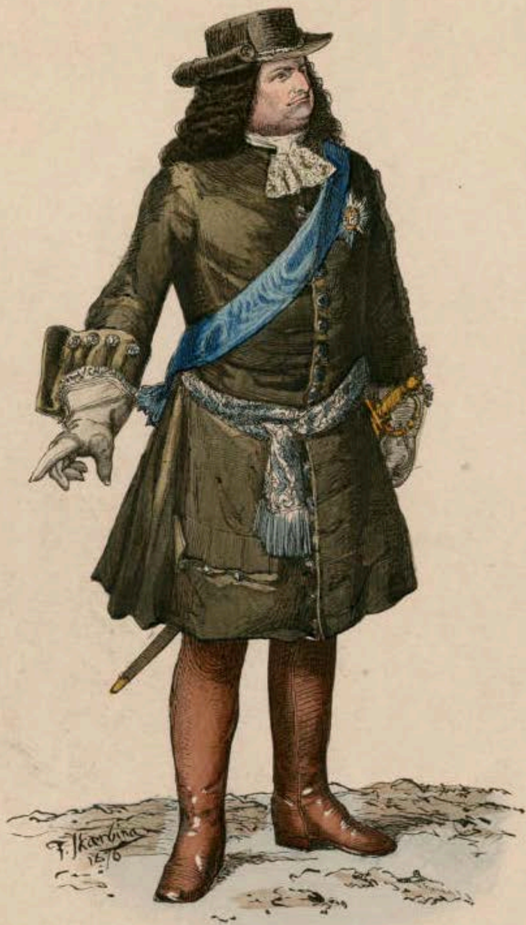
Kurfürst Friedrich Wilhelm der Grosse von Brandenburg. (Kostüm des Hosenband-Ordens.)