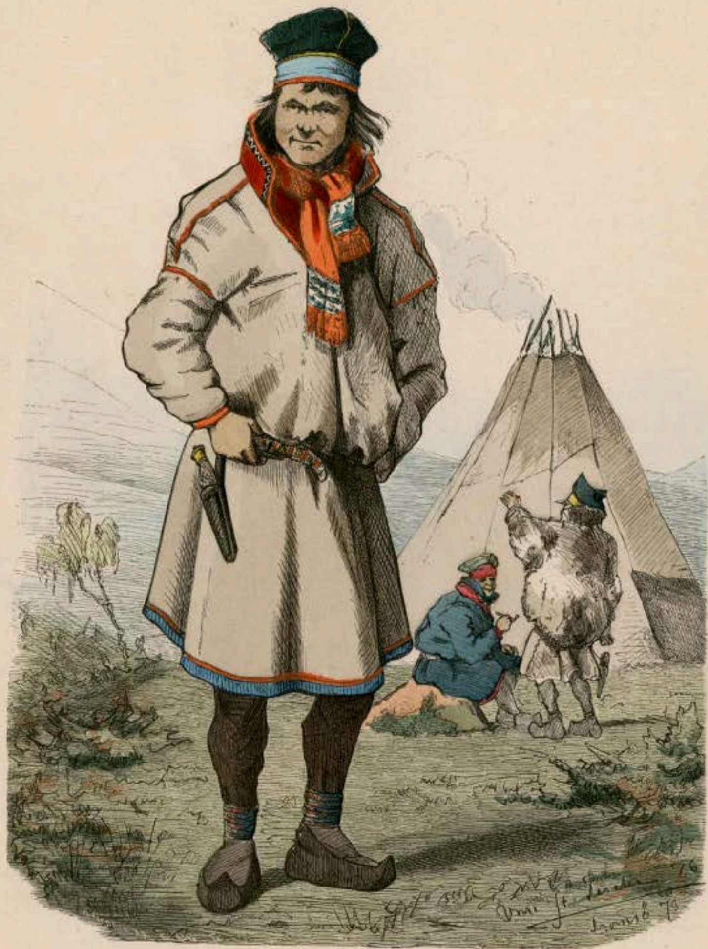
Lappe aus Karasjock in Finmarken (Norwegen).