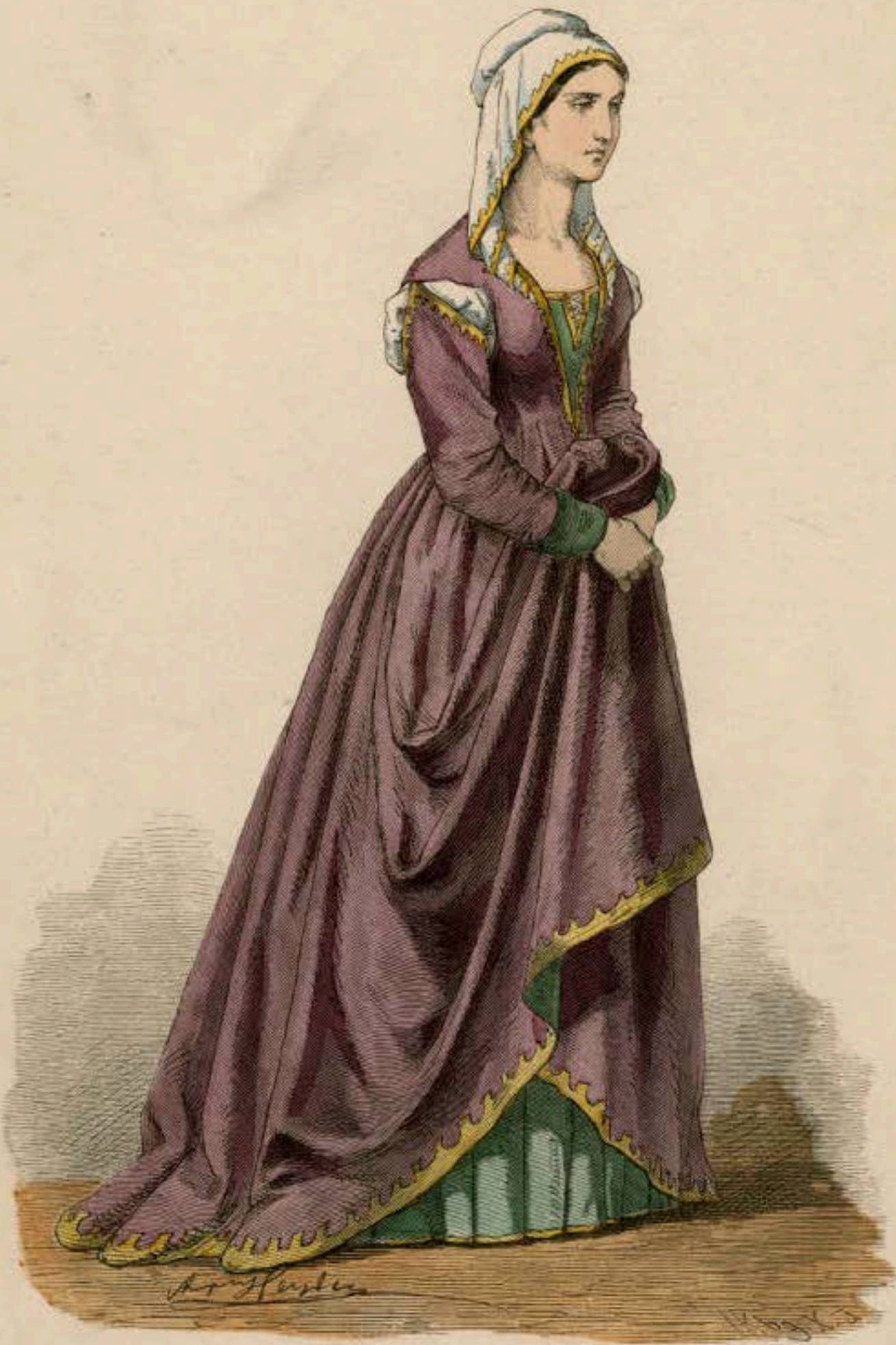
Florentinerin. Fünfzehntes Jahrhundert.