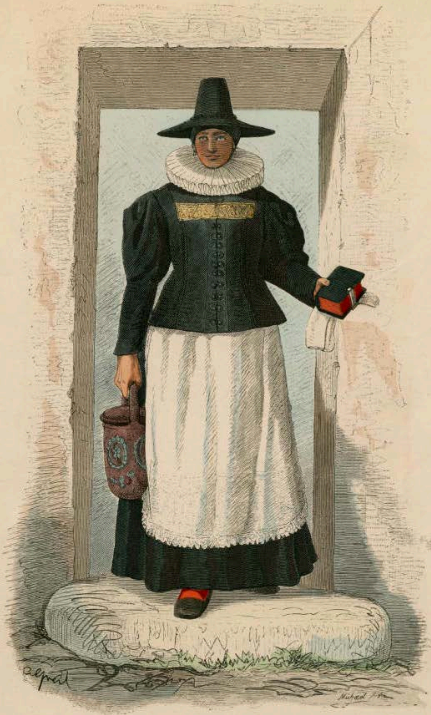
Oberösterreichische Bauersfrau. Zeit des österreichischen Bauernkrieges, 1626.