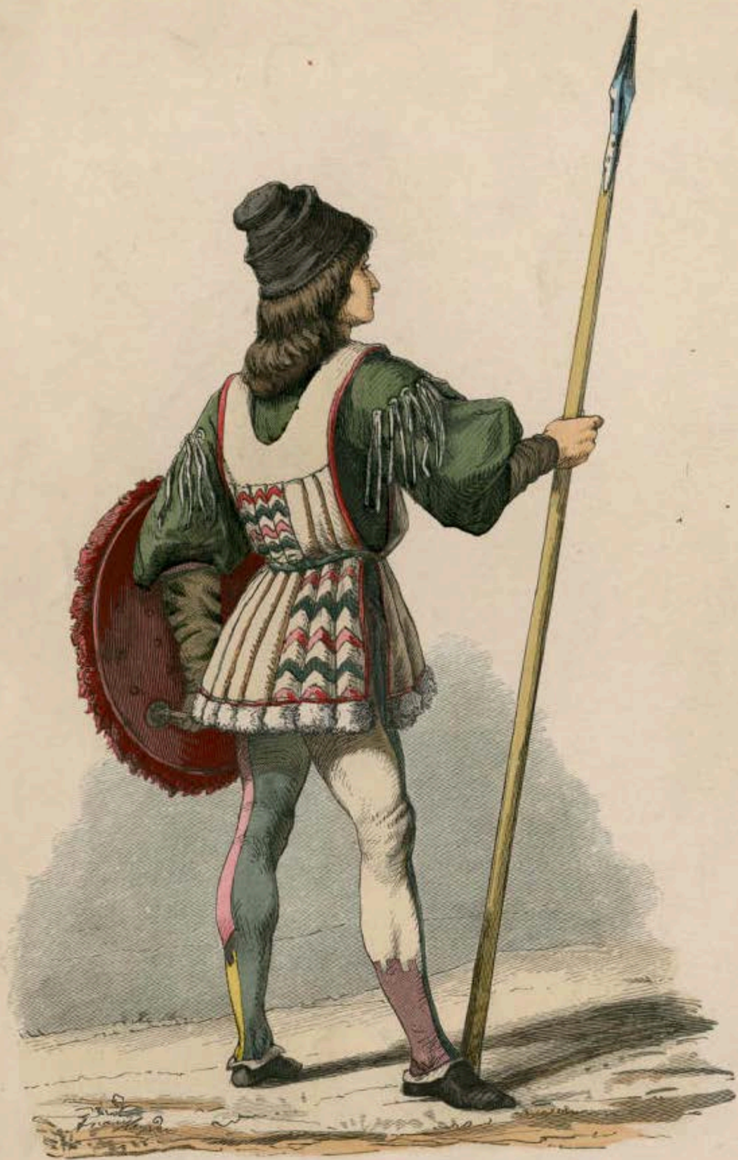
Italienischer Jüngling. Zweite Hälfte des fünfzehnten Jahrhunderts.