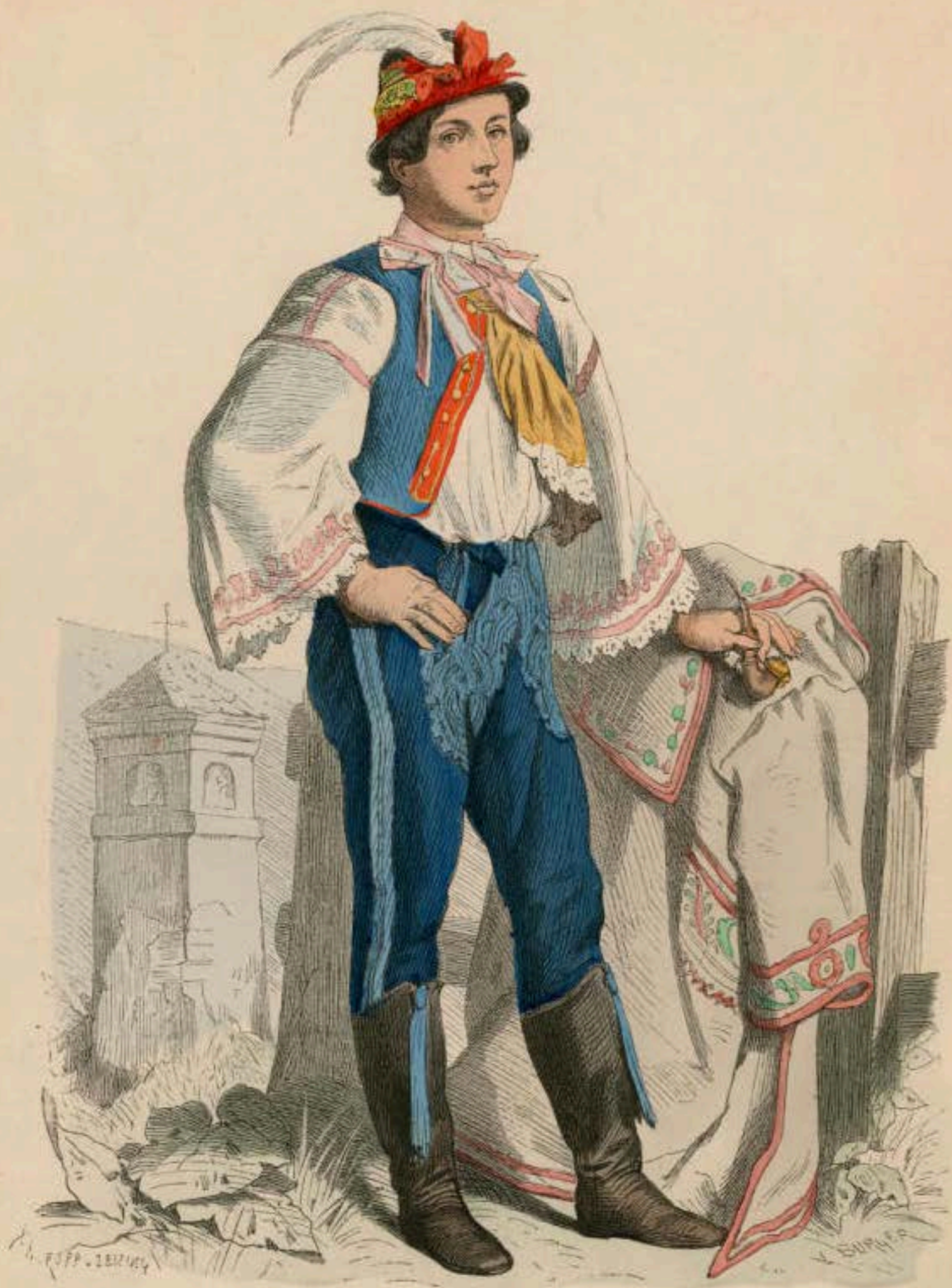
Slovake aus dem Pressburger Comitatz (Ungarn) in Sonntagstracht.