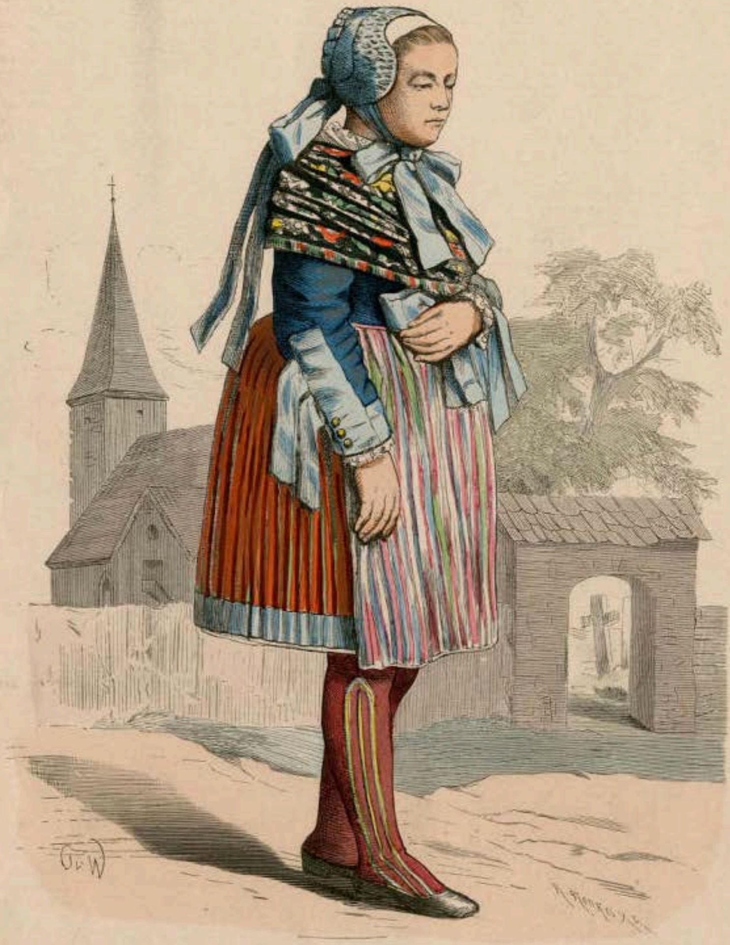
Pommersches Bauernmädchen aus dem Weizacker (Kreis Pyritz).