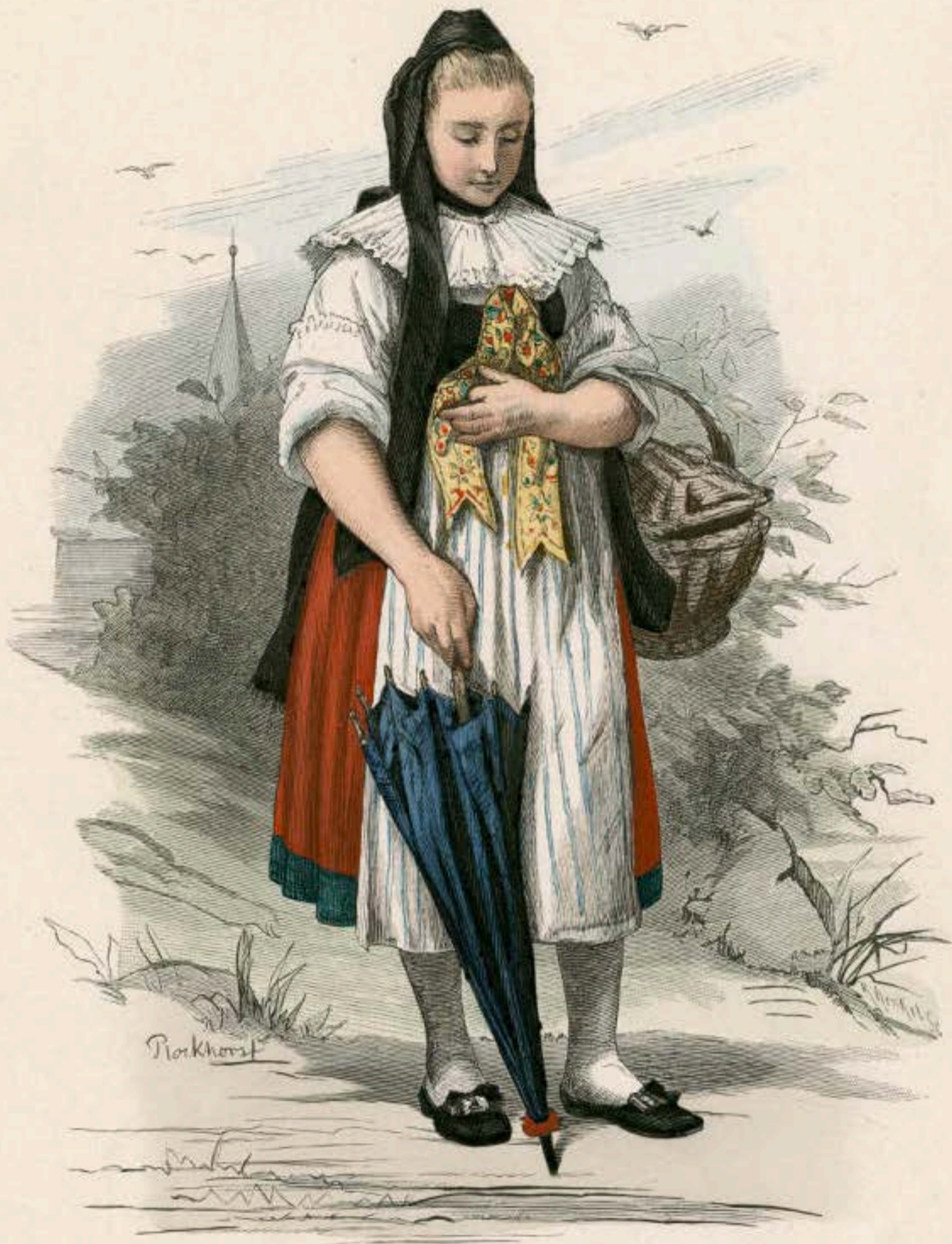
Bauerin aus Bortfeld bei Braunschweig.