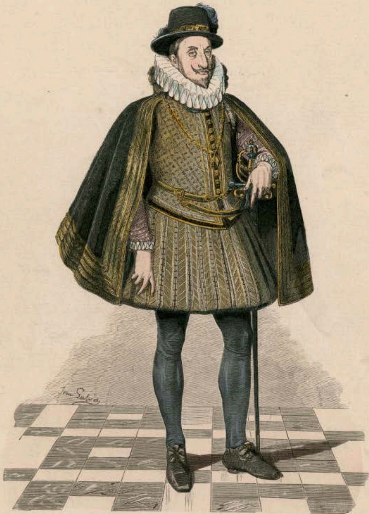
Ferdinand II., Kaiser von Deutschland.