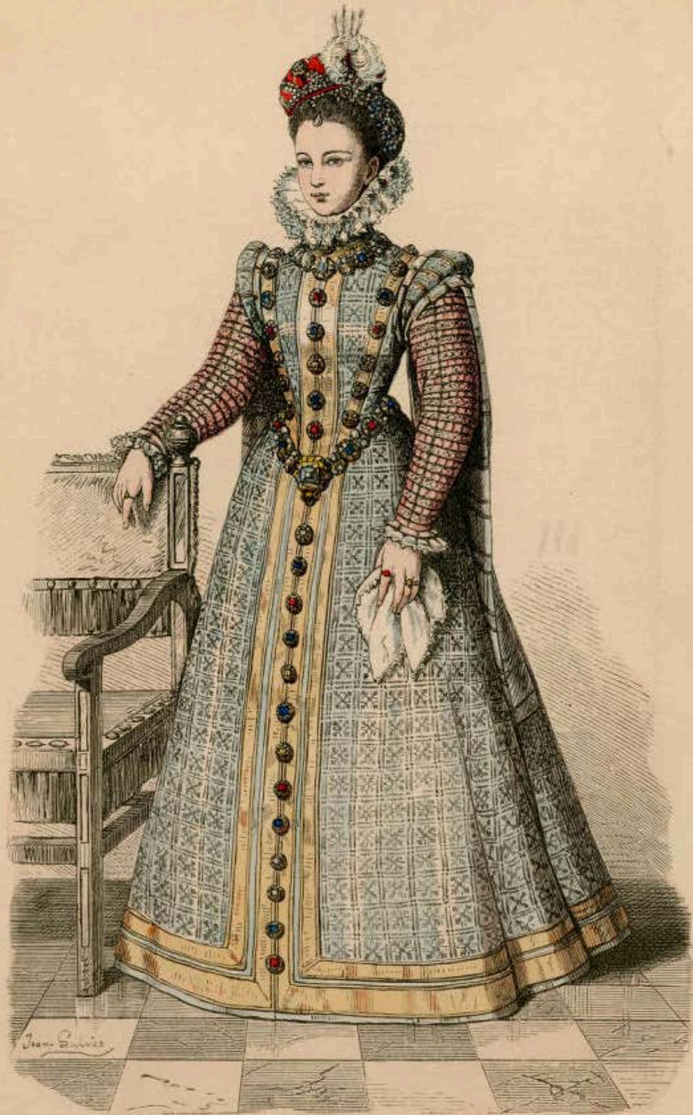
Isabella Clara Eugenia, Tochter Philipps II. von Spanien, 1584.