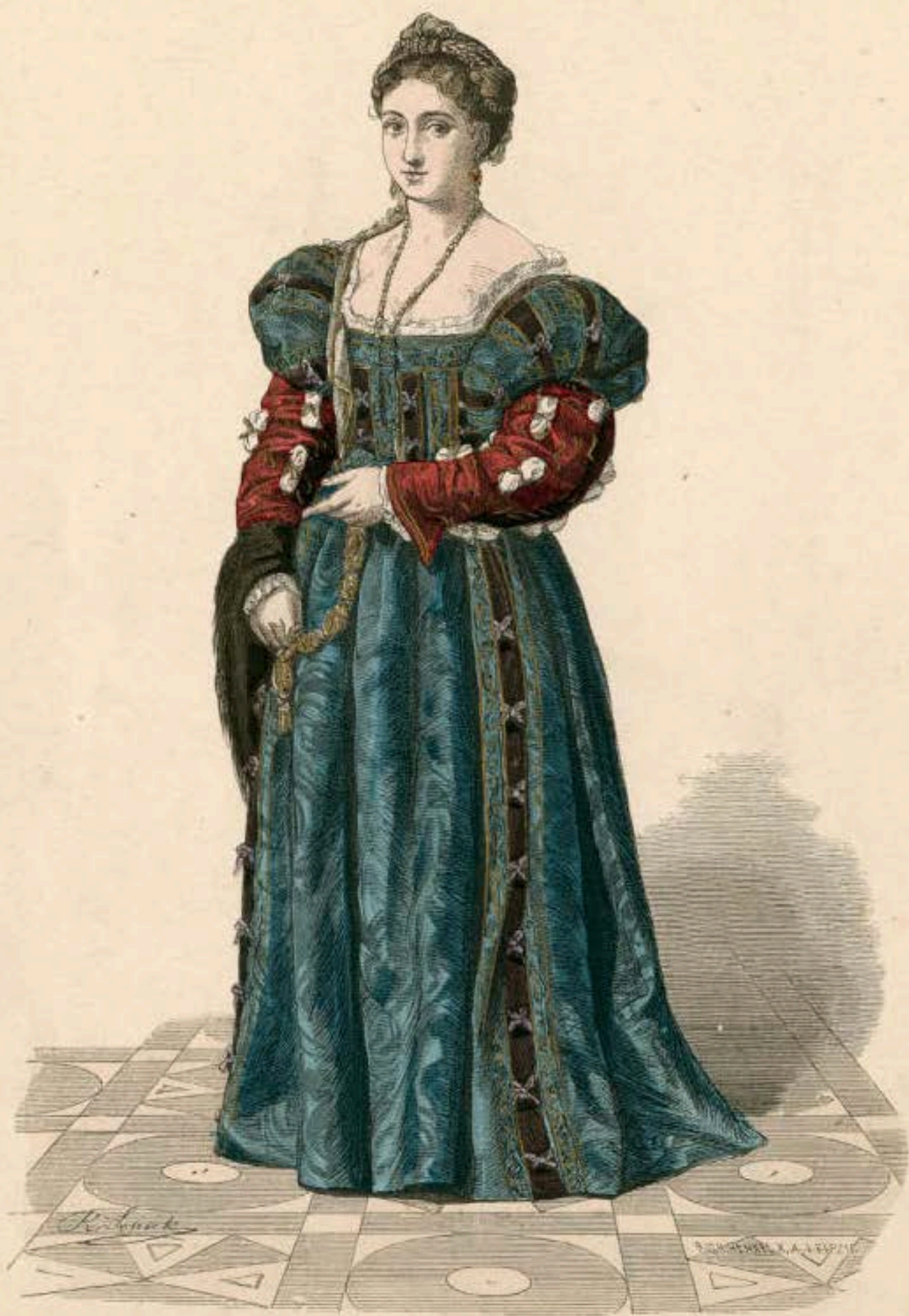
Italienische Fürstin, Anfang des XVI. Jahrhunderts. (La Bella di Tiziano.)