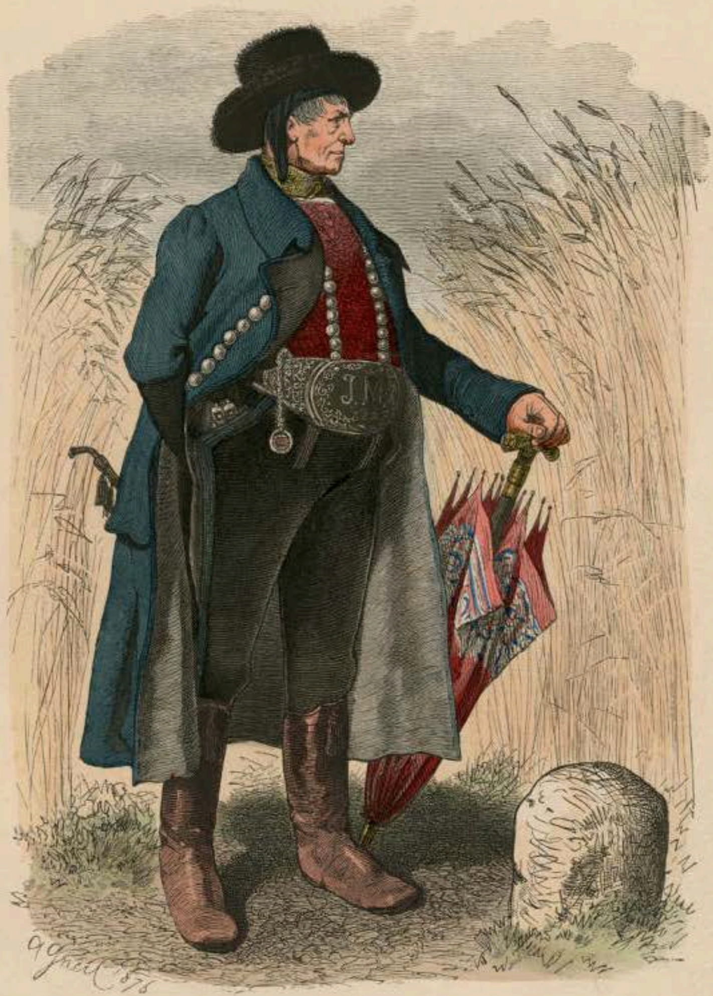
Bauer aus Ober-Oesterreich (Traunkreis).