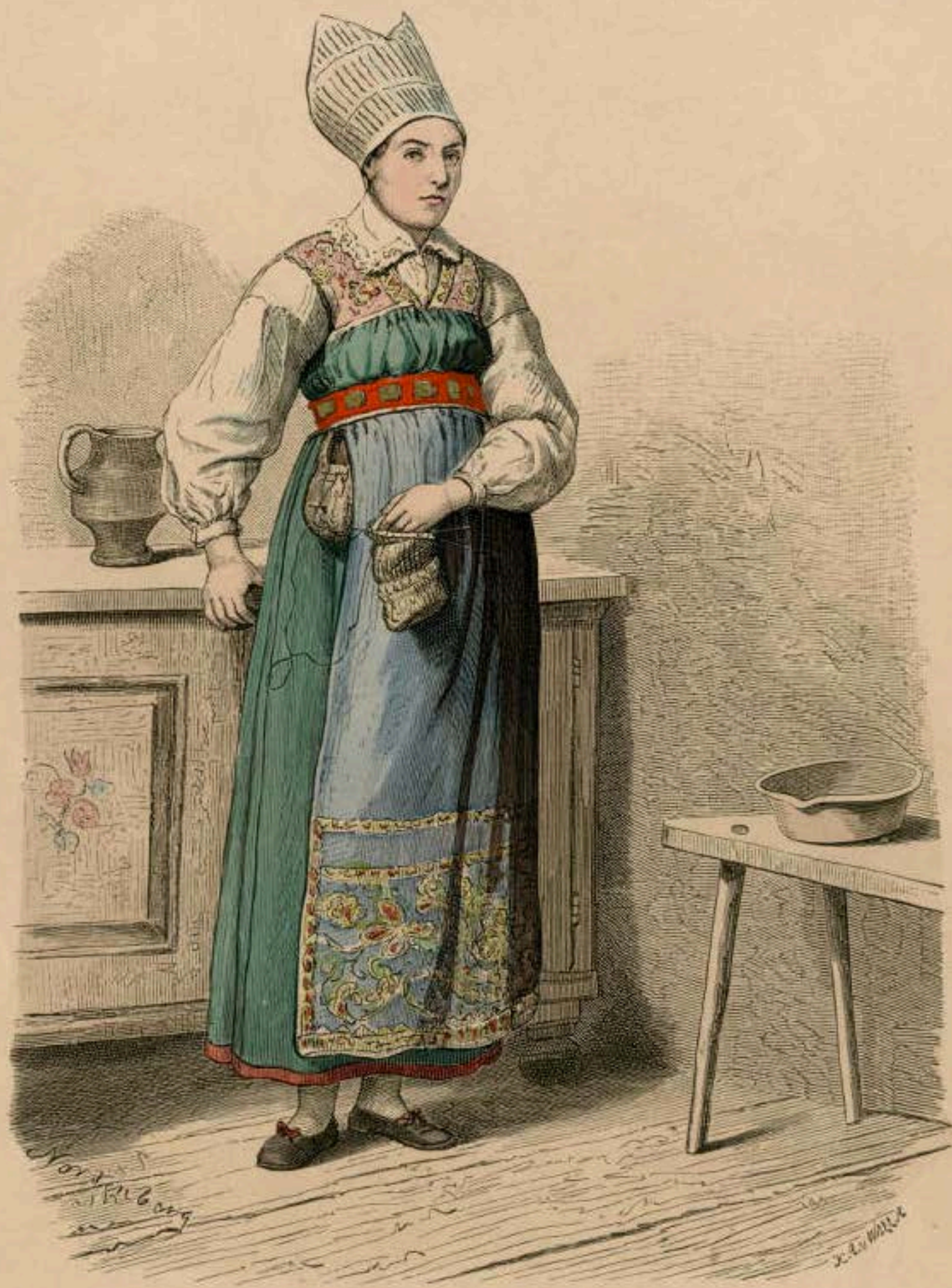
Frau aus West-Wingaker (Schweden).