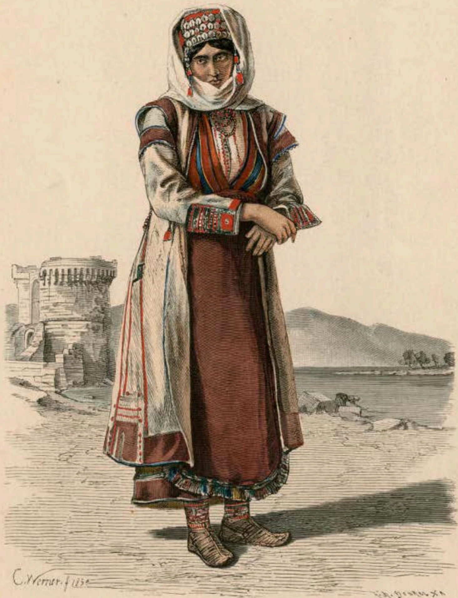
Montenegrinerin aus Postinje.