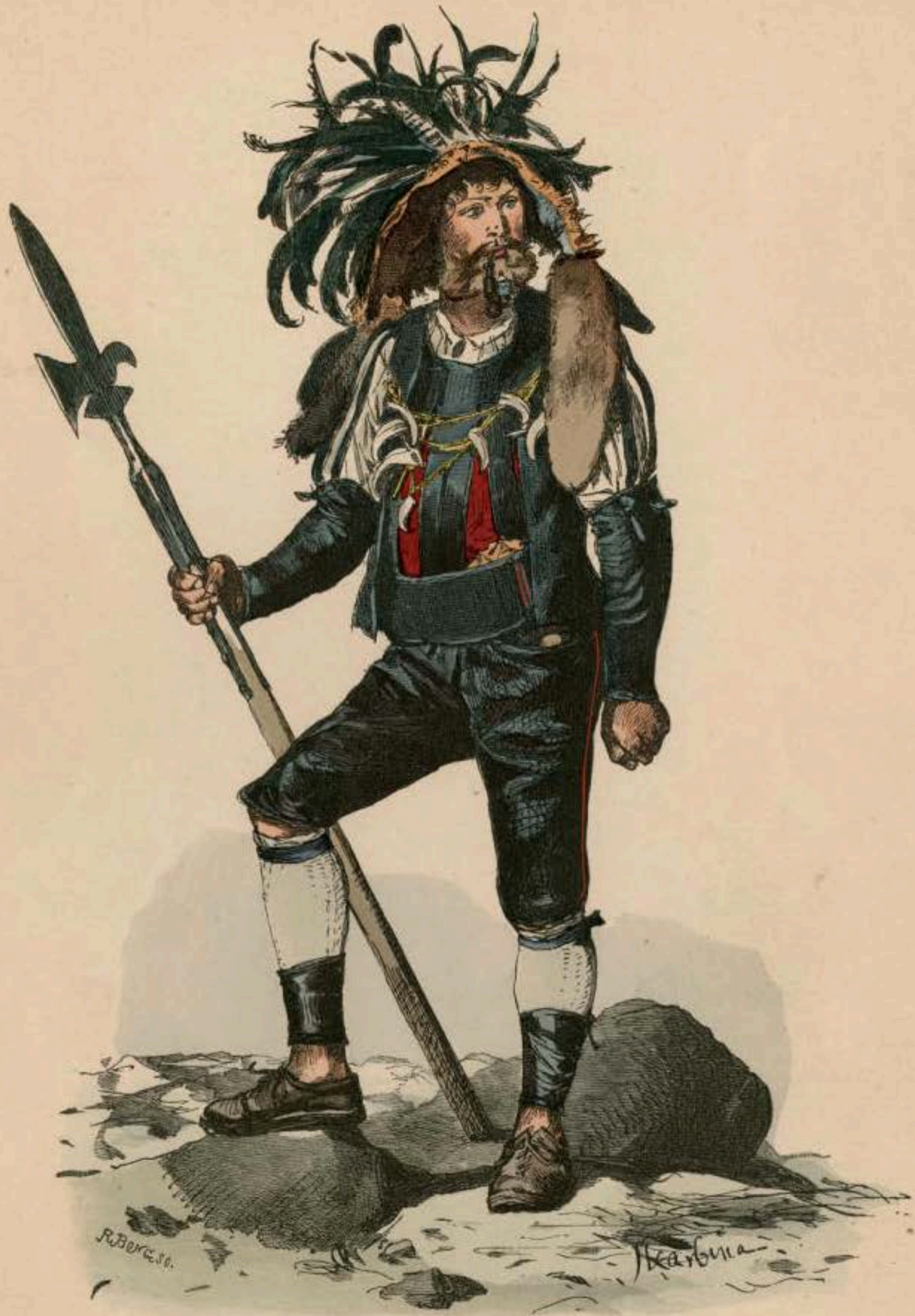
Weinhüter (Saltner) aus Meran (Süd-Tirol).